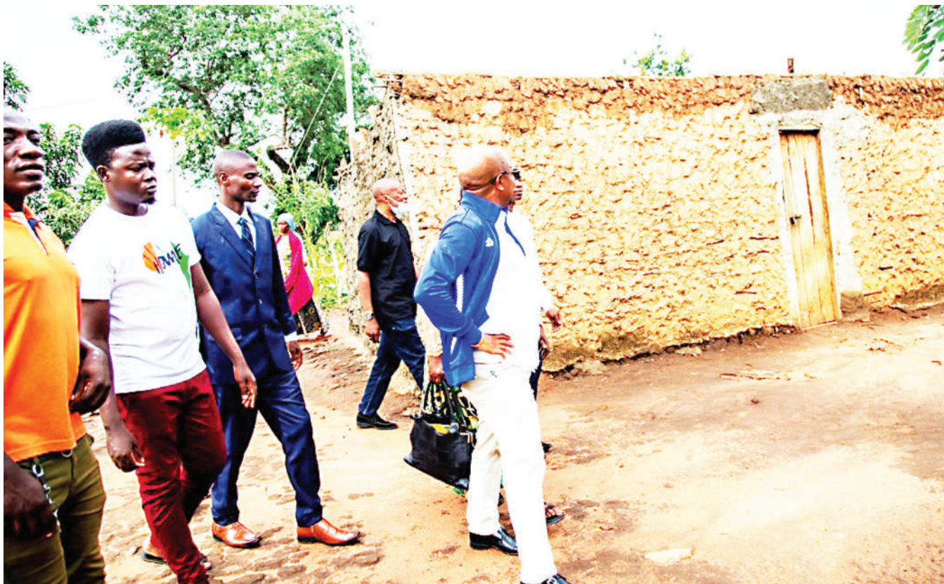
Naibu Waziri wa Ardhi, Nyumba na Maendeleo ya Makazi ambaye ni Mbunge wa Jimbo la Chalinze mkoa wa Pwani, Ridhiwani Kikwete, akiangalia moja ya nyumba iliyoathirika na mvua katika kijiji cha Makombe, Chalinze mkoani Pwani alipokwenda kutoa pole na kujionea athari za mvua mwishoni mwa wiki.

Aidha, alisema wametoa vifaa tiba vya kuanzia kutoa huduma kwa wananchi vyenye thamani ya Sh. milioni 49.9, mada wati 300 kwa ajili ya shule za msingi na sekondari vilivyogharimu Sh. milioni 37.5 na uchimbaji wa mabwawa 8 kwa Sh. milioni 151 kwa ajili ya kilimo cha umwagiliaji wa mboga na tumbaku.