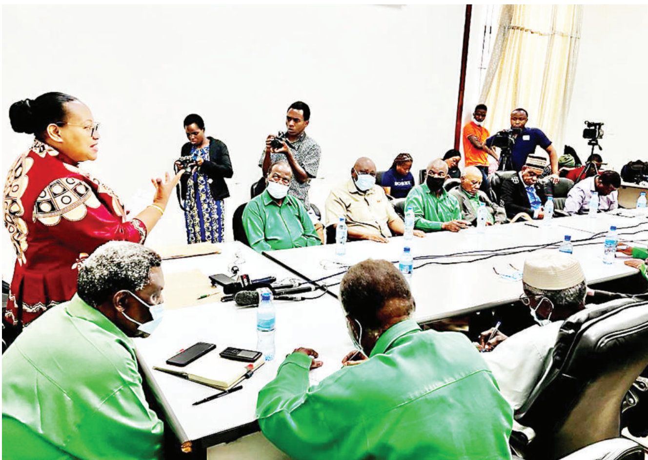
Waziri wa Nchi Ofisi ya Waziri Mkuu Sera, Bunge na Uratibu, Dk. Pindi Chana, akizungumza na Baraza la Wazee wa Chama Cha Mapinduzi (CCM) Wilaya ya Dodoma Mjini, alipofanya ziara ya kutembelea ujenzi wa mji wa serikali ulioko Mtumba jijini Dodoma.