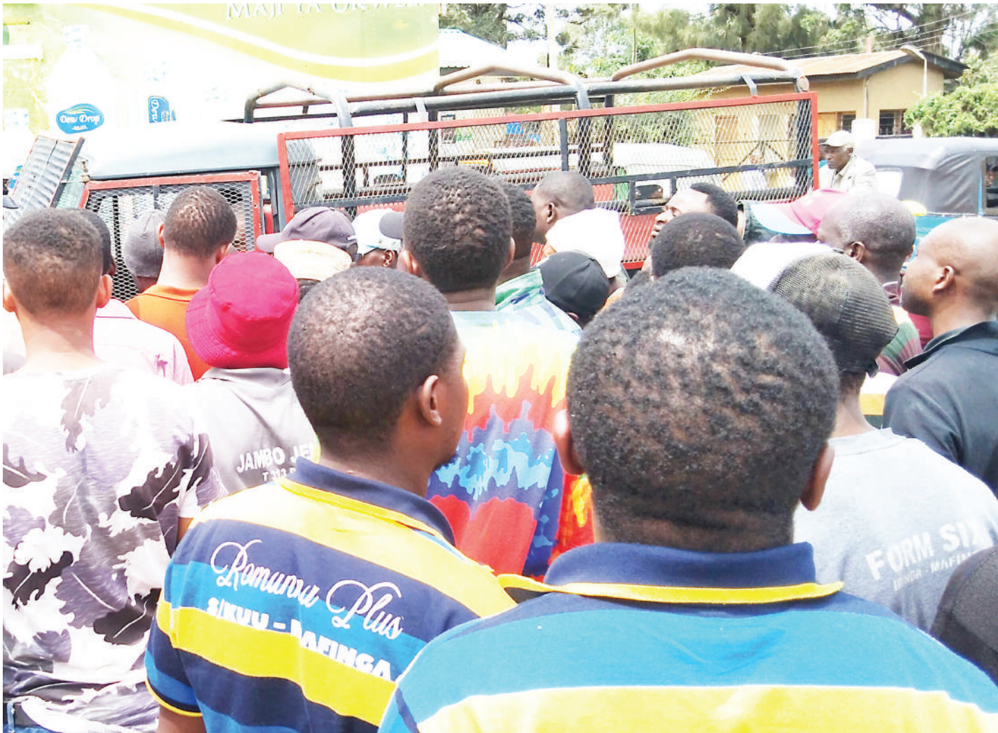
Baadhi ya madereva na makondakta wa daladala zinazofanya safari zake kati ya Iringa Mjini na Mafinga mkoani Iringa wakiwa katika mgomo juji, kupinga mabasi yanayofanya safari zake nje ya mkoa huo, kuingia stendi ya Ipegolo badala ya stendi ya Igumbilo ambayo ni stendi ya mkoa kama walivyopangiwa.

Katika kufanikisha ujenzi wa ukuta huo, jumla ya Sh. milioni 300 zilipangwa kutumika ambapo hadi kufikia Desemba 2021, Sh. milioni 200 zilikuwa zimetumika, na ujenzi unatarajiwa kukamilika Machi mwaka huu.