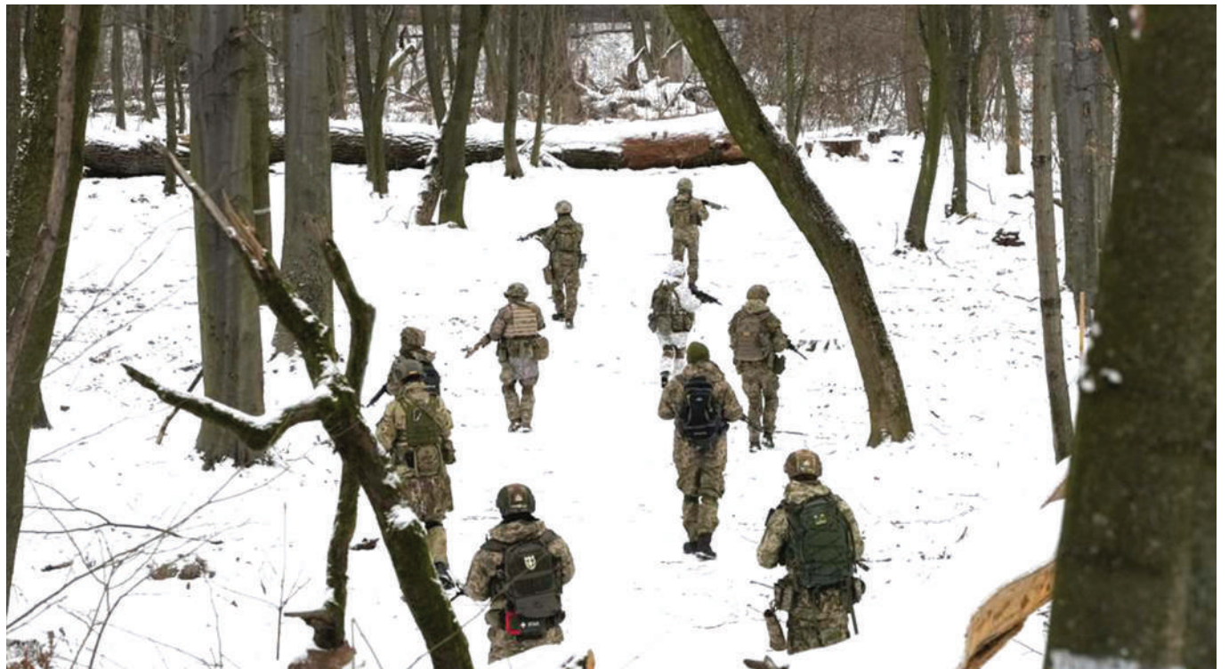
Wanajeshi wa Jeshi la Ukraine wakiendelea na mafunzo kwenye jiji la Kyiv nchini humo, mwishoni mwa wiki. Makumi ya wakazi wa Ukraine wameambiwa wajiunge na jeshi hilo wiki chache zilizopita ili kuongeza nguvu kazi.