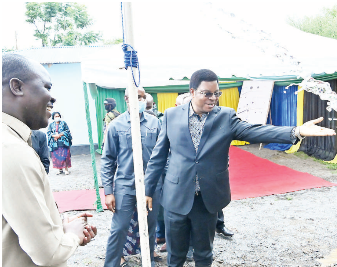
Waziri Mkuu, Kassim Majaliwa, akishika maji wakati alipoweka jiwe la msingi la mradi wa maji wa Mogitu-Katesh wilayani Hanang' katika ziara ya Mkoa wa Manyara jana. Kushoto ni Waziri wa Maji, Juma Aweso.

Aliwataka wanasheria kujifunza na kuufahamu uchumi wa bluu unaojengwa Zanzibar kwa kuwa wakizielewa sera na mipango watakuwa na nafasi nzuri ya kushauri na kushughulikia aina mpya ya mashauri ambayo yanaweza kuibuka na kuhitaji ujuzi na maarifa, tofauti na ilivyozeleka.