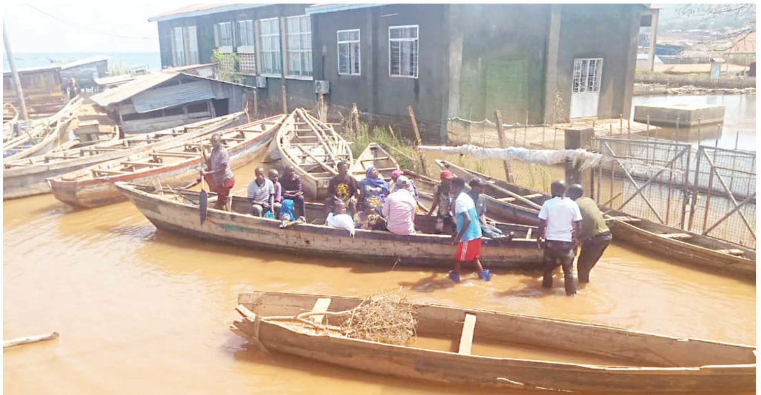
Mwonekano wa Chuo cha Uvuvi Kigoma (FETA), Kibilizi, Kigoma Ujiji kilichoingirwa na maji, wanaonekana kwenye ngalawa ni wavuvi wakijiandaa kwenda kuvua.