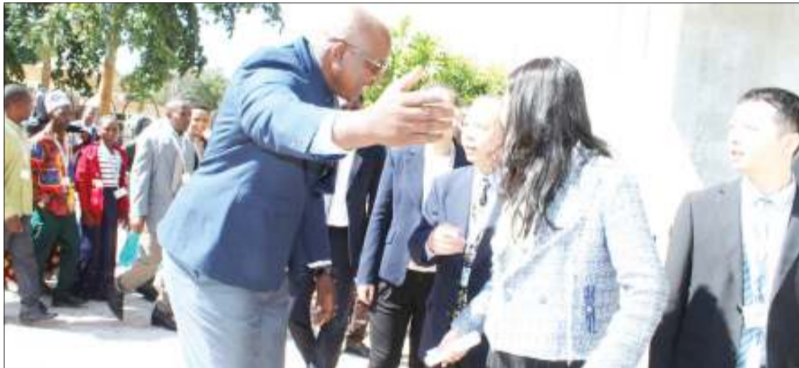
Naibu Waziri wa Maliasili na Utalii, Constantine Kanyasu, akizungumza na viongozi wa Chuo cha Mafunzo ya Kigeni na Utalii cha nchini China, kijulikanacho kwa jina la JXCFFS, baada ya kuwatambulisha wageni hao, bungeni jijini Dodoma jana. Viongozi hao wamekuja kwa lengo la kuwajengea uwezo wa mafunzo watumishi na wadau wa utalii hapa nchini.

Alisema mwanamke huyo alipelekwa katika Hospitali ya Rufani ya Mkoa wa Mara, mjini Musoma na kisha akahamishiwa katika Hospitali ya Rufani ya Kanda ya Bugando jijini Mwanza baada ya hali yake kuendelea kuwa mbaya.