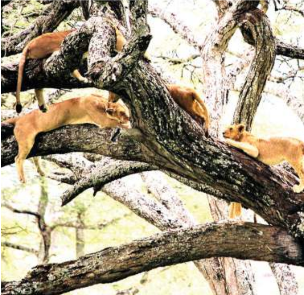
Simba wakiwa mtini kwenye Hifadhi ya Taifa Selous.

labda nusu ya mamba walioko nchini, ni mazingira yanayoweza kuvutia utalii wa kuwinda, kwani ngozi yake inapendeza.