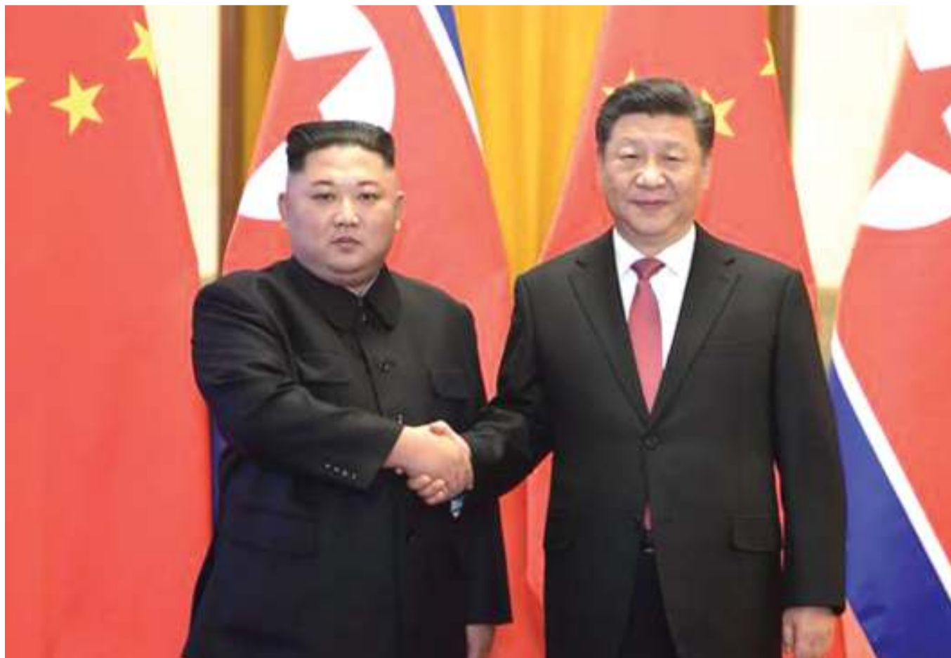
Rais wa Korea Kaskazini, Kim Jong Un (kulia), akiwa na Rais wa China, Xi Jinping, walipokutana kwa mazungumzo ya nyuklia mjini Pyongyang.