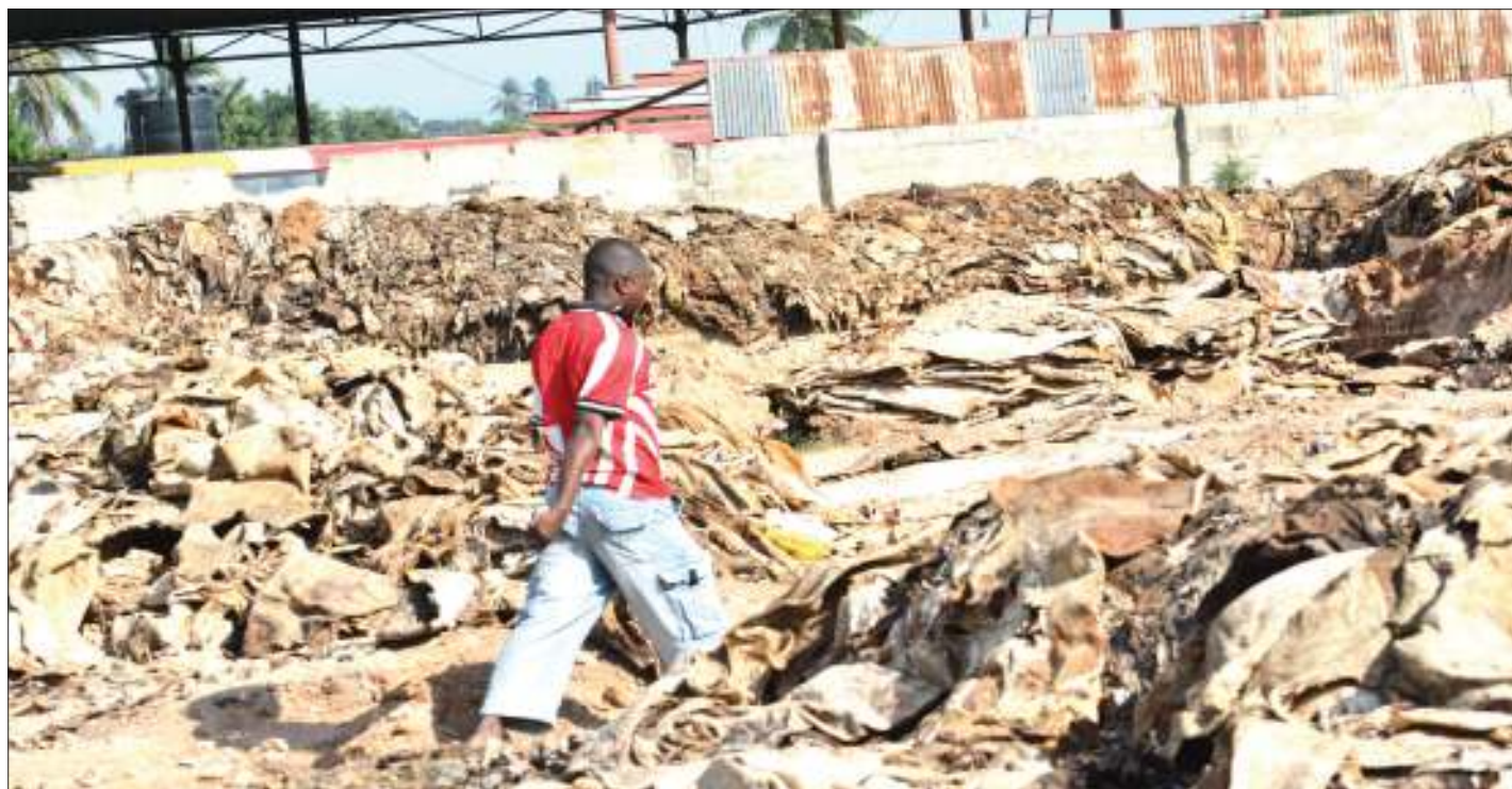
Mkazi wa Jiji la Dar es Salaam akipita karibu na rundo la ngozi zilizotelekezwa katika eneo la Mbagala Rangi Tatu, jana na kusababisha kero kwa wakazi wa eneo hilo, kutokana na harufu mbaya.

AKIRI kufanya makosa, Waziri Lugola awatoa hofu Watanzania, asema vyombo vya ulinzi viko imara... Endelea ukurasa wa 2