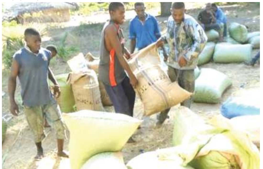
Wakulima wa korosho waliokusanyika katika soko la kuuza bidhaa zao, Muhoro, Rufiji.

"Awamu ya kwanza tuligawa vitambulisho 1,000 na awamu ya pili tuligawa vitambulisho 4,000," anasema, kwamba ni mkakati ulio-weza kuwafikia wafanyabiashara wa mjini na vijijini.