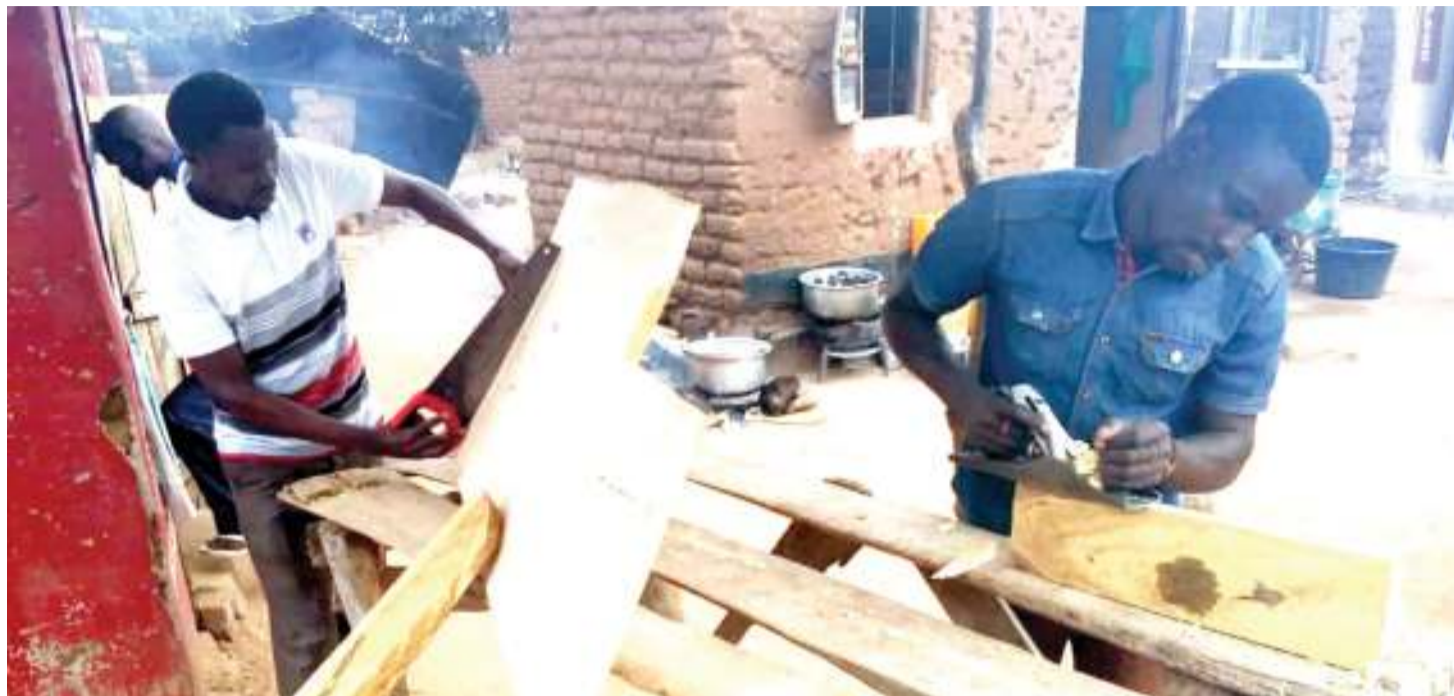
Wana kikundi cha Kwikuba Carpenters wakiwa kazini.