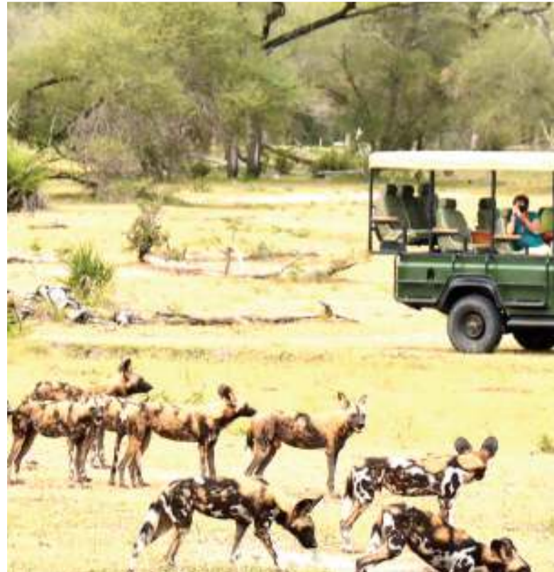
Watalii wakizuru hifadhini Selous.

Tumesikia karibuni kuwa katika Bonde la Kilombero, kwamba lina