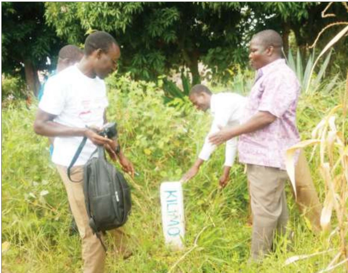
Baadhi ya wananchi wenye mashamba katika bonde la kilimo la Buswelu, wilaya Il-emela jijini Mwanza, wakionyesha kwa waandishi wa habari alama za mipaka 'beacon' zilizowekwa ili kutengani-eneo la makazi na kilimo. Upimaji wa kugeuza eneo hilo kutoka bonde la kilimo kuwa makazi unaendelea.

NEMC imefanunua kuwa tamko hilo halihusu ibada fupi kama vile adhana misikitini, kengele za kanisani ambazo huita waumini kwenda kufanya ibada za muda mfupi.