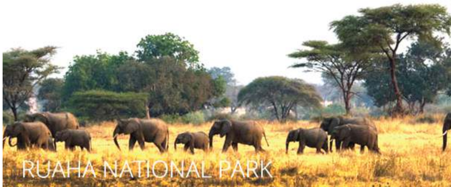
Tembo wakiwa katika Hifadhi ya Taifa ya Ruaha.