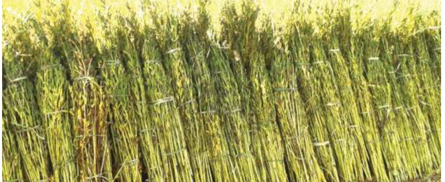
Zao la ufuta likiwa limevunwa shambani.