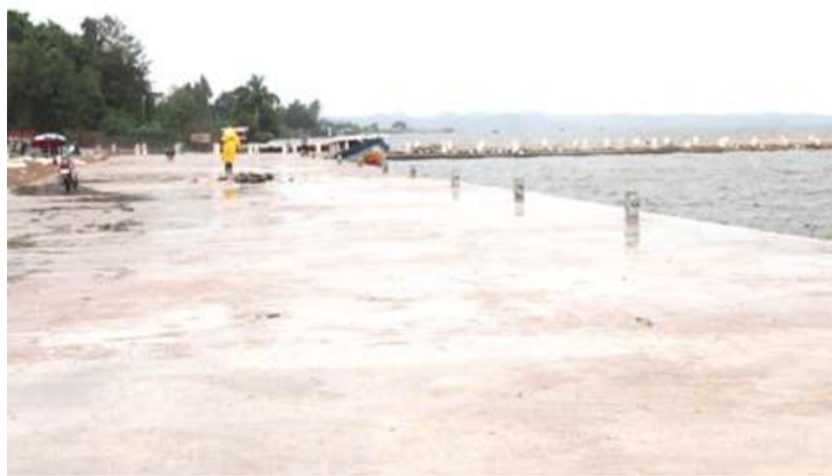
Sehemu ya Bandari ya Musoma, ikifanyiwa upanuzi. Picha zote: MTANDAO.

Lwesya anasema, pia katika Bandari ya Fela, wamechukua eneo la ujenzi wa bandari kavu, lenye ukubwa wa ekari 117,869 kwa sasa limepata mزابوني mshauri kwa ajili ya