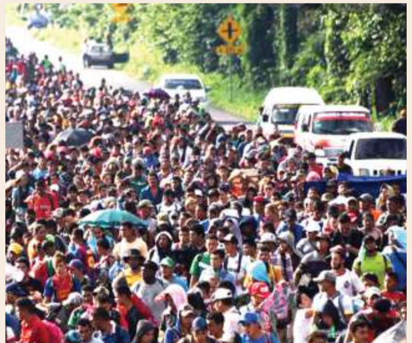
Wakimbizi kutoka nchini Mexico, katika misafara wakitaka kuingia nchini Marekani.