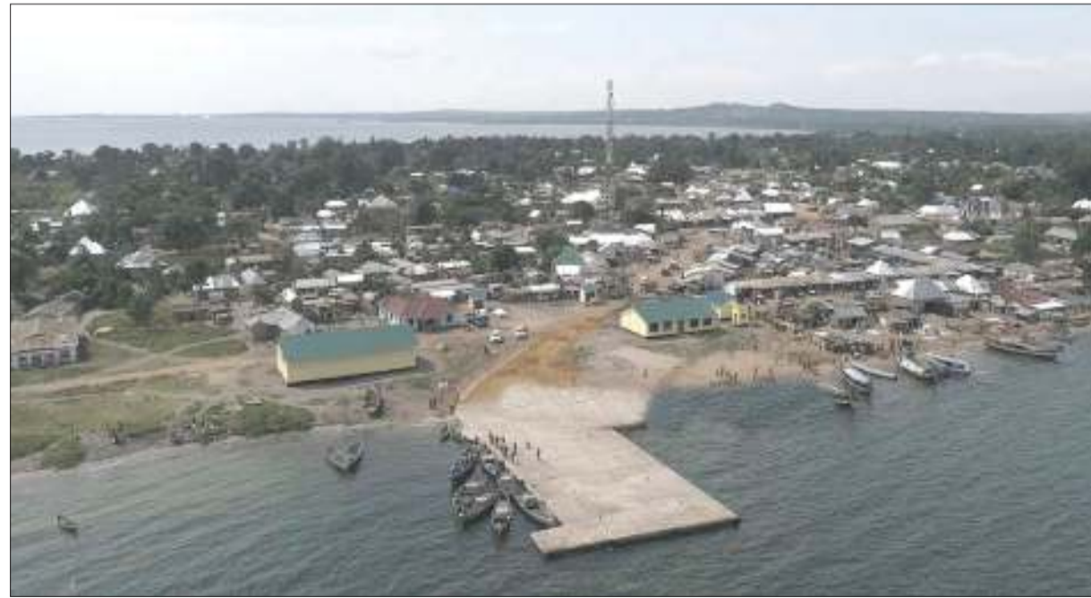
Bandari ya Lushamba, mkoani Mwanza katika mandhari yake mpya inayopendeza na kisasa.

Kiongozi anayesimamia bandari ya Nyamirembe, wilayani Chato, Mkoa wa Geita, anasema wanaendelea na mradi