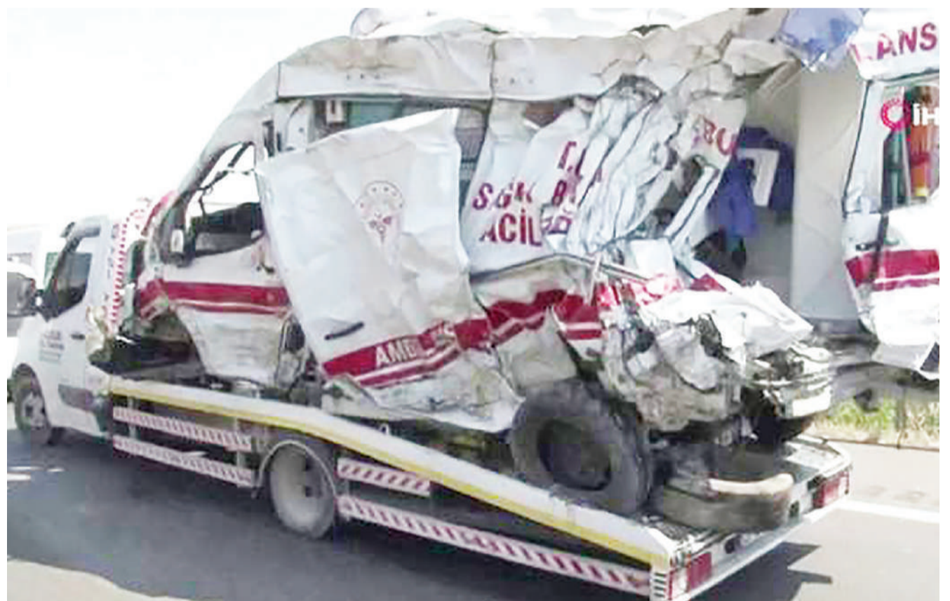
Gari ya kubebea wagonjwa iliyopata ajali.

Waziri wa Sheria Bekir Bozdog alitangaza uchunguzi kuhusu ajali hiyo, huku baadhi ya wanasiasa nchini humo wakituma salamu zao za rambirambi mtandaoni. BBC