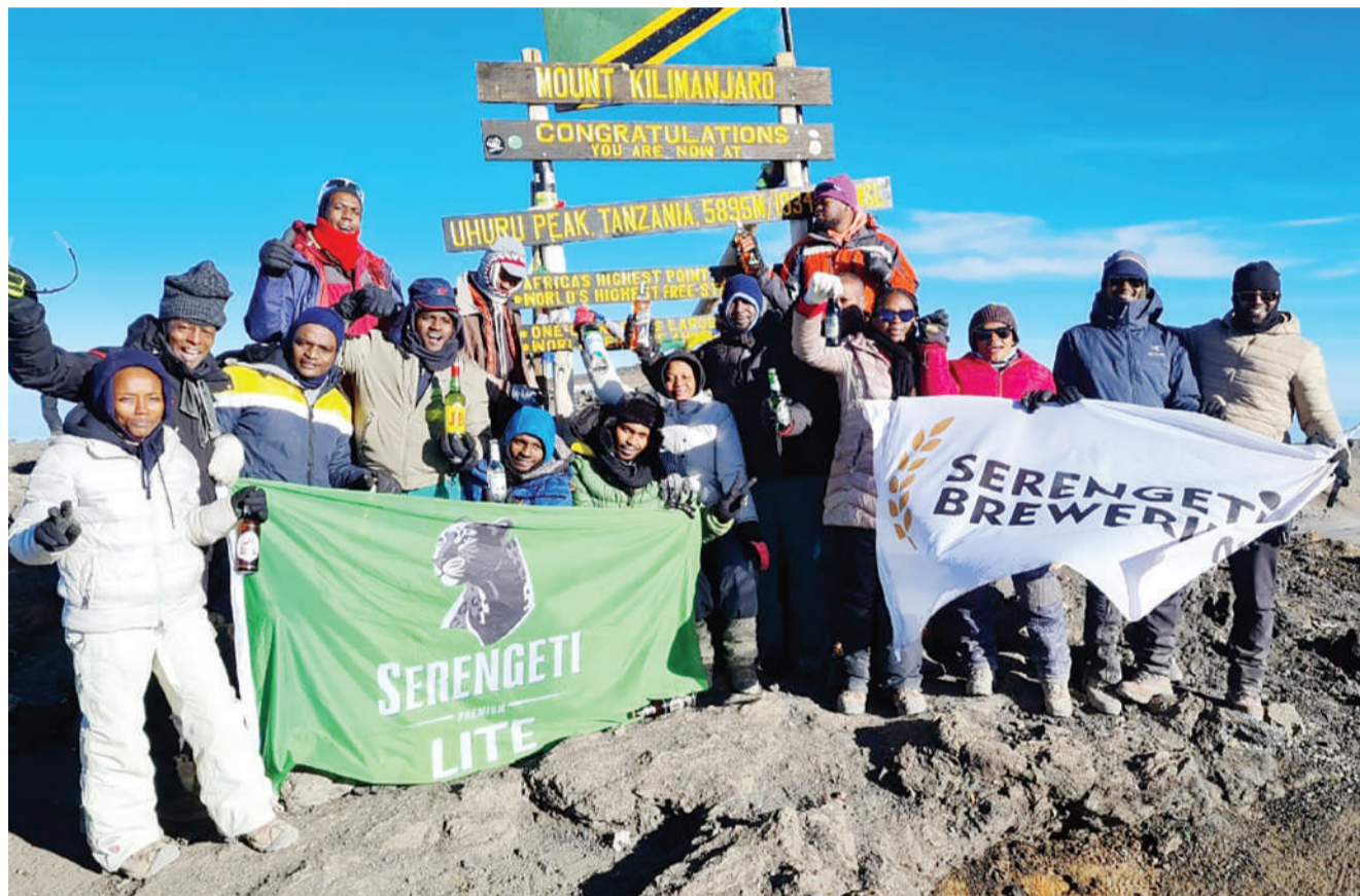
Baadhi ya wafanyakazi wa Kampuni ya Bia ya Serengeti wakiwa pamoja baada ya kufanikiwa kufika kwenye kilele cha Mlima Kilimanjaro (Uhuru Peak) ambao ni mrefu kuliko yote Afrika ikiwa ni sehemu ya kuhamasisha utalii wa ndani na kuifikisha chapa ya Serengeti kwenye kilele cha mlima huo.

Benki ya Mwanga Hakika imekuwa ya biashara sasa na wateja wake wategemeo huduma nyingi zaidi ya zile zilizokuwa zikitolewa awali.