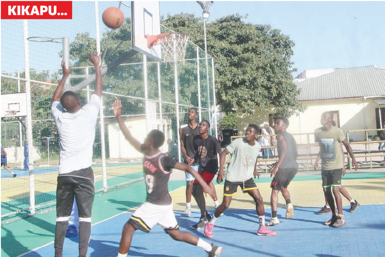
Vijana wakifanya mazoezi ya mpira wa kikapu katika viwanja vya Jakaya Kikwete jijini Dar es Salaam juzi.