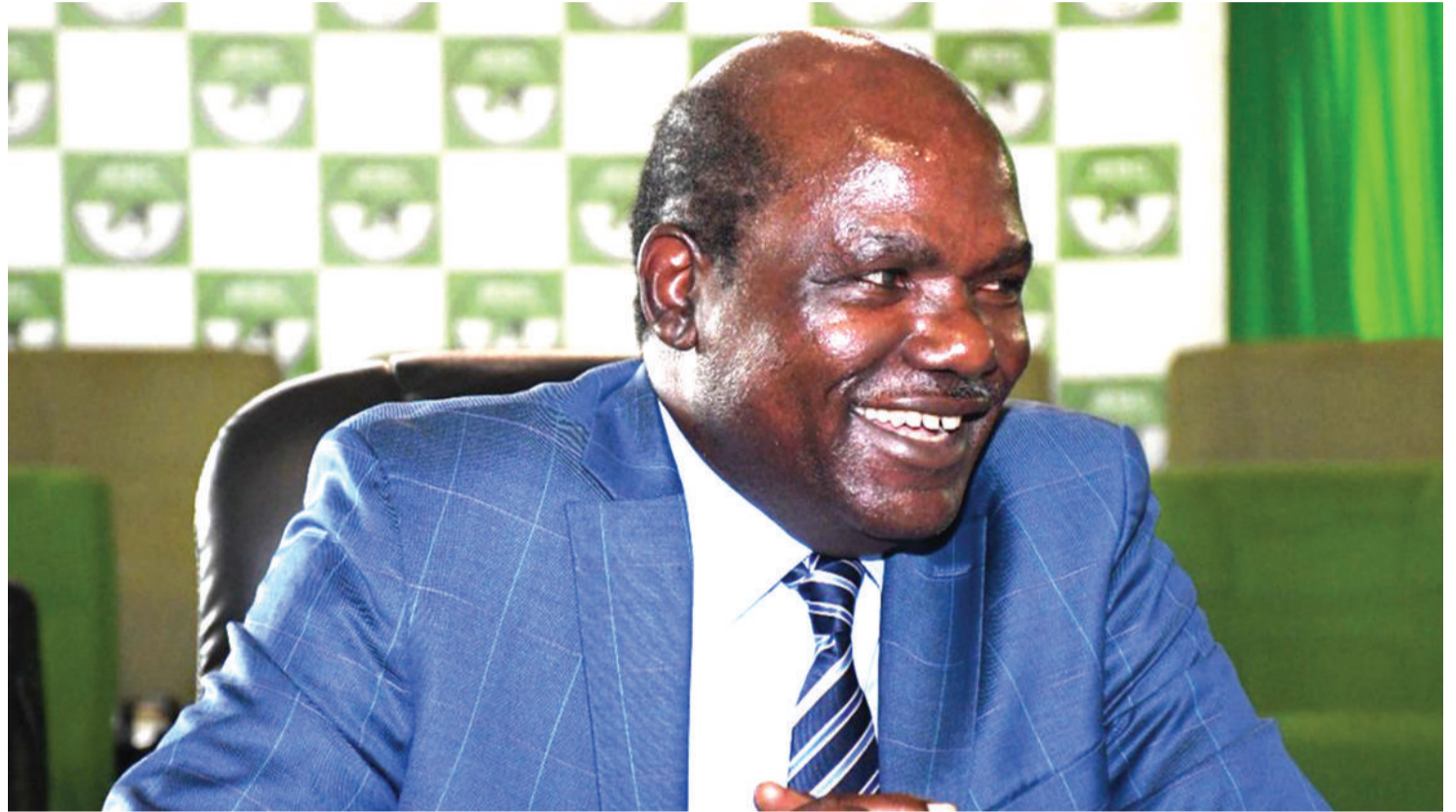
Mwenyekiti wa IEBC Wafula Chebukati, ndiye msimamizi mkuu wa kura za uchaguzi wa Rais.

Hii imekuwa na athari mbaya kwa wasomaji na watumiaji mitandao hasa vijana, kwani ni wengi wanaotumia jukwaa hilo