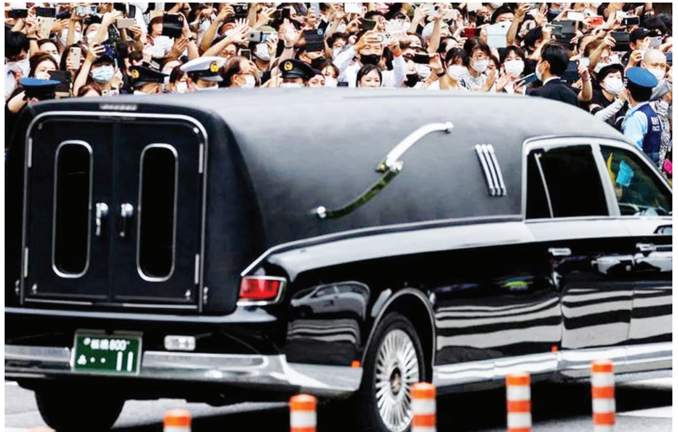
Watu wakiangalia gari lilobeba mwili wa waziri mkuu wa zamani wa Japan, Shinzo Abe, wakati ukiwasili katika eneo la maziko katika hekalu la Zojoji jijini Tokyo jana. Abe aliuawa kwa kupigwa risasi wakati akihutubia mkutano wa kampeni mwishoni mwa wiki iliyopita.

Kamishna wa Umoja wa Ulaya anayeshughulikia masuala ya sheria, Didier Reyners, alisema umoja huo umezuia mali za Russia za thamani ya dola bilioni 13.8 tangu ilipovamia Ukraine Februari 24 mwaka huu. DW