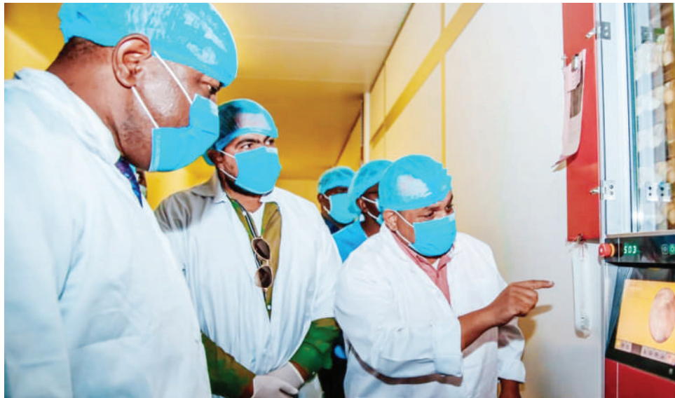
Naibu Waziri wa Mifugo na Uvuvi, Abdallah Ulega (kushoto), akipatiwa maelezo kuhusu kifaa kinachooonyesha ukuaji wa kifaranga ndani ya yai mpaka siku kitakapotolewa alipotembelea shamba la Oganja wilayani Kibaha, mkoani Pwani.

Wassira alisema ili kujenga nchi na watu wake, mapinduzi katika elimu ni jambo la msingi.