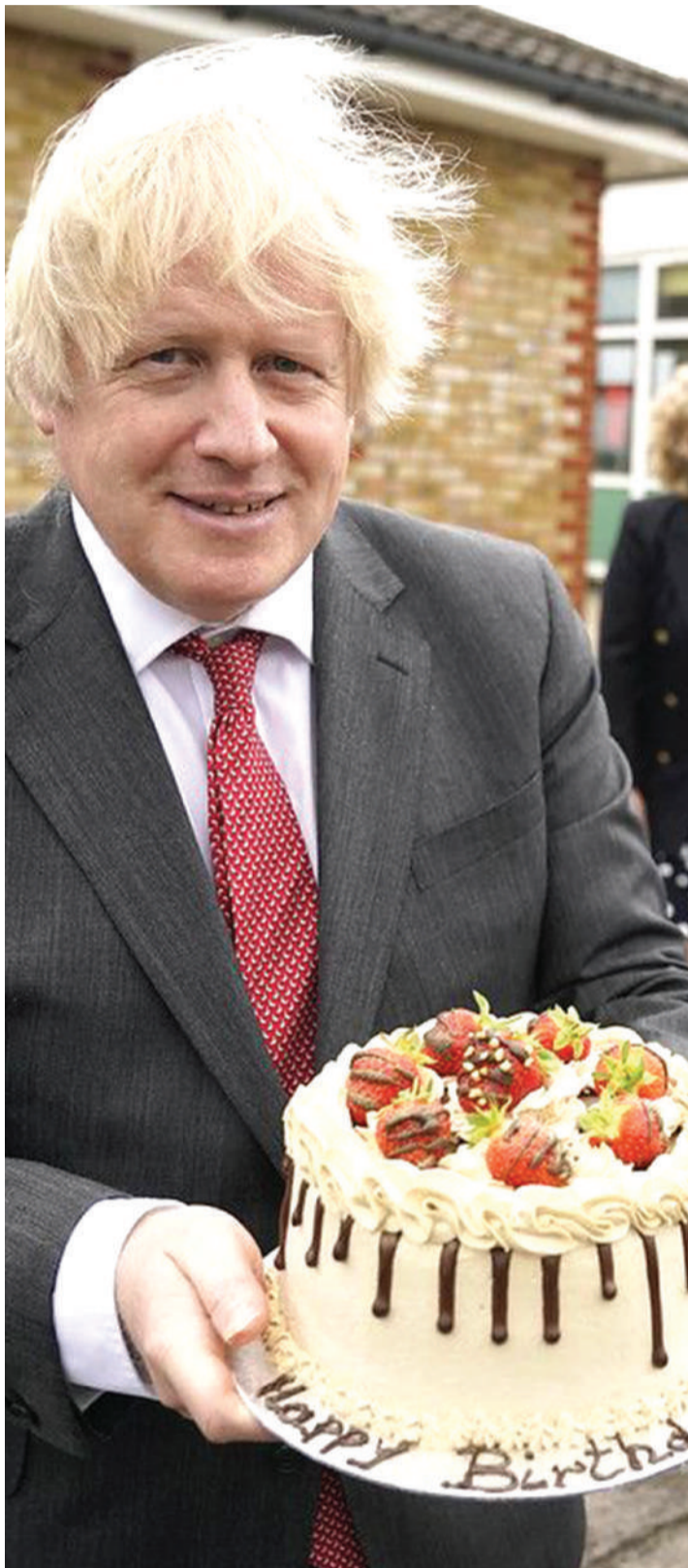
Swali linaendelea kukosa jibu tafrija na 'kulakula' pekee ndiko kulimponza Johnson?.

Johnson alikuwa Meya wa London halafu akawa Waziri wa