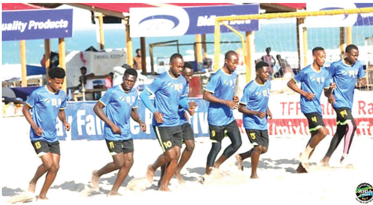
Timu ya Taifa ya Soka la ufukweni (Beach Soccer) ikiendelea na mazoezi kwenye fukwe za Coco kujiandaa na mchezo wa kufuzu AFCON (BSAFCON) dhidi ya Malawi.

“Yaani sasa hivi hakuna anayeweza kuongea sio Msuva, kaka, Mama wala dada yake wote wanamshukuru Mungu kwa kutenda,” amesema.