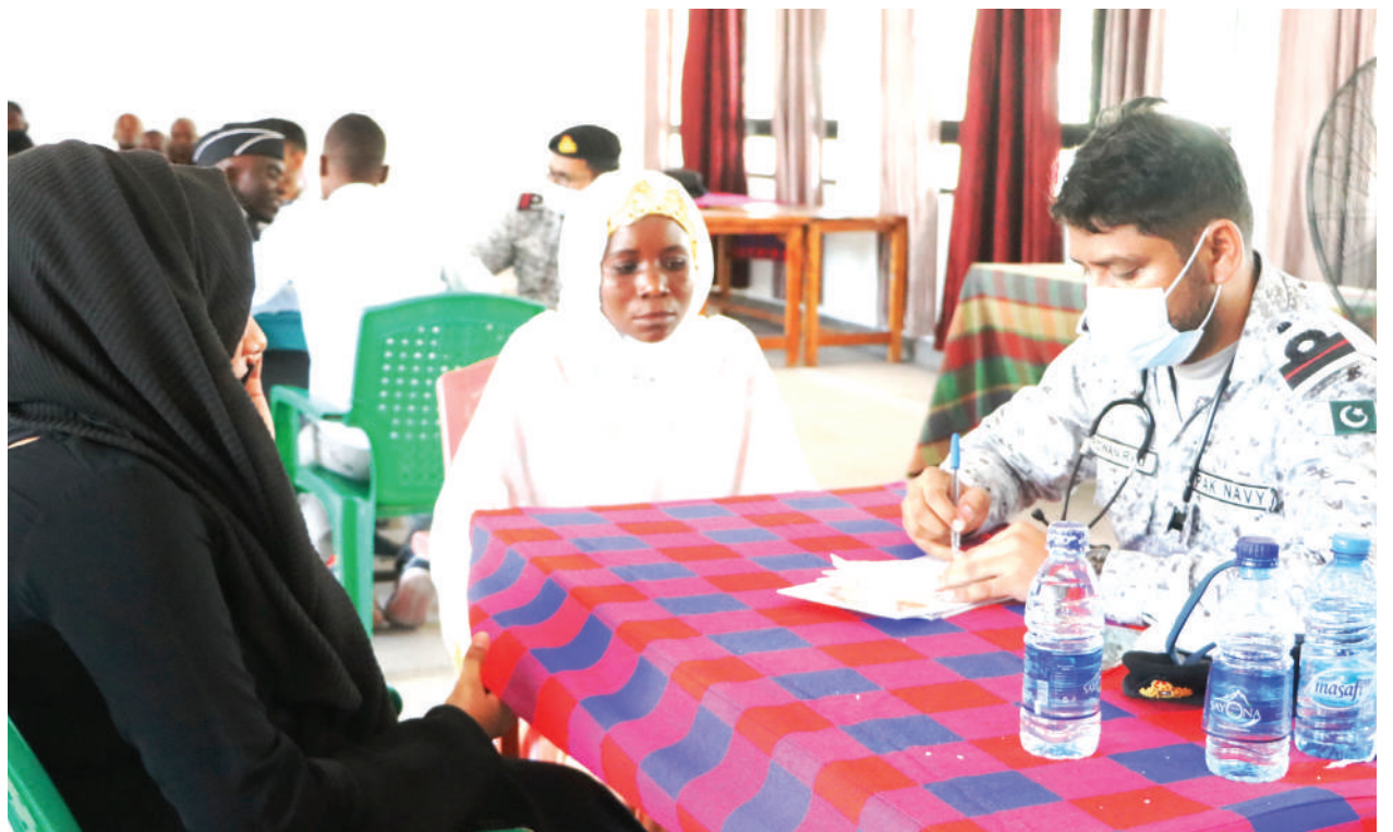
Mmoja wa madaktari kutoka kwenye meli ya Jeshi la Wanamaji la Pakistani (kulia), akiwahudumia wananchi katika kambi ya matibabu bure, iliyoandaliwa na jeshi hilo, katika Shule ya Almontazir, jijini Dar es Salaam mwishoni mwa wiki.

Myao alisema lengo la kutumia vyumba vya maabara, maktaba na mabweni ni kuhakikisha wanafunzi hao wanaenda sambamba kimasomo na wenzao waliopata nafasi katika chaguo la kwanza.