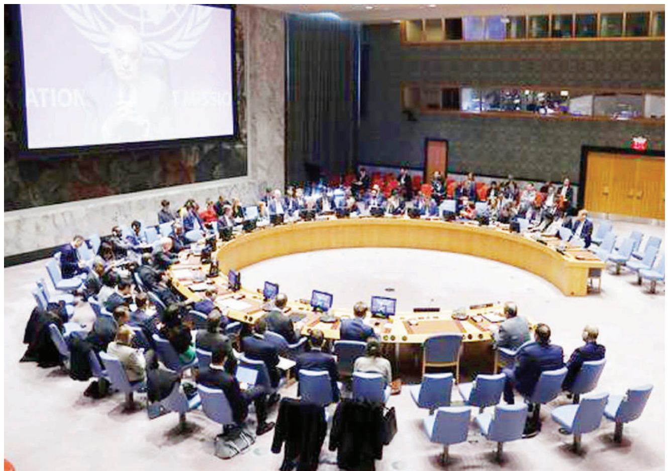
Wajumbe wa Baraza la Umoja wa Mataifa wakiwa katika kikao wakijadili Libya.

Alitumia fedha nyingi kujenga uhusiano na majeshi mengine ya Lebanon, Yemen, Iraq na Syria wakati ambao Marekani ilikuwa inaweka vikwazo vingi dhidi ya Wairan. BBC