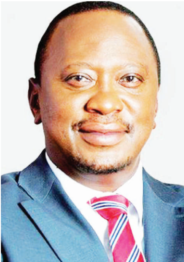
Rais Uhuru Kenyatta.

• Mtihani kukamilisha Katiba Mpya ya 2013