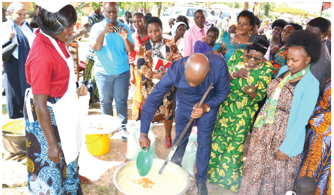
Naibu Waziri wa Afya, Maendeleo ya Jamii, Jinsia, Wazee na Watoto, Dk. Faustine Ndugulile, akishiriki kupika uji lishe kwa ajili ya watoto wakati wa Siku ya Lishe eneo la Tanangozi, mkoani Iringa juzi, wakati wa ziara yake mkoani humo kukagua shughuli za afya na maendeleo ya jamii.