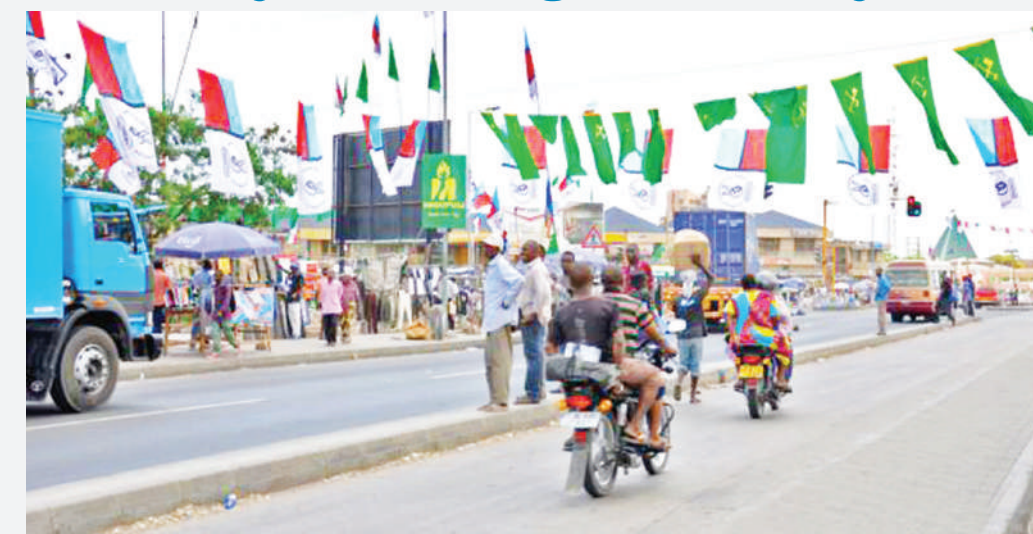
Homa ya uchaguzi ilivyowahi kutokea Zanzibar.