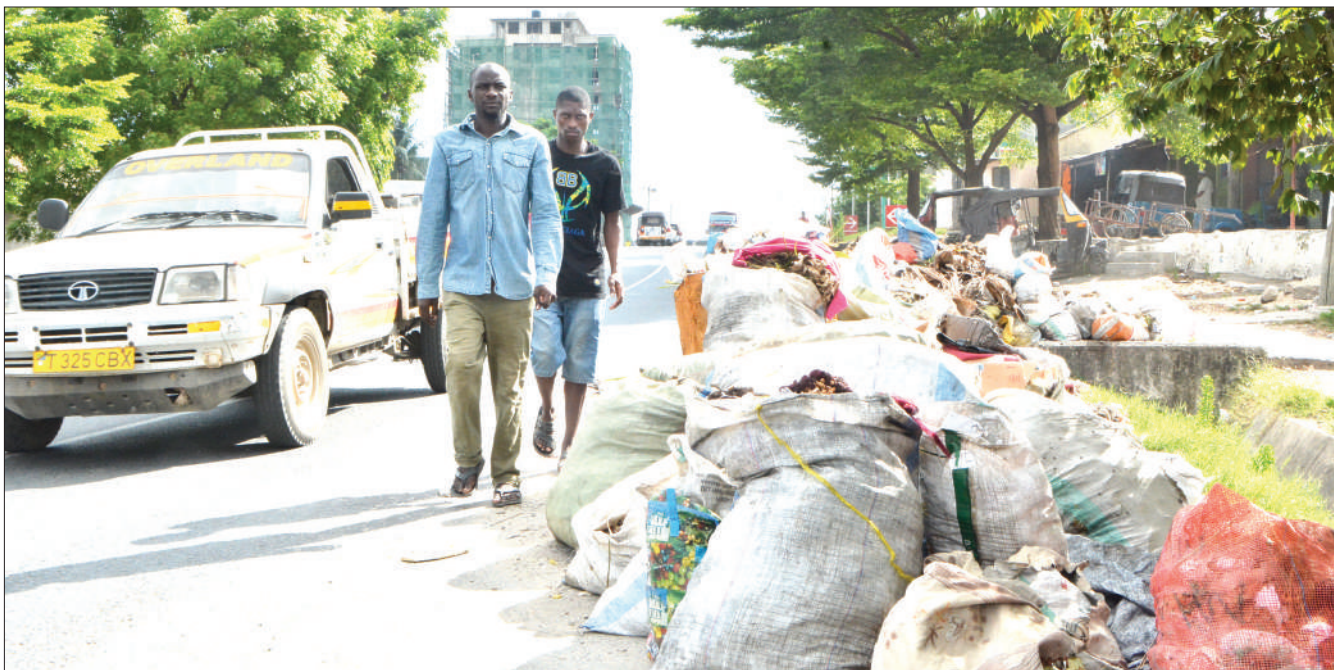
Mwananchi wakipita jirani na taka zilizotelekezwa bila ya kuzolewa kando ya barabara katika eneo la Kigogo, jijini Dar es Salaam jana.

Ilielezwa katika taarifa hiyo kuwa uteuzi mpya wa bodi umezingatia uwekezaji mkubwa katika rasilimali watu kwa kuchagua watendaji wenye sifa stahiki na utendaji mkubwa ka-tika kuendeleza benki.