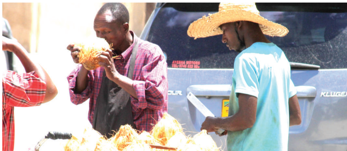
Mkazi wa Jiji la Dodoma, akikata kiu kwa maji ya dafu katika eneo la Mji Mpya. Dafu moja liliuzwa kwa bei ya 1,000/-.

"Mimi hawa watu ingekuwa maamuzi (uamuzi) yangu (wangu) ningekata mikono yao... wakati sisi tunapambana kupandisha uchumi wa nchi mtu mwingine anaingiza fedha bandia katika mzunguko. Huyo hana tofauti na yule ambaye mpo naye kwenye mtumbwi halafu anautoboa," alisema.