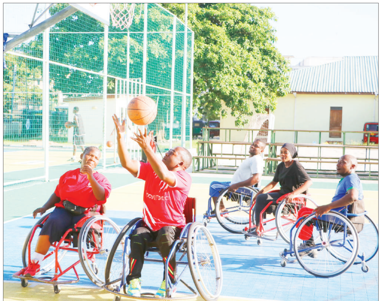
Wachezaji wa timu ya kikapu ya wenye ulemavu ya Mkoa wa Dar es Salaam, wakifanya mazoezi kujiandaa na mashindano mbalimbali kwenye Uwanja wa Jakaya Mrisho Kikwete (JMK Park) jijini jana.

Kwa matokeo hayo Mtibwa Sugar nusu fainali sasa itakutana na mshindi wa mechi kati ya Jamhuri na Yanga keshokutwa kwenye Uwanja wa Amaan.