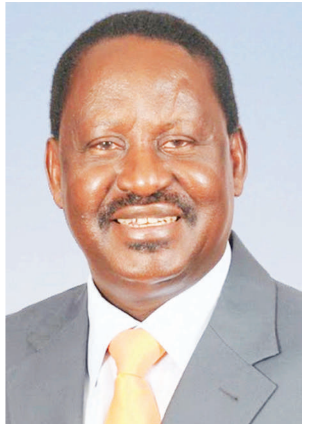
Raila Odinga.