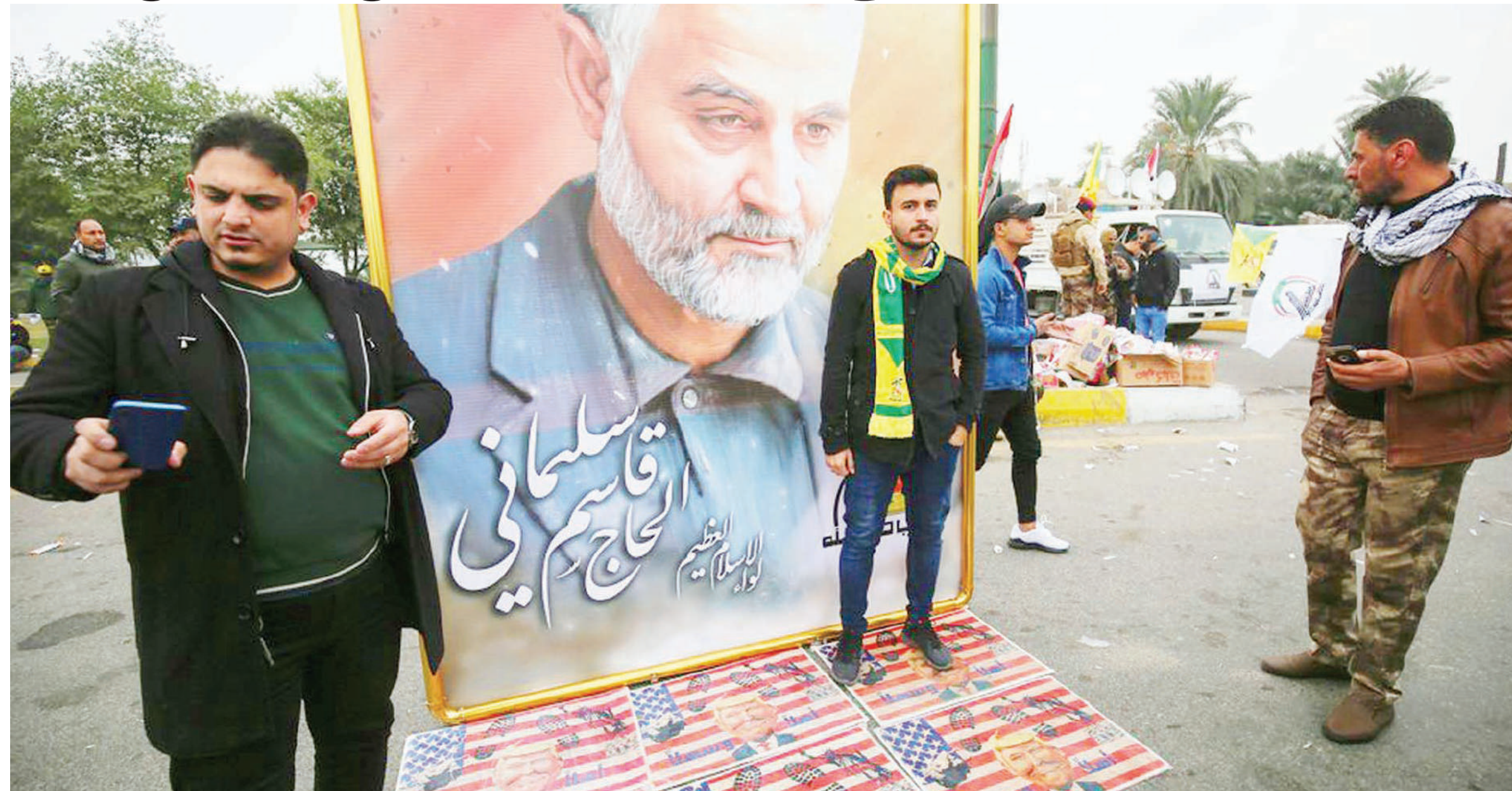
Maombolezo ya Jenerali Qasem Soleimani, nchini Iran.