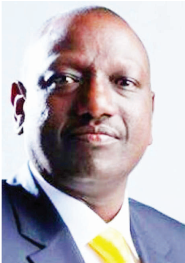
Makamu wa Rais, William Ruto.