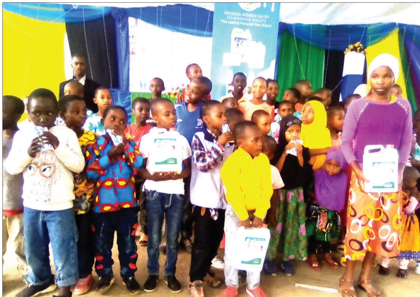
Baadhi ya watoto wenye mahitaji maalumu (wanaoishi na viusi vya Ukimwi) wilayani Siha, mkoani Kilimanjaro, wakifurahia zawadi ya maziwa waliopatiwa na Taasisi ya Mtandao wa Wasanii wa Injili Tanzania (TAGOANE). Taasisi hiyo pia imewakatiwa bima ya afya watoto 100 wenye mahitaji maalumu, wilayani humo, ili waweze kupata huduma za tiba na kukabiliana na changamoto za gharama za matibabu.

Kesi hiyo namba 333 ya mwaka 2019, inasikilizwa na Hakimku Mkazi wa Mahakama hiyo, Devotha Msofe.