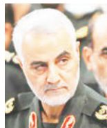
Soleimani aliuawa katika mapambano ya anga na Jeshi la Marekani nchini Iraq siku ya Ijumaa, baada ya Rais Trump kutoa amri kuwa auawe.

Soleimani alikuwa mtu wa pili mashuhuri nchini Iran baada ya