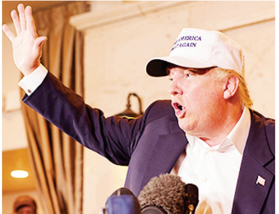
Rais wa Marekani, Donald Trump.