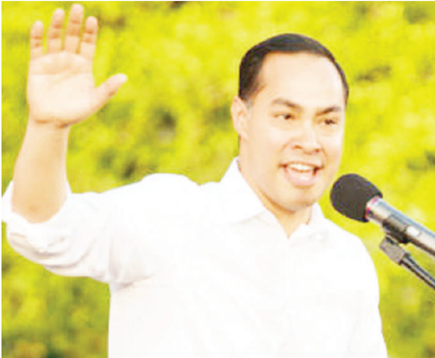
Julian Castro.

• Chasakwa kigingi kumng'oa Donald Trump