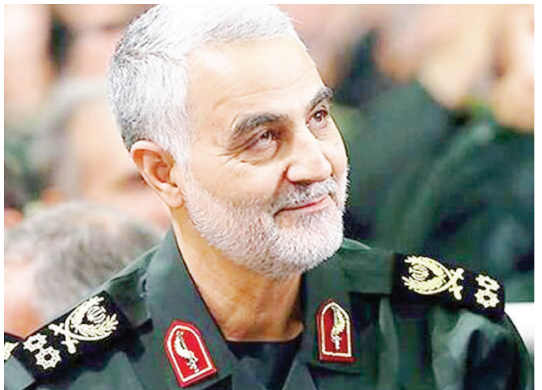
Jenerali Qassem Soleimani.

Vita ukatili jinsia kupitia moto aliyowasha Majaliwa Ukurasa 20