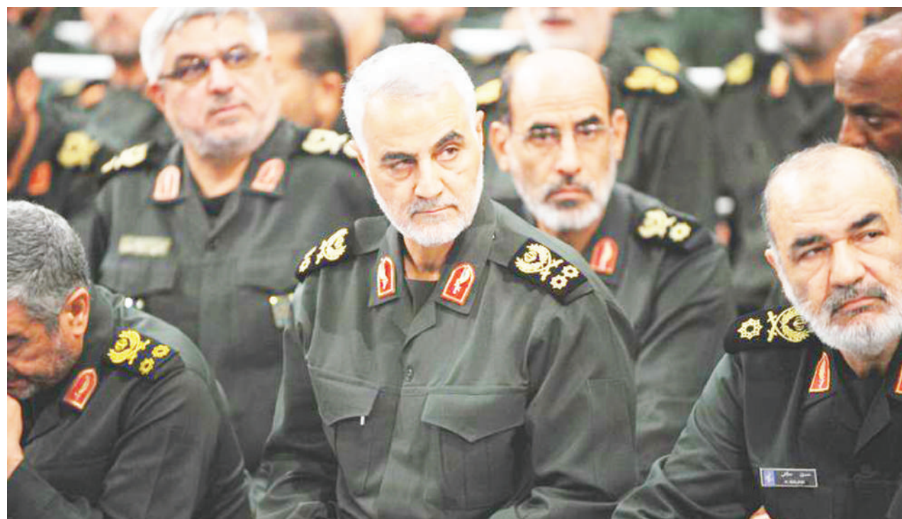
Jenerali Qasem Soleimani.

“Mudavadi ana uwezo kutatua matatizo ya kiuchumi tunayokabiliana nayo nchini mwe...anaweza kushughulikia ugumu wa ki-fedha unaotukabili.”