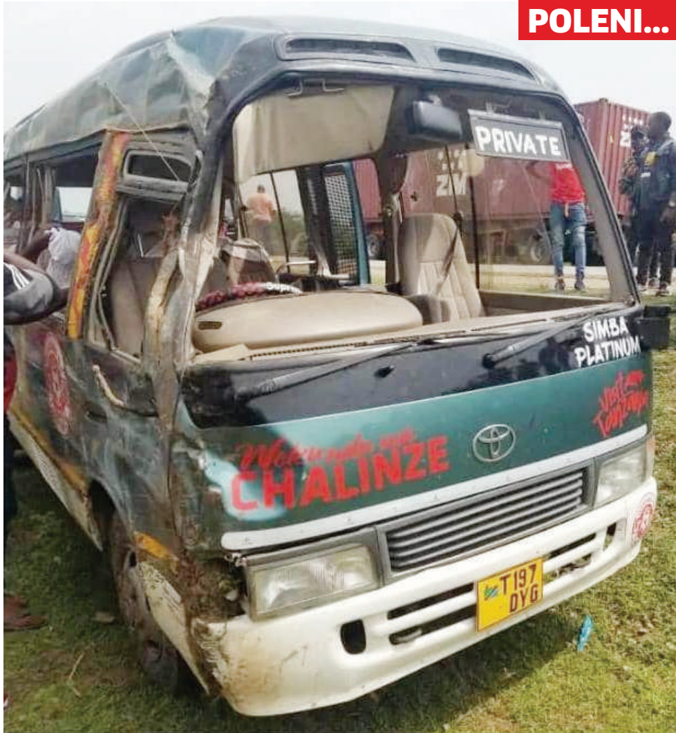
Basi lililokuwa limebeba mashabiki wa Simba tawi la Wekundu wa Chalinze, baada ya kupata ajali jana majira ya saa nane mchana katika Kijiji cha Wendele wilayani Kahama.