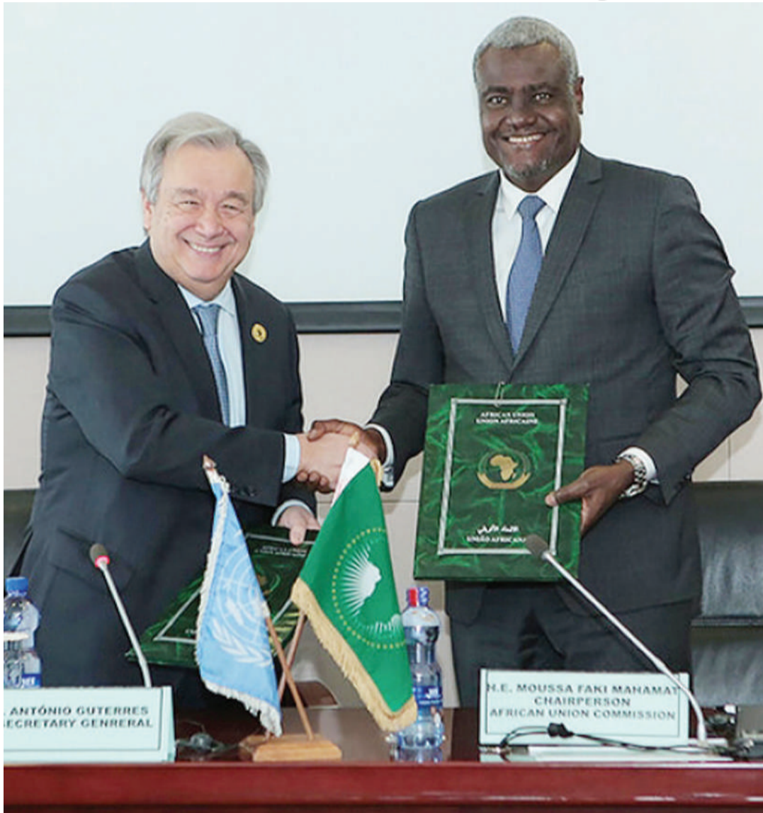
Katibu Mkuu wa UN, Antonio Guterres akiwa na Mwenyekiti wa Kamisheni ya Umoja wa Afrika, Moussa Faki Mahamat.