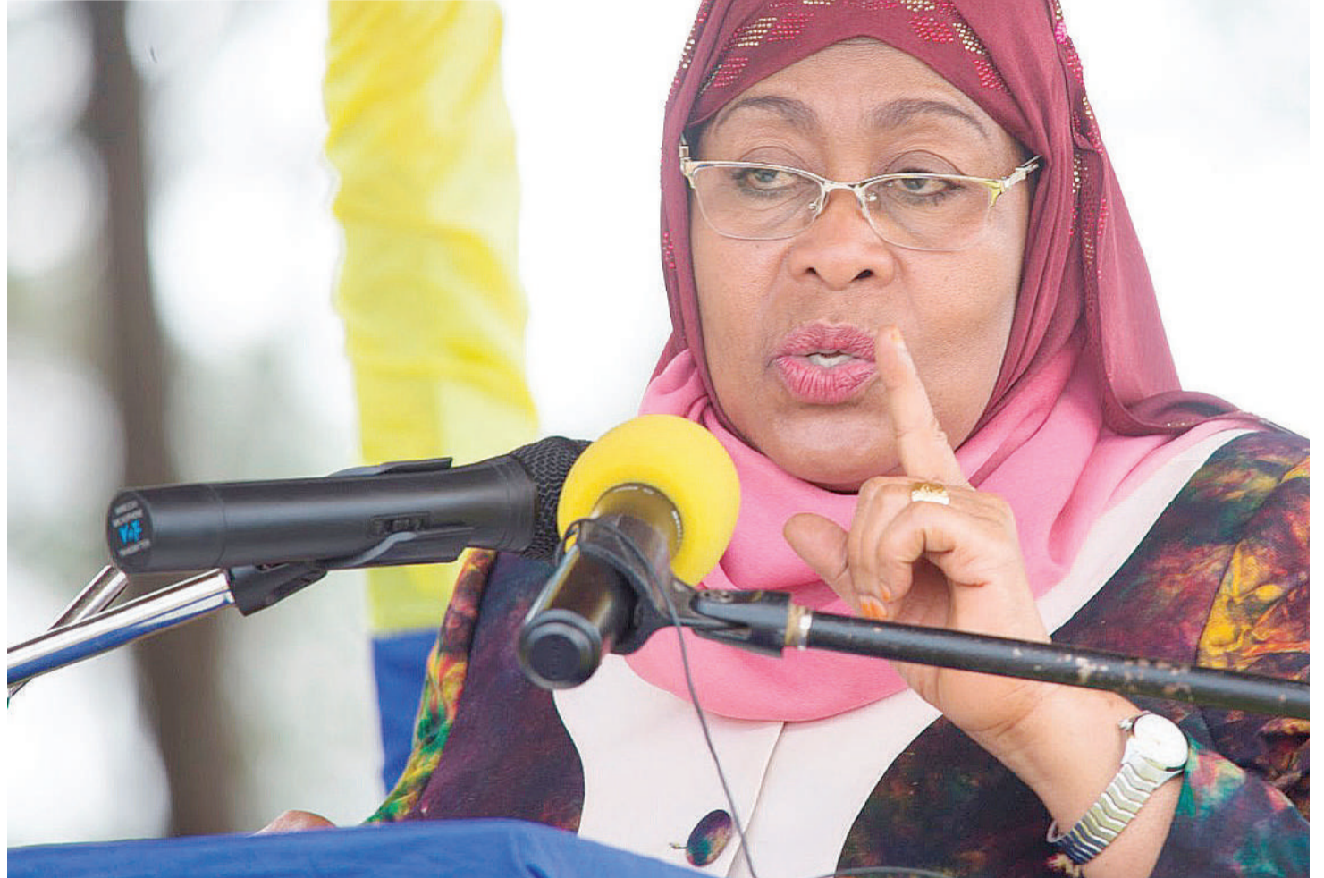
Rais Samia Suluhu Hassan.

haifu ulioanzia katika mchakato wa kumpata mgombea wa CCM katika uchaguzi mkuu mwaka 2005.