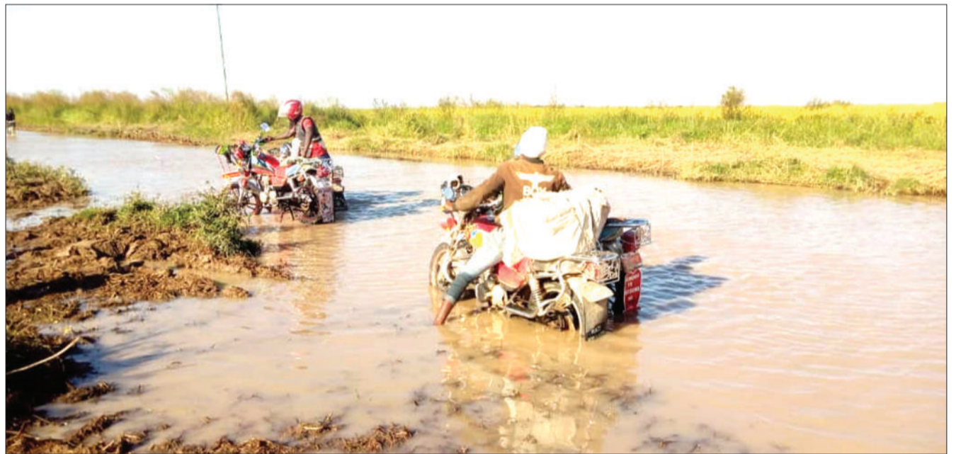
Waendesha bodaboda wakipita kwa tabu baada ya mawasiliano ya barabara inayounganisha vijiji vya Luhanga na Madundasi katika Kata ya Luhanga, Halmashauri ya Mbarali, mkoani Mbeya, kukatika kutokana na maji kujaa jana.

Aliongeza kuwa uongozi wa wilaya unafahamu tatizo la barabara katika kijiji hicho na kwamba wanashindwa hata kuwatembelea kutokana na kadhia hiyo.