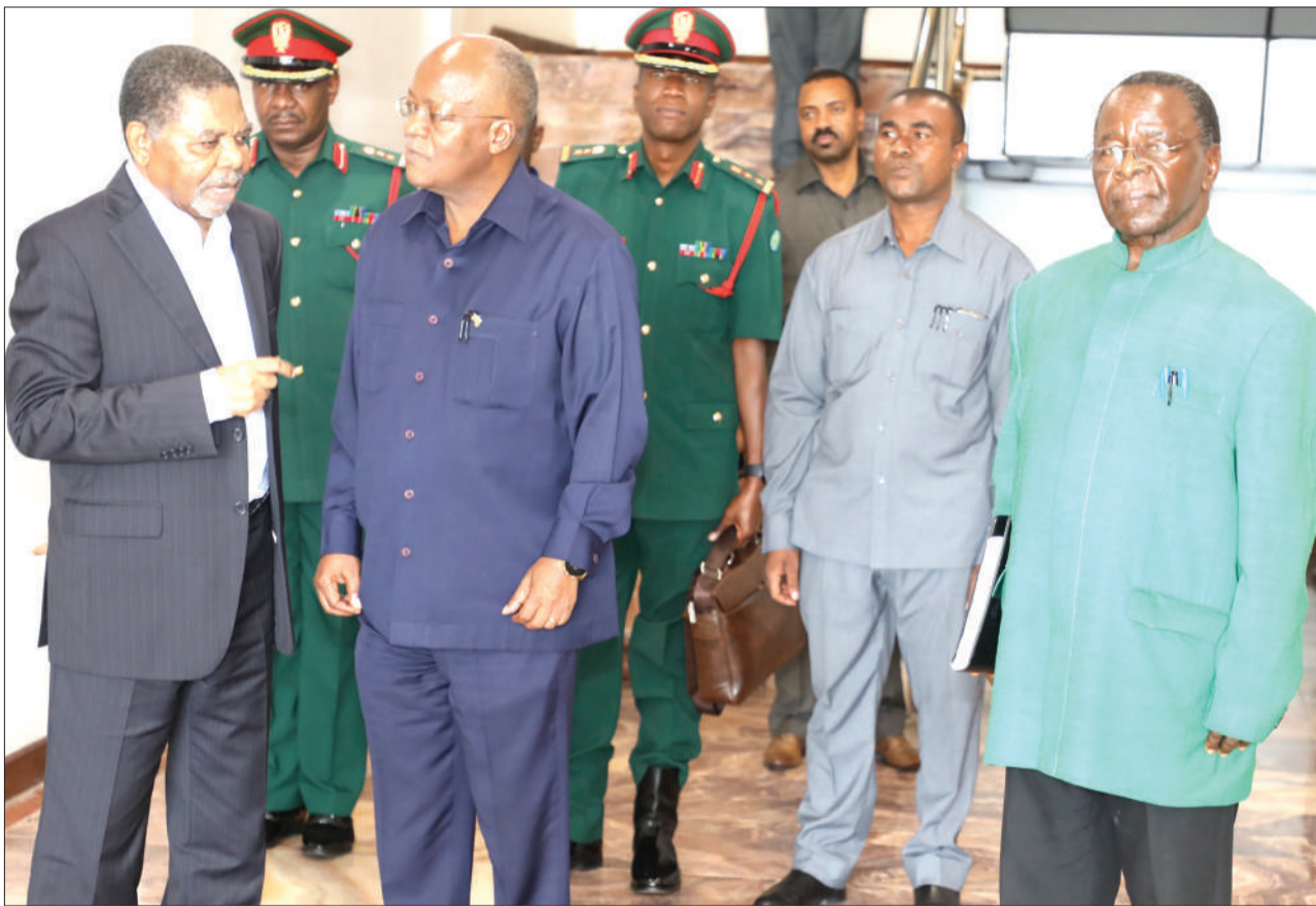
Mwenyekiti wa Chama Cha Mapinduzi (CCM), Rais Dk. John Magufuli, akijadiliana jambo na Rais wa Zanzibar na Mwenyekiti wa Baraza la Mapinduzi ambaye ni Makamu Mwenyekiti wa CCM Zanzibar, Dk. Ali Mohamed Shein, baada ya kikao chao Ikulu, Chamwino mkoani Dodoma jana. Kulia ni Makamu Mwenyekiti wa CCM Bara, Philip Mangula.

WATIA nia kujitokeza hadi Juni 15, vyama vyaitwa kuunda ushirikiano... Endelea ukurasa 2