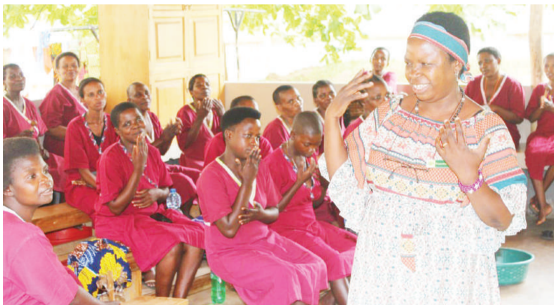
Washiriki Siku ya Fistula Duniani, katika moja ya hospitali jijini Dar es Salaam, inayofanyika kila Mei 23 ya mwaka.

Rai iliyoko kiasia ni kwamba, fistula inatibika na kinamama katika ujauzito wao wanatakiwa kuhudhuria kliniki wafanyiwe uchunguzi