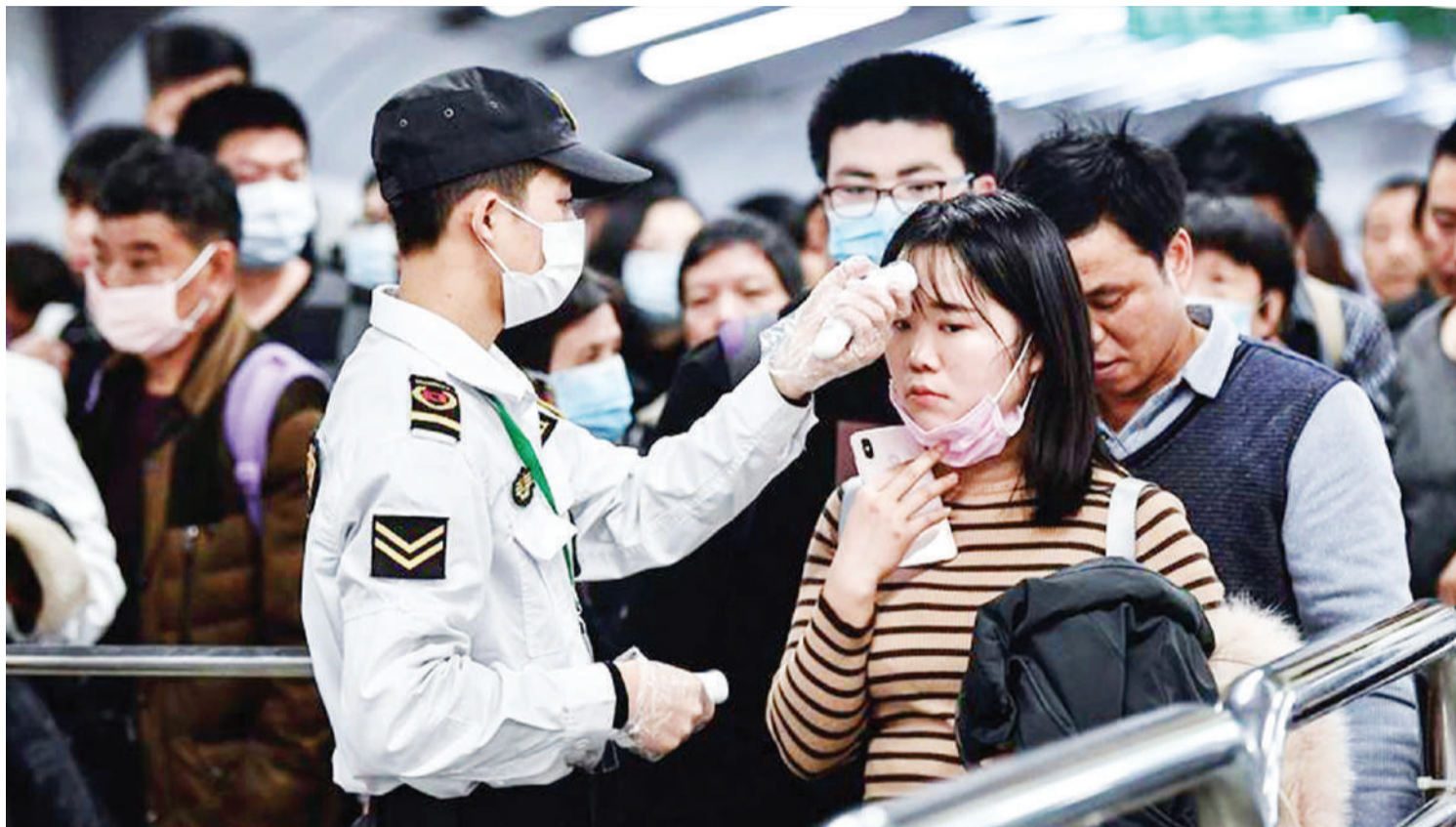
Iliyoy hali halisi ya kuikabili corona duniani.