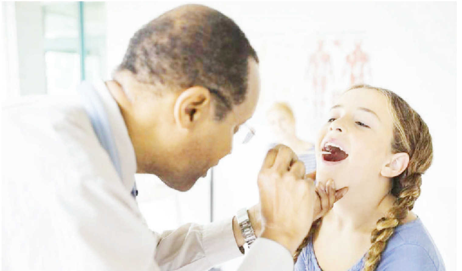
Daktari wa koo akimhudumia mgonjwa wake.