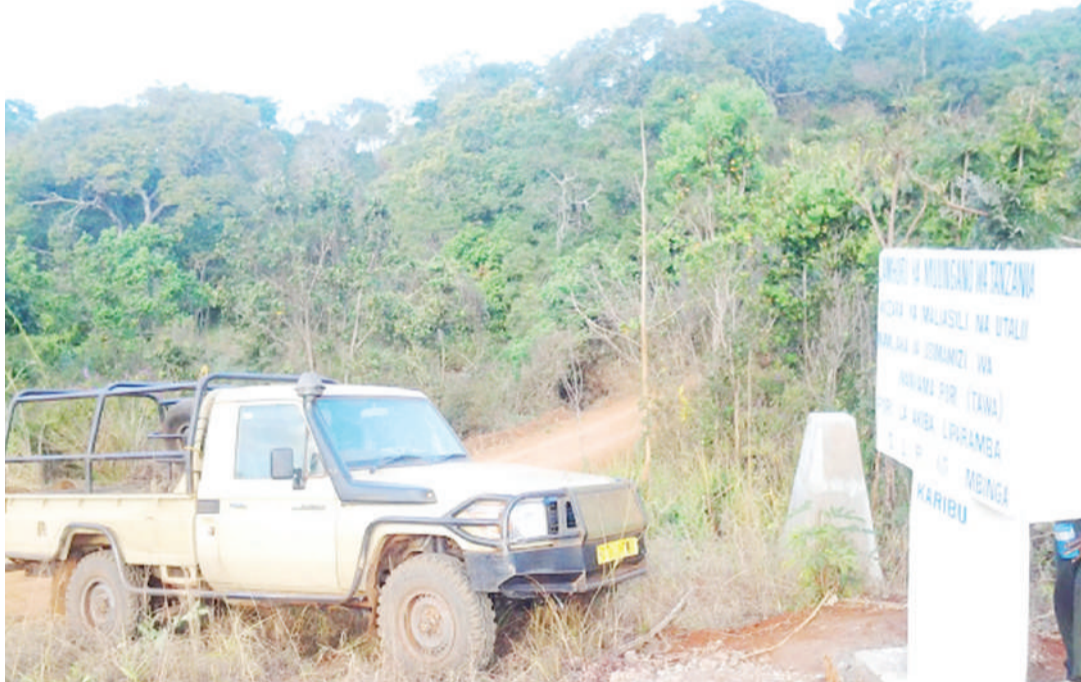
Misitu wa Pori la Akiba, Liparamba, mkoani Ruvuma.

Kiongozi huyo mtaaluma anayesimamia misitu ya nchi, anasema wameboresha zaidi usimamizi wa misitu katika kipindi hi-