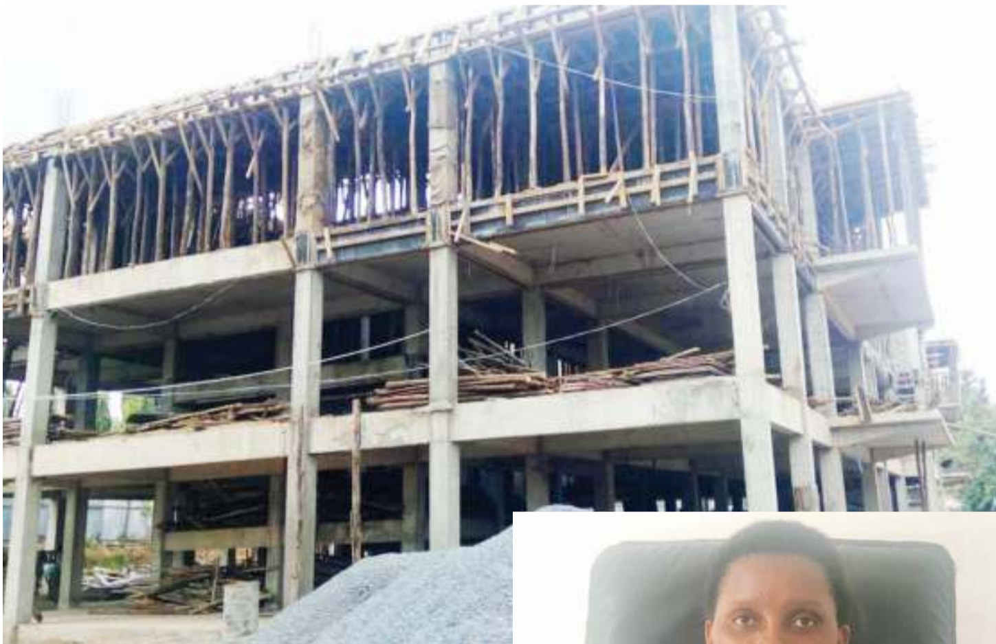
Jengo jipya la Mama na Mtoto, hospitalini Sekou Toure.

• Ghorofa 5 mpya mama & mtoto • Usafishaji figo, tiba moyo zaja • Siku wanaojifungua 60; 'kisu' wanne