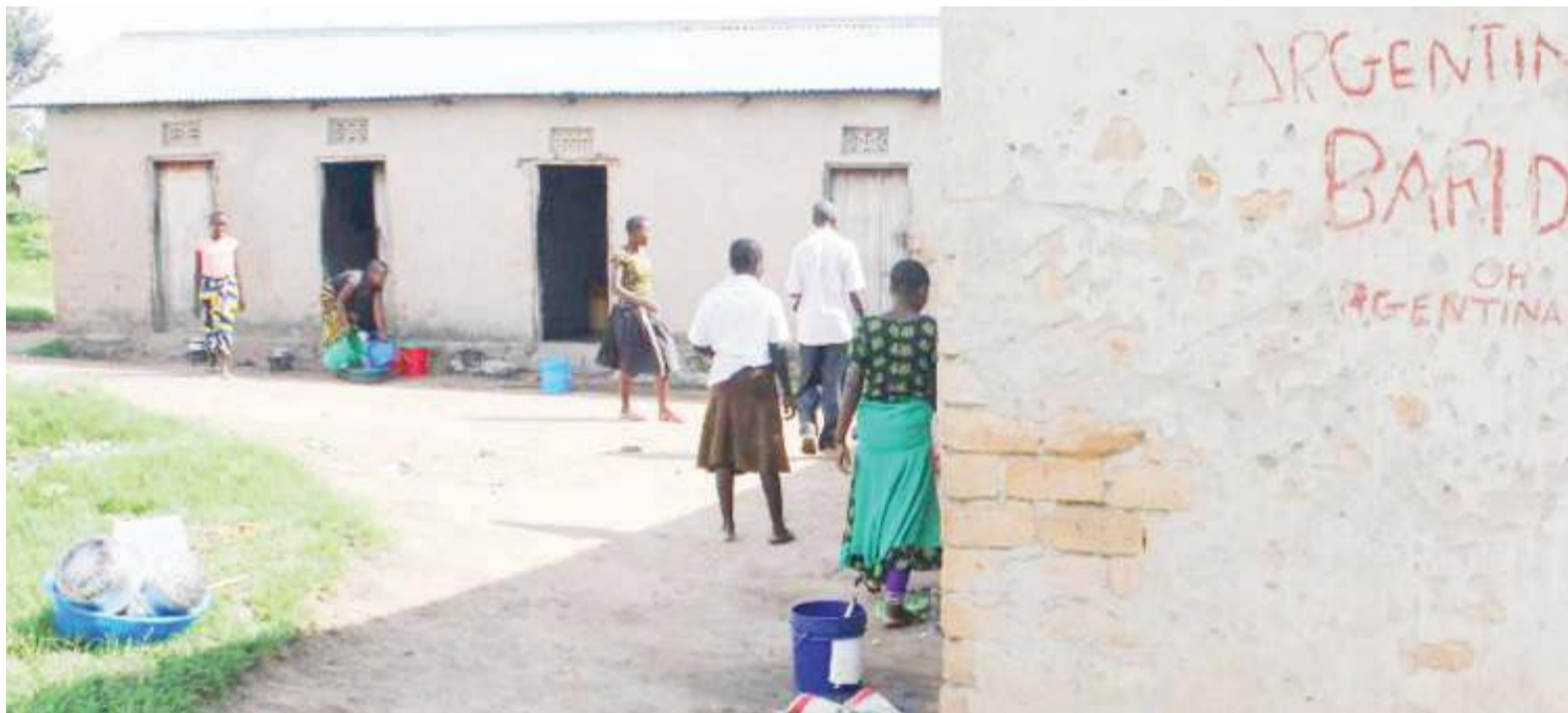
Baadhi ya wasichana wanaosoma katika Shule ya Sekondari Kachwamba wilayani Chato, wakiwa kwenye 'mageto' yao walikopanga.

• Wenyewe tabu; vijana kijijini janga • 'Tufanye bado wamelala' • Mkoa waishia kulalama, kijiji ch