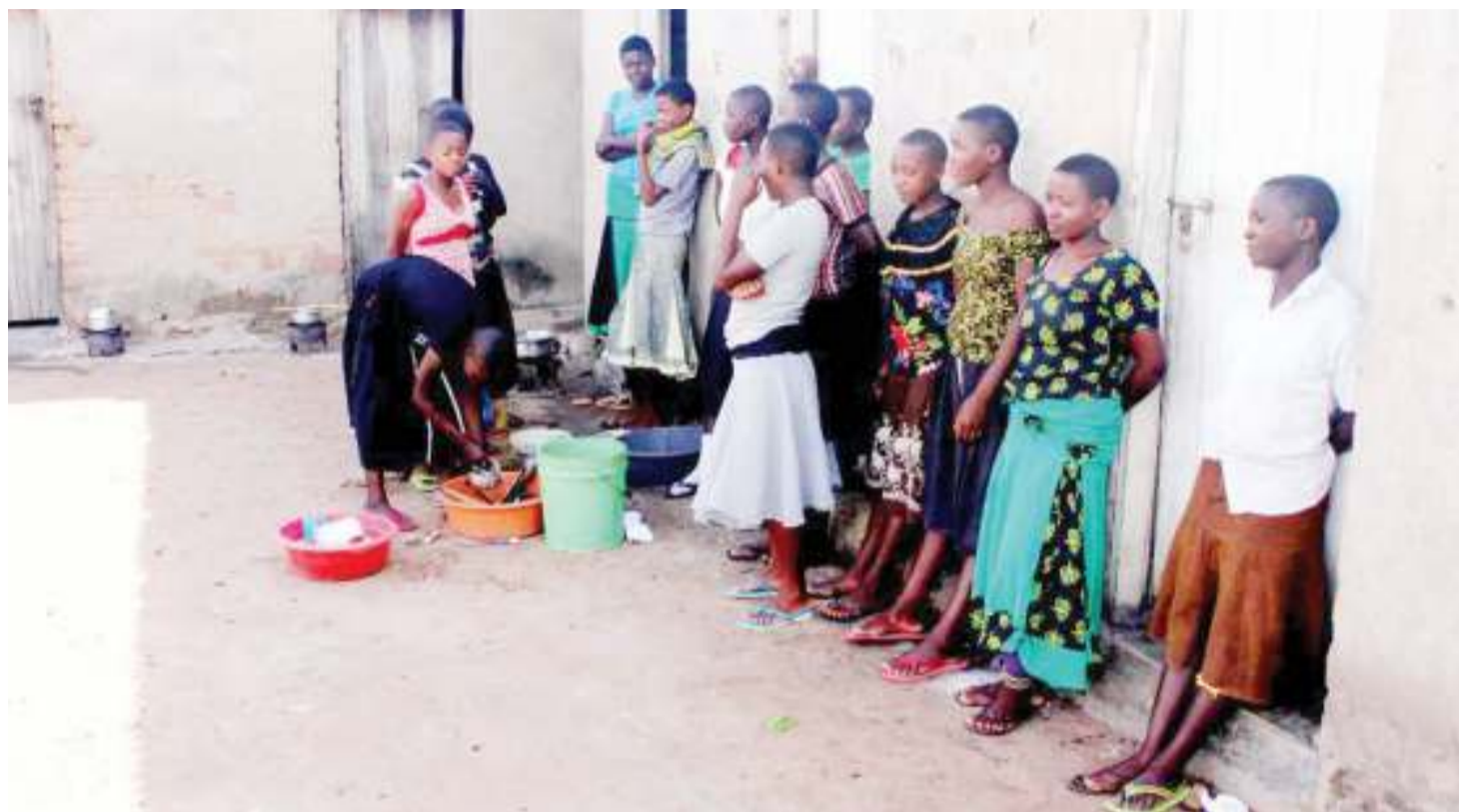
Baadhi ya wasichana wa Shule ya Sekondari Kachwamba wilayani Chato, wakiwa kwenye 'magero' yao.