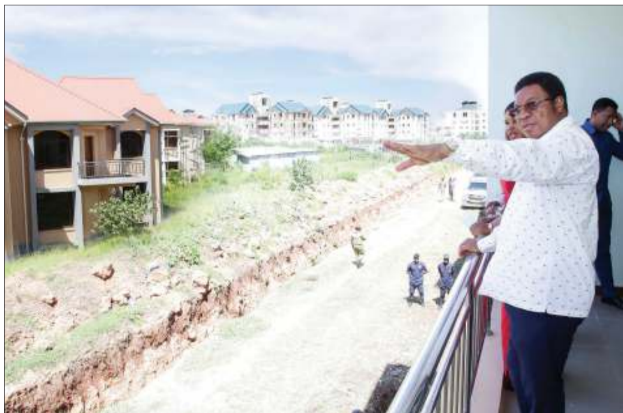
Waziri Mkuu, Kassim Majaliwa akikagua mradi wa nyumba za NSSF, zilizo zote Tuangoma katika Wilaya ya Kigamboni, jijini Dar es Salaam jana.