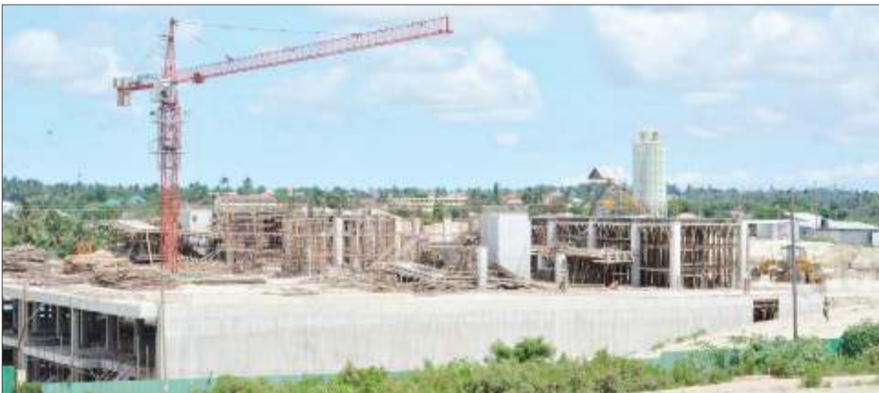
Mafundi wakiendelea na kazi ya ujenzi wa stendi mpya ya mabasi ya mikoani katika eneo la Mbezi Mwisho, jijini Dar es Salaam jana.

Baada ya mradi kukamilika ulitangazwa kwa watumishi walianza taratibu za kununua nyumba hizo na mtumishi mwenye umri mdogo kulipa kwa muda usiozidi miaka 25.