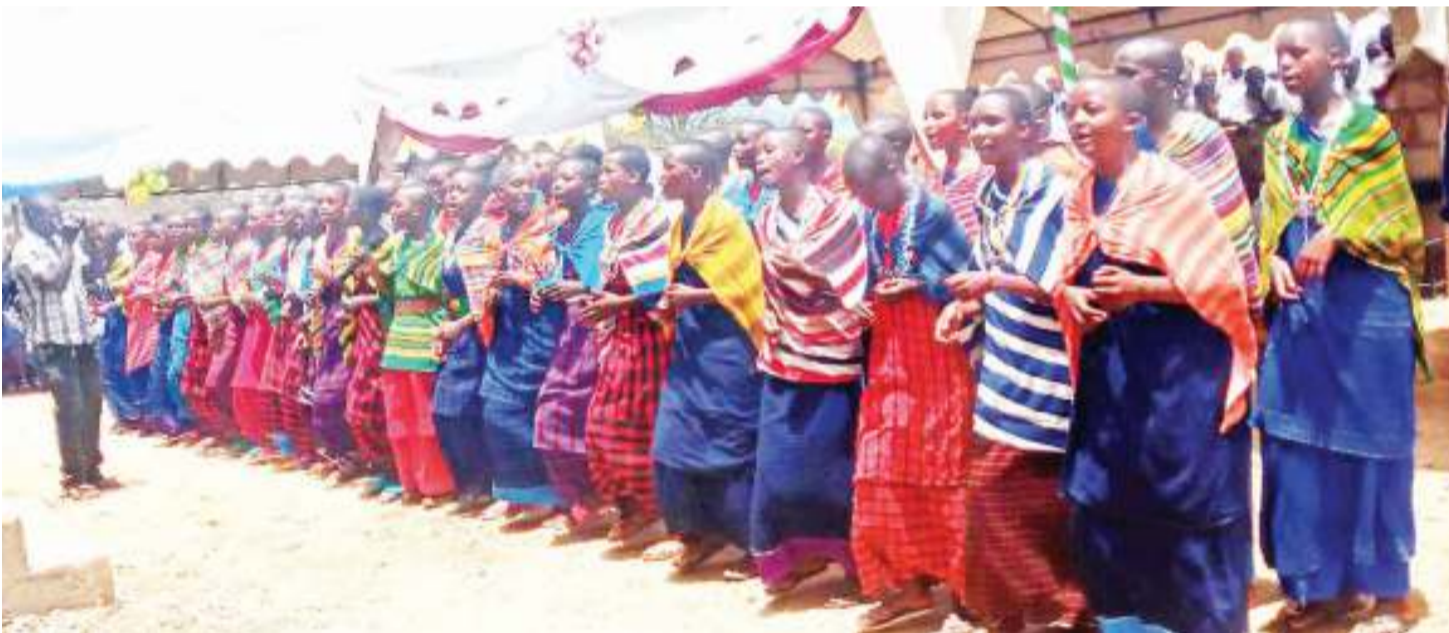
Wanafunzi wa Shule ya Wasichana Lekule, katika Kata ya Lumbwa, Longido wakiimba nyimbo zenye maudhui ya kukemea ukeketaji na ndoa za utotoni, kwenye mahafali ya tano ya kidato cha nne mwaka huu.

Nipashe imebaini kwamba katika kuhofia mikono ya sheria, wakazi wake sasa wanawakeketa watoto wachanga, kukwepa mikono ya sheria serikalini na wanaharakati, wanajamii na wanaopinga vitendo hivyo.