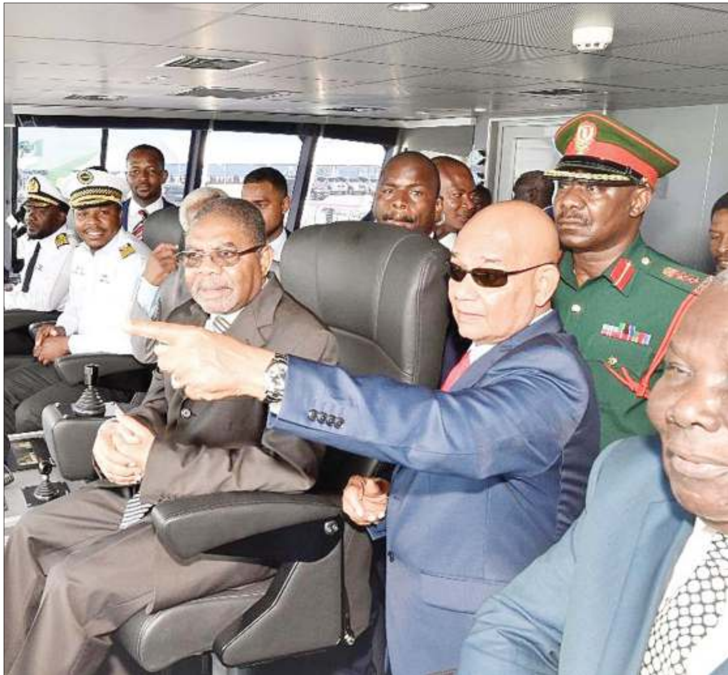
Rais wa Zanzibar Dk. Ali Mohamed Shein, akimsikiliza, Mwenyekiti wa Makampuni ya Kilimanjaro Fast Ferries na Azam Marine Said Salim Bakhressa wakiwa katika chumba cha kuongozea boti hiyo ya Kilimanjaro VII baada ya kuizindua jana.

"Wajumbe wa Baraza la Wawakilishi napenda kuwajulisha wajumbe kwamba miswada mitatu ya sheria iliyopitishwa na wajumbe sasa ni sheria kamili baada ya kutiwa saini na Rais wa Zanzibar na Mwenyekiti wa Baraza la Mapinduzi," alisema.