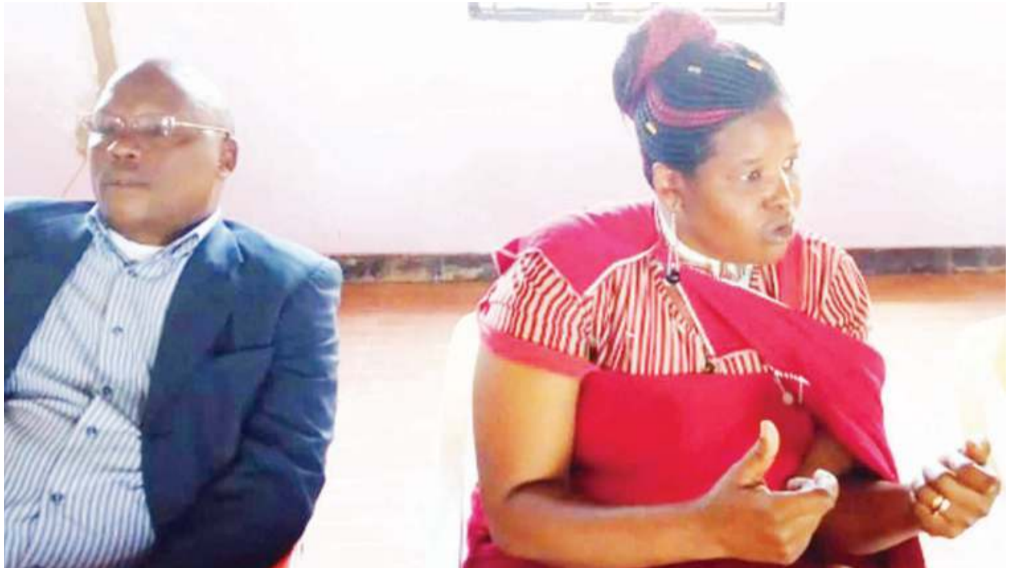
Ofisa wa Shirika la Tembo Trust, akizungumzia kuwanyima wajawazito mlo sahihi kunavyosababisha utapiamlo wilayani Longido, Arusha.

Ofisa Ustawi Jamii, anasema aliendelea kufuatilia hali ya binti huyo hadi alipopokea taarifa ya kifo chake, akiacha mto-