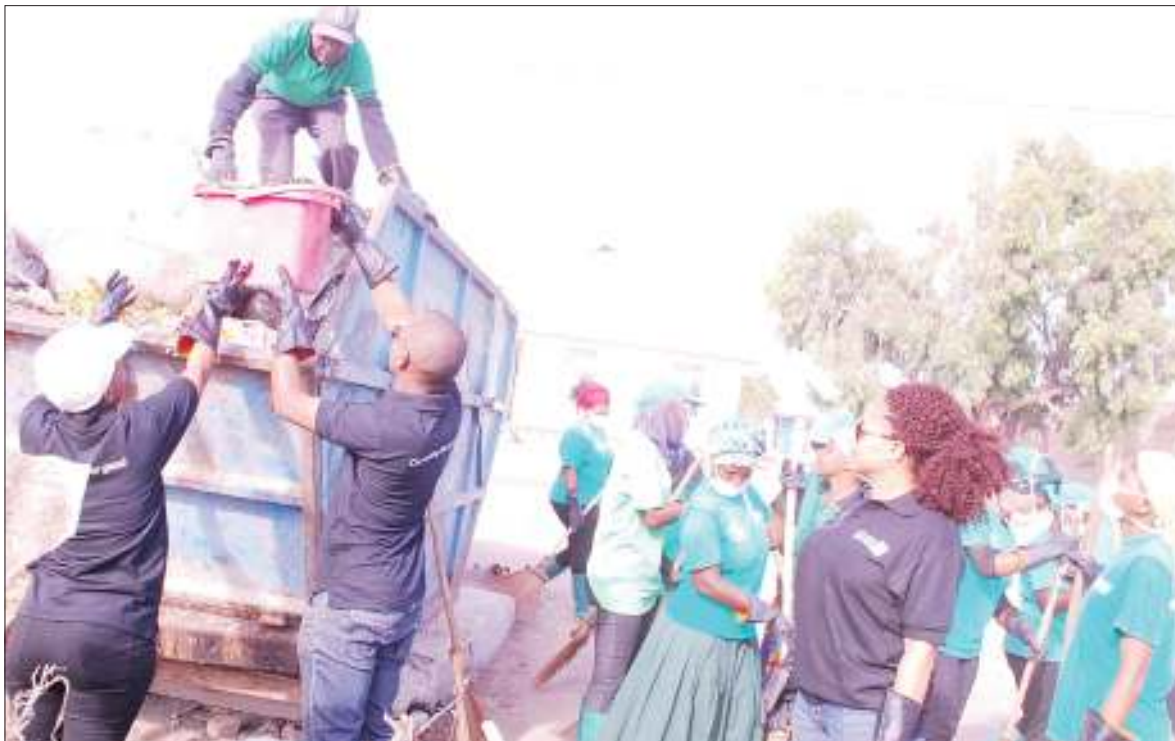
Wafanyakazi wa Shirika la Maendeleo (WWF) na Vodacom Tanzania Foundation wakishiriki zoezi la usafi lililofanyika eneo la Chang'ombe jijini Dodoma jana.

Mkutano huo wa siku mbili umeandaliwa na Shirika la Kuendeleza Kilimohai Tanzania (Toam) na washirika wake, ukiwezesha na Shirika la Chakula la Umoja wa Mataifa (FAO) na Ubalozi wa Ufaransa nchini.