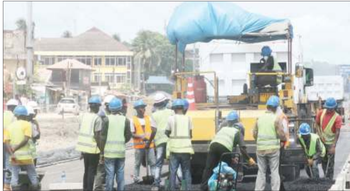
Mafundi wa kampuni ya ujenzi ya Bomag, inayofanya upanuzi wa barabara ya Bagamoyo, kutoka Morocco hadi Mwenge, wakiweka lami jana.

Alitoka wito kwa wazazi kuwaruhusu watoto wao kushiriki katika kinyang'iro hicho huku akiwatoa hofu kuwa mashindano hayo si uhuni kama wengi wanavyoyachukulia.