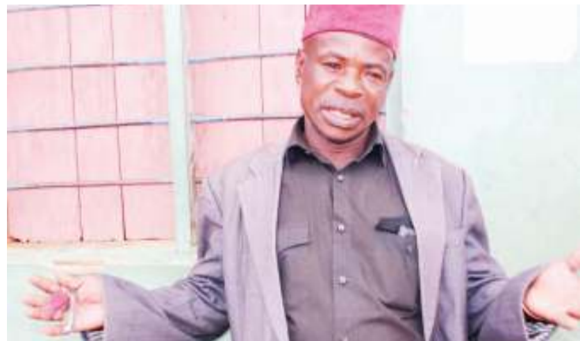
Mwenyekiti wa Kijiji cha Igalula, wilayani Chato mahali iliko Shule ya Sekondari Kachwamba, Makoye Butondo, akifafanua ilivyo mikasa hiyo.

"Tatizo jingine, wazazi wetu huwa hawaji hata kututembelea na hawajui mtoto wao wanaishi katika mazingira gani, yeye ni kuruhusu tu kwenda kupanga na kutuma chakula pamoja na pesa ya matumizi, lakini hawafuatilii maendeleo ya shule na mwisho wa siku anashangaa mtoto wake anarudi na ujauzito," anasema.