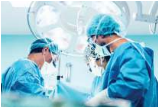
Upasuaji wa mgonjwa mwenye figo kubwa ulipofanyika.