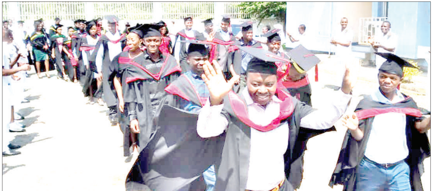
Wahitimu wa Stashahada ya Uuguzi na Uofisa Tabibu wa Chuo cha Kijeshi cha Sayansi na Tiba, wakiwa kwenye maandamano ya mahafali ya pili ya chuo hicho, yaliyofanyika Lugalo, jijini Dar es Salaam jana.

“Tulianza kutoa mafunzo haya kwa maaskari, lakini baadaye tukapanua wigo kwa raia nao kujiunga na chuo hiki na hivi sasa ni kama nusu kwa nusu kuna wanafunzi ambao ni wanajeshi na wengine raia,” alisema.