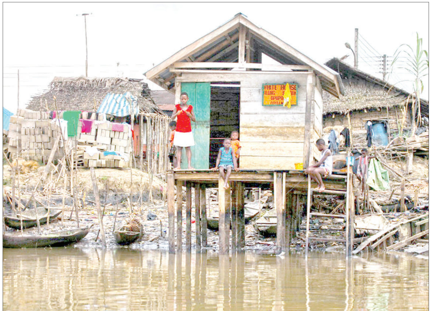
Baadhi ya makazi ya wanavijiji wa jimbo la Delta nchini Nigeria. Licha ya sehemu hiyo kuwa na mafuta mengi Afrika, wananchi ni fukara kupindukia.

Suala la nidhamu ya matumizi ya fedha za umma ni muhimu zama hizi na linahitaji kupewa kipaumbale cha kipekee. Kupambana na