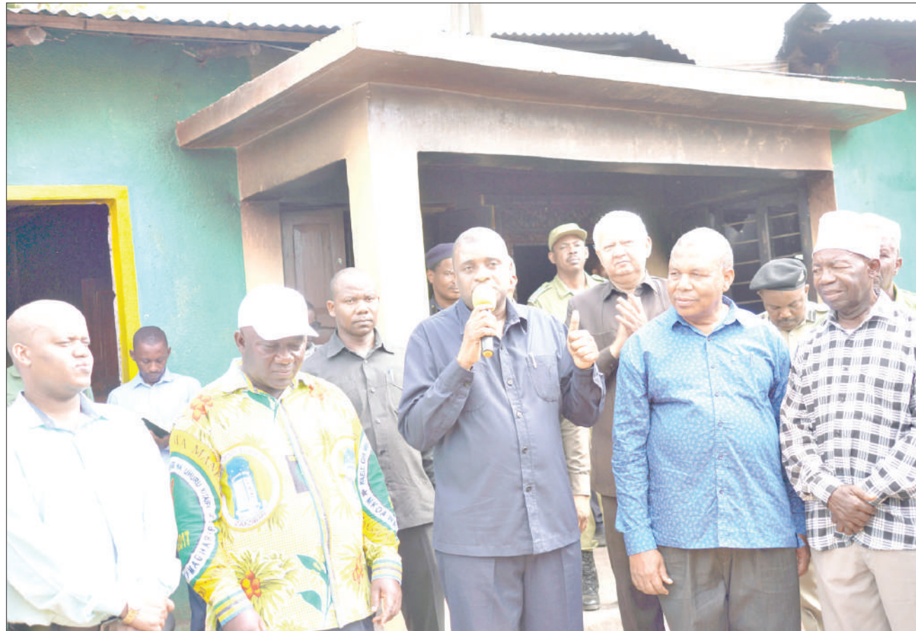
Makamu wa Pili wa Rais wa Zanzibar, Hemed Suleiman Abdulla (katikati), akiwafariji viongozi na wanachama wa Chama Cha Mapinduzi (CCM), Wilaya ya Kusini jana, kutokana na jengo la ofisi za chama hicho, kuungua kwa moto.

Alisema CCM inawaunga mkono viongozi wakuu wa serikali akiwamo Makamu wa Kwanza wa Rais, Maalim Seif Sharif Hamad, kwa kuonyesha uungwana na hatua yake ya kuungana katika serikali ya umoja wa kitaifa na kuwaomba wafuasi wake kumuunga mkono katika kuendelea serikali hiyo.