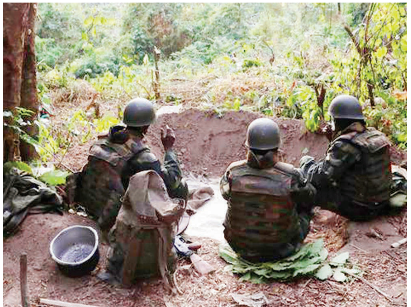
Baadhi ya wanajeshi wa Congo wakiwa msituni kuwasaka waasi wa ADF ambao wameongeza vitendo vya mauaji kwa raia. PICHA: DW

Katika kituo kimoja mtu mmoja alitoroka na sanduku la kura. BBC