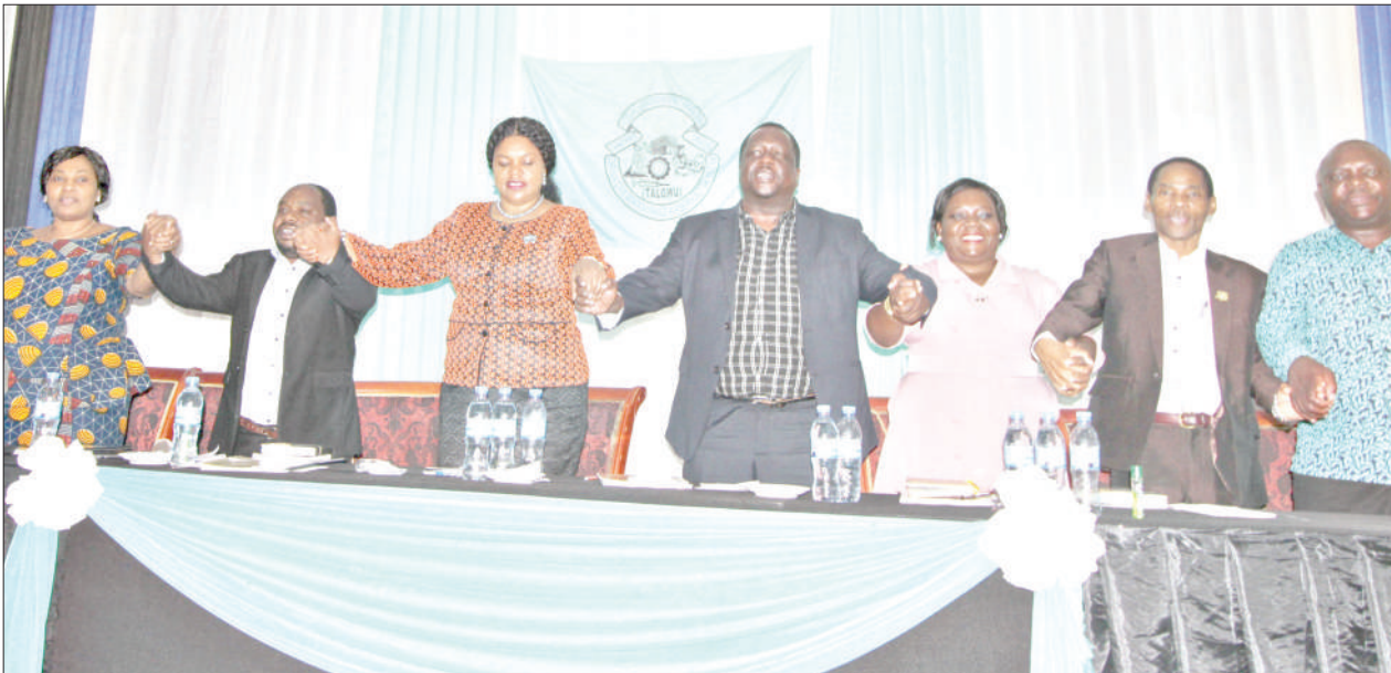
Waziri wa Nchi, Ofisi ya Waziri Mkuu (Kazi, Sera, Bunge, Ajira, Vijana na Watu wenye Ulemavu), Jenista Mhagama (wa tatu kushoto), akiwa ameshikana mikono na viongozi wa kitaifa wa Chama cha Wafanyakazi wa Serikali za Mitaa Tanzania (TALGWU), wakiimba wimbo wa mshikamano, wakati wa ufunguzi wa kikao cha Baraza Kuu la chama hicho Taifa, jijini Dodoma jana.

"Suala hili limekuwa ni kero hasa baada ya kuunganishwa kwa mifuko ya hifadhi ya jamii, hivyo tunakuomba waziri utusaidie kuziagiza mamlaka husika kutatua suala hili ili watumishi walipwe mara baada tu ya kustaafu kwa mujibu wa sheria," alisema Kibwasali.