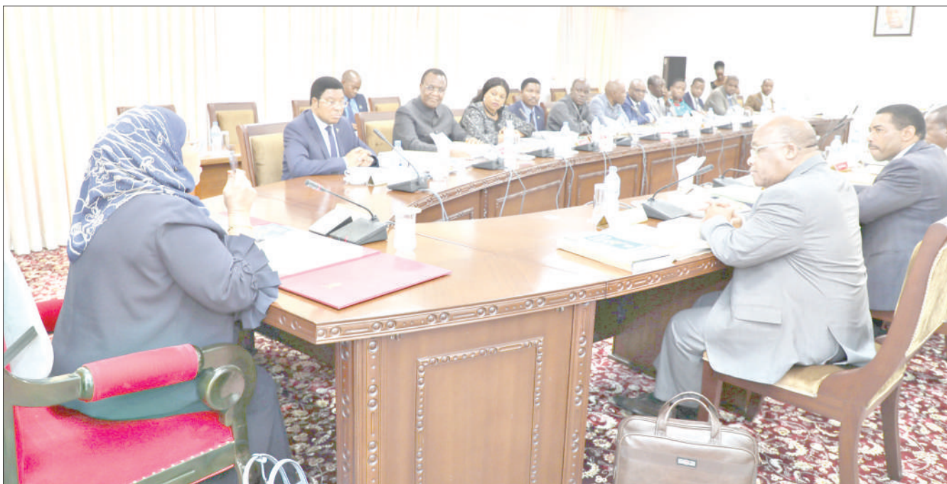
Makamu wa Rais, Samia Suluhu Hassan, akiongoza kikao cha Baraza la Mawaziri Ikulu Chamwino, jijini Dodoma jana.