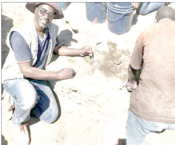
Baadhi ya wataalamu wakichimbua masalia ya zana za mawe za kale.