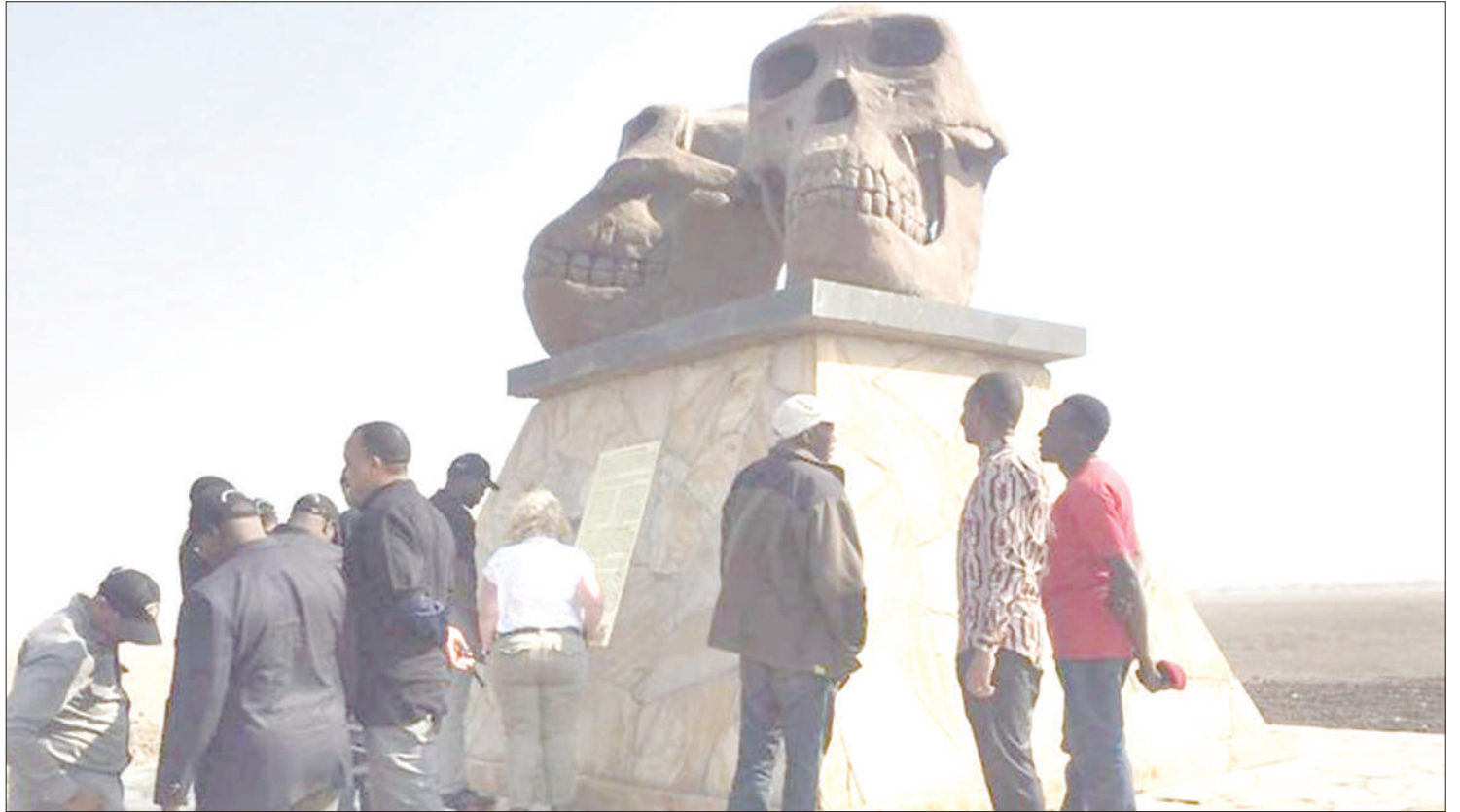
Bonde la Olduvai limekuwa kiini cha utafiti wa chimbuko la binadamu duniani.

Watafiti hao wanasema waligundua uwepo wa viashiria vipya vya maisha ya mwanadamu katika eneo