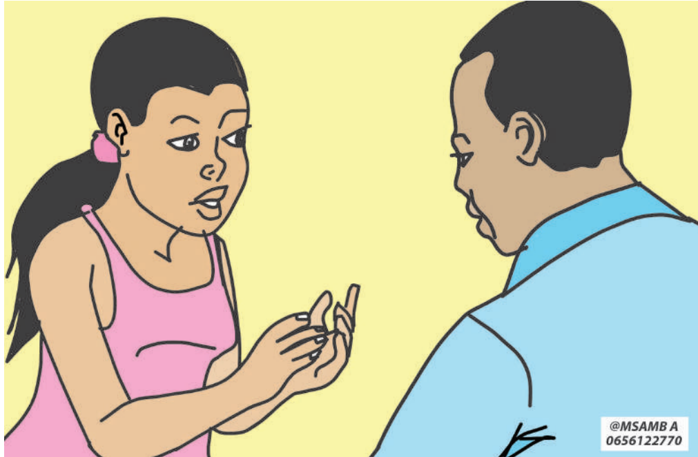
@MSAMB A 0656122770