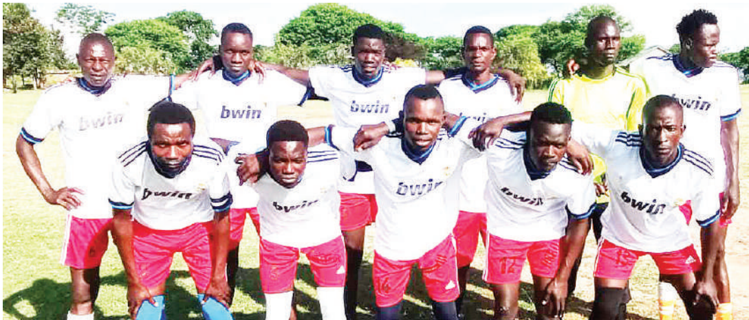
Kikosi cha Bubombi FC kinachotarajiwa kushuka katika Uwanja wa Maji Shirati Sota kuvaana na Kabwana FC kusaka nafasi ya mshindi wa tatu wa michuano ya Umoja Cup Rorya 2023.