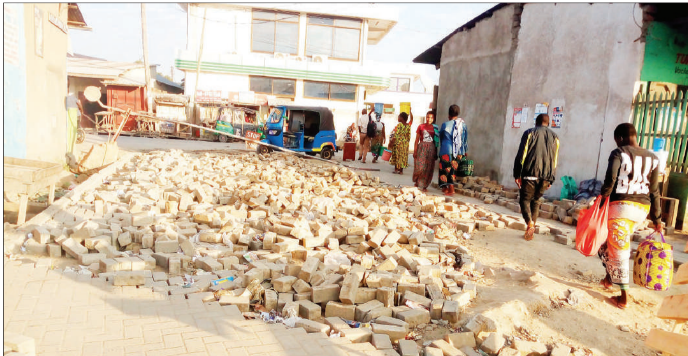
Baadhi ya wananchi wakipita sehemu ya lango kuu la stendi ya mabasi ya Mamlaka ya Mji Mdogo wa Mbalizi Tarafani, mkoani Mbeya jana, ambayo inafanyiwa ukarabati licha ya kuwa na mwezi mmoja tangu ilipokamilika na kuanza kutumika.