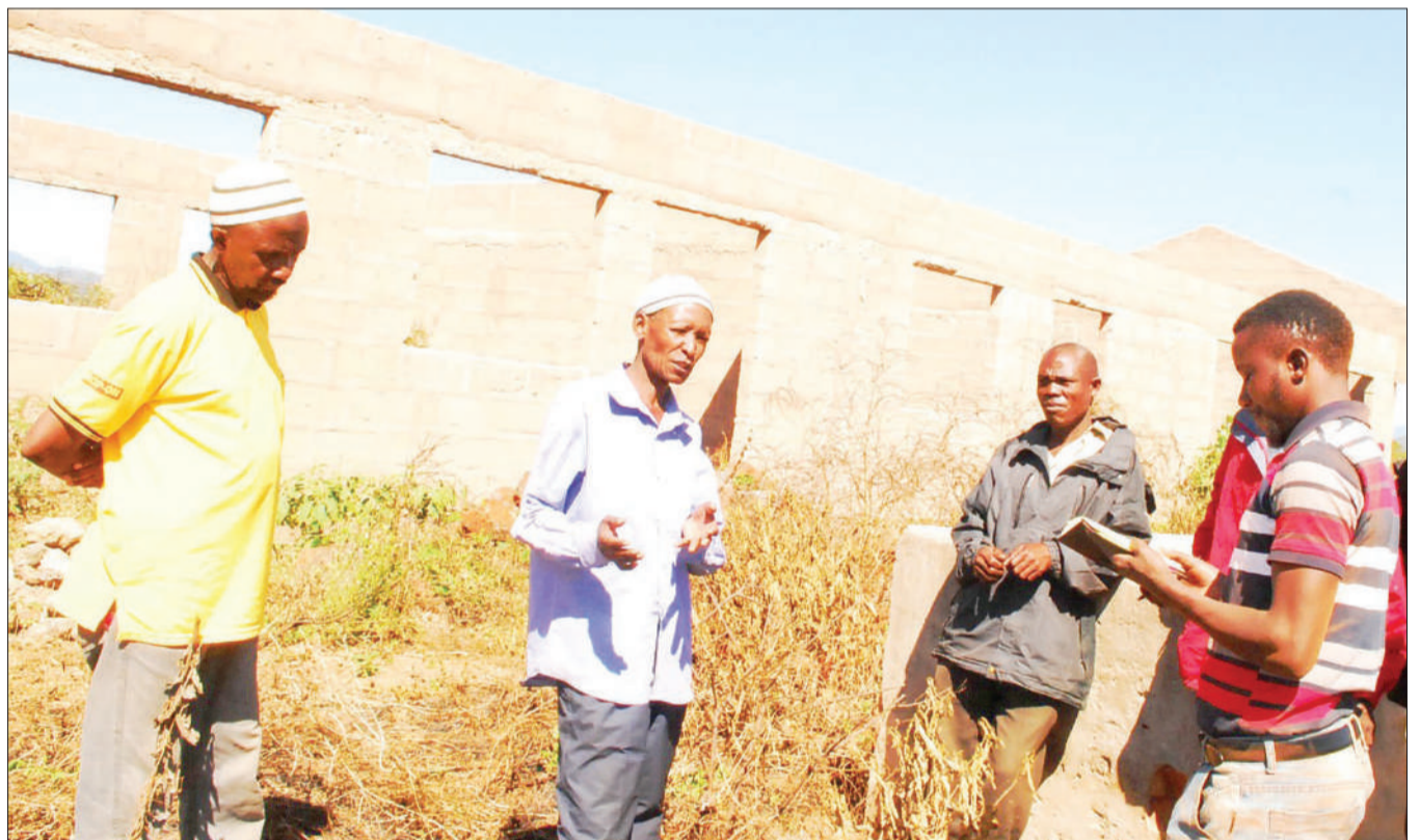
Wakazi wa Kitongoji cha Bwawani, Kijiji cha Ngwandi, wilayani Chamwino, Mkoa wa Dodoma, wakitoa ufafanuzi kwa waandishi wa habari kuhusu jengo la shule (pichani), lililojengwa kwa nguvu kazi, ambalo limeshindwa kupauliwa zaidi ya miaka minne.

Pia alisema wanaendelea kutoa tiba kwa wengine ambao wanajihusisha na dawa za kulevya, ili waache na kuwa mfano kwa wengine ambao wanaendelea kutumia dawa hizo.