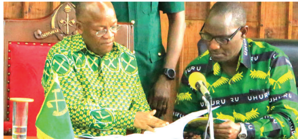
Katibu Mkuu wa Chama Cha Mapinduzi (CCM), Dk. Bashiru Ally, akikagua fomu za mgombea pekee wa urais aliyomba kupitia chama hicho ambaye ni Rais na Mwenyekiti wa CCM Taifa, Dk. John Magufuli, kabla ya kuzipokea katika Ofisi za Makao Makuu jijini Dodoma jana.

"Atakayekiuka kanuni, Mzee Mangula yupo hapa na mimi nipo nyuma yake, tunahitaji ushindani wenye utulivu, wa kistaarabu, wa kiCCM na matarajio tuta-pata wagombea wazuri wa kushindana na vyama vingine," alisema.