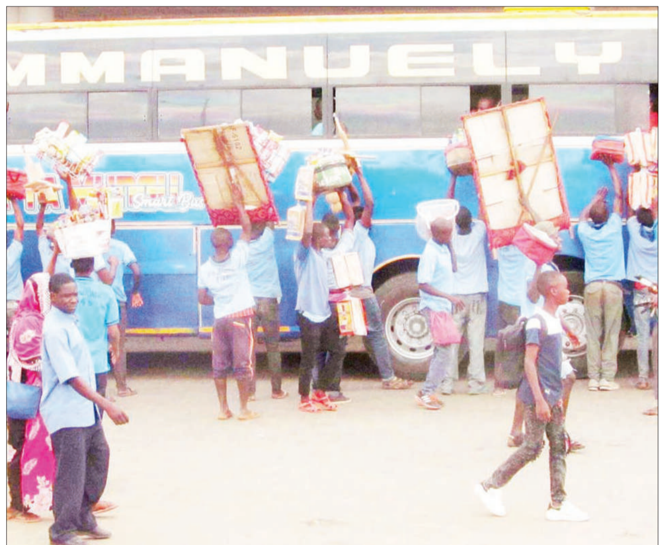
Wafanyabiashara wadogo wenye sare wakisaka wateja katika basi, stendi kuu ya mabasi Msamvu Mjini Morogoro mwishoni mwa wiki. Walisema sare zinawafanya watambuliwe na uongozi wa stendi hiyo.

Itakapokamilika, barabara hiyo itaunganisha mikoa ya Tanga, Morogoro na Iringa bila kupita mbuga ya wanyama ya Mikumi na hivyo kupunguza ajali katika mbuga hiyo.