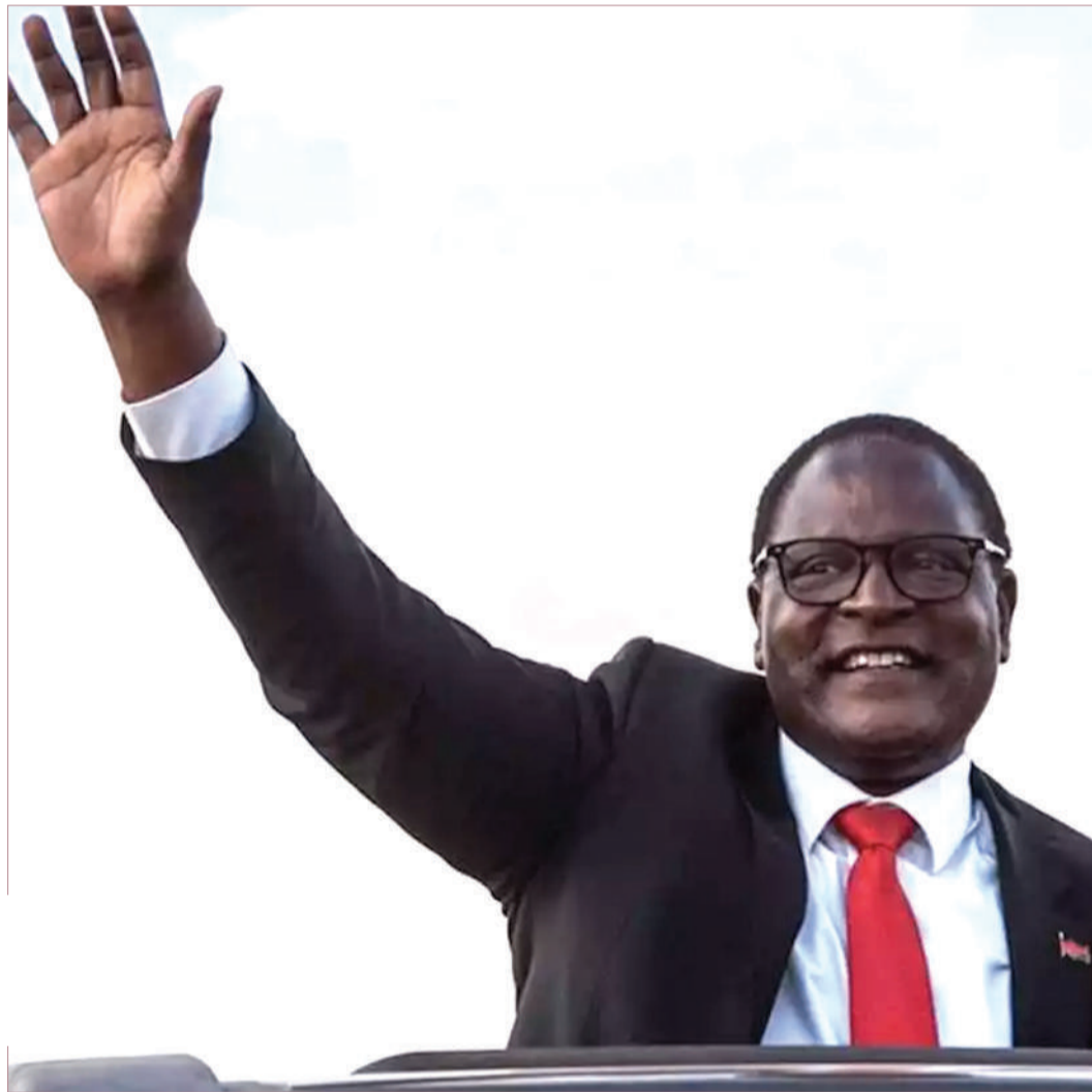
Rais Lazarus Chakwera.

Rais huyo mpya wa Malawi anayezungumza Kiingezera cha lafudhi ya Kimarekani anasema anapenda kusoma na muziki wa kiasili, wa kigeni na nyimbo za