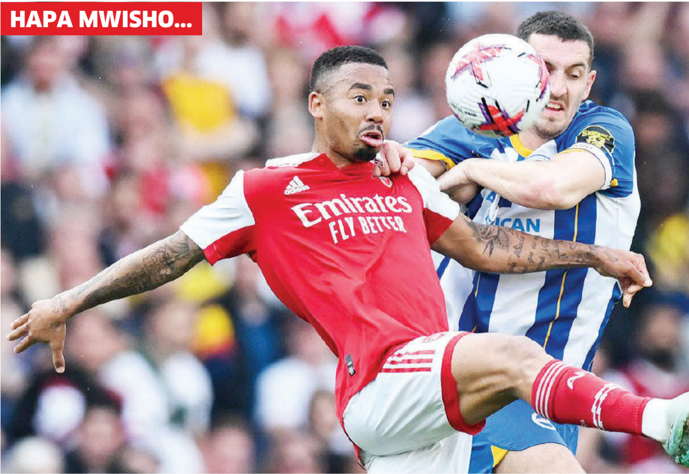
Beki wa kati wa Brighton, Lewis Dunk, akimdhiti mshambuliaji wa Arsenal, Gabriel Jesus (kushoto), kwenye mechi ya Ligi Kuu England iliyopigwa Uwanja wa Emirates juzi usiku na kumalizika kwa wageni hao kushinda mabao 3-0.