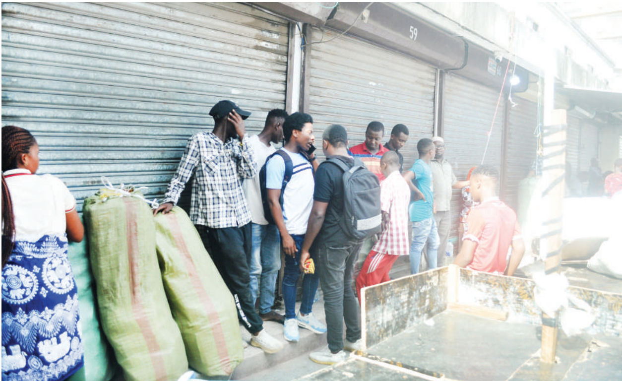
Baadhi ya wafanyabiashara wa Soko la Kariakoo wakiwa nje ya maduka yao kutokana na mgomo ulioitishwa jana jijini Dar es Salaam.

• Waziri Mkuu aacha kikao cha Bunge kuwawahi, atoa maagizo matatu... Endelea ukurasa 2