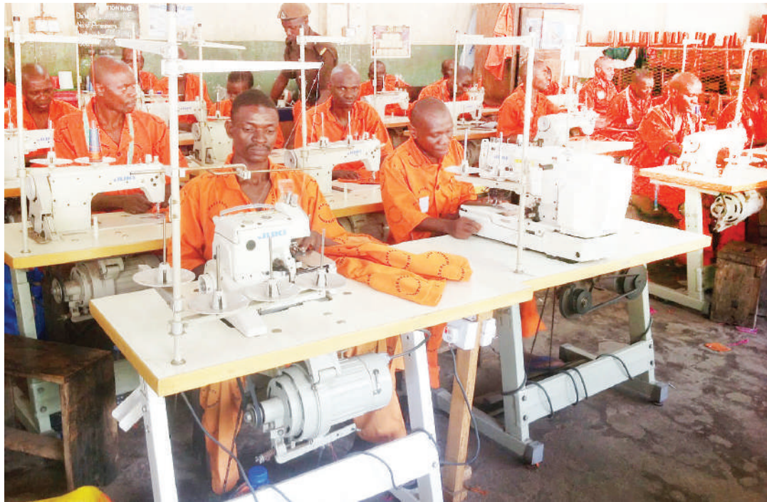
Baadhi ya wafungwa wakishona nguo za aina mbalimbali. Katika kurekebisha tabia wanaweza kutumikia adhabu ndani au nje ya gereza.

Hapa mshtakiwa anatakiwa kulipa faini na kutumikia adhabu gerezani kwa pamoja, kushindwa kulipa faini kunaweza kusababisha aliyekutwa na hatia kuongezewa muda wa kifungo