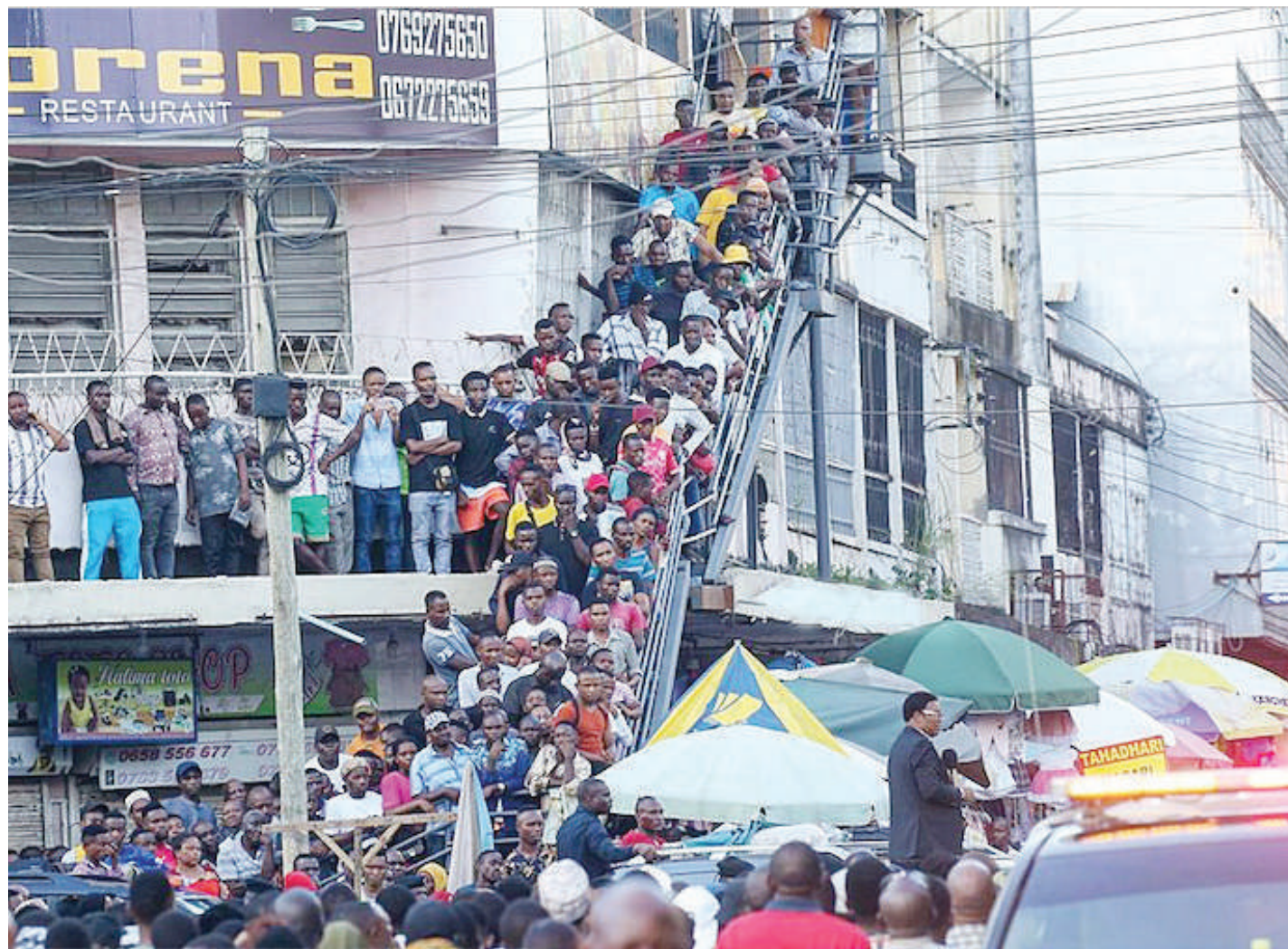
Waziri Mkuu, Kassim Majaliwa, akiongea na wafanyabiashara wa Kariakoo