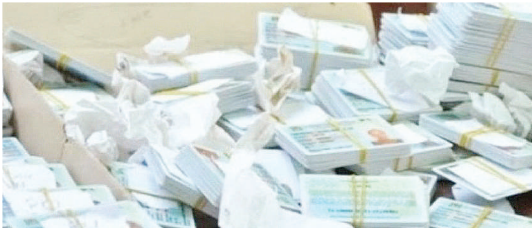
Vitambulisho vya Taifa.

Tengeneza anasema katika eneo la usajili na utambuzi wa watu, kumekuwa na ongezeko kubwa la wananchi wanaohitaji huduma hiyo.