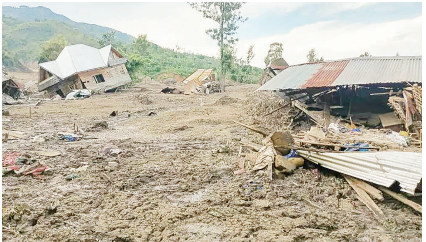
Nyumba zikionekana kudondoka na zingine kuharibiwa vibaya ikiwa ni moja ya madhara yaliyotokana na mafuriko yaliyoikumba DRC wiki iliyopita.