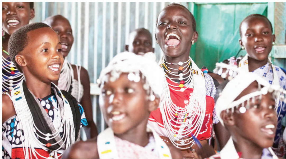
Mila na desturi zinazowafunza wasichana maisha ya unyumba na ukeketaji hukwamisha juhudi za kuendeleza elimu.

Mafunzo haya yanadaiwa kuwa na umuhimu mkubwa katika jamii hiyo huko Tunduru kwani lengo ni kutumika kumwonyesha msichana au mtoto wa kike kuwa tayari amekua, ana majukumu, hadhi na heshima iko juu na pia ana thamani kubwa mbele ya wanajamii wenzake.