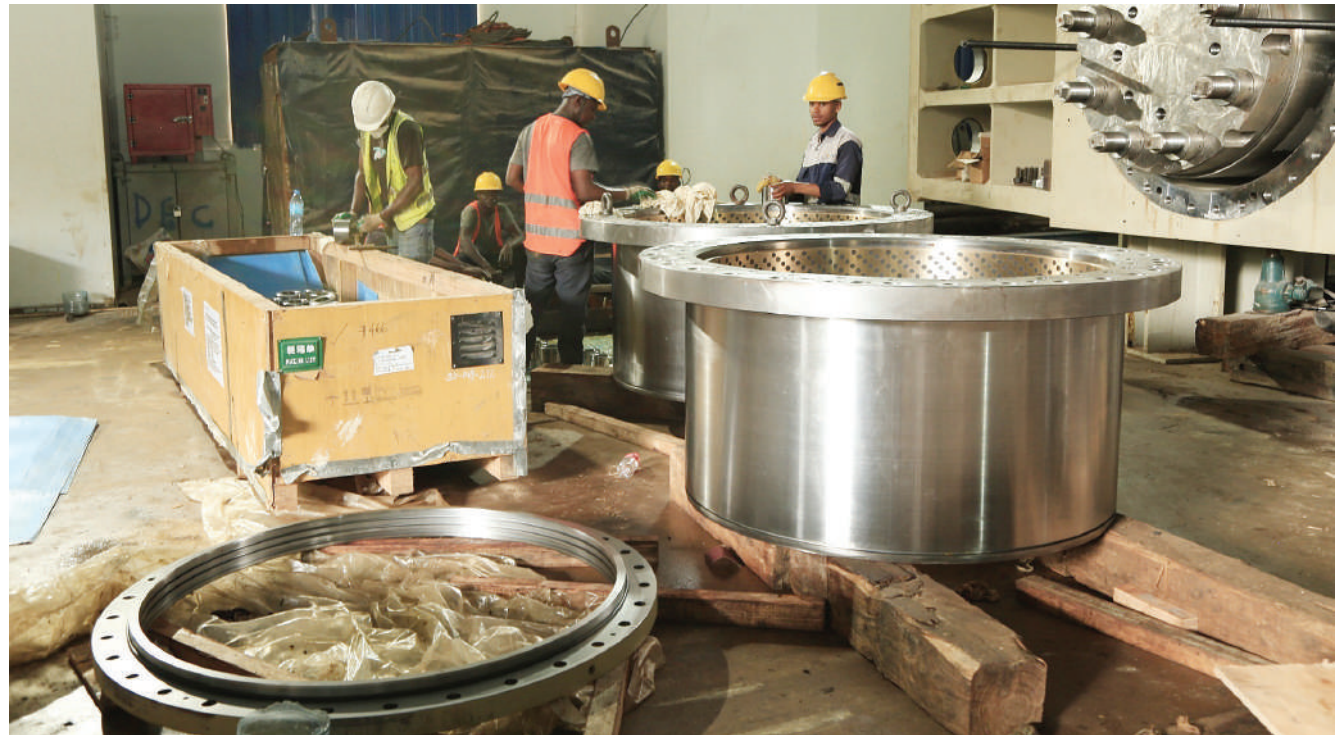
Wafanyakazi wakiendelea na kazi katika nyumba ya kuendesha mitambo ya kuzalisha umeme wa Julius Nyerere, wakati wa ziara ya wajumbe wa kamati ya usimamizi wa mradi huo ya kukagua maendeleo ya utekelezaji wa mradi husika mkoani Pwani juzi.