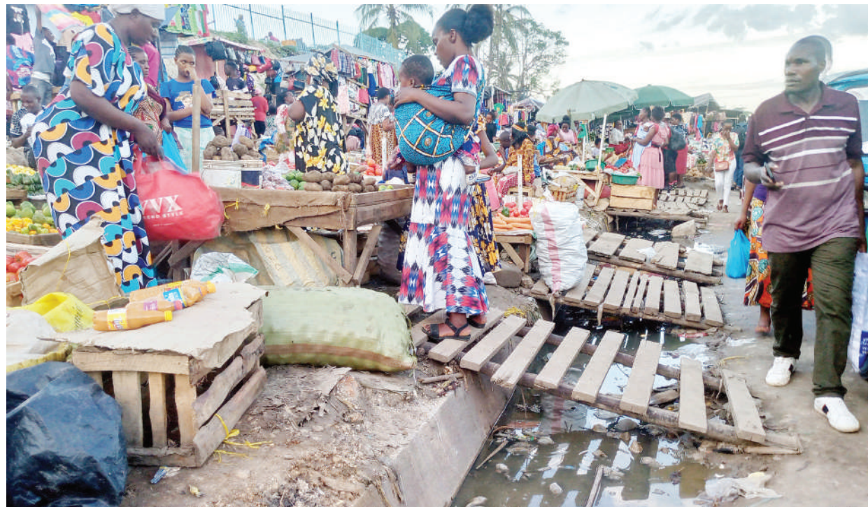
Wafanyabi-ashara wadogo wakiondoka na shughuli zao pembeni ya mtaro uliojaa maji machafu yanayotokana na mvua zinazoendelea kunyesha, Mbezi Mwisho Dar es Salaam jana.

*Imeandikwa na Moses Ng'wat (MBOZI) na Samson Chacha, (TARIME)