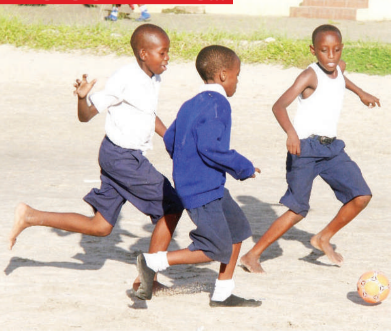
Wanafunzi wa Shule ya Msingi Lumumba, wakicheza mpira katika uwanja vya JMK Park jijini Dar es Salaam jana.