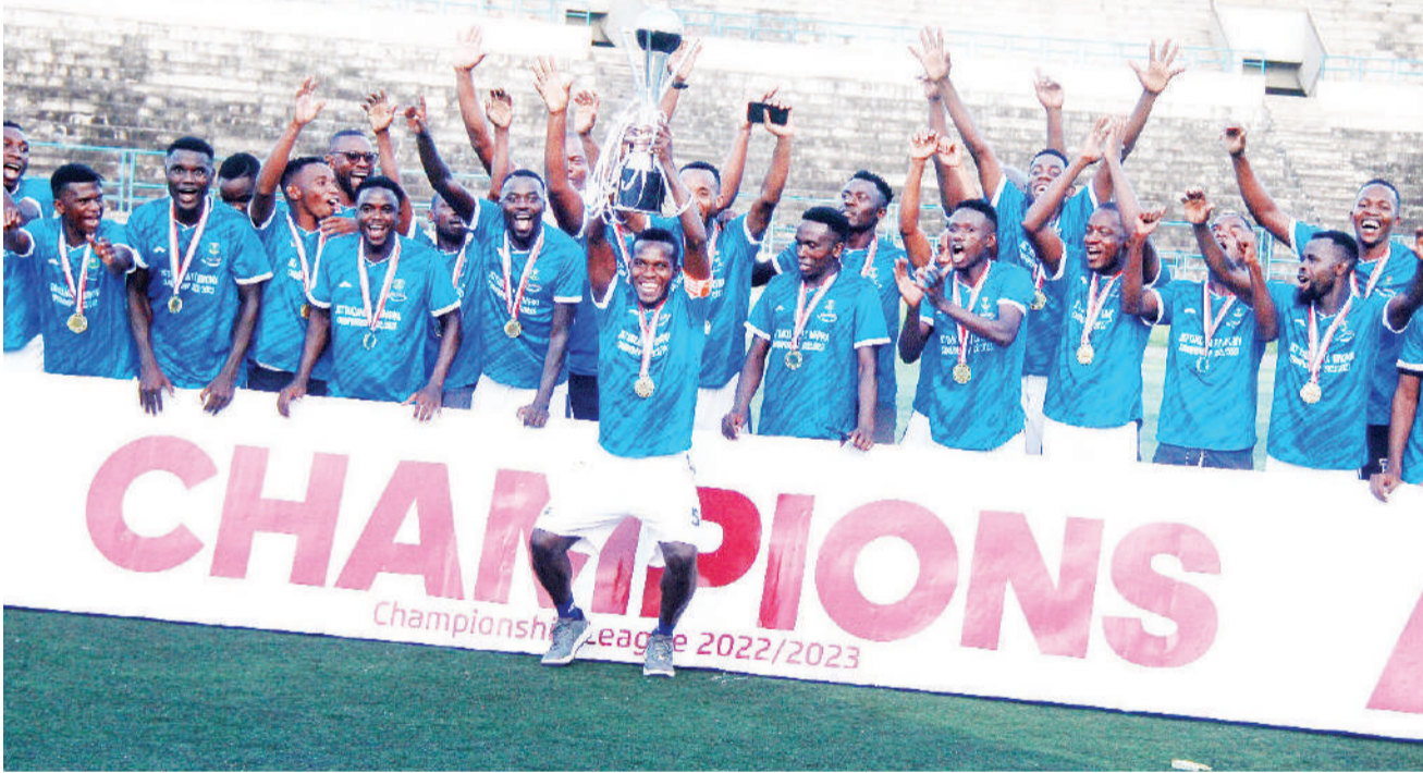
Wachezaji wa Timu ya JKT Tanzania, wakishangilia kwa kutwaa kombe kutokana na kuhitimisha Ligi ya Championship [Daraja la Kwanza Tanzania Bara] wakiwa kileleni baada ya juzi kutoka sare ya mabao 2-2 dhidi ya Transit Camp, katika mchezo uliopigwa Uwanja wa Uhuru, Dar es Salaam.