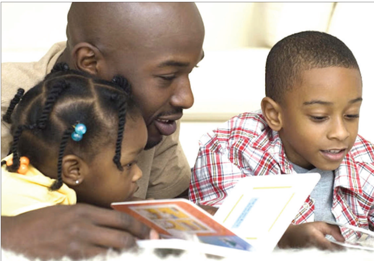
Mzazi akiwa na watoto akiwahamasisha kusoma vitabu.