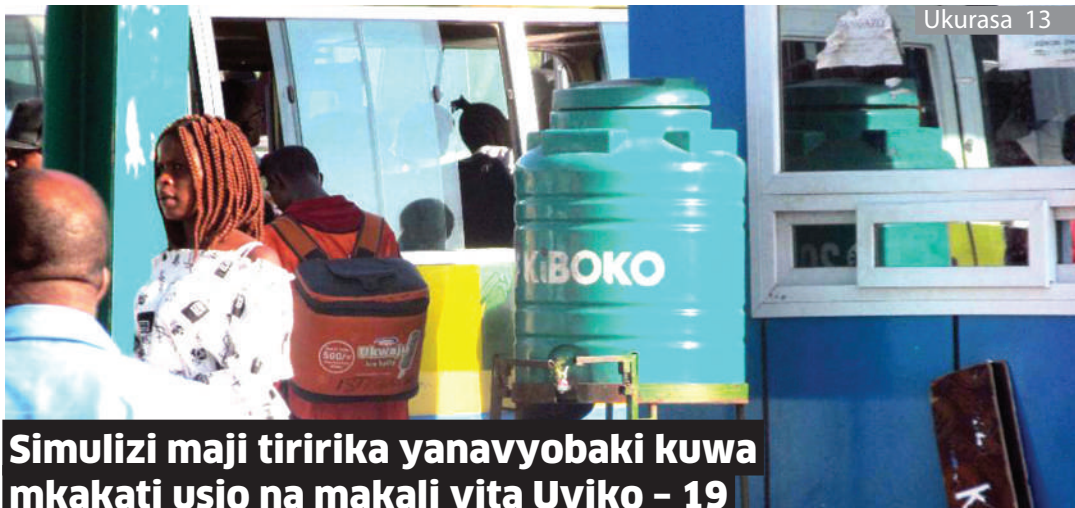
Simulizi maji tiririka yanavyobaki kuwa mkakati usio na makali vita Uviko - 19