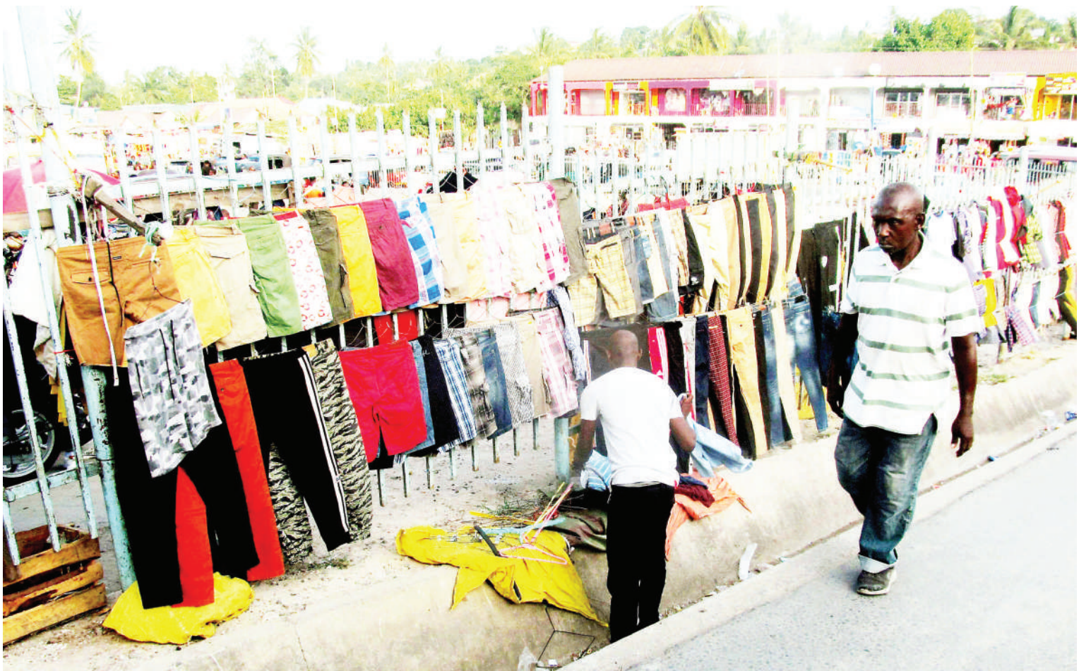
Wafanyabiashara wadogo maarufu machinga, wakiwa wametundika bidhaa zao kwenye uzio wa kituo cha daladala cha Mbezi Mwisho, Manispaa ya Ubungo, mkoani Dar es Salaam jana, licha ya serikali kuwaondoa katika maeneo hayo.