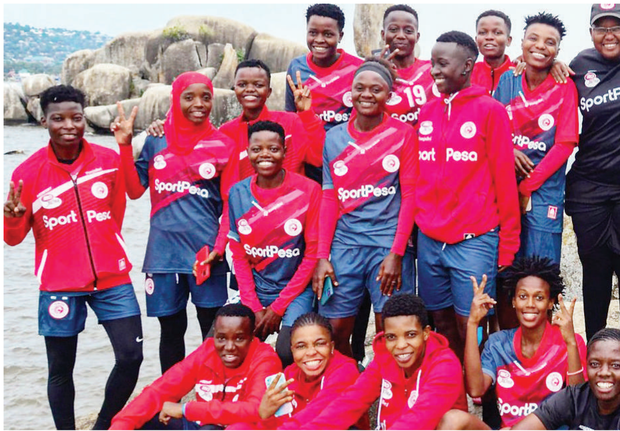
Wachezaji wa Simba Queens katika picha ya pamoja baada ya kumaliza mechi zao mbili za Ligi Kuu ya Wanawake Tanzania walizocheza na kupata pointi sita dhidi ya Alliance Girls na TSC Queens.