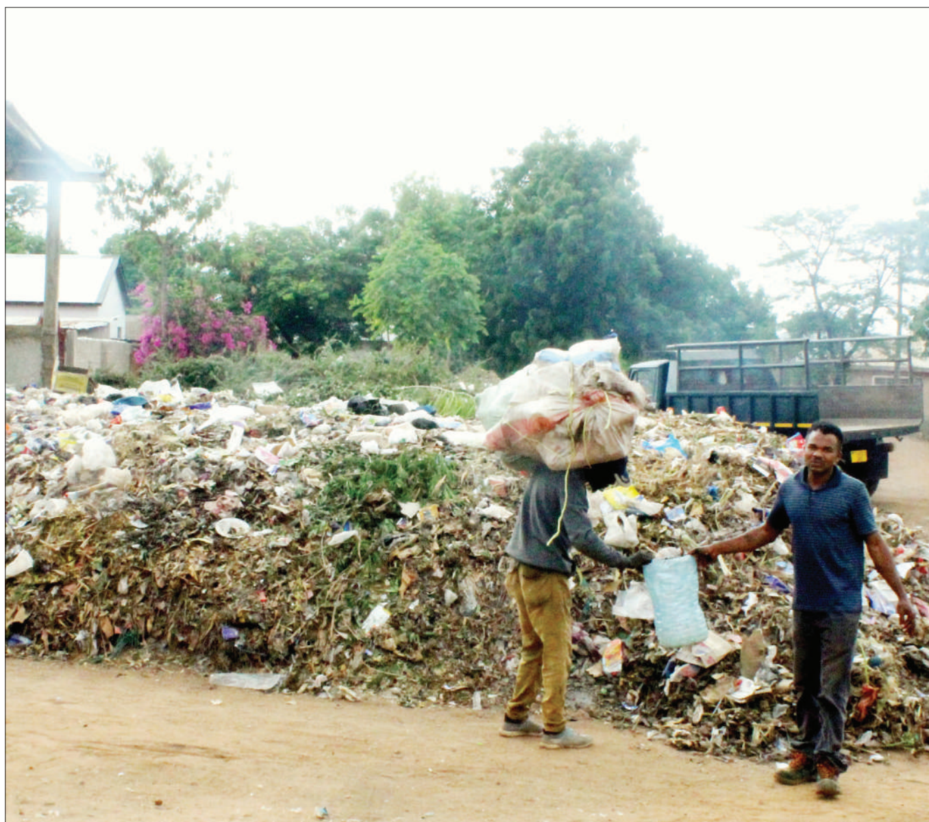
Rundo la takataka likiwa limetelekezwa bila ya kuzolewa katika Mtaa wa Mapinduzi, Kata ya Ndala, Manispaa ya Shinyanga jana na kutishia usalama wa afya za wananchi.