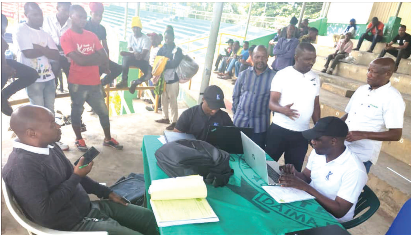
Wafanyakazi wa Yanga ya jijini Dar es Salaam wakiandikisha wanachama wapya na wazamani wa klabu hiyo kwa njia ya mtandao katika mchakato unaoendelea kwenye Uwanja wa Kumbukumbu ya Sheikh Amri Abeid jijini Arusha.

Alisema wanahitaji kupata pointi tatu muhimu ili wapande katika msimamo wa ligi hiyo na hatimaye kutimiza malengo ya kuwania ubingwa.