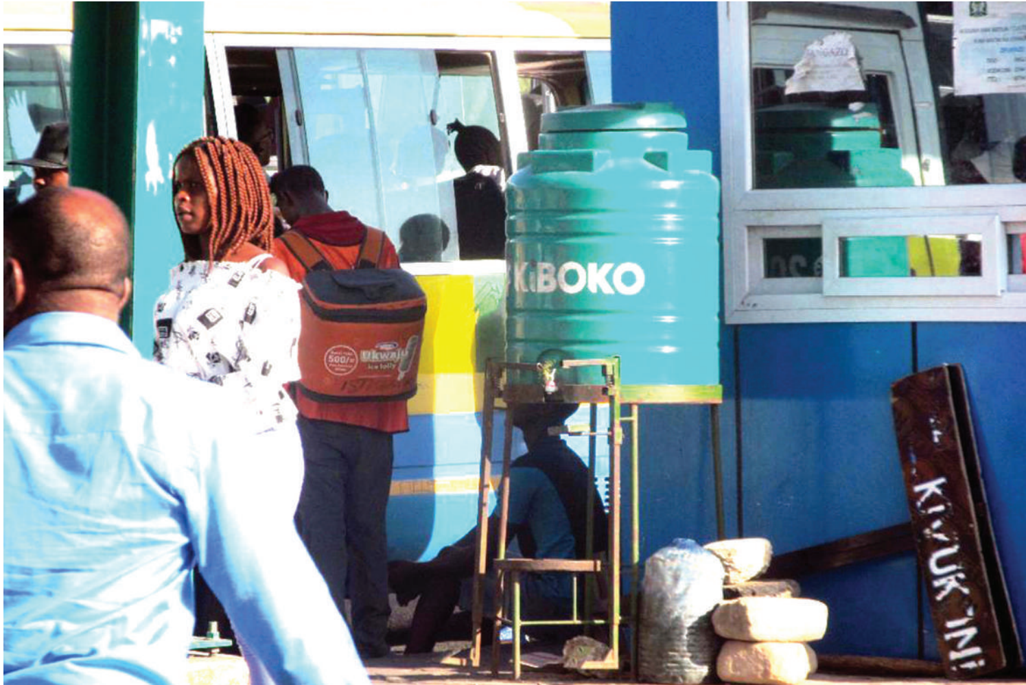
Tangi la maji katika Stendi ya Mabasi Mbezi Mwisho, jijini Dar es Salaam, ilivyo hivi sasa.

•Mtendaji mwendokasi adai 'ugonjwa wa wakubwa'