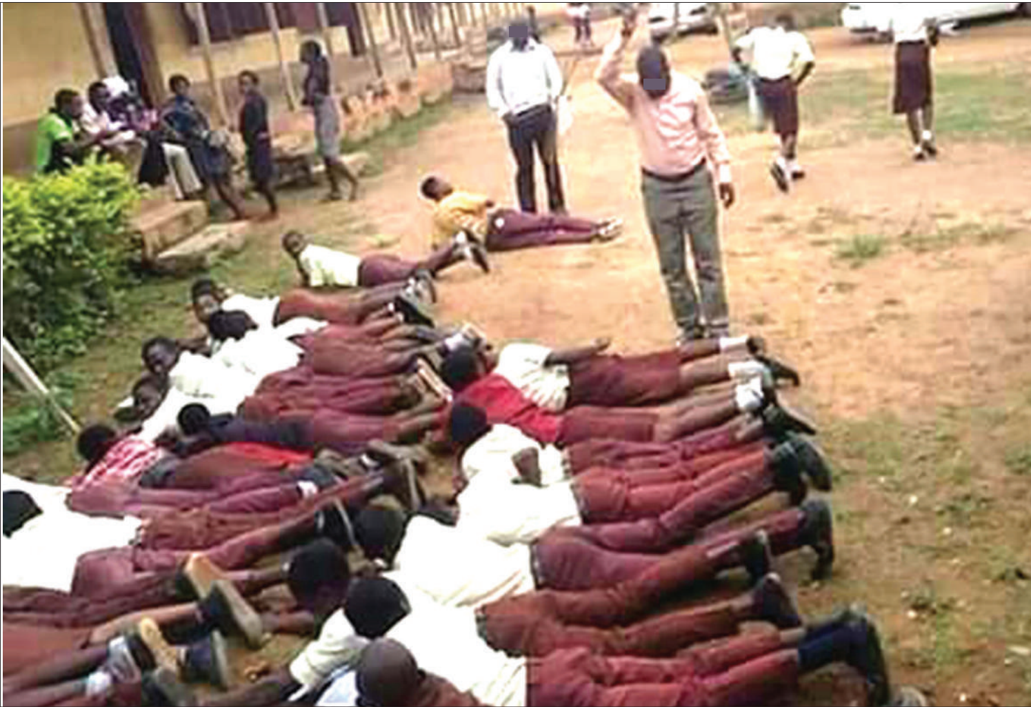
Watoto wakitandikwa viboko shuleni, sehemu ya adhabu zenye athari kwa afya ya mtoto. PICHA: MTANDAO.