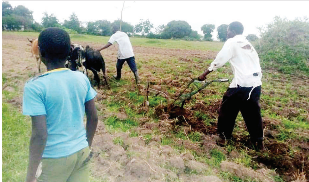
Wakulima wa Kijiji cha Rusoli, Musoma Vijijini, mkoani Mara, wakiandaa shamba lao juzi, kwa kutumia jembe la kukokotwa na ng'ombe (plau), ambalo kwa sasa hutumiwa na vikundi mbalimbali vya wakulima ikiwa ni mkakati wa kuachana na jembe la mkono.

"Tumepokea malalamiko mara kwa mara, lakini ilikuwa vigumu kuchukua hatua bila kuwa na uthibitisho, hivyo kwa tukio hili ni wazi tutaenda kuchukua hatua kali sana ili iwe fundisho kwa wale wote ambao wanashindwa kuheshimu sheria na taratibu."