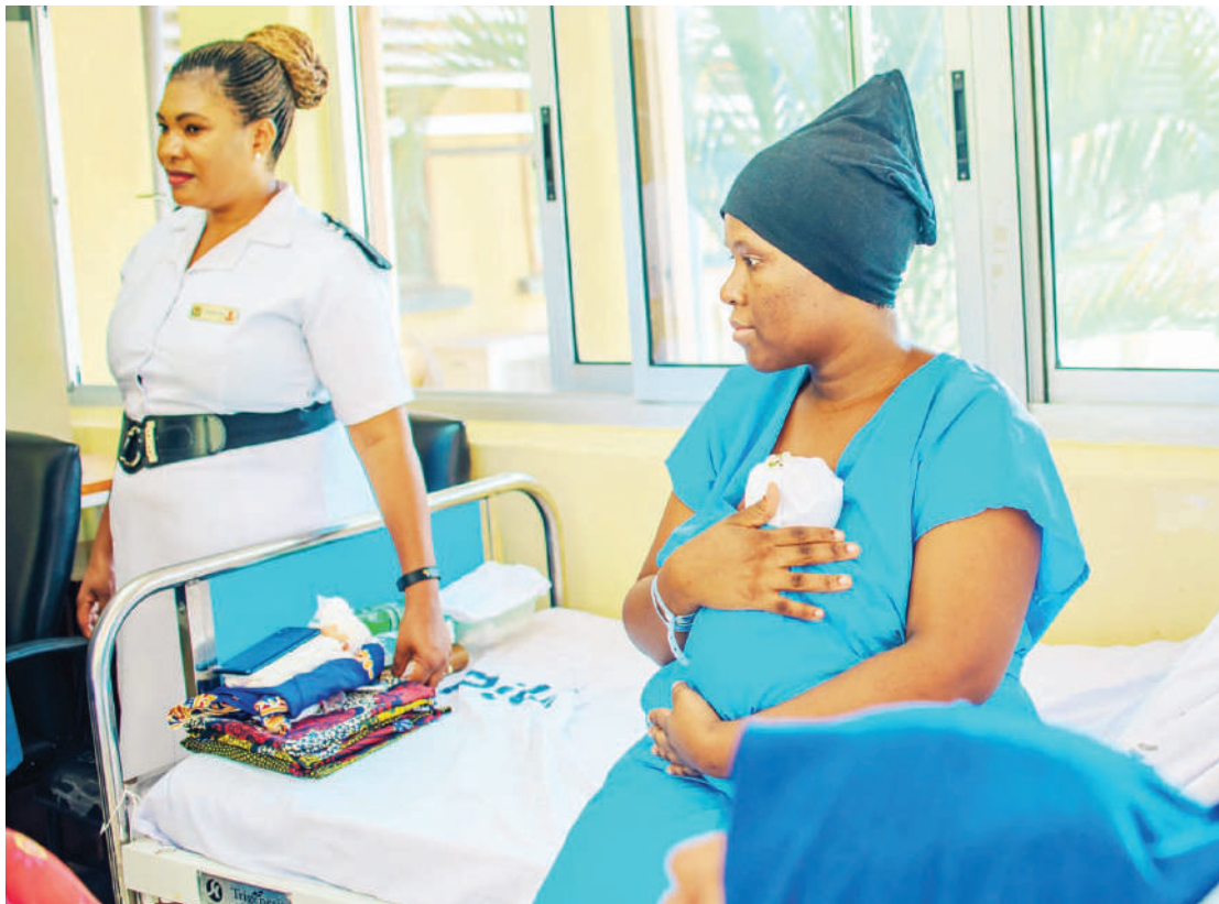
Mama wa njiti aliyeko katika Hospitali ya Taifa Muhimbili, Dar es Salaam.

Anashauri: “Elimu itolewe kwa mama yeyote mjamzito hapa Tanzania, itasaidia kupunguza vifo watoto wachanga. Kama unavyojua hakuna anayejua mjamzito atajifungua mtoto miezi ikikamlia au la.”