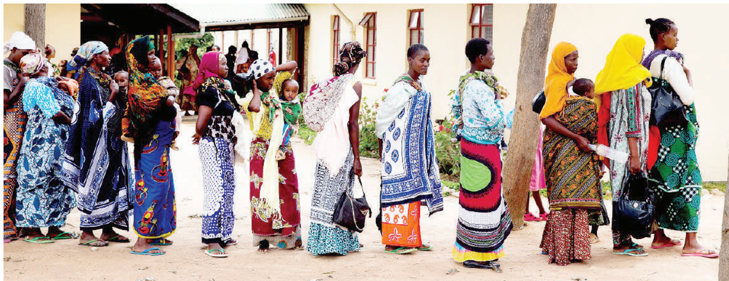
Kinamama na watoto mgongoni wanasimama bila huduma kwa muda mrefu. Moja ya sababu huenda ni uzembe, kutokujali wala kuwajibika kazini pengine kunakotokana na kijana kutumikia kazi asiyoiipenda.

Lakini, kwa upande mwingine mambo huwa magumu hasa kwa wazazi na walezi ambao hawana rafiki wenye shughuli au miradi inayoweza kuwaajiri watoto wao. Hubaki wakiumia na kukosa