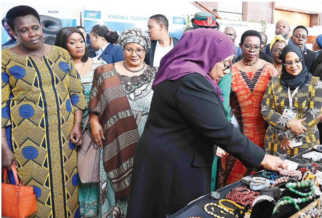
Rais Samia Suluhu Hassan akiangalia bidhaa katika mabanda ya maonesho kabla ya kuhutubia kwenye kongamano la Wanawake na Vijana wa Eneo Huru la Biashara la Afrika (AfCFTA) lililofanyika katika ukumbi wa Mwalimu Julius Nyerere (JNIC) Dar es Salaam jana.

Aliwataka wakurugenzi wa halmashauri hizo miradi hiyo inakamilika kwa wakati na kuanza kutoa huduma kwa wananchi kabla ya kumalizika mwezi Septemba, mwaka huu.