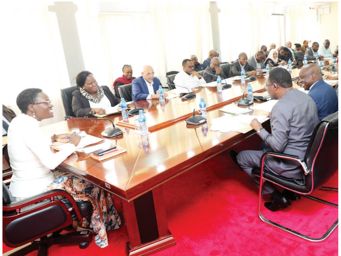
Spika wa Bunge, Dk. Tulia Ackson, akiongoza kikao cha kamati ya uongozi kilichopokea na kujadili shughuli za Mkutano wa Nane wa Bunge na mapendekezo ya ratiba ya mkutano huo jijini Dodoma jana.

Vyama vya siasa ambavyo vimeonekana kuteua wajumbe wa kugombea nafasi hizo ni pamoja na Chama Cha Mapinduzi (CCM), ACT-Wazalendo na Chama cha Wananchi (CUF).