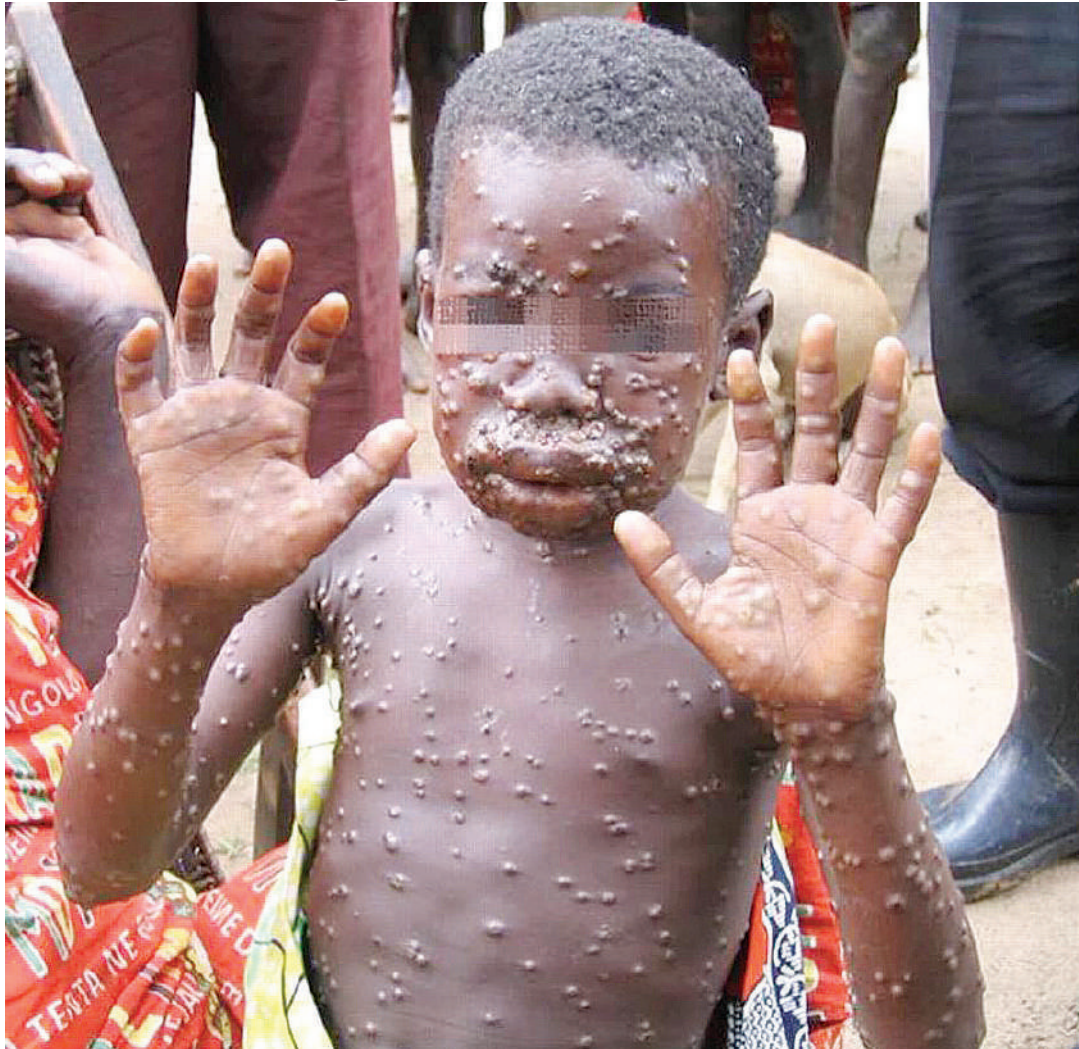
Mgonjwa wa vidonda vya homa ya ndui ya nyani.