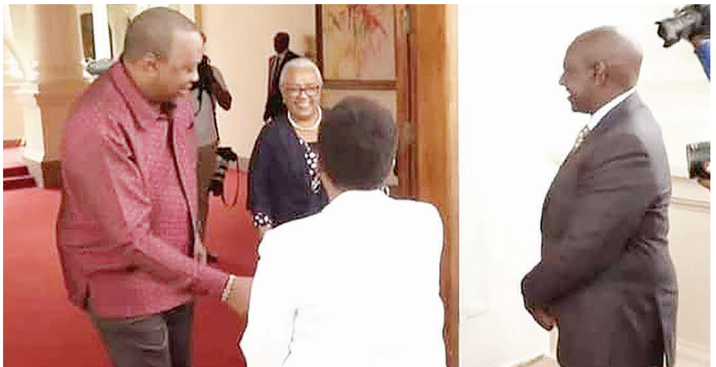
Rais Uhuru Kenyatta akimkaribisha William Ruto na mkewe Ikulu.