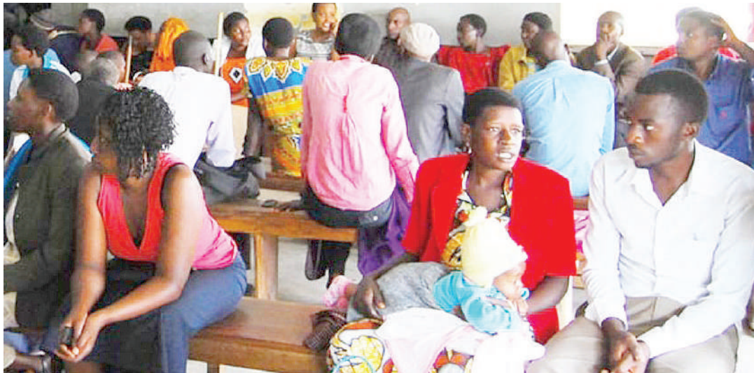
Wananchi wakisubiri huduma huku wakuwahudumia asiwepo. Kutojali watu ni baadhi ya matukio yanayosababishwa na vijana au wahusika kutokujali kazi hasa wale ambao walipewa ajira bila kuzisotea.

Wanaweza kuwashauri na kuwahimiza kubadilika zaidi waajiri nao waanze kujifunza kuwa watoto wanaotafutiwa