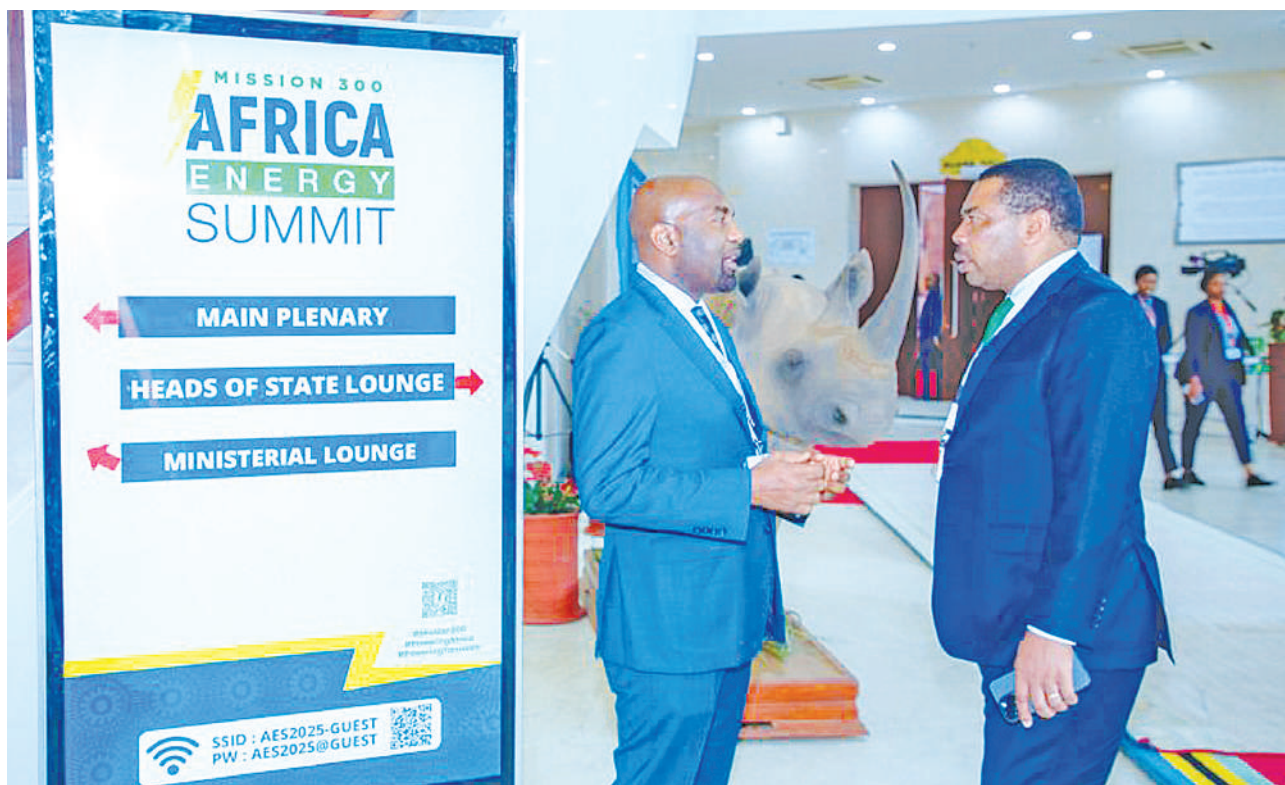
Waziri wa Fedha, Dk. Mwigulu Nchemba, akizungumza na Waziri wa Nchi, Ofisi ya Makamu wa Rais (Muungano), Hamad Yussuf Masauni, kando ya Mkutano wa Nishati wa Wakuu wa Nchi na Serikali, mnamo Januari 28, 2025, katika Kituo cha Kimataifa cha Mikutano (JNICC), Jijini Dar es Salaam.

Ili kufikia lengo Namba Saba la Malengo Endelevu ya Nishati kwa Wote mwaka 2030, zinahitajika jitihada za pamoja ku-pata nishati.