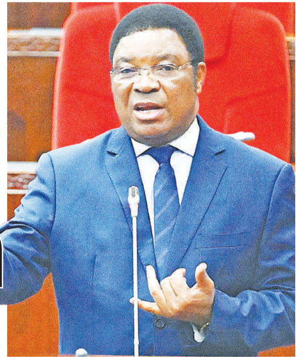
Waziri Mkuu, Kassim Majaliwa akijibu maswali, bungeni jijini Dodoma, jana.