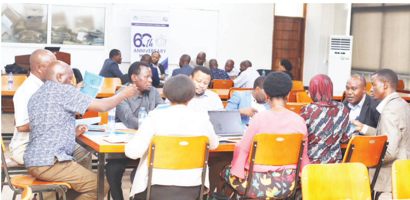
Wataalamu na wahadhiri wa vyuo vikuu mbalimbali nchini, wakipitia mtaala wa Shahada ya Uzamivu (PhD) ya Infomatiki za Biashara, ulioandaliwa na Chuo cha Elimu ya Biashara (CBE), jijini Dar es Salaam jana, kwa ajili ya kutoa maoni yao.

Alisema mpaka sasa kuna viwanda vya uchakaji wa mazao Njombe na Mufindi na wanaatarajia kujenga kingine Kilolo na uwapo wake umechangia mazao hayo kutoharibika shambani.