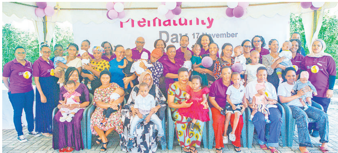
Madaktari wa watoto waliozaliwa njiti katika Hospitali ya Taifa Muhimbili (MNH), katika picha ya pamoja na wazazi wao, katika Maadhimisho ya Siku ya Taifa ya Watoto Njiti.

Watoto hao wanahitaji uangalizi wa karibu kutoka kwa wazazi wao ili kuhakikisha ukuaji wao unakua kwa afya njema.