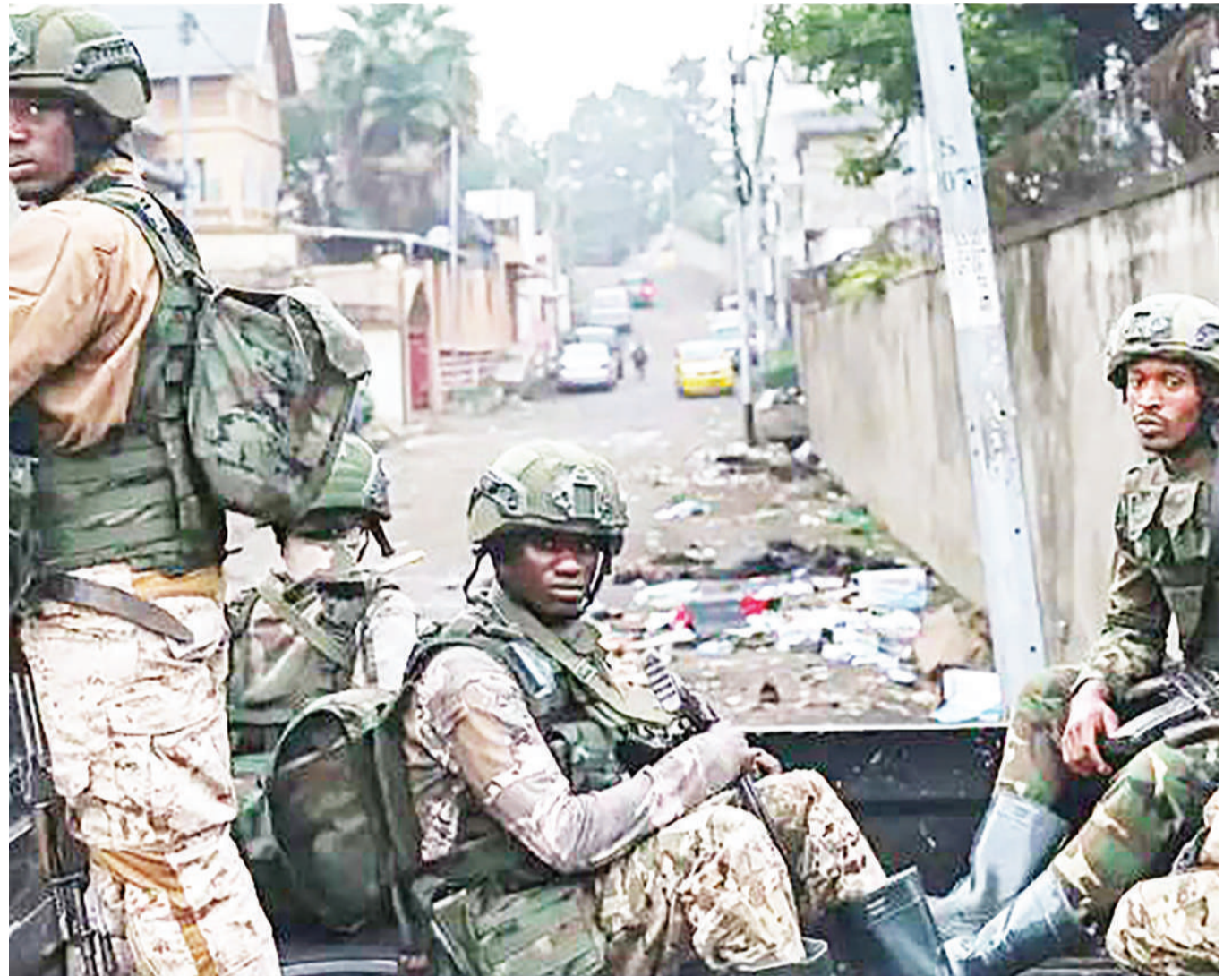
Waasi wa M23 wakiwa katika mitaa ya mji wa Goma hivi karibuni.

-Wanawake wabakwa, wachomwa moto - ‘Mochwari’ zajaa, miili yakosa maziko