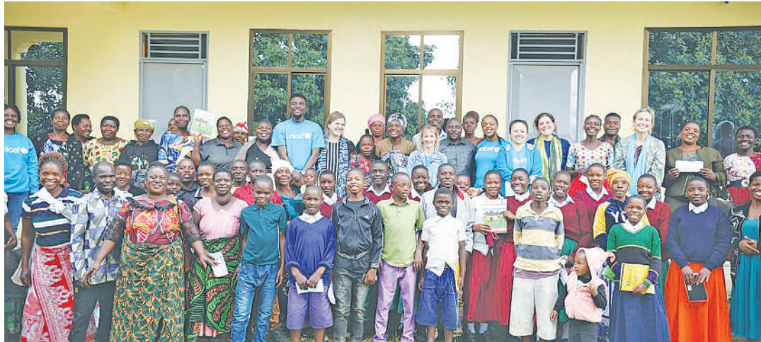
Wanufaika wa huduma za kielimu wa wasichana mkoani Songwe, katika picha na ugeni wa UNICEF mkoani humo.

UNICEF inataja umuhimu wa Elimu ya Wasichana, kwamba ni hatua muhimu kwa, kupitia mwingozo wake 'Kurudi Shule' inayowa-