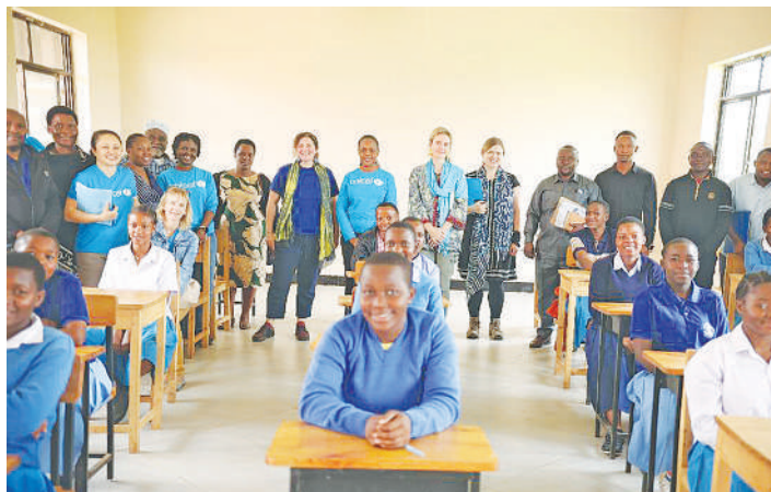
Wawakilishi kutoka UNICEF makao makuu na UNICEF Tanzania wakiwa na wasichana balehe, pia wanachama wa Kamati ya Ulinzi wa Wanawake na Watoto (WCPC) katika Kituo cha Elimu ya Watu Wazima cha Old Vwawa, Mbozi mkoani Songwe.