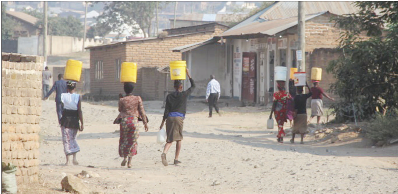
Baadhi ya wanawake wa Mwambene katika Kata ya Mwakibete jijini Mbeya wakiwa wamejitwisha ndoo za maji juzi, ambayo wanachota kwenye chanzo cha Mto Nzovwe kutokana na eneo lao kutokuwa na maji ya bomba kwa zaidi ya siku tatu sasa.

Hivi karibuni, serikali ilitoa fedha kwenye mikoa yote kwa ajili ya utekelezaji wa miradi mbalimbali ya maendeleo hasa miradi ya afya na elimu.