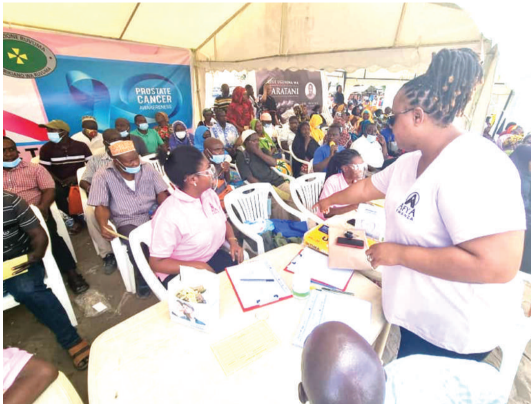
Huduma ya upimaji wa saratani ya matiti, shingo ya uzazi na tezi dume ukiendelea katika maeneo mbalimbali Dar es Salaam.

Anataja dalili kuwa ni pamoja na kutokwa na damu baada ya