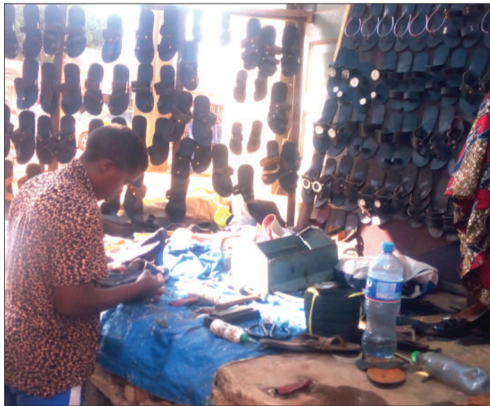
Bidhaa za ngozi vikiwamo viatu hukosa soko baada ya wateja kukimbilia mitumba.

"Nilikuwa msindikaji wa sabuni, mvinyo, baadaye 2009 Shirika la Maendeleo ya Viwanda Vidogo (SIDO), walitupa mafunzo ya kutengeneza chaki mjini Musoma kwa siku 14, tukatengeneza chaki na kuzipeleka shuleni kupitia waratibu elimu kata, lakini wakazikataa kwa madai ya kuwaumiza macho, wakati huo maduka yalikuwa na punguzo la bei tukakosa wakumuuzia," anasema