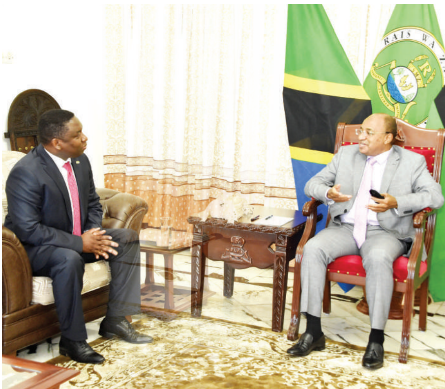
Rais wa Zanzibar, Dk. Hussein Ali Mwinyi (kulia), akimsikiliza mgeni wake Balozi wa Jamhuri ya Kenya nchini, Dan Kazungu EGH, wakati wa mazungumzo alipofika Ikulu jijini Zanzibar.