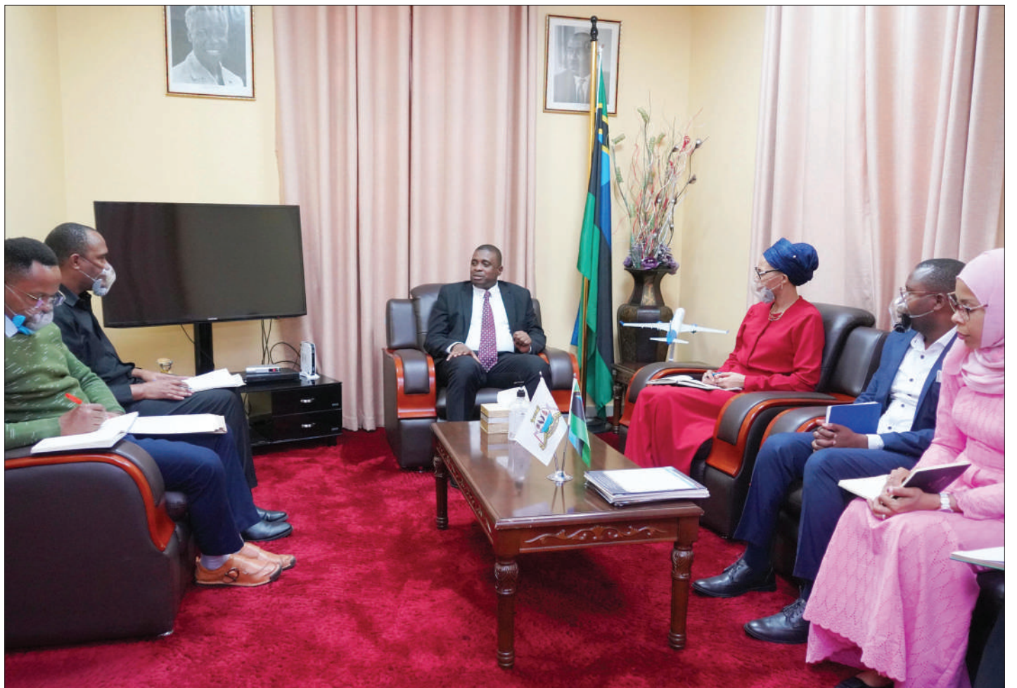
Makamu wa Pili wa Rais wa Zanzibar, Hemed Suleiman Abdulla, akizungumza na uongozi wa Chuo cha Bima na Hifadhi ya Jamii Afrika wali-ofika ofisini kwake Vuga kujitambulisha na kubadilishana naye mawazo.

Maonyesho hayo yalishirikisha taasisi mbalimbali zinazojishughulisha na masuala ya ujenzi, masuala mbalimbali ya aina hiyo kutoka Tanzania Bara na Zanzibar.