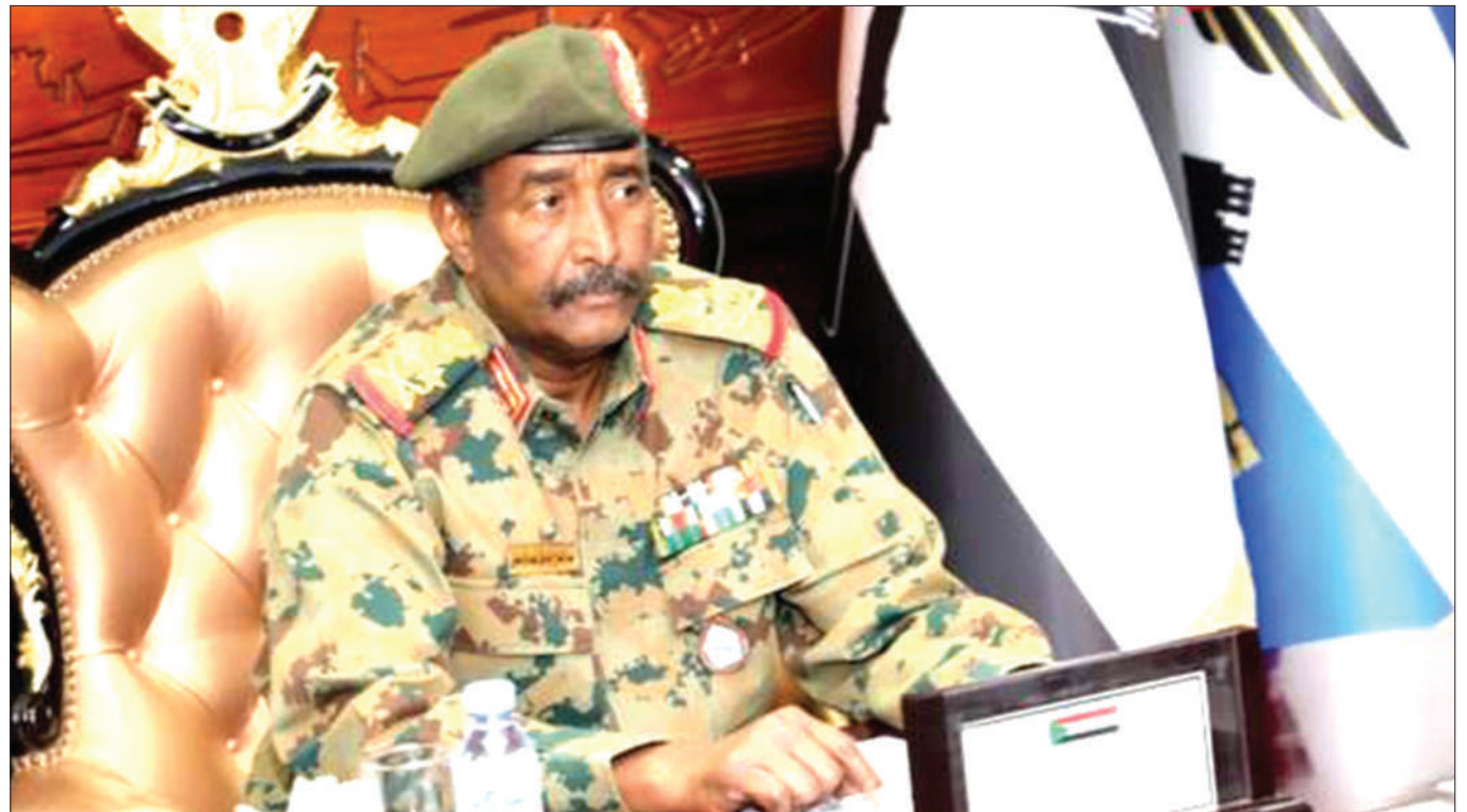
Mkuu wa Jeshi, Luteni Jenerali Abdel Fattah Abdelrahman Burhan.