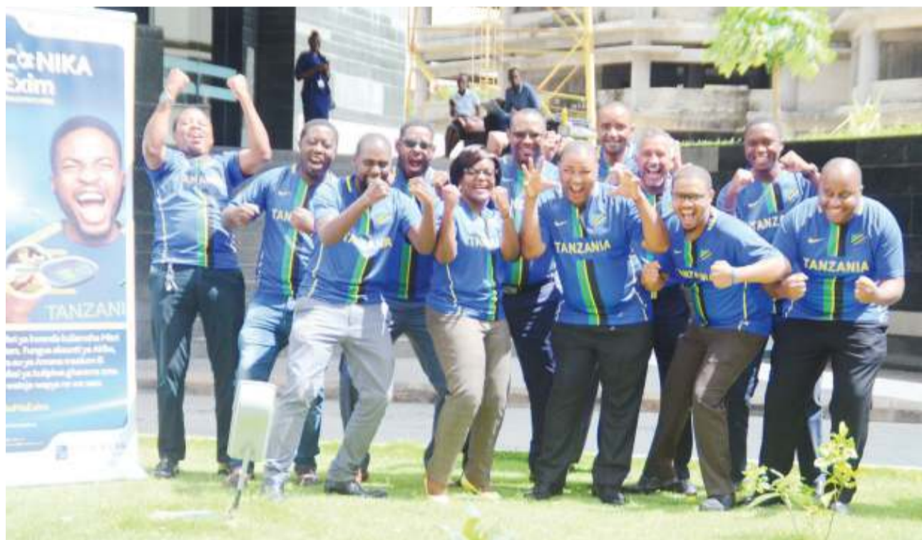
Baadhi ya wafanyakazi wa Benki ya Exim makao makuu jijini Dares Salaam, wakionyesha ishara ya ushangiliaji jana wakati wa uzinduzi wa kampeni maalum inayofahamika kama ‘Afconika na Exim’, ambayo inatoa fursa kwa wateja wa benki hiyo kulipiwa gharama zote za safari na malazi, ili waweze kushuhudia mechi za Timu ya Taifa, Taifa Stars katika fainali za Kombe la Mataifa ya Africa (Afcon) 2019 nchini Misri. NA MPIGAPICHA WETU

Pazia la fainali za Vijana za Afcon U-17, litafunguliwa Jumapili kwa wenyeji Serengeti Boys kutoka Kundi A, kuwakaribisha yosso wenzao wa Nigeria, mchezo utakaochezwa kwenye Uwanja wa Taifa jijini Dar es Salaam majira ya saa 10 jioni.