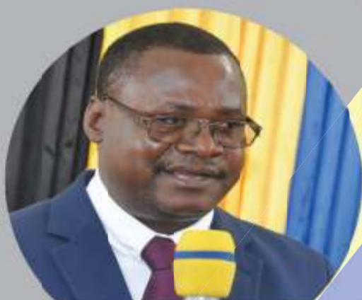
NAIBU KATIBU MKUU (E), OR-TAMISEMI TIXON NZUNDA