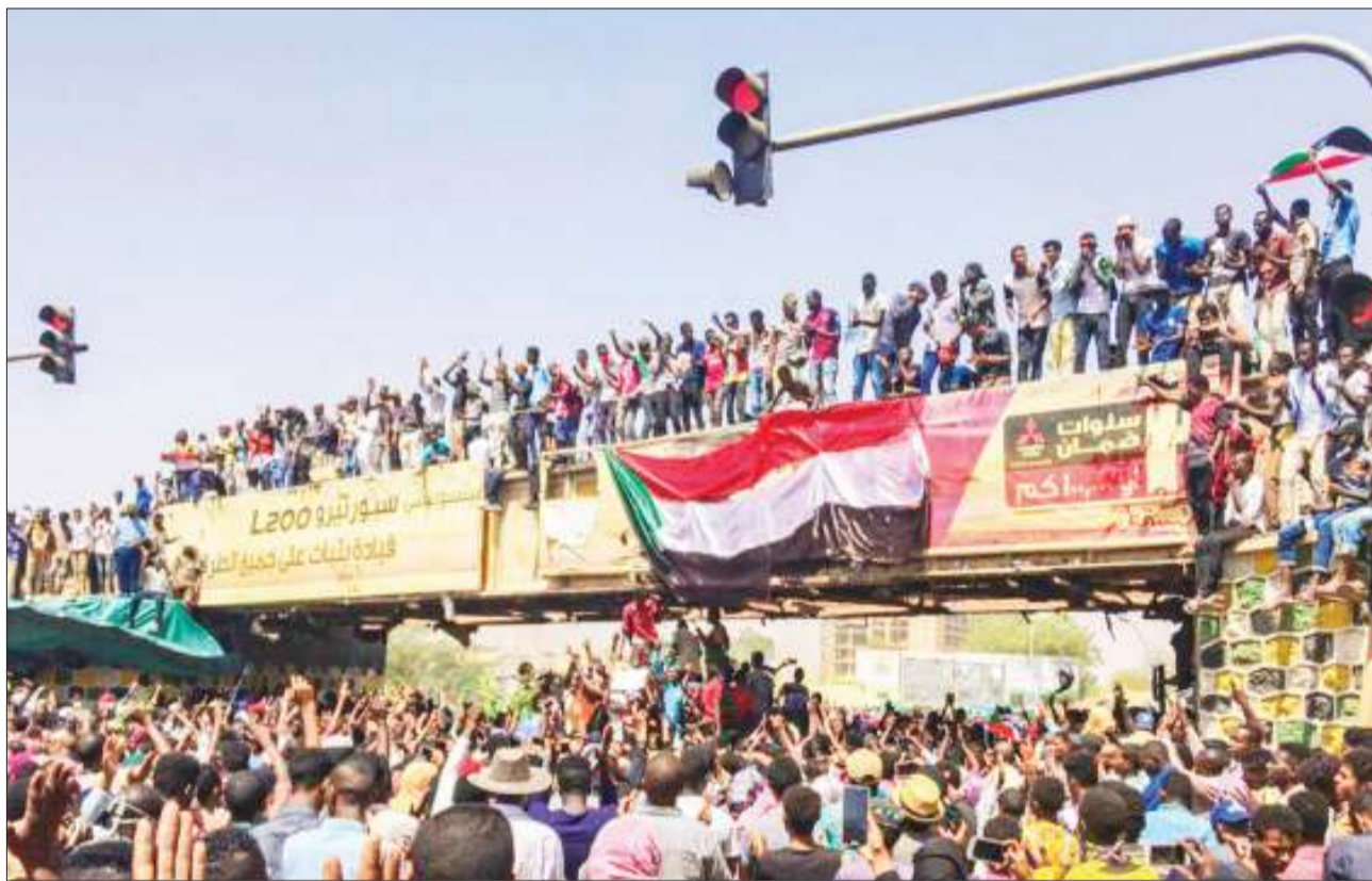
Waandamanaji nchini Sudan wanaoupinga utawala wa Rais Omar Al-Bashir wakiwa wamekusanyika nje ya makao makuu ya jeshi mjini Khartoum, wakishinikiza Rais huyo kujiuzulu.