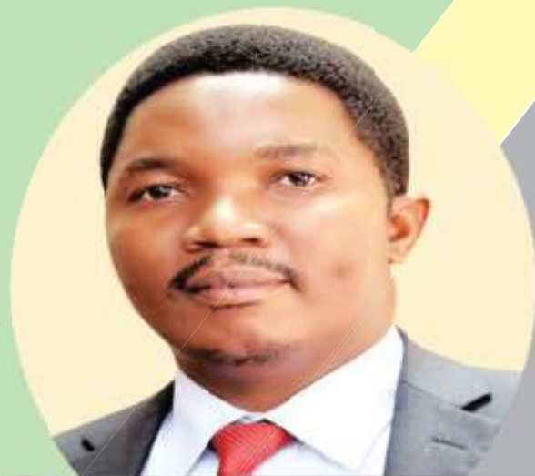
WAZIRI WA NCHI, OR-TAMISEMI MHE. SELEMANI S. JAFO (MB)