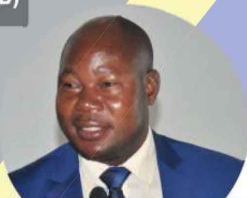
NAIBU WAZIRI, OR-TAMISEMI MHE. MWITA WAITARA (MB)