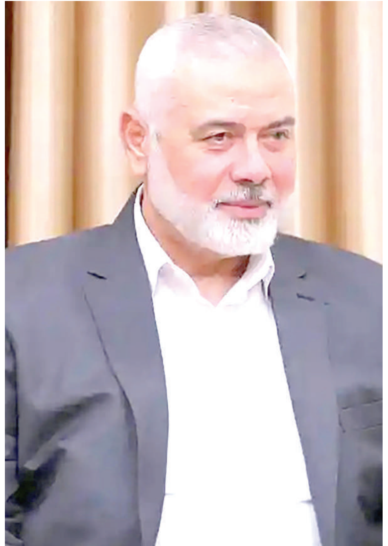
Kiongozi wa kundi la Hamas, Ismail Haniyeh.

“Tulikuja Rafah, na sasa wanatambia tuondoke. Kutakuwa na mauaji. Hakuna mahali pengine pa kwenda. Rafah ndio kimbilio letu la mwisho. Mtu yeyote