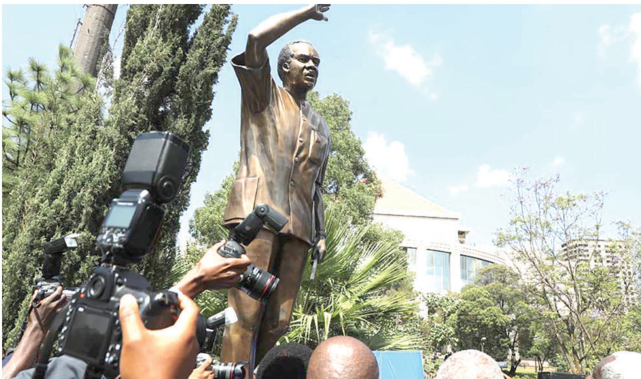
Sanamu ya Mwalimu Julius Nyerere ikiwa wazi baada ya kuzinduliwa Makao Makuu ya Umoja wa Afrika (AU) jijini Addis Ababa, Ethiopia jana.

ALIYEKOPA Mil. 3/- atakiwa kurejesha Mil. 70/-, BoT yaonya mikopo hiyo imehamia mtandaoni... Endelea ukurasa 8