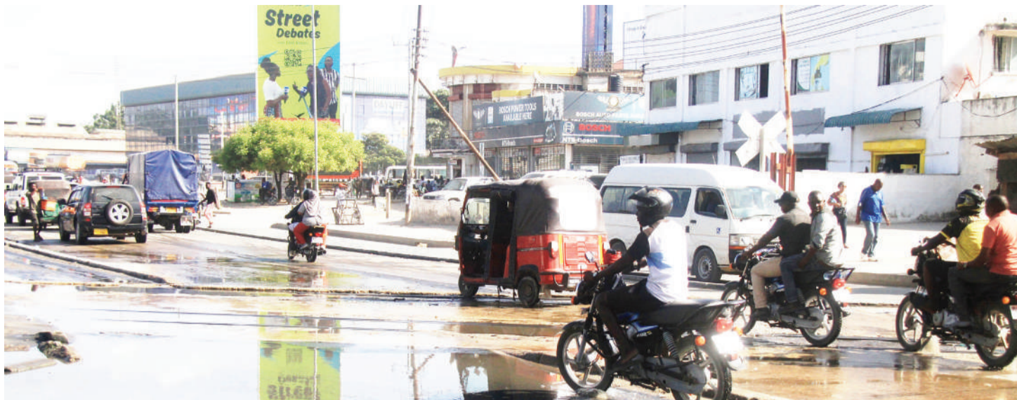
Mwendesha pikipiki akipita sehemu ya majitaka yatokayo katika chemba iliyopo eneo la Kamata jijini Dar es Salaam jana ikiwa ni tatizo la muda mrefu.