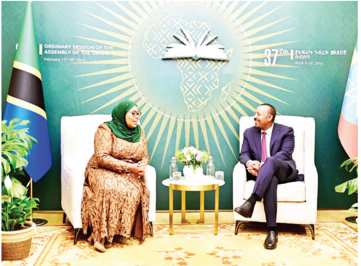
Rais Samia Suluhu Hassan akiwa kwenye mazungumzo na Waziri Mkuu wa Ethiopia, Abiy Ahmed, jijini Addis Ababa, Ethiopia jana.