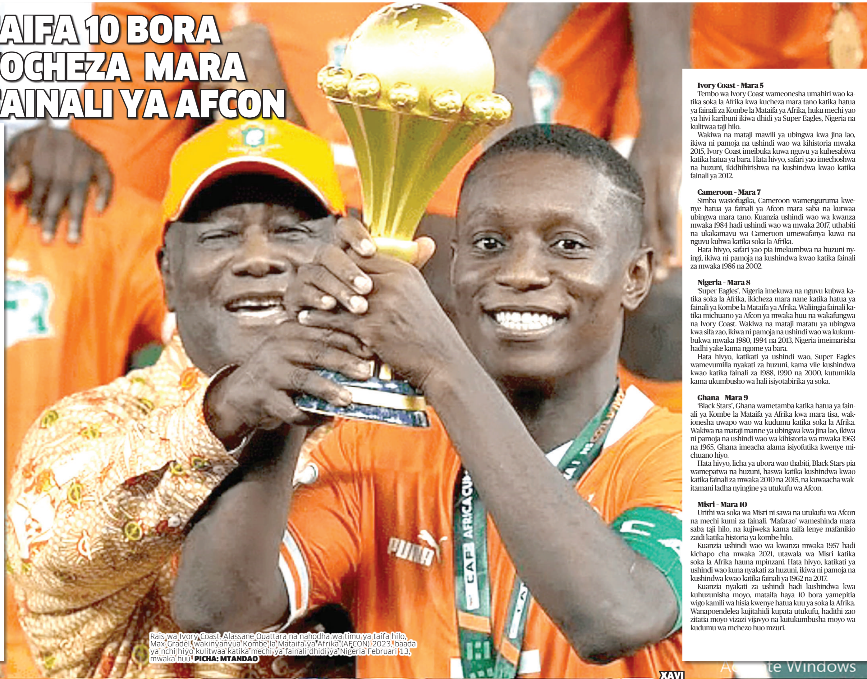
Rais wa Ivory Coast, Alassane Ouattara na nahodha wa timu ya taifa hilo, Max Gradel, wakinyanyua Kombe la Mataifa ya Afrika (AFCON) 2023, baada ya nchi hiyo kulitwaa katika mechi ya fainali dhidi ya Nigeria Februari 13, mwaka huu.

Hata hivyo, katikati ya ushindi wao kuna uchungu wa huzuni, uliodhihirishwa na kushindwa kwao kwa chungu katika fainali ya 1980.