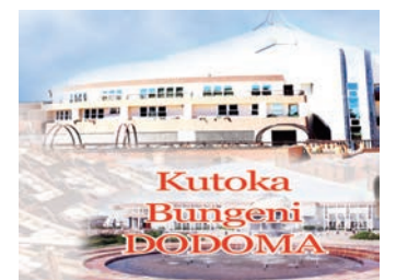
Habari zote na Augusta Njoji, DODOMA

ombo mbalimbali kushiriki pamoja katika kulinda miundombinu dhidi ya watu waovu na wasio wazalendo.