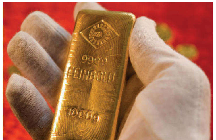
Shinyanga ina hazina kubwa ya madini hasa almasi na dhahabu.

Sensa ya Watu na Makazi ya mwaka 2012 ilibaini Shinyanga ilikuwa na wakazi 1,534,808 (milioni 1.5).