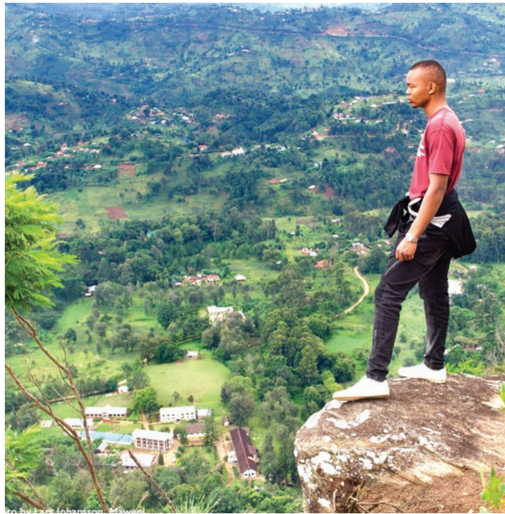
Mandhari ya milima ya Usambara.

"Pia, kuna changamoto ya matumizi ya mkaa hasa mijini na katika huu mradi, una zaidi ya Sh. bilioni 60 na tumetenga kiasi cha