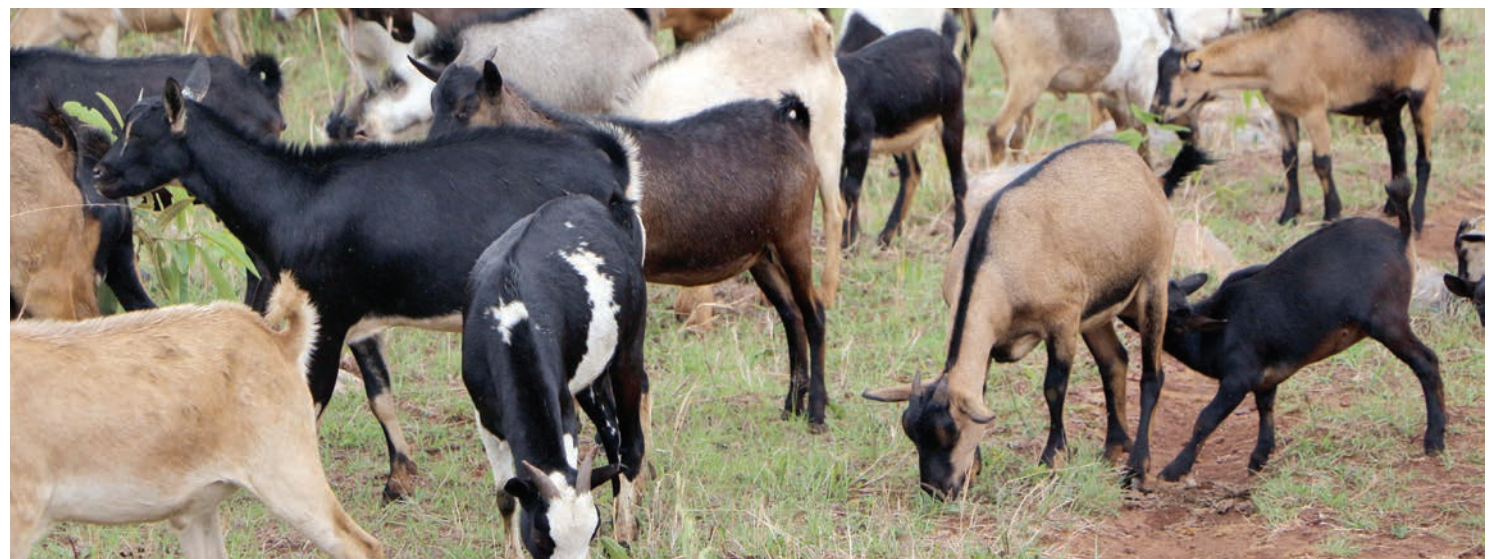
Mifugo ni sehemu ya fursa nyingi za uwekezaji mkoani Shinyanga.