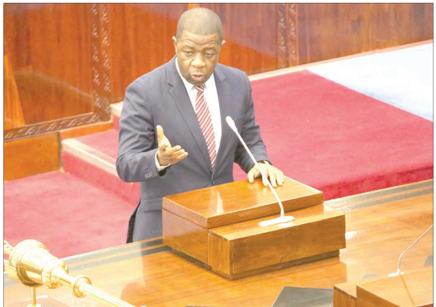
Naibu Waziri Mifugo na Uvuvi, Abdallah Ulega, akijibu baadhi ya maswali Bungeni Jijini Dodoma jana.

"Wizara inatekeleza haya kwa kuzingatia Ilani ya Chama cha Mapinduzi ya Mwaka 2020 na maelekezo ya Mhe. Rais wa Jamhuri ya Muungano wa Tanzania kuwa sekta ya kilimo ijitegemee," alisema.