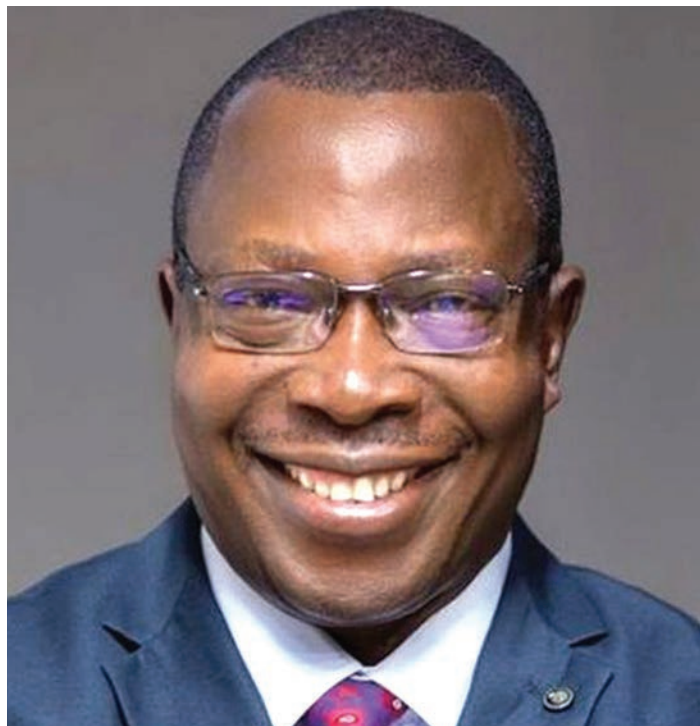
Makamu wa Rais, Dk. Philip Mpango.

Pia, kiongozi huyo mwanazuoni wa uchumi, anasema asilimia 80 ya rasilimali misitu na mazingira yanaharibiwa na matumizi ya nyumbani, kwa ajili ya kuni na mkaa na hasa mijini, ikiwa ni wastani wa ekari 188 za kila mwaka, hali inayotoa shaka ya kutoweka miti