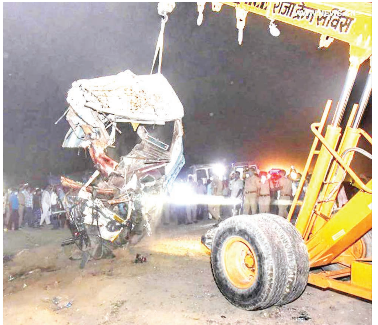
Winchi ikilinyanyua basi lililoharibiwa baada ya kugongana na gari la kunyanyulia mizigo eneo la Kanpur Nagar, Kaskazini mwa Jimbo la Uttar Pradesh, nchini India, juzi, huku watu 17 wakipoteza maisha na wengine kujeruhiwa.