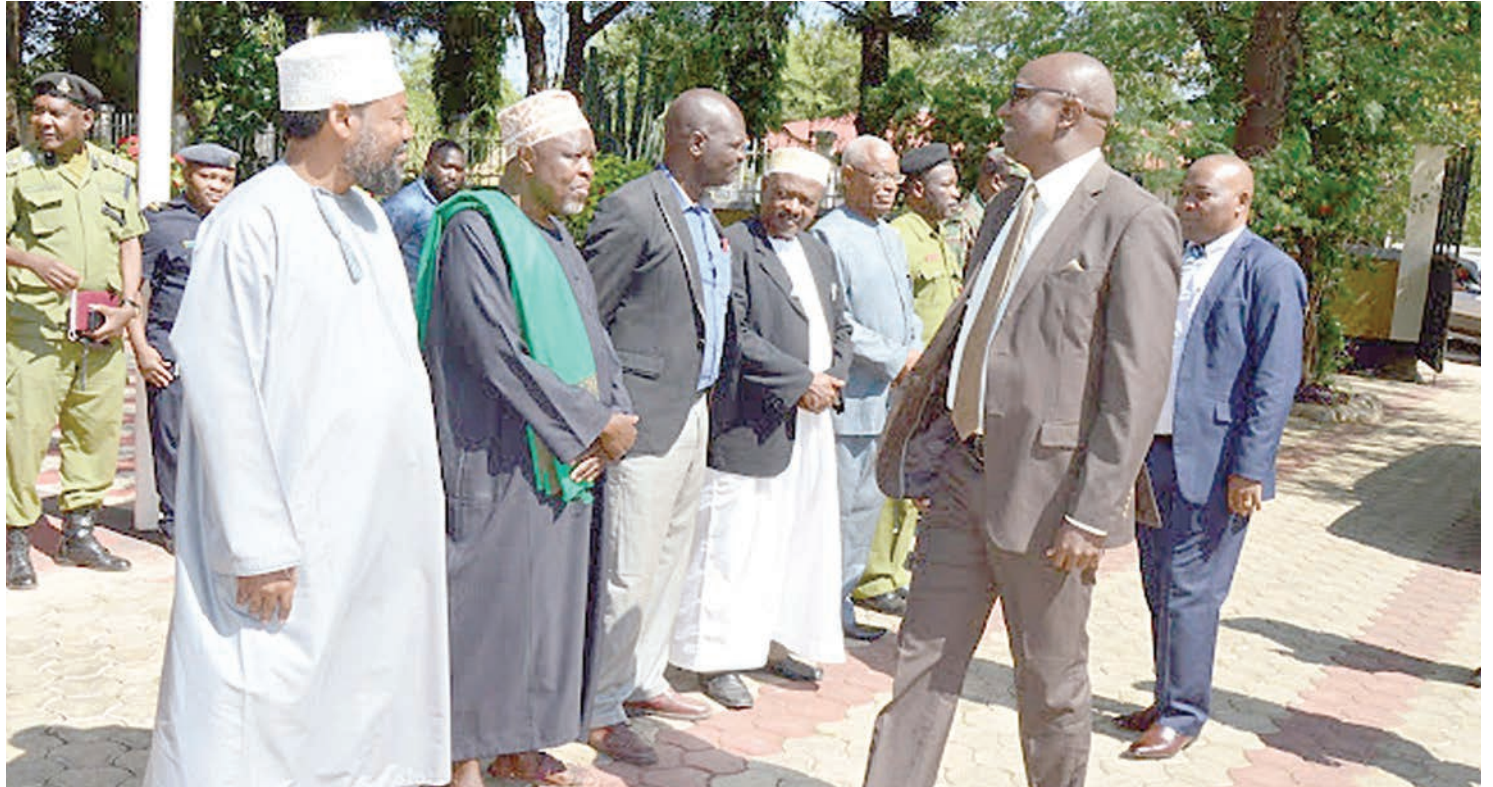
Mkuu wa Mkoa wa Shinyanga, Dk. Philemon Sengati akisalimiana na baadhi ya viongozi wa dini alipowasili katika ofisi za mkuu wa mkoa huo.

Pia, kuanzia mwaka 2012 kutokana na mkoa kukidhi vigezo