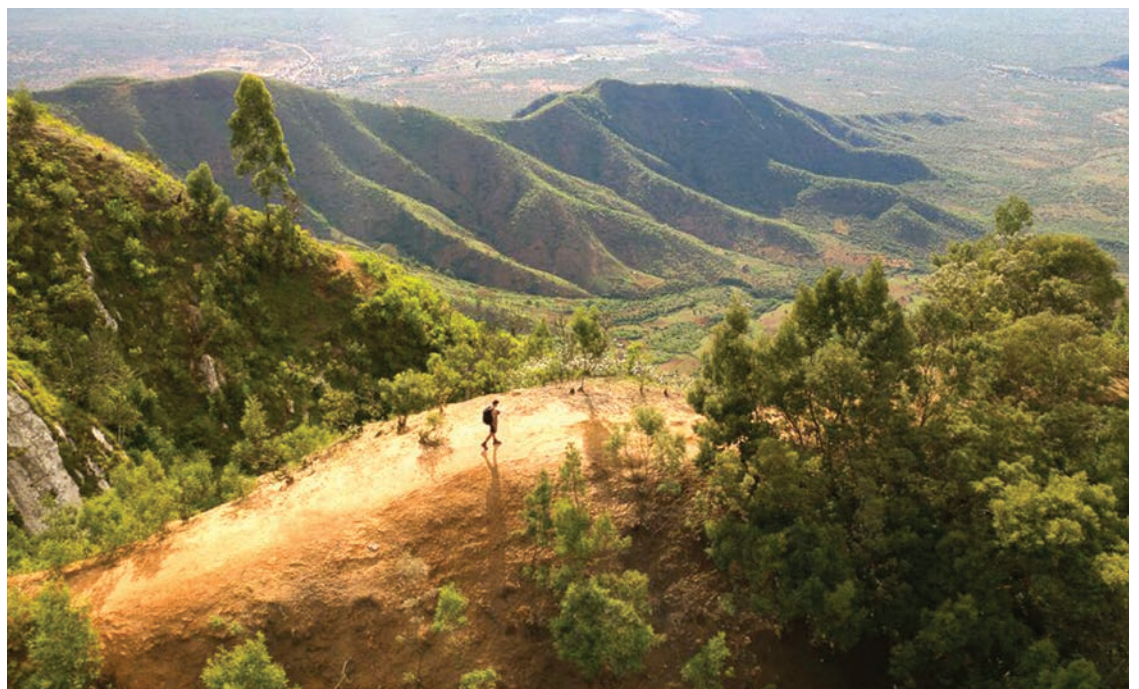
Miti iliyonawiri katika milima ya Usambara.

Anasema Tanzania imeadhimishwa kwa namna tofauti mwaka huu na fursa kwa washiriki zaidi ya 100 kuonyesha fani mbalimbali za utunzaji mazingira, akikumbusha kaulimbiu 'Mazingira Yangu, Tanzania Yangu, Ninaipenda Daima.'