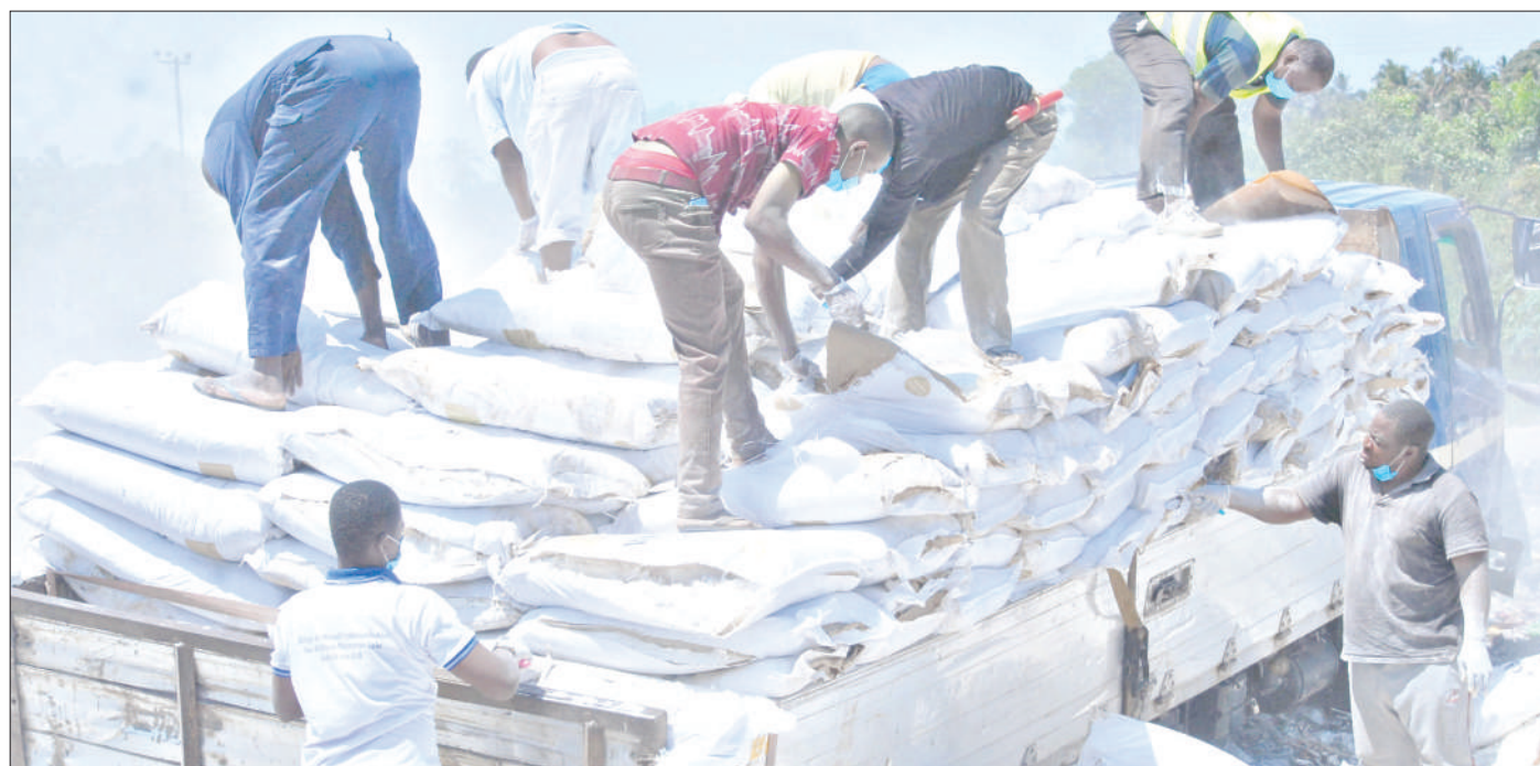
Wafanyakazi wa Wakala wa Chakula na Dawa Zanzibar wakishusha shehena ya unga wa ngano ulioharibika kwa ajili ya kuutekeleza katika dampo la Kibele, Wilaya ya kati, Mkoa wa Kusini Unguja.

Pia kupokea na kujadili mapendekezo ya Mpango wa Maendeleo ya Taifa wa mwaka mmoja 2021/22, Mwongozo wa kuandaa Mpango na Bajeti ya Serikali kwa mwaka 2021/22 na taarifa ya utekelezaji wa bajeti pamoja na Sheria ya Fedha kwa kipindi cha nusu mwaka wa fedha 2020/21.