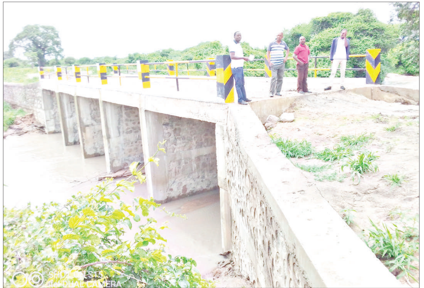
Mwonekano wa Ujenzi wa daraja la Mto Nkonjigwe katika kata ya Sasajila, wilayani Manyoni baada ya kukamilika ujenzi wake.

Kadhalika, aliiomba serikali kuajiri wauguzi wengine kwa kuwa ni miongoni mwa changamoto zinazojitokeza wakati wa kutoa huduma.