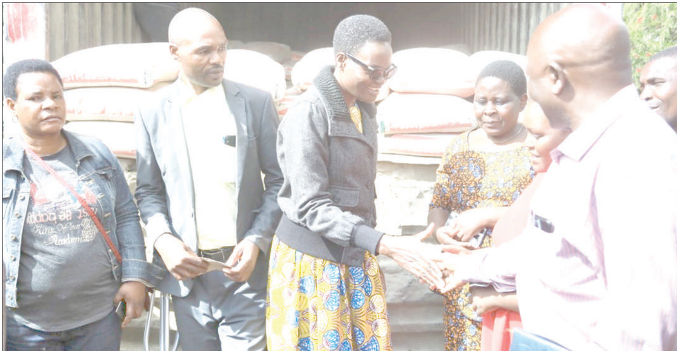
Mbunge wa Jimbo la Mbeya mjini (aliyevaa miwani). Dk. Tulia Akson, akipewa mkono wa ahsante na baadhi ya viongozi wa Shule ya Sekondari ya Pankumbi ambapo alichangia mifuko 100 ya Saruji kwa ajili ya kukamilisha ujenzi wa vyumba vya madarasa mwishoni mwa wiki.

Katika hatua nyingine, Dk. Tulia alitoa msaada wa mifuko 100 ya saruji kwa ajili ya kukamilisha ujenzi wa vyumba vya madarasa katika Shule ya Sekondari Pankumbi.