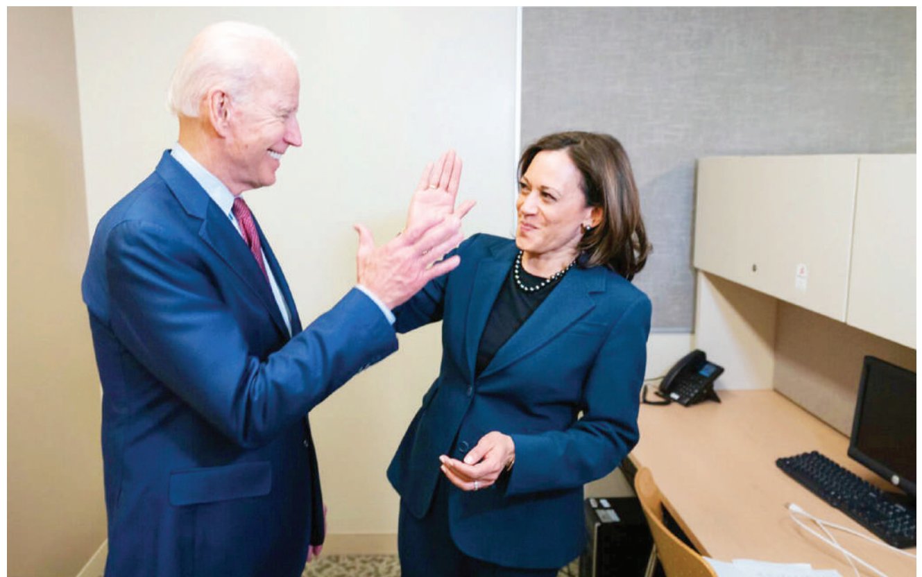
Viongozi wapya wa Marekani Joseph Biden na Makamu wake Kamala Harris, wanatarajiwa kuanza kazi rasmi baada ya kula kiapo wiki hii.

Shirika la Masuala ya Hali ya Hewa (BMKG) lilitangaza jana kuwa tetemeko la ardhi lenye ukubwa wa kipimo cha richta 6.2, lililotokea na kupiga kwa kina cha kilomita 10 na kilomita 6 Kaskazini Mashariki mwa mji wa Majene na miji ya Palu na Makasar. TRT