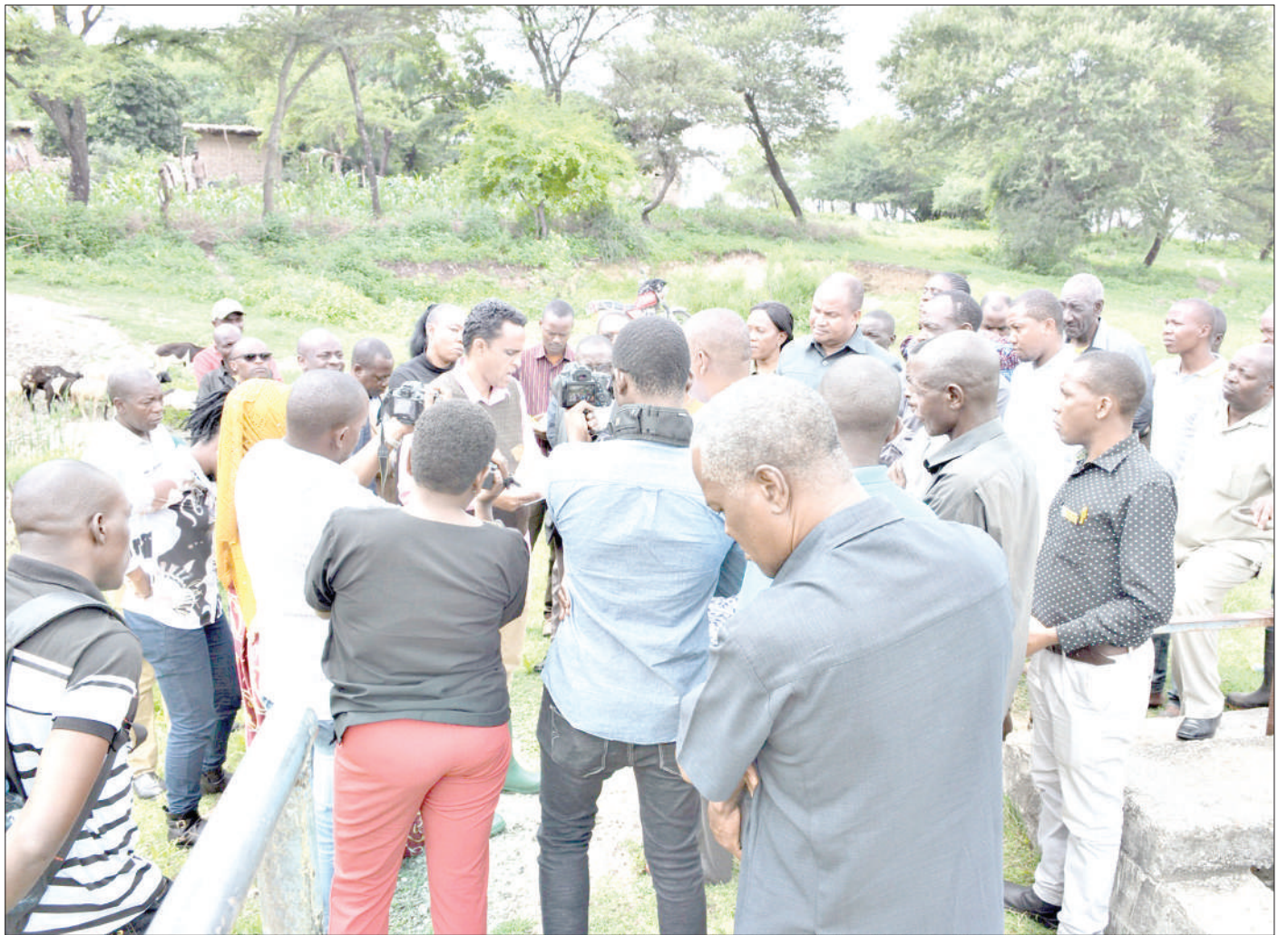
Naibu Waziri Kilimo, Hussein Bashe, akiongea na Wakulima wa Skimu ya Mwamaliili katika Hamashauri ya Wilaya ya Shinyanga Vijijini alipofika kuitembea na kukagua shughuli za skimu hiyo yenye ukubwa wa hekari 5,000 ambayo imesimama kwa sasa.

Jeshi hilo pia limefanikiwa kukamilisha ujenzi wa jengo la makao makuu jijini Dodoma, Kituo cha Zimamoto na Uokoaji katika Wilaya ya Chato, mkoani Geita, linaendelea na ujenzi wa kituo cha zimamoto wilayani Chamwino na ujenzi wa nyumba za askari wake katika eneo la Kikombo, jijini Dodoma.