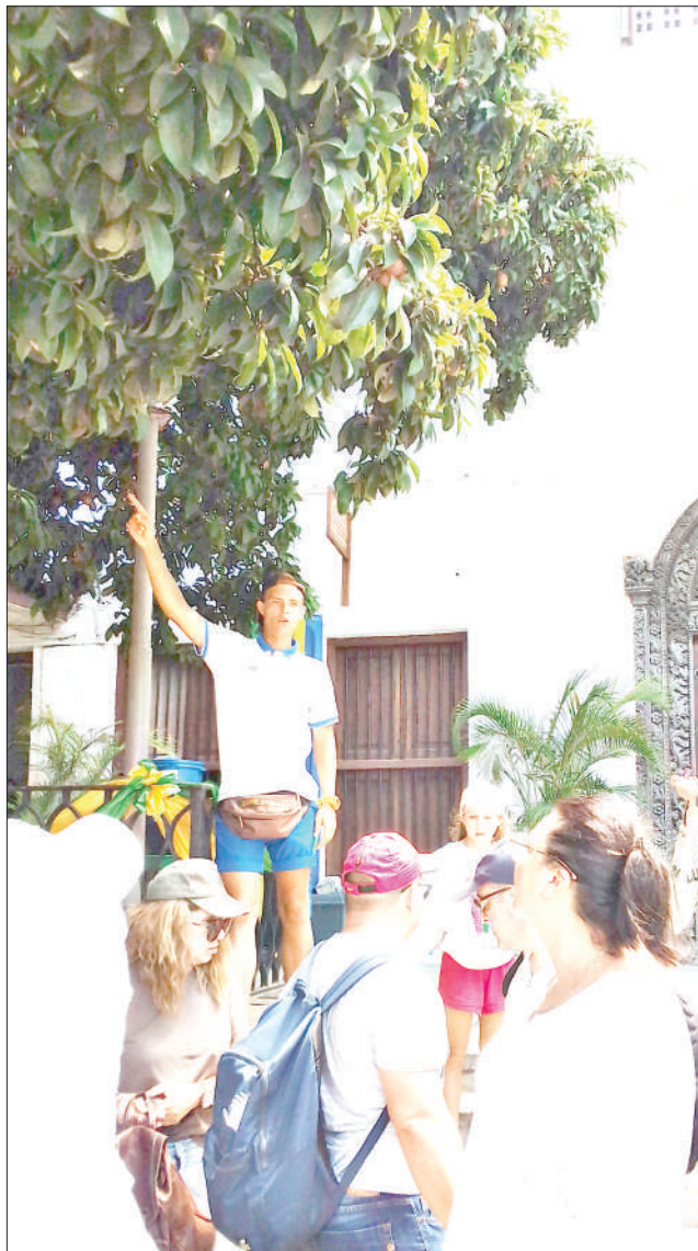
Watalii kutoka Poland (pichani), wakipata historia ya mti ujulikanao kama Mbula ulioko nyuma ya Ngome Kongwe Mjini Unguja, kama walivyokutwa na mpiga picha, jana.