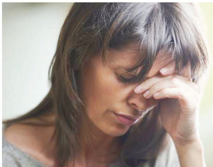
Akiwa katika hisia kali.

Mwenye sonona hupitia vipindi vya huzuni, upweke, hatia na kujiona hana thamani kabisa, sasa akishikwa na mawazo ya kukatisha maisha.