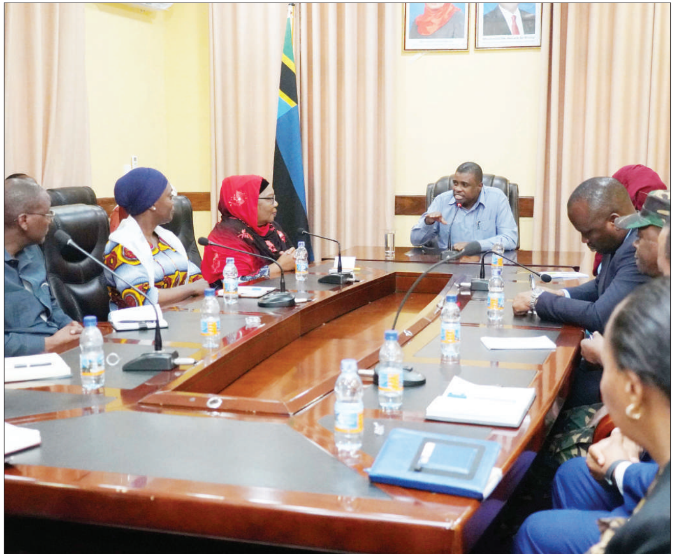
Makamu wa Pili wa Rais wa Zanzibar, Hemed Suleiman Abdulla, akizungumza na wajumbe wa Kamati ya Kudumu ya Bunge inayoshughulikia masuala ya UKIMWI, kifua kikuu, dawa za kulevya waliofika ofisini kwake, Vuga, jijini Zanzibar jana.

Alisema moja ya changamoto kubwa na sababu ya kuchelewa kusikilizwa kwa kesi nyingi kwa wakati ni ukosefu wa nafasi za kusikiliza kesi kwa majaji na mahakimu na vyumba za kusikiliza kesi hizo kwa kuwahusisha wananchi.