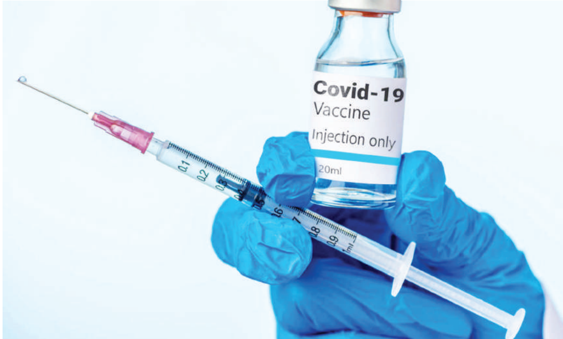
Nyenzo ya chanjo inavyofanya kazi.

Visaidizi hivyo, pia vinaweza kuwa vya kiwango kidogo cha chumvi chenye mjumuiiko wa kemikali kama vile 'aluminium phosphate.'