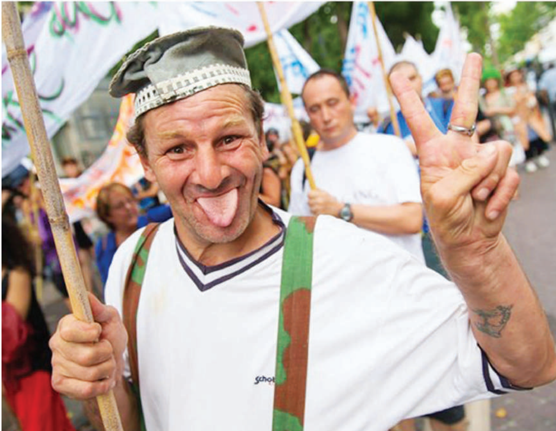
Maadhimisho mojawapo ya Siku ya Afya ya Akili Duniani.