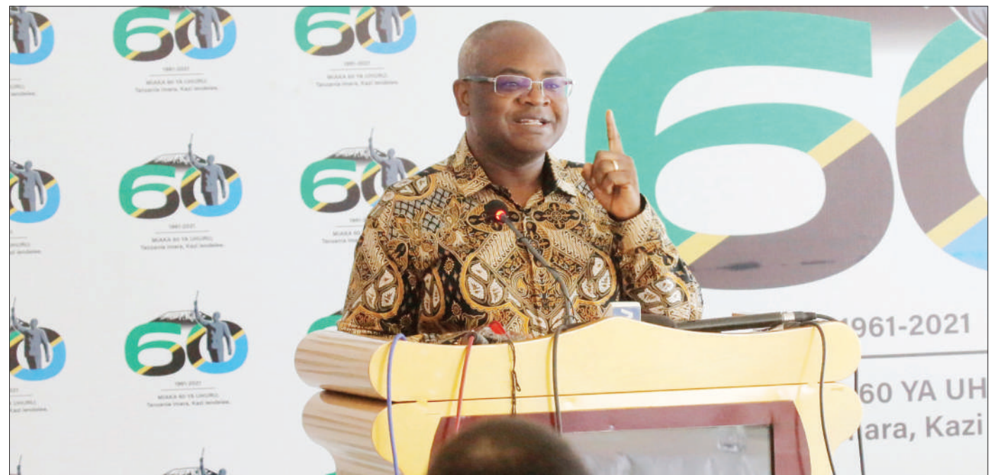
Waziri wa Viwanda na Biashara, Prof. Kitila Mkumbo, akiwasilisha taarifa ya mafanikio na matatizo ya sekta ya viwanda na biashara kwenye mkutano na waandishi wa habari, jijini Dodoma jana, ikiwa ni sehemu ya maadhimisho ya miaka 60 ya Uhuru wa Tanzania Bara.

Aliyataja baadhi ya maeneo ambayo wateja wengi hawajakamilisha malipo ya viwanja kuwa ni pamoja na Mtumba, Kikombo, Nzuguni, Iyumbu, Njedengwa, Michese, Mkalama, Nala, Michese, Wia, na Mahomanyika.