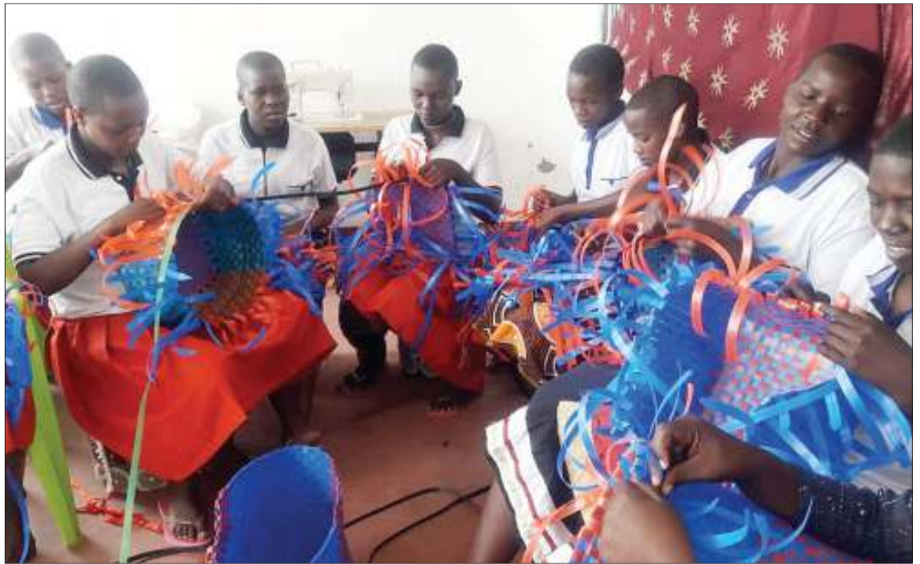
Baadhii ya wasichana wanaolelewa katika kituo cha House of Hope cha Shirika la Hope for Girls and Women Tanzania mjini Mugumu Serengeti mkoani Mara, baada ya kukimbia vitendo vya ukeketaji nyumbani kwao, wakijifunza kusuka vikapu juzi ikiwa ni mojawapo ya mafunzo wanayopata kwa ajili ya kujiajiri hapo baadaye.