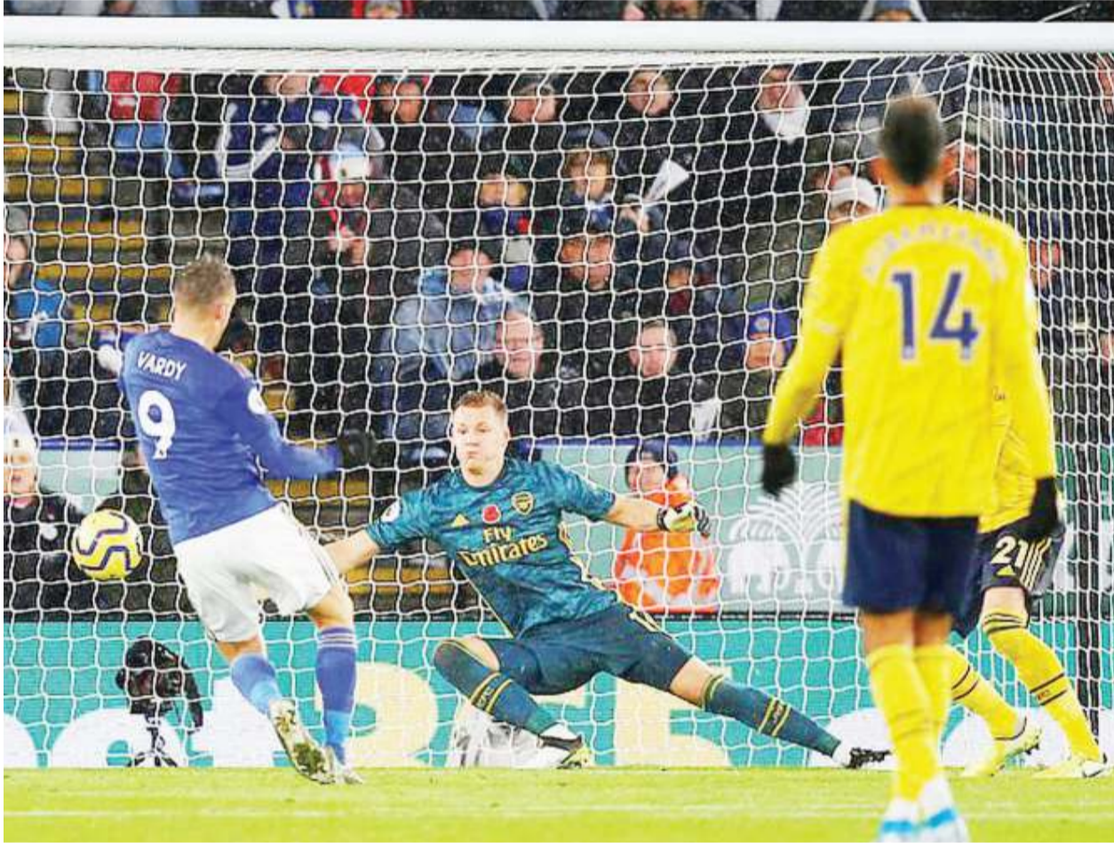
Straika wa Leicester, Jamie Vardy akipiga shuti lililotinga wavuni moja kwa moja na kumwacha kipa wa Arsenal, Bernd Leno, akiruka bila mafanikio katika mechi ya Ligi Kuu England iliyochezwa kwenye Uwanja wa King Power juzi. Arsenal ilichapwa mabao 2-0.