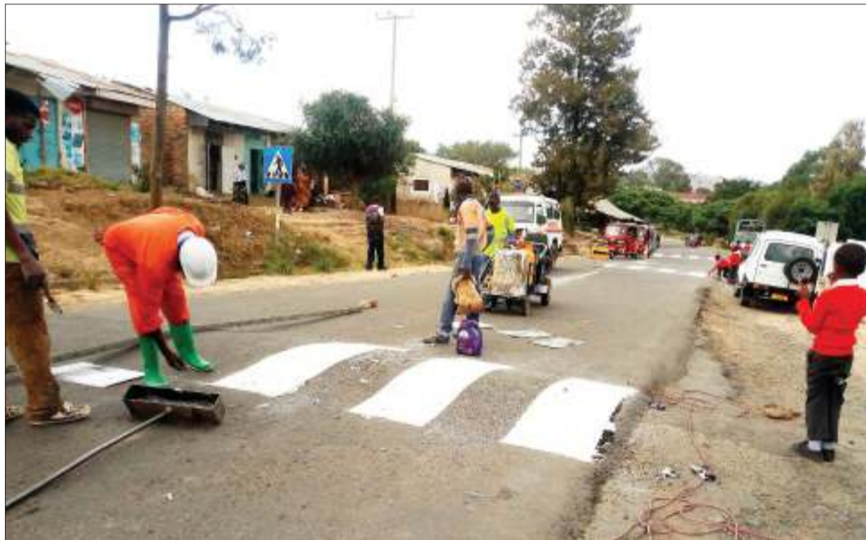
Mafundi wakiendelea kuweka alama za pundamilia kuashiria vivuko vya watembea kwa miguu katika moja ya barabara za Jiji la Mbeya eneo la Sokoine ili kupunguza matukio ya watu kugongwa na magari.

“Tunashukuru mafunzo haya yamefanyika vizuri na hatujapata tatizo lolote la kiafya kwa vijana wetu ukiacha yale madogo madogo ambayo huwa ni lazima yatokee, tunawashauri wahitimu kwenda kuwa mabalozi wazuri kwenye maeneo yao,” alisema Staff Sajenti Mwasasumbe.