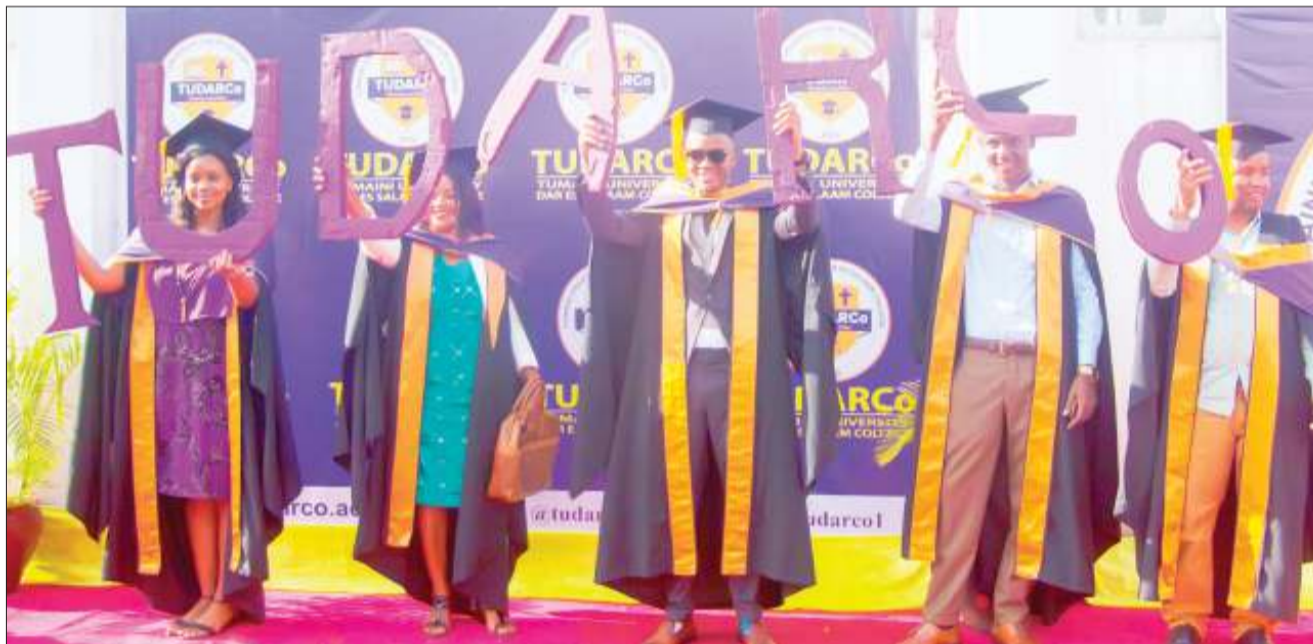
Wanafunzi wa Chuo Kikuu cha Tumaini, Dar es Salaam (TUDARCo), wakiwa wamenyanua herufi za kifupisho cha chuo hicho, wakati wa mahafali ya 13 ya wahitimu 743 juzi.