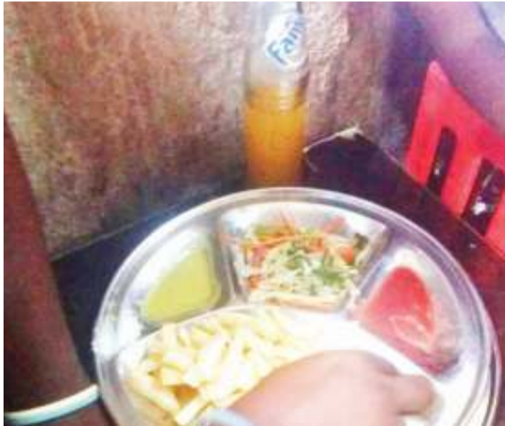
Mtu akipata mlo.