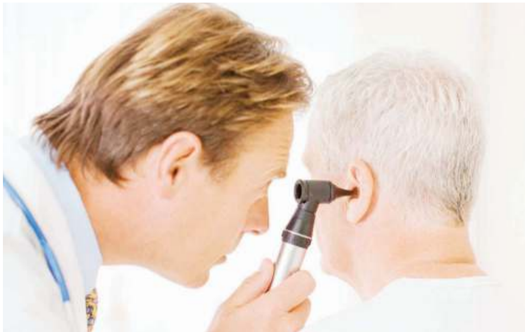
Daktari akimhudumia mgonjwa wa masikio. Picha ndogo; simu na vifaa vya kusikiliza ambavyo vimekuwa chanzo kikubwa cha matatizo ya usikivu duniani.

Mradi wa pamoja wa Shirika la Kazi Duniani (ILO) na Muungano wa Kimataifa wa Mawasiliano (ITU), ni jaribio la kutaka kukabiliana na tatizo la kutokuwa na ufahamu, kuhusu athari za kusikiliza kelele kubwa, wakati kukiwapo takwimu zinazoonyesha kwamba, takriban asilimia 50 ya vijana wanasikiliza sauti katika viwango vi-