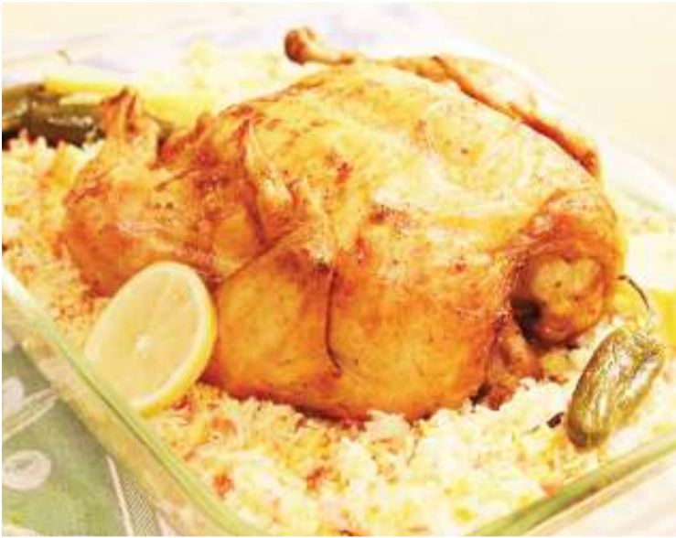
Mlo unaojumuisha nyama ya kuku na limao, ambazo zimo katika kundi la nyama nyeupe.