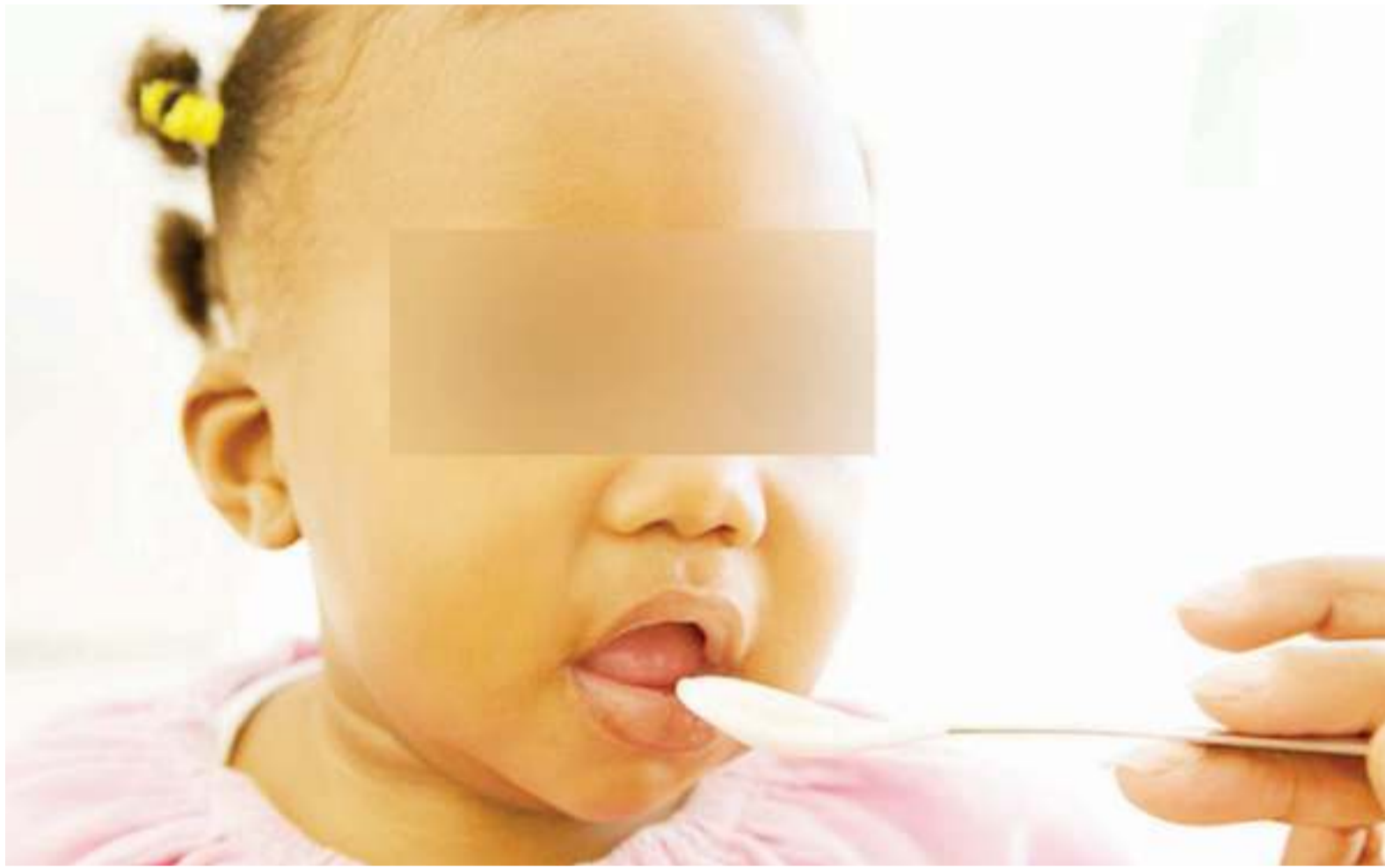
Mtoto akilishwa.