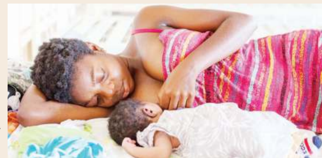
Mama akimnyonyesha mtoto wake.