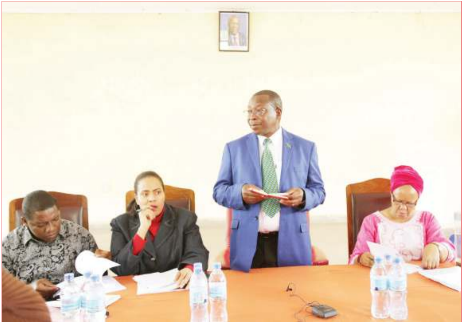
Waziri wa Fedha, Dk. Philip Mpango (aliyesimama) akifafanua jambo kabla ya kuanza kwa kikao hicho cha kushughulikia wawekezaji katika Wilaya ya Hai, mkoani Kilimanjaro jana.

Waziri Mpango alisisitiza, wamekubaliana ni muhimu mwekezaji wa kwanza aliyeingia mkataba na Muungano wa Vyama vya Murososango akapatikana ili kuondoa