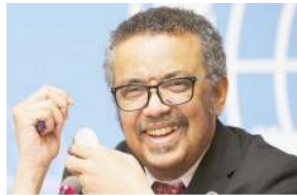
Mkurugenzi Mkuu wa WHO, Dk. Tedros Adhanom Ghebreyesus.

Pia, magonjwa ya ulemavu wa watoto unaosababisha vifo vya watoto chini ya siku 28 ni sababu ya vifo milioni 1.8 mwaka kwa 2017. Idadi na vyanzo vya vifo vinatofautiana baina ya nchi na nyingine. BBC