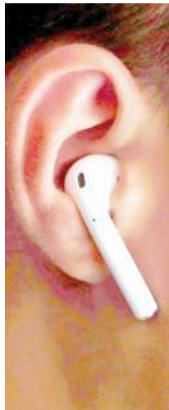
Kifaa cha usikivu wa simu chenye madhara sikioni.

tayari watoto 21 wamepandikizwa vifaa vya usikivu kitaalamu kwa jina la 'cochlear implants' anasema Makani