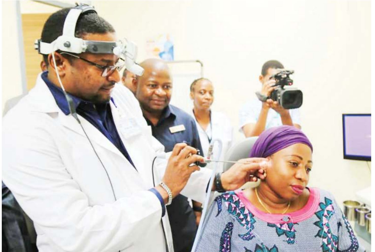
Huduma ya ukaguzi na tiba ya masikio ikifanyika nchini.

Waziri Ummu, anasema kuwa jambo jema ni kuona sasa matibabu ya matatizo ya usikivu hafifu yanapatikana hapa nchini na rai yake ni kuwataka wananchi kukata bima za afya, ili wapate mat-