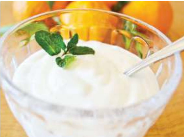
Mtindi, moja ya lishe bora inayomfaa sana mwenye VVU na Ukimwi.