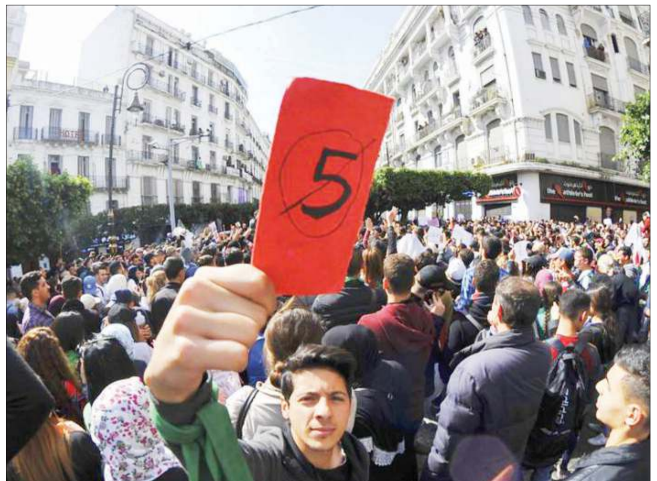
Mamia ya wanafunzi wakiwa wamekusanyika katikati ya Jiji la Algiers, tayari kuandamana kumpinga Rais Abdelaziz Bouteflika kuwania awamu ya tano ya urais.

Wafanyakazi hao pia wanataka wasimamizi hao watimuliwe kutokana na ubadhirifu wa fedha. DW