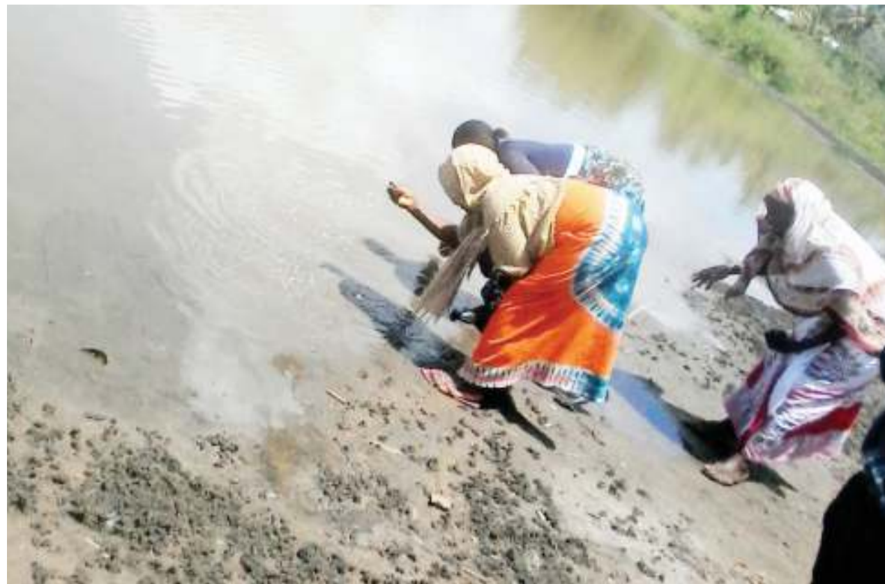
Kinamama wa Vikuge, Kibaha wakisafisha bwawa walilotengeneza, ukiwa ni mradi unaotokana na ufadhili wa Tasaf. Picha ya juu ni sehemu ya bwawa hilo ambalo sasa ni chanzo cha maji katika eneo hilo lililokuwa kame.

Kwa hiyo, ilibidi mkutano uitishwe kwa walengwa wote ambapo tuliambiwa kwamba tunatakiwa kujipanga kuanza uchimbaji wa visima.