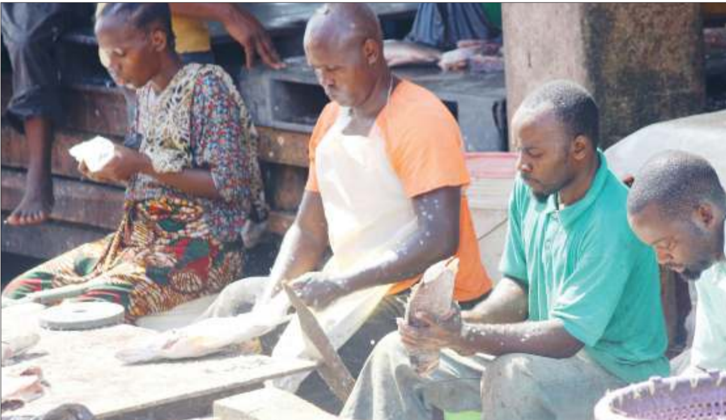
Wachuuzi wakipaa samaki kabla ya kuwauzia wateja katika soko la kimataifa la Feri jijini Dar es Salaam.

Mkurugenzi huyo alisema Kampuni ya Zanzibar Petroleum inatarajia kuingiza mafuta kiasi cha lita 1,600,000 za petroli kwa kutumia meli ya East Wind I Machi, 10 mwaka huu.