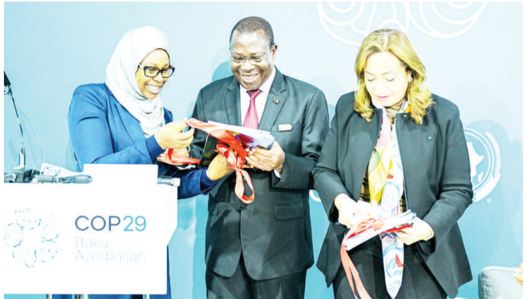
Makamu wa Rais, Dk. Philip Mpango, akiwa na viongozi mbalimbali akizindua Jarida la "Sustainable Scalling: Meeting the Clean Cooking Challenges in Africa" wakati wa Mkutano wa Kushughulikia Changamoto za Nishati Safi ya Kupikia Afrika: Wito kwa Viongozi wa Afrika, uliofanyika pembezoni mwa Mkutano wa 29 wa Wakuu wa Nchi na Serikali wa Nchi Wanachama wa Mkataba wa Umoja wa Mataifa kuhusu Mabadiliko ya Tabianchi (COP-29), katika Mji wa Baku nchini Azerbaijan, jana. Habari Uk. 7.