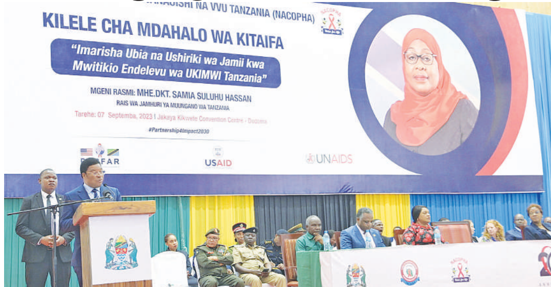
Waziri Mkuu, Kassim Majaliwa, alipomwakilisha Rais Dk. Samia Suluhu Hassan, katika mdahalo kitaifa unaohusu Ukimwi, Septemba mwaka jana.

Akihutubia Siku ya Ukimwi Duniani, katika maadhimisho kitaifa yaliyofanyika mkoani Lindi katika Uwanja wa Michezo Ilulu, Manispaa ya Lindi, Rais Dk. Samia akasema jitihada kubwa zinafanywa na serikali yake, kushirikiana