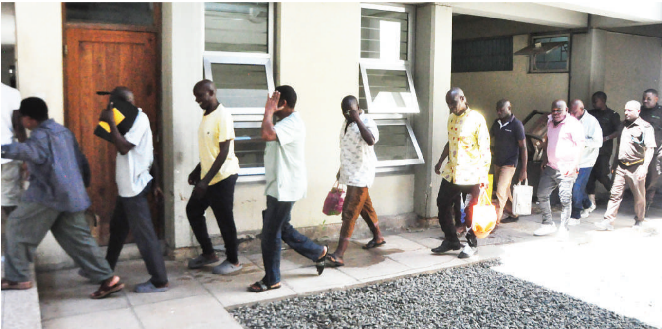
Washtakiwa wa kesi ya uhujumu uchumi ya kusafirisha vipande 660 vya meno ya tembo vyenye thamani ya zaidi ya Sh. bilioni 4.6, wakiwa chini ya ulinzi wa askari Magereza, baada ya kusikiliza kesi inayowakabili, katika Mahakama ya Hakimu Mkazi Kisutu, jijini Dar es Salaam, jana.