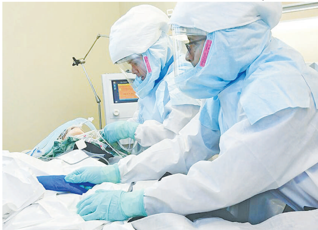
Matabibu wakimhudumia mgonjwa anayesadikiwa na maradhi ya maburg.

Pia anataja hali ya kugusa maji ya mwili wa mgonjwa kama vile damu, mate, matapishi, kinyesi,