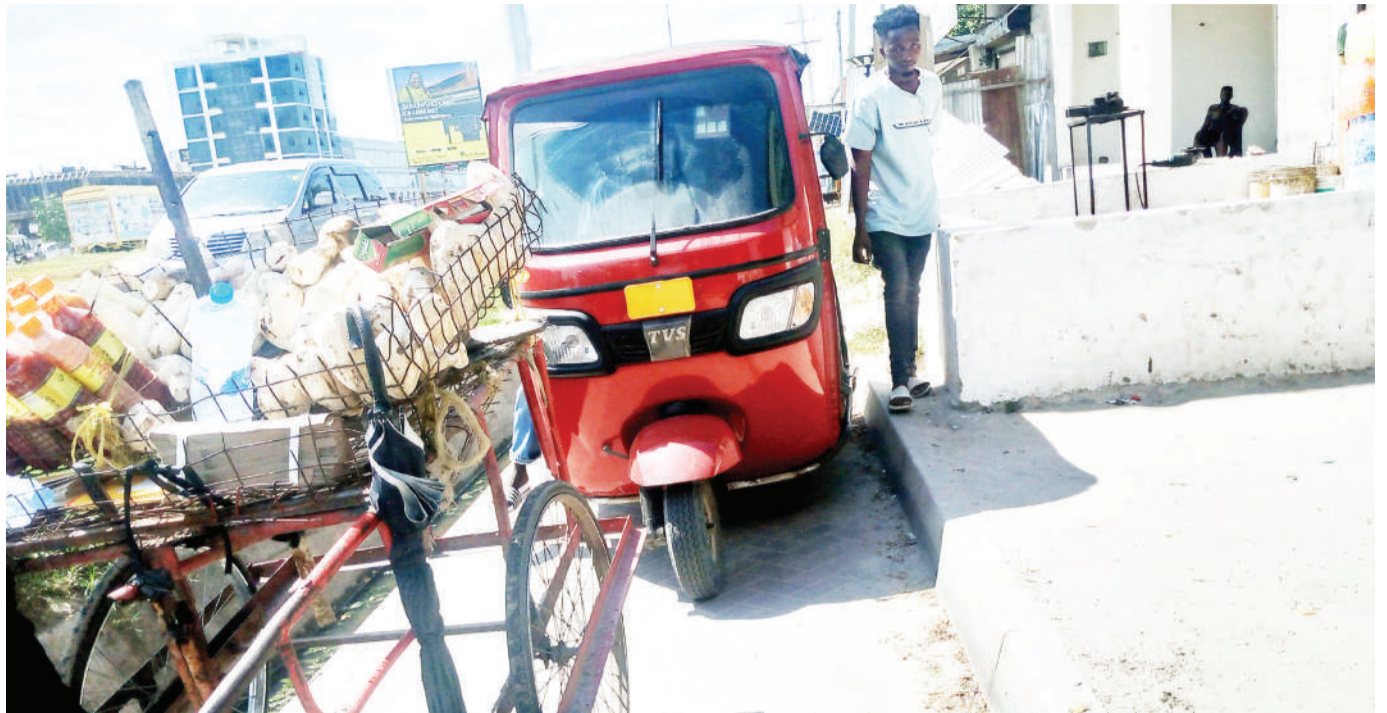
Dereva wa bajaji na muuza viazi wakiwa wameegesa vyombo vyao na kuziba njia ya waenda kwa miguu kando ya Barabara ya Bagamoyo, eneo la Mwenge, Dar es Salaam jana, kitendo kilichosababisha usumbufu kwa wapita njia.

Alisema Tanzania imedhamiria kulinda na kuhifadhi bahari na misitu ambapo ina jumla ya eneo la hekta milioni 48.1 za hifadhi za misitu na makadirio ya uwezo wa kuhifadhi kaboni sawa na asilimia mbili ya jumla ya kaboni duniani. Vilevile, kuwapo ukanda wa pwani wa kilomita 1,424 na eneo la bahari la kilomita za mraba 64,500 ambayo inatoa fursa kubwa kwa uchumi wa buluu.