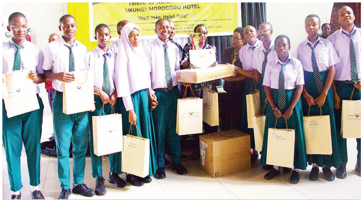
Wanafunzi wa Sekondari ya Bigwa, mkoa wa Morogoro wakiwa na zawadi zao baada ya kushika nafasi ya kwanza kwa kipengele cha uwasilishaji wa mada ya mashine za kielektroniki, katika shindano la vilabu vya kodi, kwa shule za sekondari linaloendeshwa na Mamlaka ya Mapato Tanzania (TRA), shuleni hapo, mkoani humo, juzi.