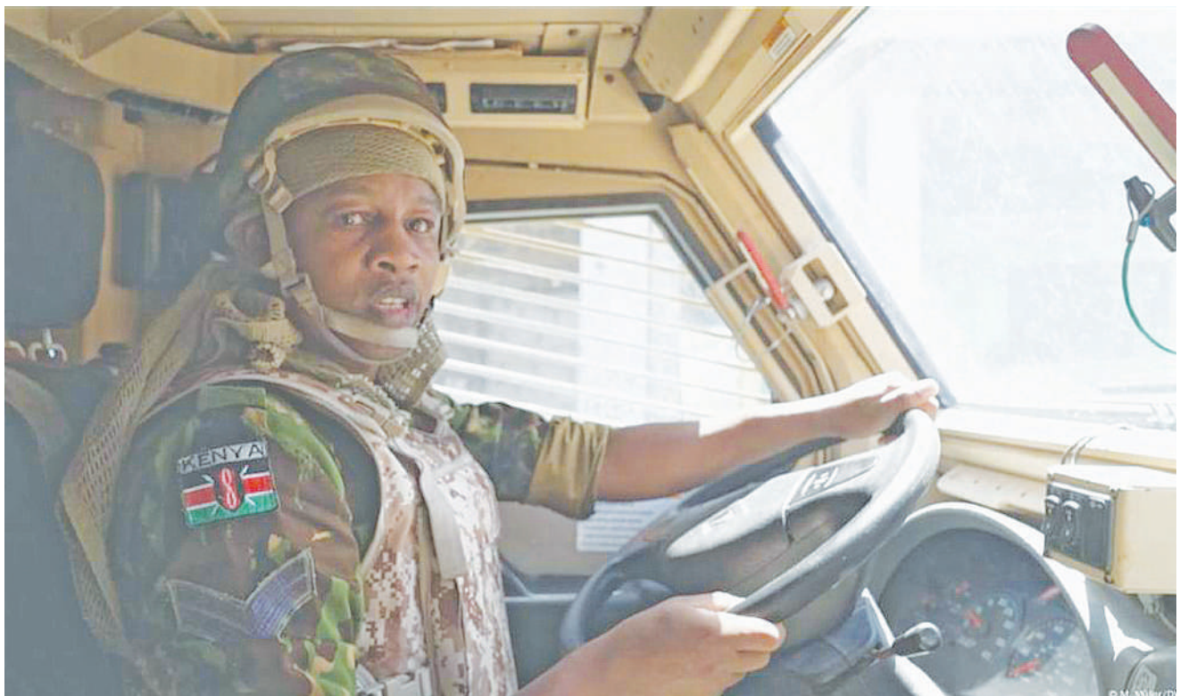
Mwanajeshi wa Kenya akiwa kwenye harakati za kuimarisha ulinzi nchini Haiti hivi karibuni.

Kura hiyo inakuja wakati kuna mvutano wa kikanda baada ya Somalia kupinga hatua ya Ethiopia kuchukua eneo la Somaliland iliyoko katika Bahari Nyekundu kwa ajili ya matumizi ya kijeshi na uchukuzi. TRT