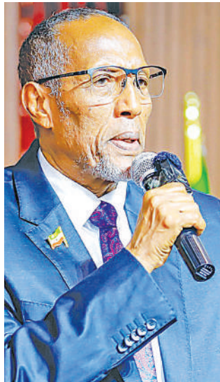
Rais aliyemadarakani, Muse Bihi Abdi

Msemaji wa Waziri Mkuu Keir Starmer alisema anaheshimu uamuzi huo ambao umechukuliwa na kuwa yuko pamoja na waathiriwa wote. BBC