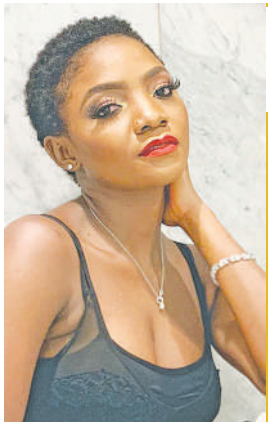
SIMI AMJIA JUU MCHUNGAJI UKURASA 14