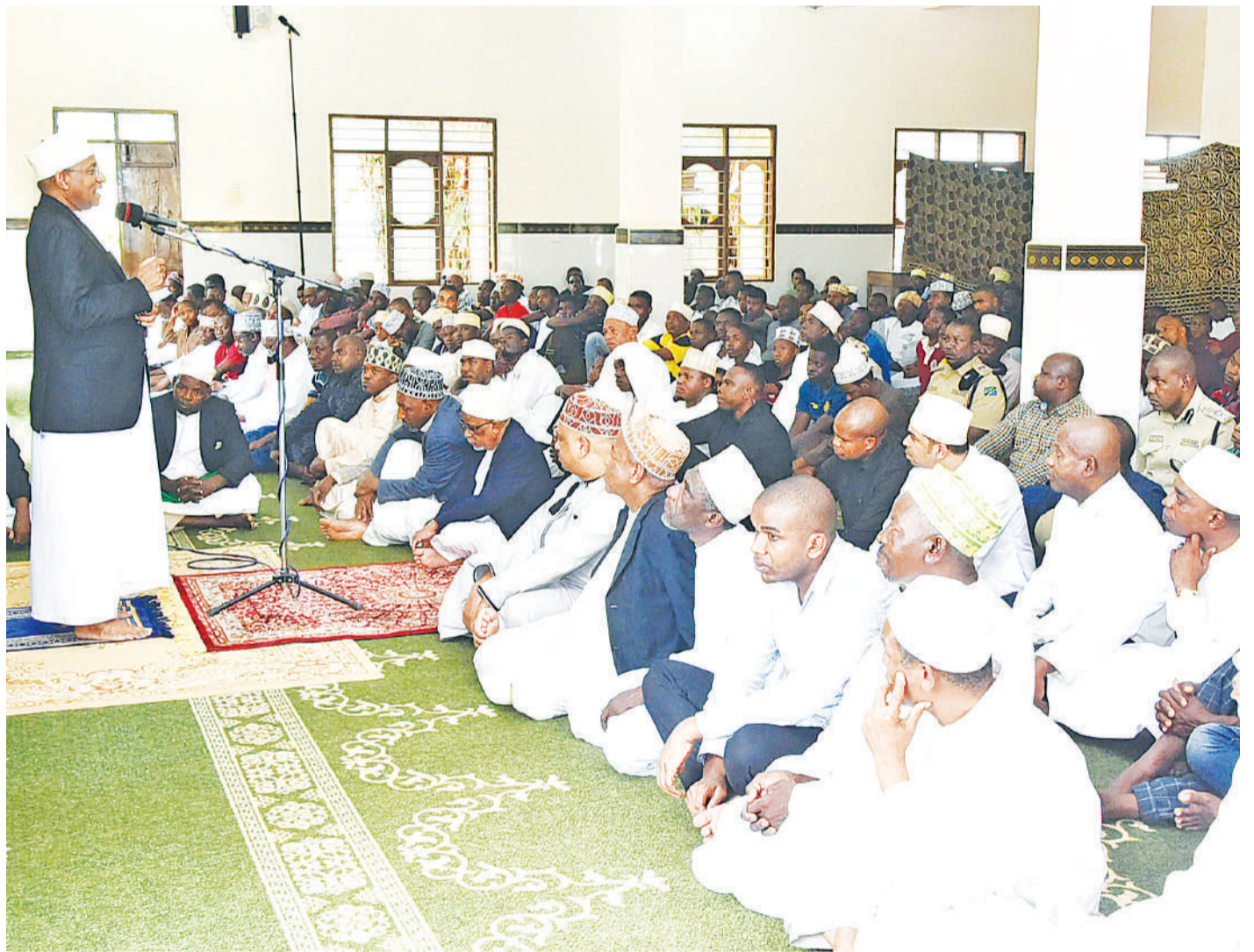
Rais wa Zanzibar Alhaj Dk. Hussein Ali Mwinyi akizungumza na Waumini wa Kiislam, baada ya ibada ya swala ya Ijumaa katika Masjid Noor Kombeni, Wilaya ya Magharibi "B" Mkoa wa Mjini Magharibi jana.