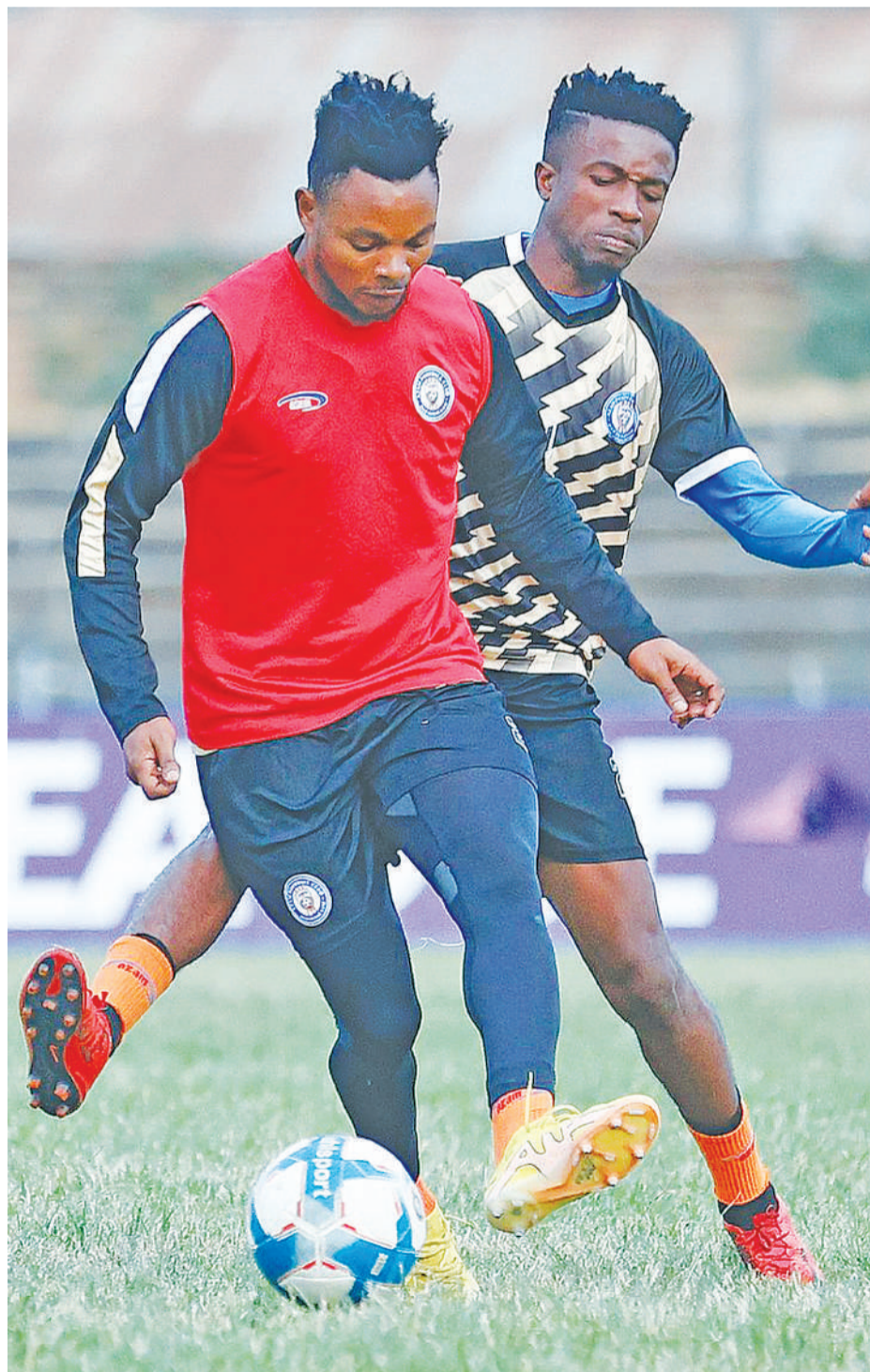
Wachezaji wa Azam FC wakifanya mazoezi kwa ajili ya kujiandaa na mechi ya Ligi Kuu Bara dhidi ya Ihefu itakayochezwa leo kwenye Uwanja wa Highland Estates ulioko Mbarali, Mbeya.