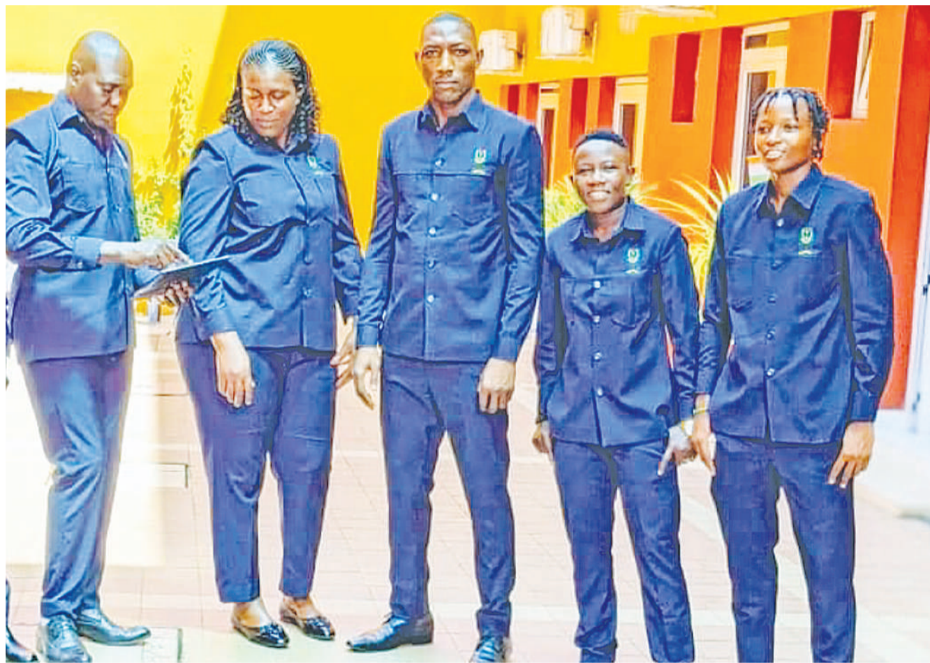
Baadhi ya nyota na viongozi wa benchi la ufundi la JKT Queens wakiwa Ivory Coast tayari kushiriki fainali za Ligi ya Mabingwa Afrika kwa Wanawake. JKT Queens itatupa karata yao ya kwanza kesho kwa kuwavaa mabingwa watetezi, Mamelodi Sundowns Ladies ya Afrika Kusini.