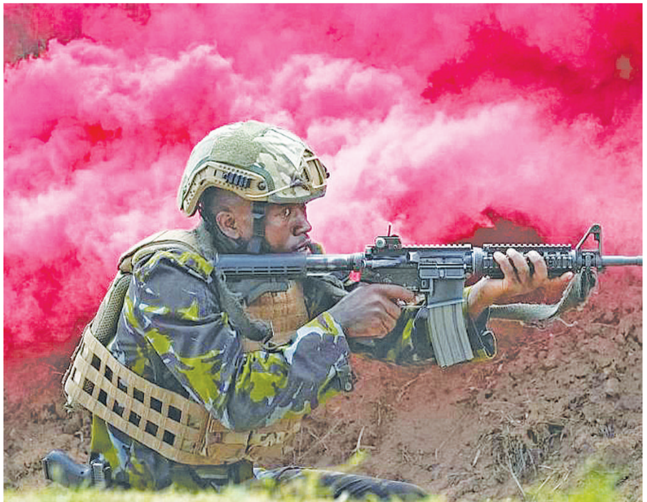
Mwanajeshi wa Kenya akishika lindo wakati Mfalme Charles III wa Uingereza akitembelea kituo cha Wanamaji cha Mtongwe huko Mombasa juzi.