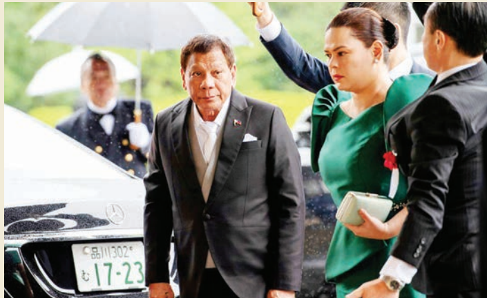
Rais wa Ufiipino Rodrigo Duterte akiwa na binti yake Sara Duterte-Carpio wakihudhuria kwenye hafla mojawapo jijini Tokyo, Japan. Binti huyo anawania urais mwakani.

Duterte mwenye umri wa miaka 76, mwezi uliopita alisema kuwa atagombea kiti cha makamu wa rais mwaka 2022. Katiba ya nchi hiyo inawaruhusu marais kuhudumu muhula