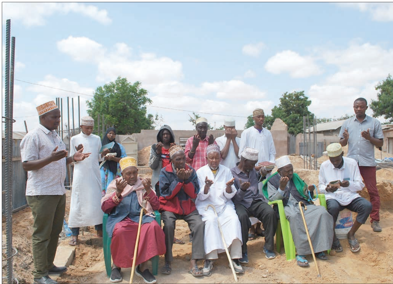
Mashekhe na viongozi wa Baraza Kuu la Waislamu (BAKWATA) Kata ya Chang'ombe, jijini Dodoma wakifanya dua kwenye msikiti wa Muccadam unaoendelea kujengwa kwa nguvu za waumini, juzi.

Bashiru, alisema kuwa wakitumia nguvu kazi na kujitua kwa wingi ujenzi huo utaweza kukamilika kwa wakati.