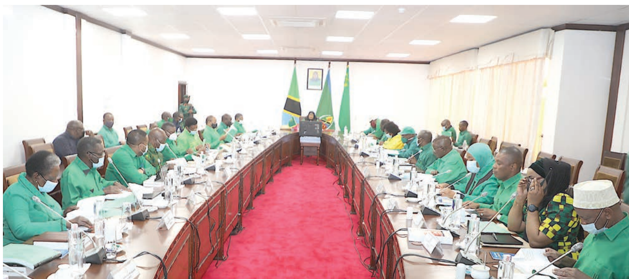
Mwenyekiti wa Chama Cha Mapinduzi CCM na Rais wa Jamhuri ya Muungano wa Tanzania, Samia Suluhu Hassan, akiongoza kikao cha Kamati Kuu Maalum ya Halmashauri Kuu ya Taifa ya CCM iliyokutana Ikuu Chamwino mkoani Dodoma jana.

Aidha, alitoa wito kwamba kiasi cha shilling bilioni 5.4 zilizotengwa katika mradi huo, zitoewe kwa wakati ili wananchi wanufaike.