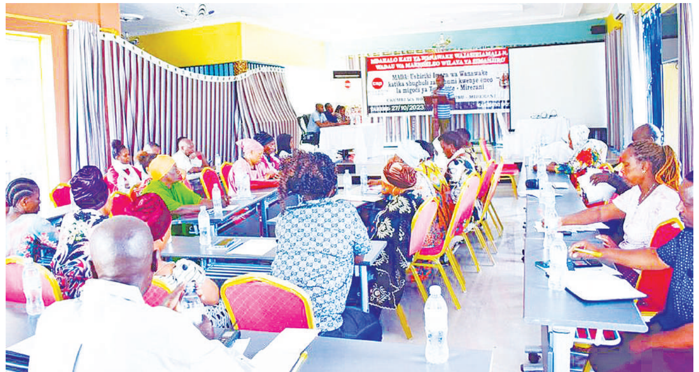
Wadau wa madini ya Tanzanite katika Mji Mdogo wa Mwerani, wilayani Simanjiro mkoani Manyara, wakifuatilia mdahalo wa ushiriki imara wa wanawake katika shughuli za madini ulioandaliwa na Shirika la Civil Social Protection Foundation (CSP), juzi.

Kwa mujibu wa Mwankunda, kupitia msaada huo wa serikali ya China kwa Tanzania, NCAA inakwenda kuendeleza Jiopaki ya Ngorongoro/Lengai, ambayo itaacha alama katika sekta ya utalii.