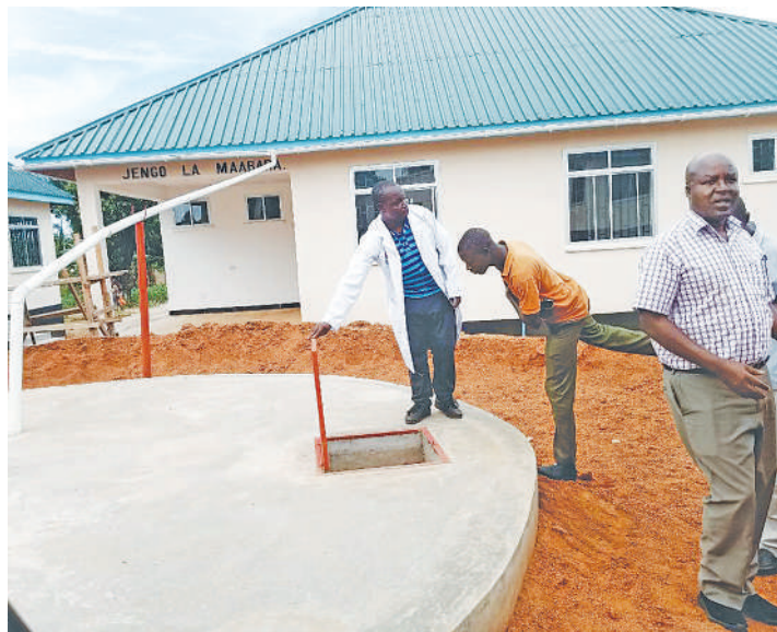
Kituo cha afya kipya wilayani Ukerewe.

Sura ya utekelezaji baada ya agizo la Rais Dk. Magufuli, ikashuhudiwa mara ya kwanza kupitia mkazo na Waziri Mkuu, Kassim Majaliwa, Septemba, 2020 zama za Awamu