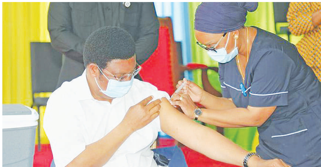
Hali ilivyokuwa kwenye uzinduzi wa chanjo ya Uviko-19 nchini, Waziri Mkuu, Kassim Majaliwa, ni sehemu ya washiriki.

Kwa upande wa chanjo aina ya Sinovac, anasema dozi ya kwanza walichoma ni watu 327,876 na wal-