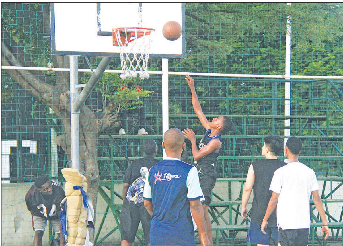
Vijana wakicheza mpira wa kikapu katika viwanja vya Jakaya Kikwete jana jijini Dar es Salaam.

“Kikubwa tumefuata maelekezo ya benchi la ufundi na kupata matokeo mazuri, tunasahau matokeo haya na tunaenda kujipanga kwa mechi ijayo dhidi ya Togo,” alisema Oppa.