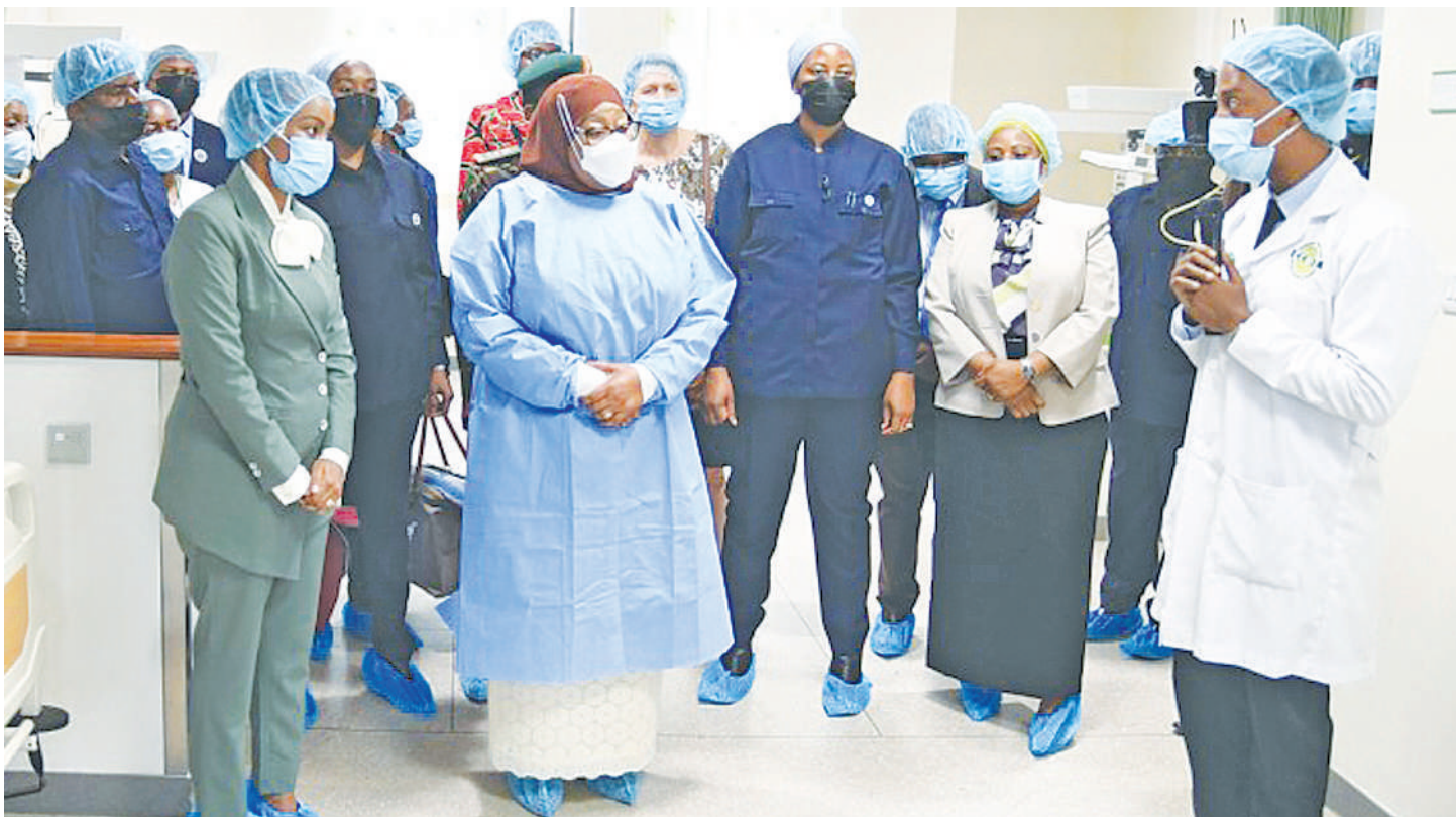
Rais Dk. Samia Suluhu Hassan, akiwa katika ziara ya kikazi hospitalini, akihimza serikali yake kuwekeza zaidi kwenye huduma za dharura na kupunguza vifo vinavyotokana na uzazi na watoto wachanga.