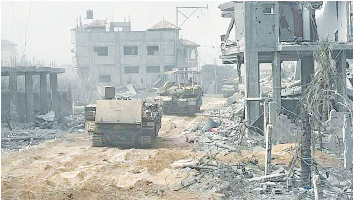
Vifaru vya Israel vikiingia Ukanda wa Gaza kuendesha mapambano na wanamgambo wa Hamas jana.