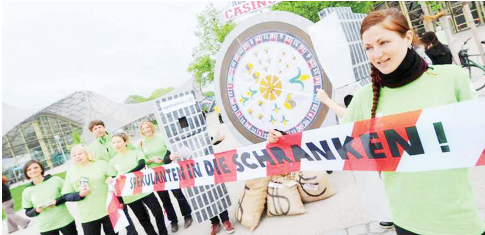
Wanaharakati wa Oxfam, wakiandamana kupinga ukosefu wa usawa wa kiuchumi.