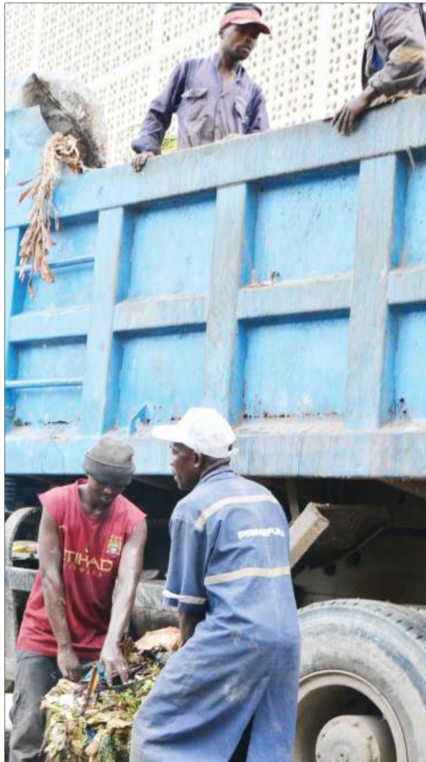
Wafanyakazi wa kuzoa taka wakifanya kazi bila kutumia vifaa maalum vya kujikinga katika Soko la Kisutu, jijini Dar es Salaam jana.