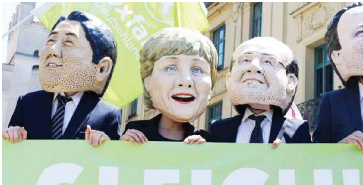
Wanaharakati wa Oxfam wakiwa wameva vikaragosi vya baadhi ya viongozi wa dunia washiriki mkutano

Hili lina-zinyima serikali rasili-mali muhimu zinazohitajika kupambana na umaskini na ukosefu wa usawa.