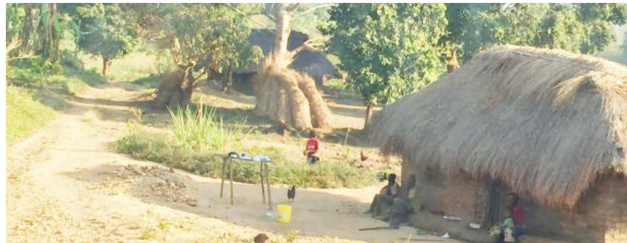
Nyumba ya mkazi ya kijiji cha Epanko, iliyoko Ulanga, katika wilaya ya Mahenge. Mkazi huyo bado hajapatiwa fidia.

“Wachimbaji wengi ni wadogowadogo ambao wamepewa leseni ya Ofisi ya Madini Kanda, lakini halmashauri haijawahi kupata hata senti moja.