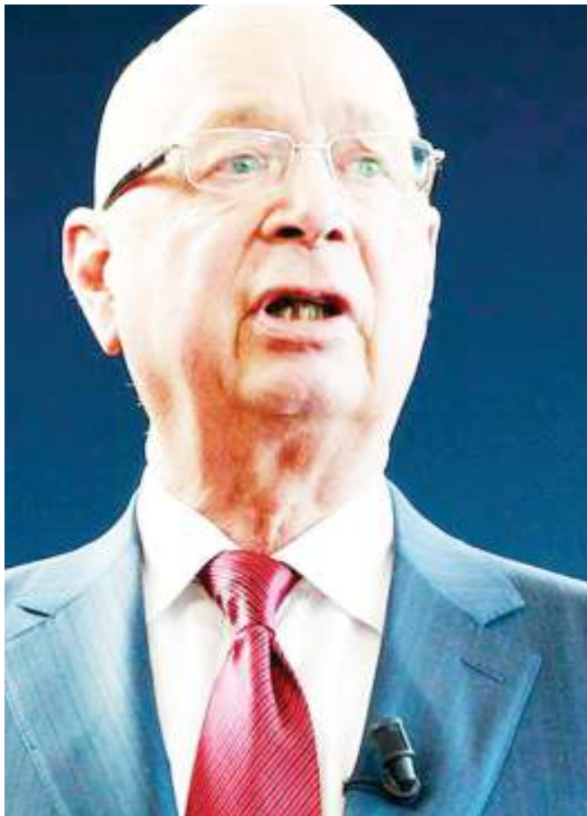
Muasisi wa mkutano wa WEF, Klaus Schwab, kutoka nchini Ujerumani.

kukabiliana na ukosefu wa usawa, Oxfam inasema pengo kati ya matajiri zaidi na wengine limetanuka zaidi katika kipindi cha miezi 12 iliyopita.