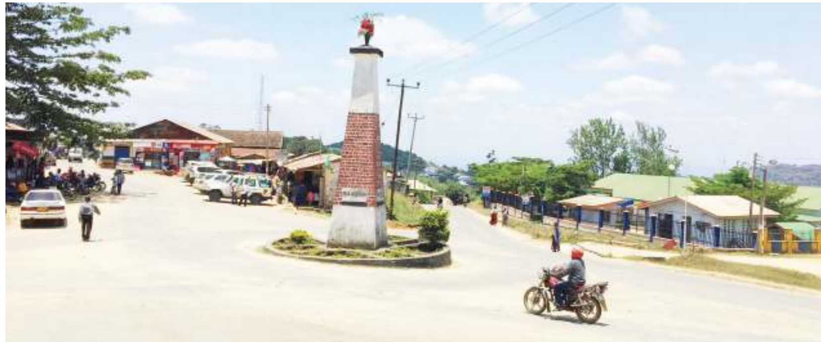
Sehemu ya mji wa Mahenge.

"Toka uchimbaji uanze halmashauri haijawahi kupata fedha yoyote. Hii ni kutokana na ukweli kuwa, wanapewa leseni na wizara (Madini), nasi tunapata ushuru, lakini imekuwa vigumu kutokana na