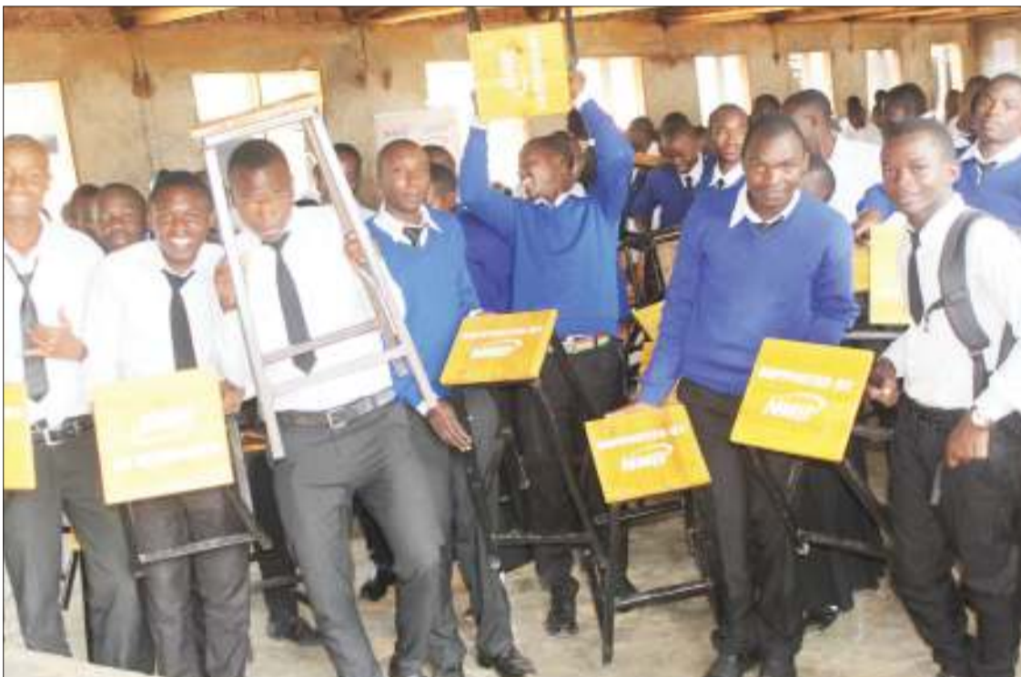
Wanafunzi wa Shule ya Sekondari Ileje, wakionyesha furaha yao baada ya kupokea msaada wa stuli 184 zenye thamani ya Shilingi milioni 5, uli-otolewa na benki ya NMB, kwa ajili ya kuboresha masomo ya sayansi katika wilaya za Ileje na Momba za jijini Mbeya juzi. Benki hiyo, pia juzi ilitoa mabati 254 kwa Halmashauri ya Tunduma wilayani Momba, madawati 50 kwa Shule ya Msingi Ny-erere na Kafule vyote vikiwa na thamani ya Shilingi milioni 25.

Alisema halmashauri kwa kushirikiana na taasisi mbalimbali kuandaa mpango kutoa elimu kwa wajawazito kuwatambua na kuwashauri umuhimu wa kupima afya zao.