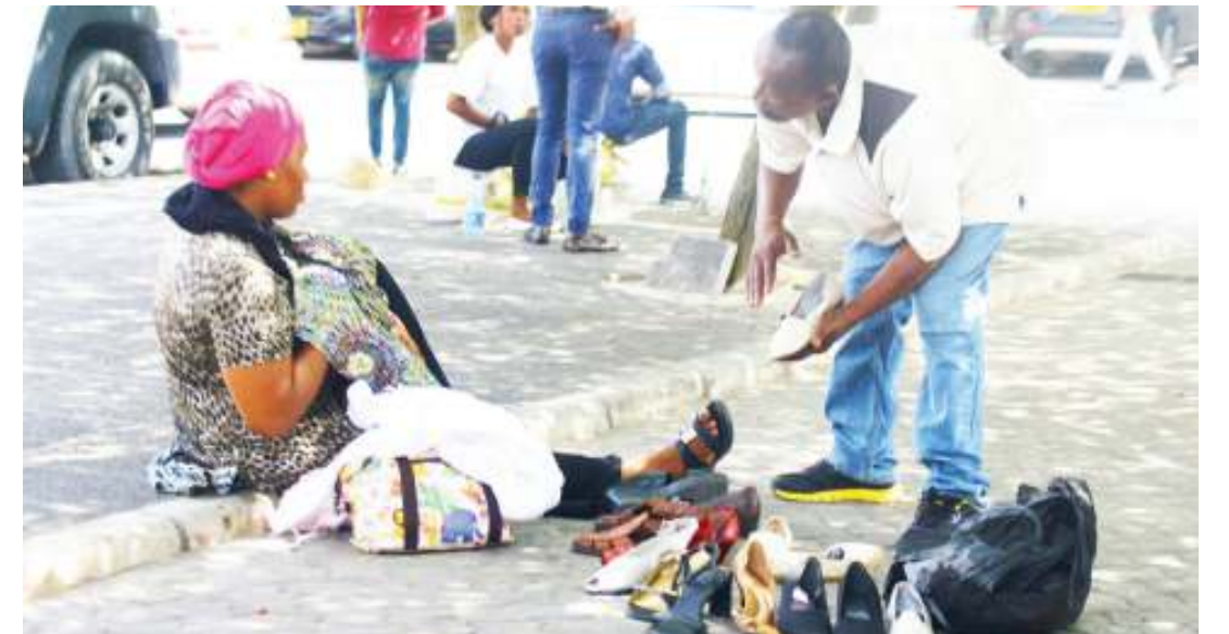
Mfanyabiashara wa viatu akimuonyesha mteja wake katika eneo la Posta jijini Dar es Salaam jana.