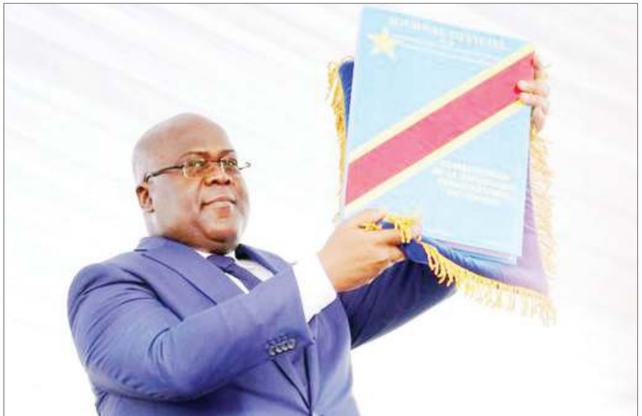
Felix Tshisekedi akiwa ameshika Katiba ya Congo baada ya kuapishwa jana, kuwa Rais wa nchi hiyo.

Hata hivyo, Tshisekedi ni lazima afanye kazi na bunge ambalo lina wabunge walio wengi wa chama tawala cha Kabila. VOA