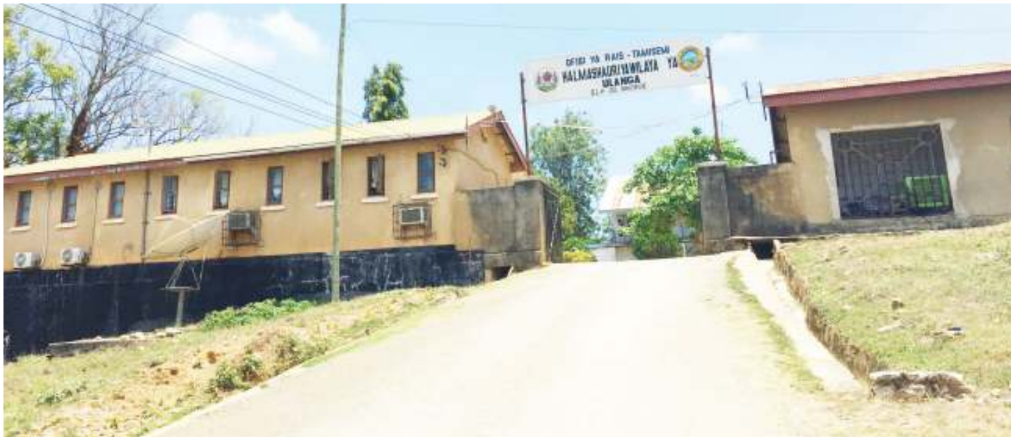
Makao Makuu ya Halmashauri ya Wilaya Ulanga.