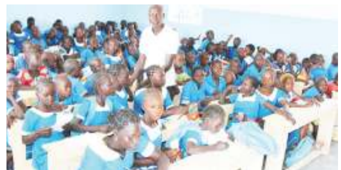
Watoto wakimbizi nchini Nigeria, wakiwa darasani.

UNESCO imetoa wito kwa serikali kuweka elimu kama kipaumbele kwa kusema, "sisi sote ni washikaduu kwenye elimu, hebu tuchukue hatua pamoja kufikia malengo". UN