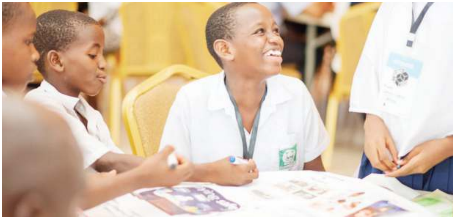
Wanafunzi wakiendelea na kazi za ubunifu, katika moja ya kumbi za Tume ya Sayansi na Teknolojia (Costech), jijini Dar es Salaam.

Wafanyakazi wa viwandani wali-tumia machapisho mbalimbali ya