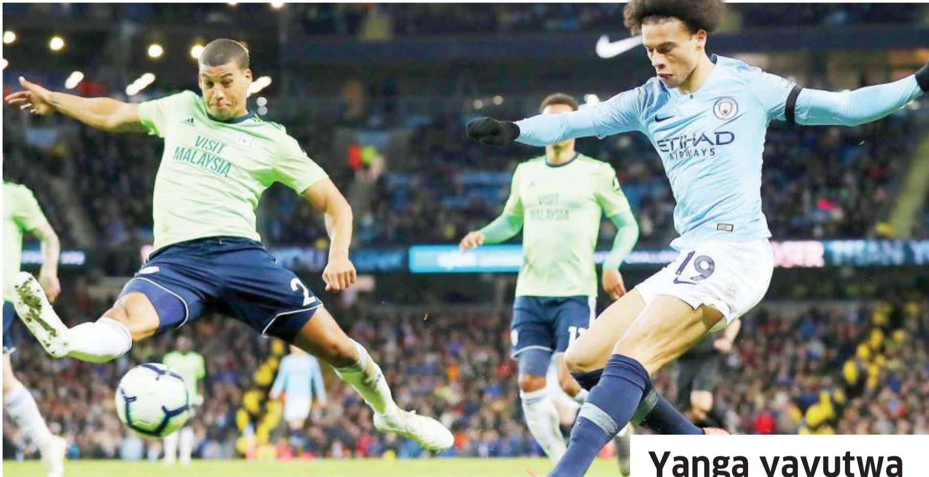
Leroy Sane (kulia) akiifungia Manchester City bao la pili wakati wakishinda 2-0 dhidi ya Cardiff kwenye mechi ya Ligi Kuu iliyopigwa Uwanja wa Etihad juzi usiku. Ushindi huo unairejesha kileleni mwa ligi hiyo kwa kuipiku Liverpool kwa pointi moja.