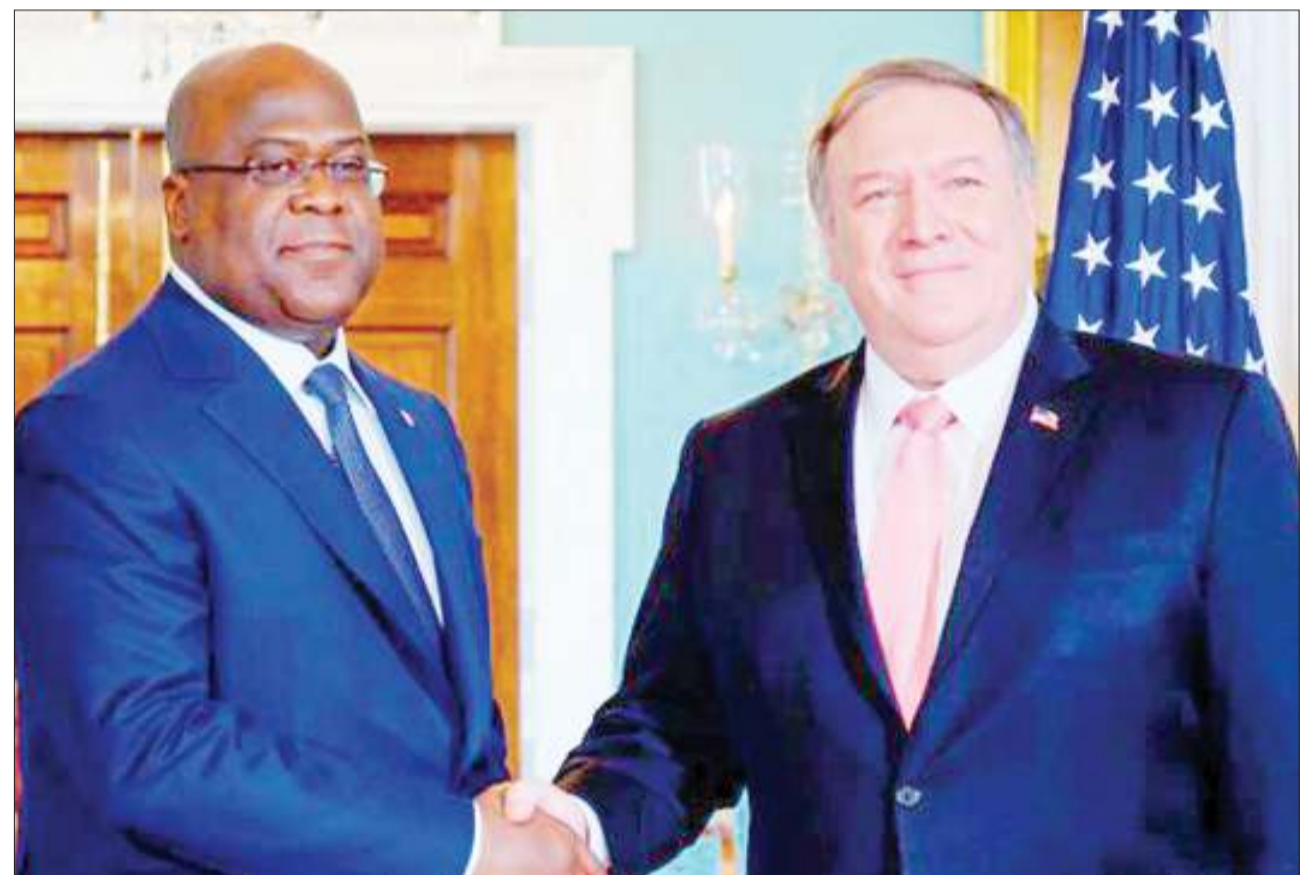
Rais wa Congo, Felix Tshisekedi (Kushoto) akiwa na Waziri wa Mambo ya Nje wa Marekani, Mike Pompeo (kulia) alipofanya ziara ya siku mbili katika nchi hiyo.

"Sawa, nyumba tulijengewa na serikali lakini kwa sasa haiko katika hali nzuri. Mvua inaponyesha, ny- umba inavuja. Walau wangesaidia kuikarabati". BBC