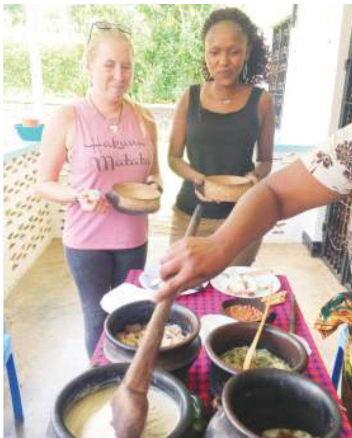
Watalii wakiangalia na kupata ufafanuzi kuhusu masuala mbalimbali ya kitamaduni, kupitia mradi wa Mweka Cultural Tourism.

“Mfano, vi-azi vikuu, magimbi, mbege na hata vyakula vya asili kama machalari, mtori, kiburu navyo vinapatikana kirahisi, katika mazingira yetu, hivyo ni rahisi kuwekeza.