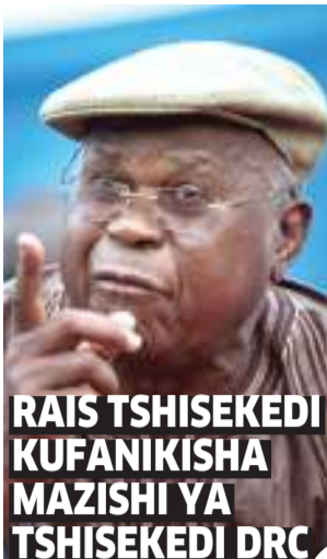
RAIS TSHISEKEDI KUFANIKISHA MAZISHI YA TSHISEKEDI DRC