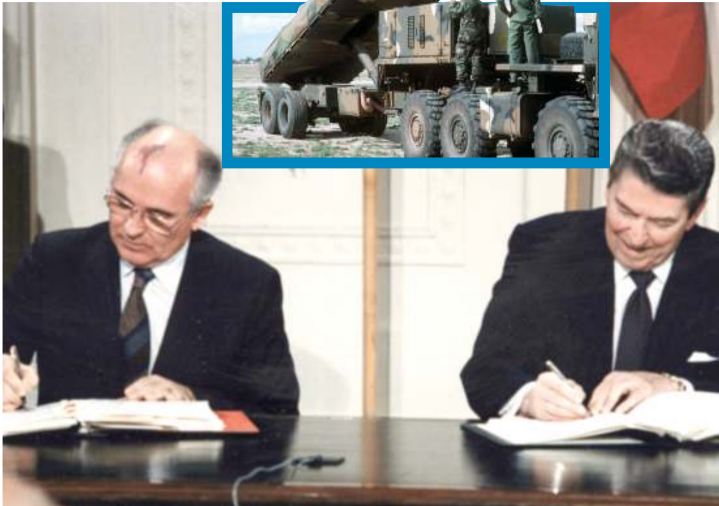
Rais Ronald Reagan wa Marekani (Kulia) na Katibu Mkuu na Kiongozi wa Urusi, Mikhail Gorbachev, walipotia saina mkataba wa kupunguza silaha za nyuklia za masafa ya kati, Desemba 8, mwaka 1987. Picha ndogo ni moja ya magari ya kurusha makombora ya masafa ya kati.

Ukiangalia idadi ya nchi ambazo tayari zimefikia uwezo wa kuwa na silaha za nyuklia, unakuta kuwa hakuna tena upenyo wa kuwa na mkataba kuhusu kuenea kwa silaha hizo, kwani 'hakuna siri ya watu wawili,' wakati tayari wapo watu wasiopungua 20 wenye siri ya utengenezaji wa silaha za