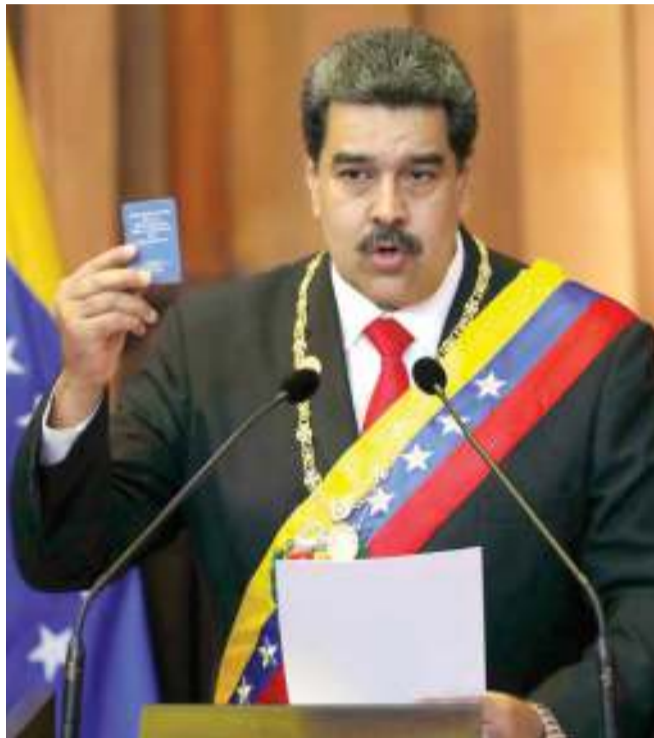
Rais wa Venezuela Nicolas Maduro.

Ni kwa maelezo kuwa unasababisha wimbi kubwa la wakimbizi na kuhatarisha mshikamano kijamii kwani nchi zinazozunguka Venezuela hazijajiandaa kupokea wakimbizi lukuki kutoka nchini humo, halafu pia serikali hiyo