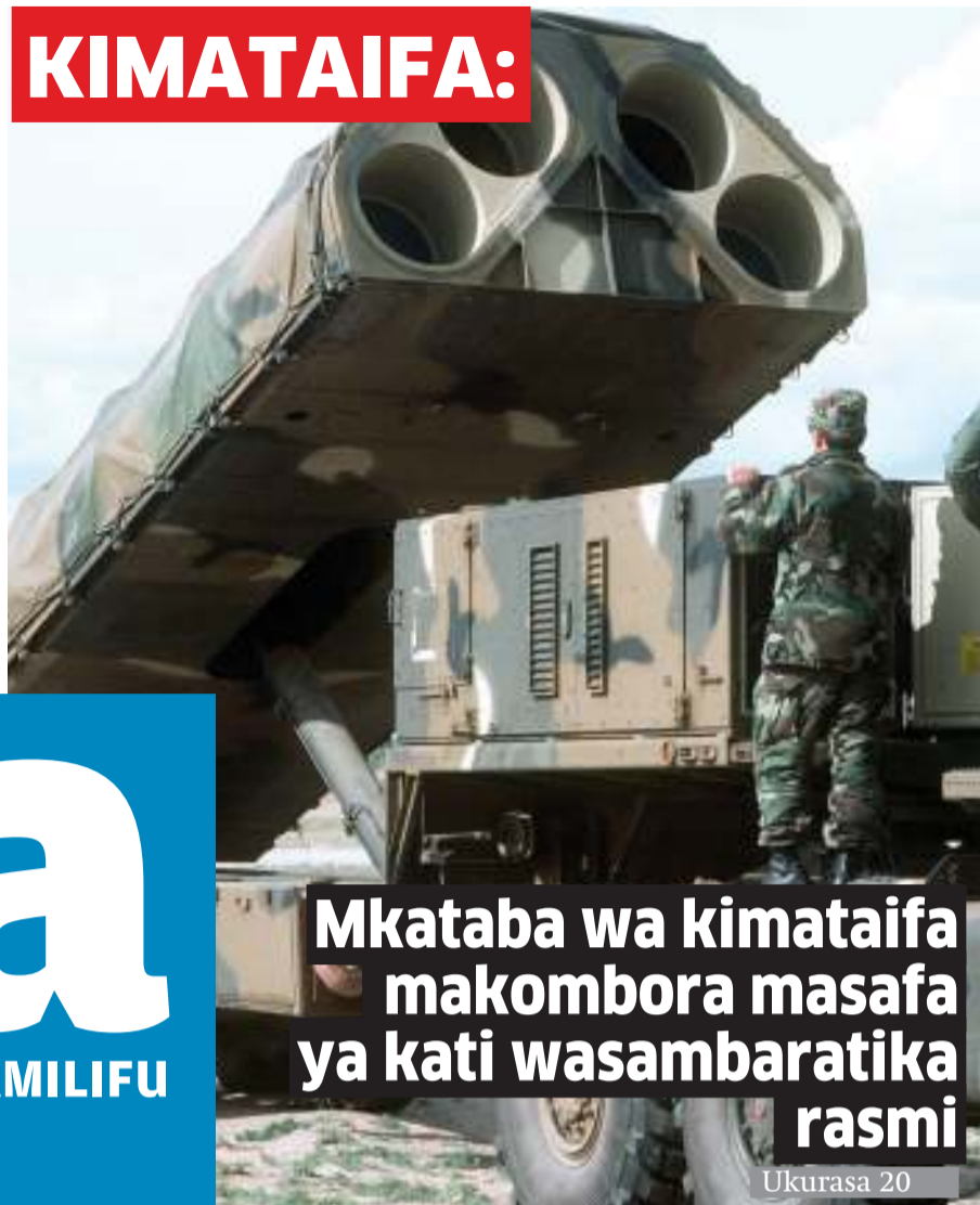
Mkataba wa kimataifa makombora masafa ya kati wasambaratika rasmi