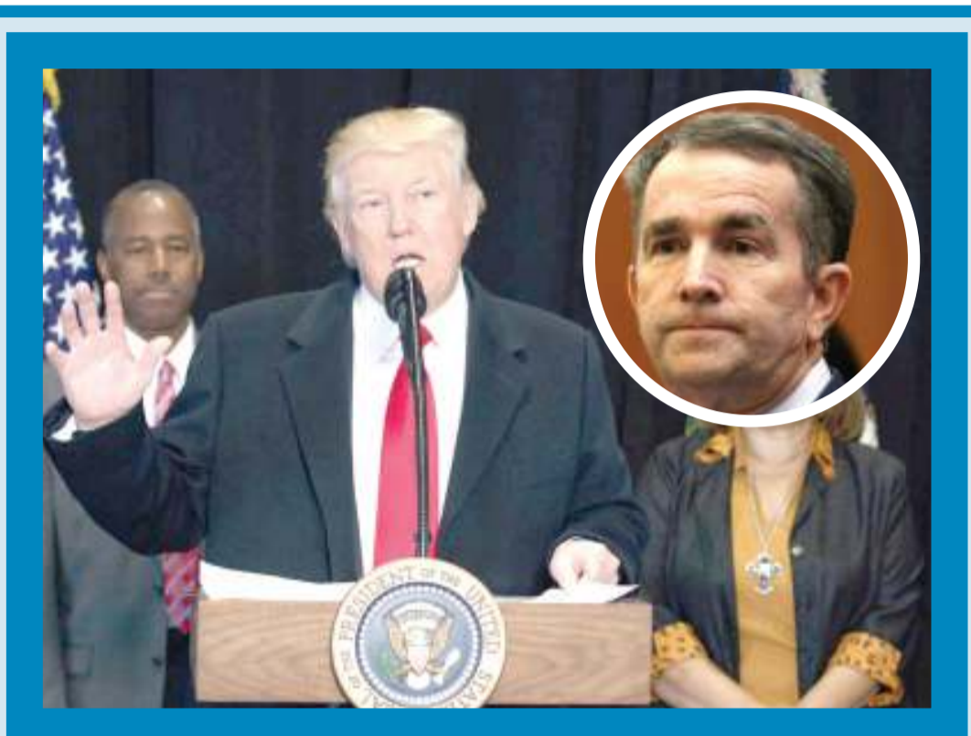
Rais Donald Trump akiwa katika moja ya Makumbusho ya Kitaifa ya Historia ya Waafrika Weusi na Utamaduni wao, katika uwanja maarufu wa National Mall. Picha ndogo ni Gavana Ralph Northam.

Makala haya yameandikwa kwa msaada wa vyanzo mbalimbali. Mwandishi wake anapitia simu namba +255 754 691540