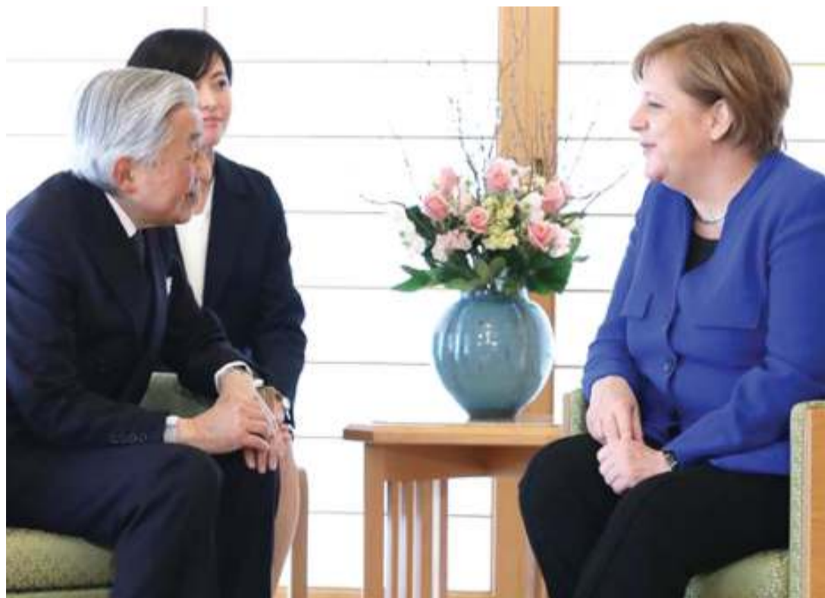
Kansela Angela Merkel wa Ujerumani (kulia), akiwa kwenye mazungumzo na mfalme wa Japan, Akihito (kushoto), nchini Japan.