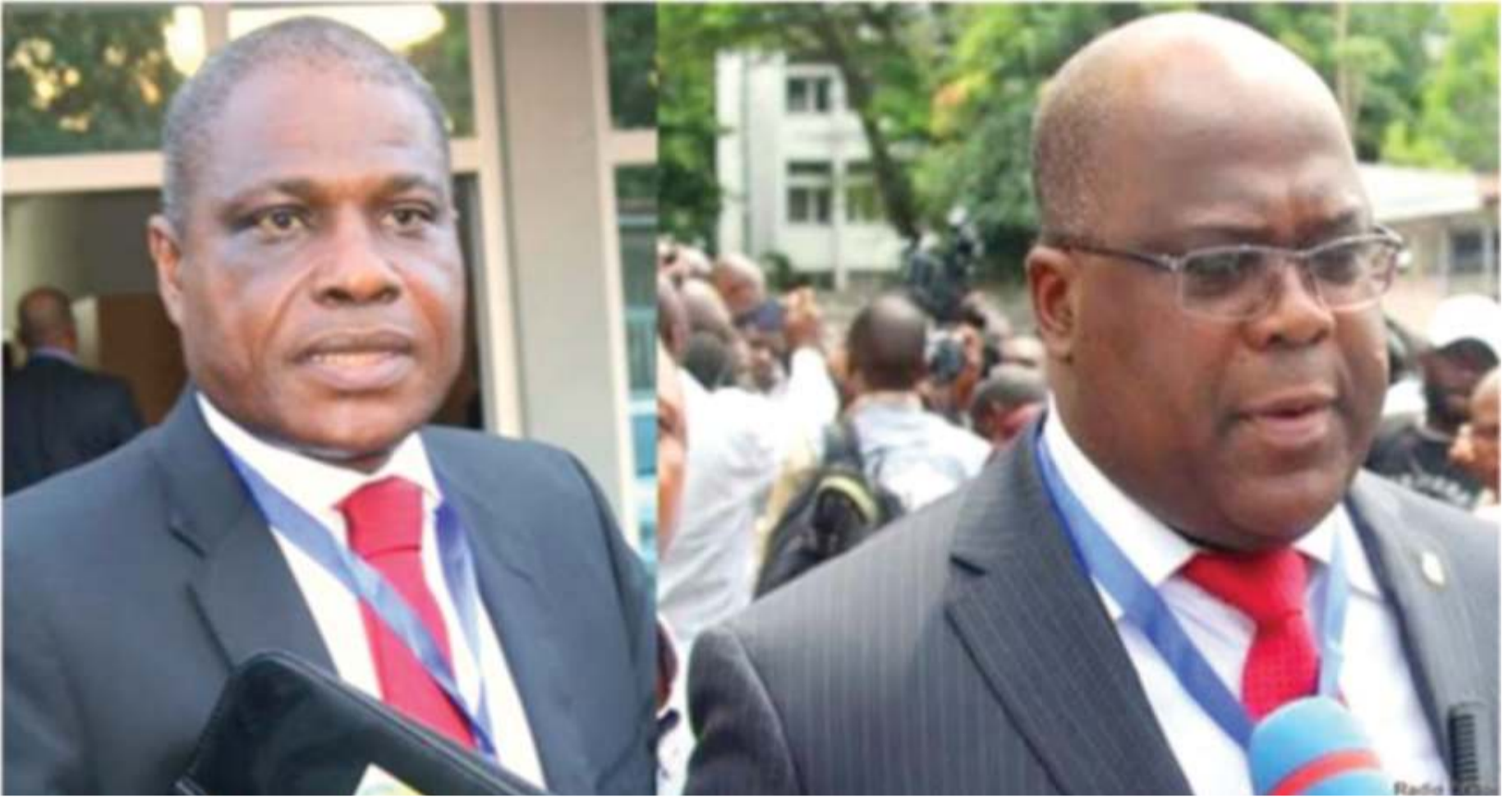
Rais Felix Tshisekedi wa DRC, na mpinzani wake Martine Fayulu.