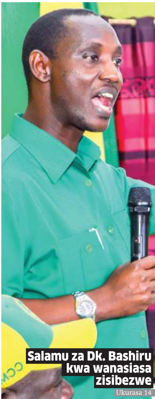
Salamu za Dk. Bashiru kwa wanasiasa zisibezwe