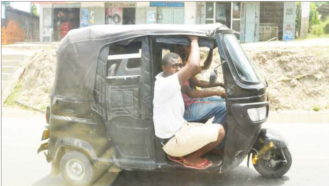
Mkazi wa Jiji la Dar es Salaam akining'inia kwenye bajaj, iliyoko kwenye mwendo, katika eneo la Mbezi Mwisho, kitendo ambacho ni hatari kwa usalama wake na uvunjifu wa sheria za usalama barabarani.

“Kituo hiki kinaweza kuwa msaada kwa jamii inayozunguka, hivyo ni vyema ikimpendeza Rais kulifanyia kazi na kufuta hati hizo au kuwaburuzi mahakamani,” alisema Hawa.