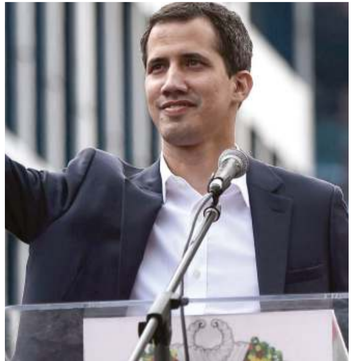
Kiongozi wa upinzani aliyejitangaza kuwa rais wa mpitio wa Venezuela Juan Guaido.