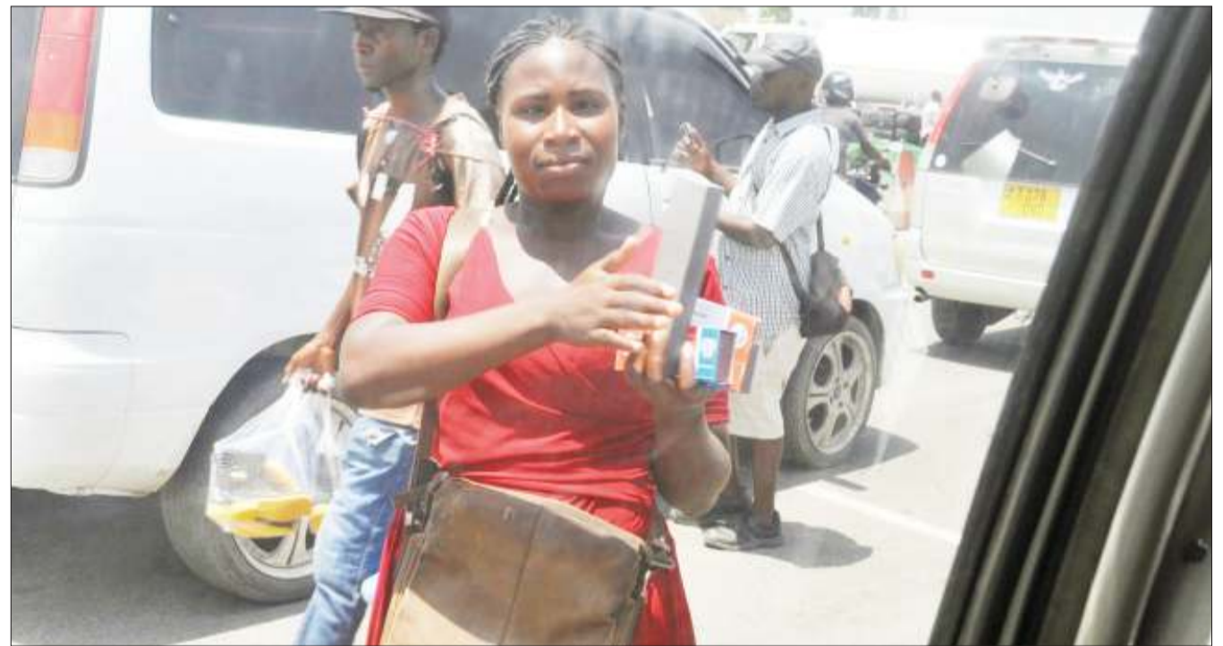
Mfanyabiashara mdogo akinadi bidhaa zake kwa abiria katika makutano ya Barabara ya Morogoro na Mandela, eneo la Ubungo, jijini Dar es Salaam jana.

Vyuo ambavyo mpaka sasa vimeingia kwenye ushirikiano na Mahakama ya Tanzania ni vyuo vikuu vya Dar es Salaam, Mzumbe, Dodoma, Ruaha, Iringa na Chuo cha Uongozi wa Mahakama Lushoto.