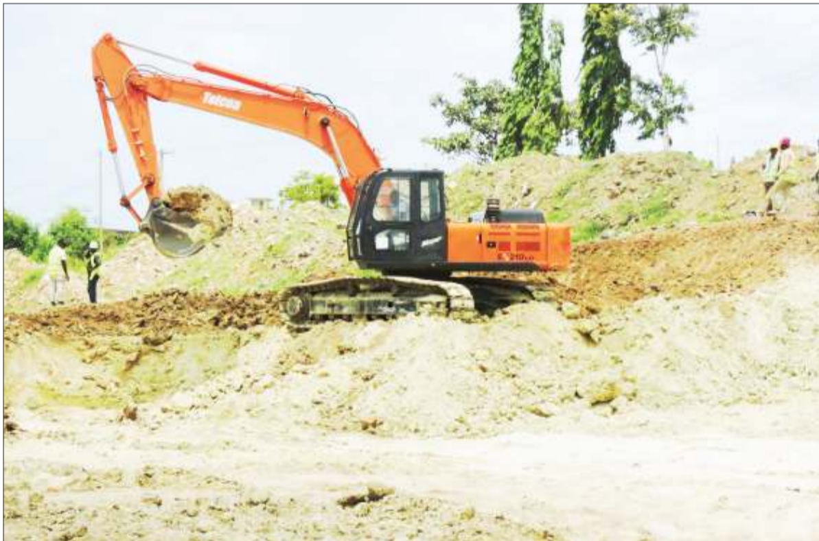
Mafundi wa kampuni ya Estim, wakiendelea na kazi ya awamu ya kwanza ya upanuzi wa Barabara ya Morogoro, jijini Dar es Salaam jana, itakayojengwa kwa njia sita kuanzia Kimara hadi Kibaha mkoani Pwani, yenye urefu wa kilomita 19, ikiwamo ujenzi wa madaraja ya Kibamba, Kiluvya na Mpiji.

Katika taarifa hiyo, Bunge lilisema wataalamu walifuatilia na kujiridhisha kuwa hakukuwa na tatizo la moto ndiyo maana Bunge lilirejea na kuendelea na kikao kama kawaida.