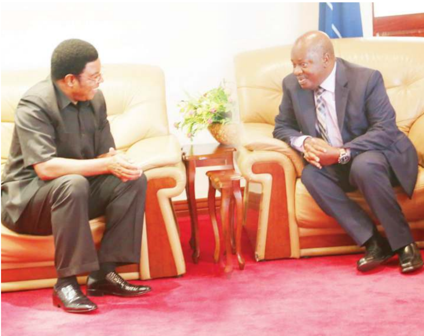
Waziri Mkuu, Kassim Majaliwa (kushoto), akiteta jambo na Spika wa Bunge, Job Ndugai, jijini Dodoma.