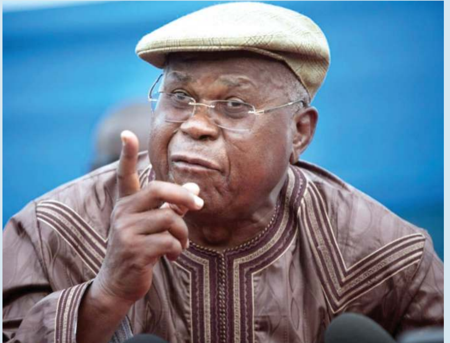
Kiongozi wa muda mrefu wa upinzani DRC, marehemu Etienne Tshisekedi ambaye ni baba mzazi wa Rais wa sasa wa DRC, Felix Tshisekedi.

Pia alimpinga kiongozi wa utawala wa kijeshi Laurent Kabila aliyeingia madara-