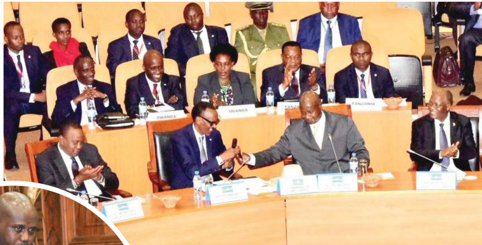
Wakuu wa nchi za EAC, Kutoka kushoto, Rais Uhuru Kenyatta wa Kenya, Paul Kagame wa Rwanda, Yoweri Museveni wa Uganda na John Magufuli wa Tanzania.

Sasa hapa sijajua EAC wata-simama wapi ama labda wana ujuzi wa ziada, lakini ninavyojua mimi wao ndio wasuluhishi ambao Burundi imewakimbilia, kisha Mwenyekiti akawa ni kiongozi wa nchi inayolalamikiwa...tuwape nafasi kwa maana lazima mgogoro huo utatuliwe."