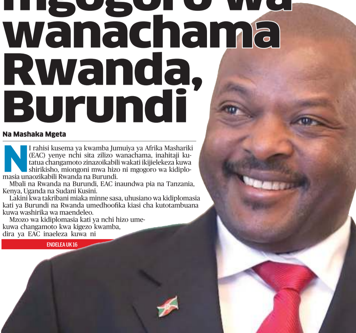
Rais Pierre Nkurunziza