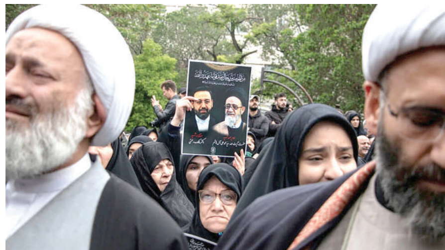
Wananchi Iran wakiandamana barabarani ishara ya maombolezo baada ya kifo cha Rais Ebrahim Raisi, Waziri wa Mambo ya Nje na viongozi wengine, jana.