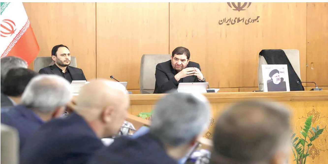
Rais wa mpito wa Iran Mohammad Mokhber, akiongoza kikao cha baraza la mawaziri, jana.

• Kaimu rais asema hakuna kitakachoharibika