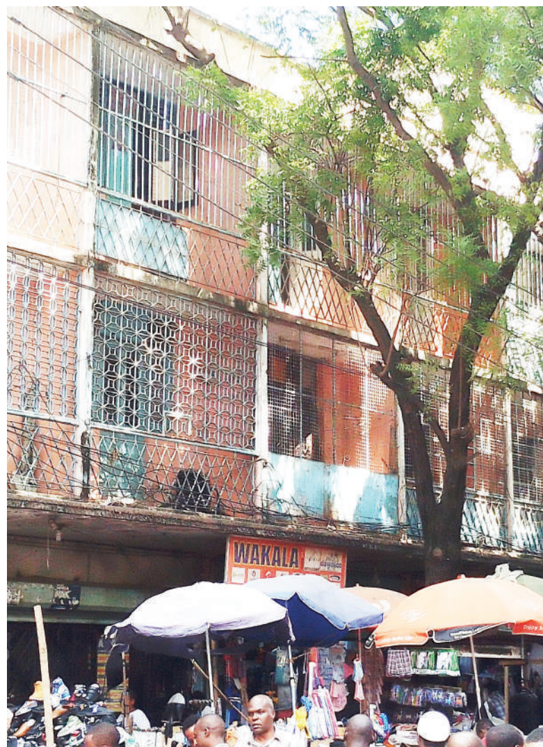
Moja ya majengo yakiwa yamewekwa vyuma 'grill' kwenye maeneo yote ya nyumba kitendo ambacho ni hatari endapo itatokea ajali ya moto kwani itakuwa vigumu katika uokoaji, kama ilivyonaswa na kamera yetu katika Mtaa wa Tandamti, eneo la Kariakoo, jijini Dar es Salaam jana.

Alisema inadhaniwa mtuhumiwa huyo ana changamoto ya afya ya akili kwa muda mrefu.