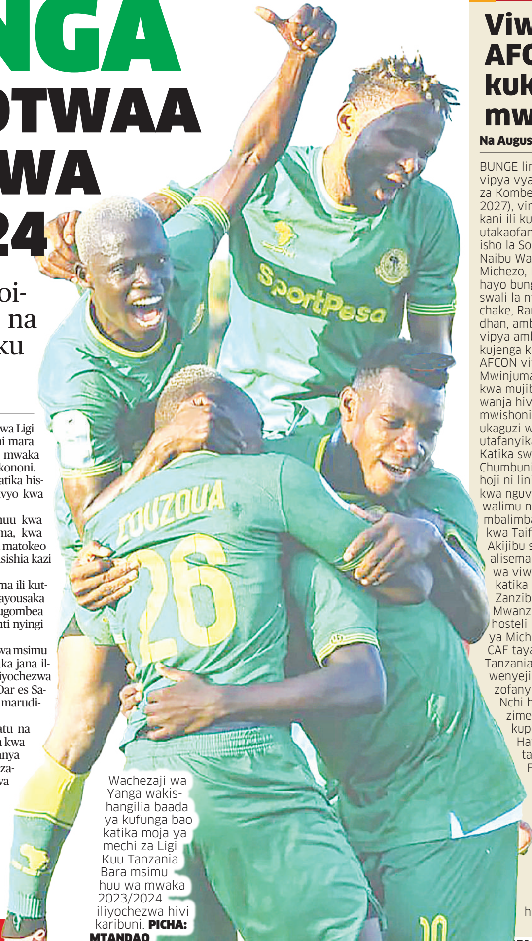
Wachezaji wa Yanga wakishangilia baada ya kufunga bao katika moja ya mechi za Ligi Kuu Tanzania Bara msimu huu wa mwaka 2023/2024 iliyochezwa hivi karibuni.