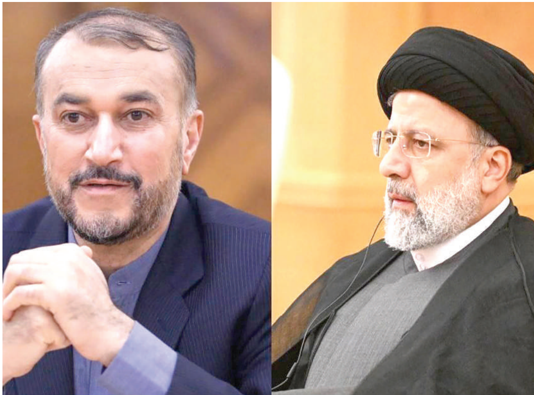
Rais wa Iran Ebrahim Raisi (kulia) na Waziri wa Mambo ya Nje Hossein Amir-Abdollahian, enzi za uhai wao.

baada ya kushinda uchaguzi, akiingia madarakani kutoka mhimili wa mahakama. Ni mzaliwa wa mji wa Mashhad na alisifika kuwa kiongozi mwenye ushawishi mkubwa Iran na ndani ya mataifa ya Kiislamu. Kadhalika