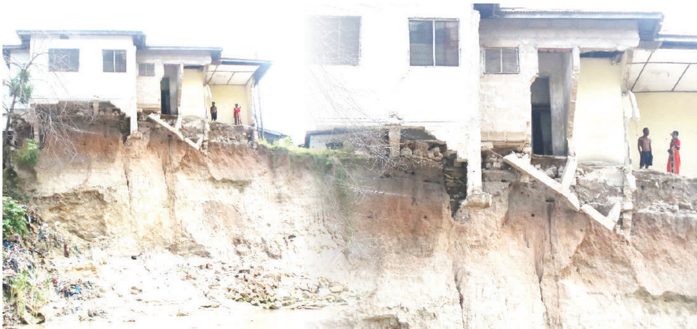
Hali ilivyo katika Mtaa wa Mabibo Mgundini, Kata ya Mabibo wilayani Ubungo, Dar es Salaam.