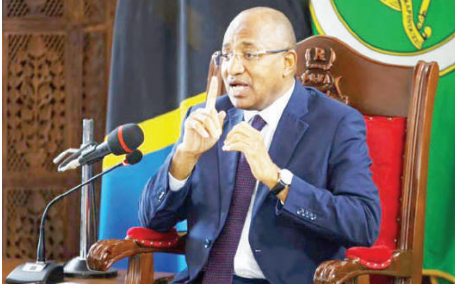
Rais wa Zanzibar na Mwenyekiti wa Baraza la Mapinduzi, Dk. Hussein Mwinyi

Uimara, ubora na uwajibikaji wa Rais Mwinyi ni pamoja na eneo hili la kukusanya mapato ya taifa kikamilifu na kwa ufansi.