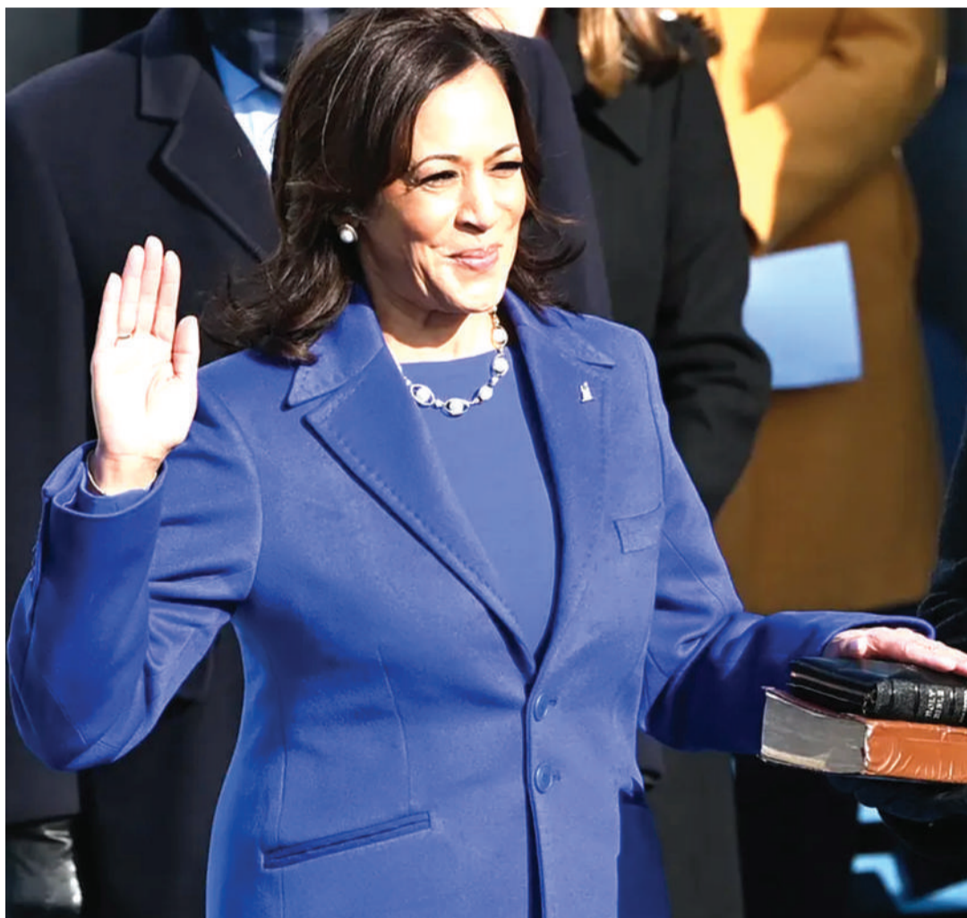
Kamala Harris