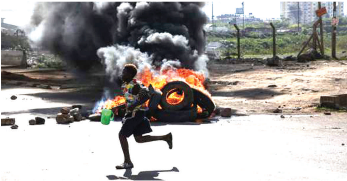
Mwananchi aliyekutwa na kamera jirani na eneo ambalo lilikuwa linachomwa moto matairi, kutokana na vurugu za baadhi ya waandamanaji nchini Kenya. Mamlaka Huru ya Kusimamia Polisi nchini Kenya (Ipoa), imesema inachunguza matukio mawili ya siku ya juzi.