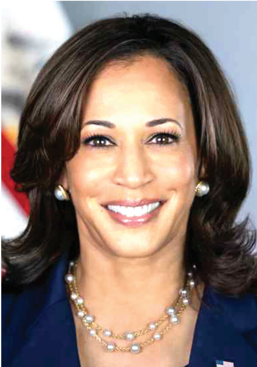
Kamala Harris.

Harris anayekaribia miaka 57 sasa ni binti wa wahamiaji kutoka Jamaica na India. Mwanamama huyu amewahi kuwa