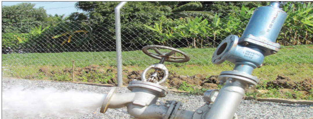
Bomba likitema mvuke unaotoka ardhini 'jotoardhi' ili kuzalisha umeme.