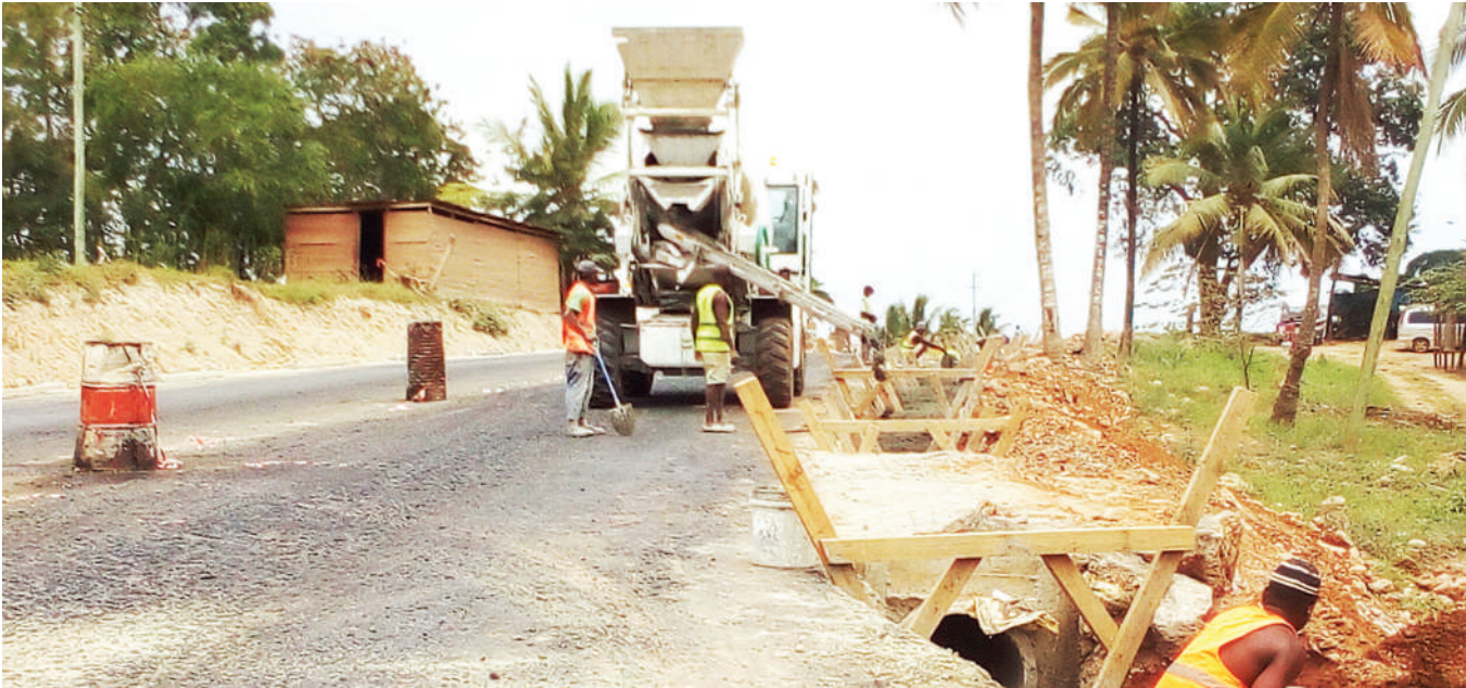
Mafundi wakiendelea na kazi ya ujenzi wa mifereji ya maji ya mvua katika barabara ya Matosa, mkoani Dar es Salaam jana.