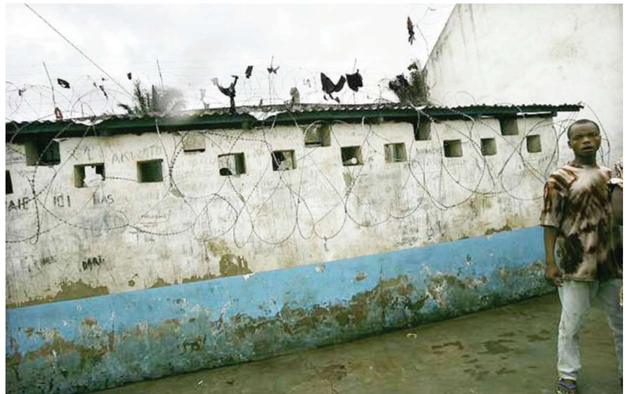
Vikosi vya usalama nchini Jamhuri ya Kidemokrasia ya Congo, vinawasaka zaidi ya wafungwa 800 wali-ofungwa katika gereza kuu la Kakwangura katika jimbo la Kivu Kaskazini baada ya kutoroshwa na waasi wenye silaha.

heshimu uhuru wa Mali na matarajio ya watu wake." Jumanne, jeshi la wanaahewa la Mali lilizindua rasmi ndege kadhaa mpya za kivita zilizotolewa na Russia wakati wa hafla iliyoongozwa na Rais Goita katika uwanja wa ndege wa kimataifa wa Bamako. Ndege za kivita za enzi ya Usoviet ni kundi la hivi karibuni za usafirishaji wa kijeshi kutoka nchini humo chini ya uhusiano wa karibu kati yake na Mali tangu jimbo la Sahel lilipokumbwa na mapinduzi Agosti 2020. Mali imeegemea Russia baada ya kutofautiana na nchi za Magharibi, hususan Ufaransa, ambayo inapinga uwepo wa mamluki wa Wagner katika ukanda wa Sahel.