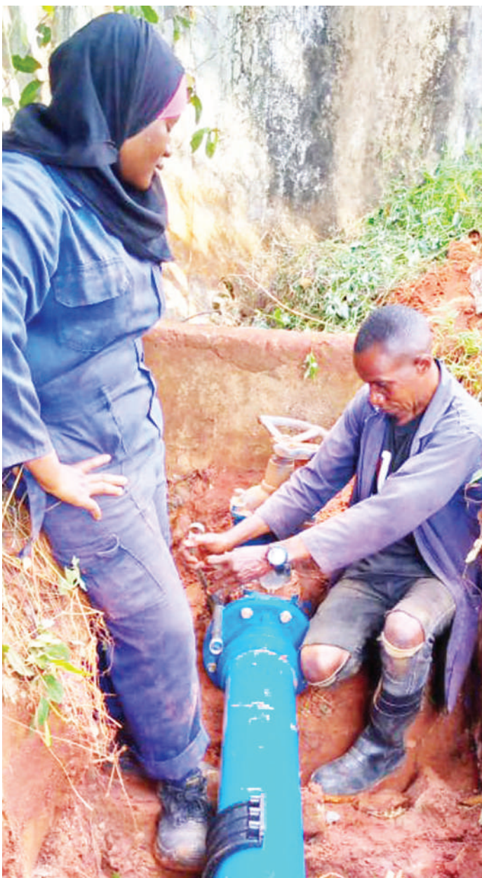
Mafundi wa Mamlaka ya Majisafi na Usafi wa Mazingira Dar es Salaam (DAWASA), wakifanya maboresho ya miundombinu ya maji katika eneo la Majohe, jijini Dar es Salaam juzi.