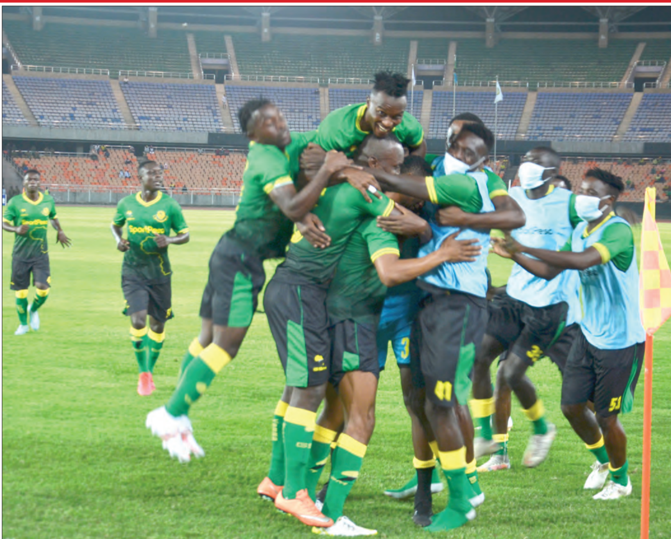
Wachezaji wa Yanga wakishangilia baada ya straiika wao, Waziri Junior kufunga bao katika mechi ya Kundi A ya mashindano ya Kombe la Kagame dhidi ya Nyasa Big Bullets iliyochezwa kwenye Uwanja wa Benjamin Mkapa jijini Dar es Salaam juzi. Timu hizo zilitoka sare ya bao 1-1.

"Tutakutana leo (jana), baada ya hapo sasa tutaanza mchakato wa kujaza nafasi kama tulivyoshauriwa, bado hatujafanya mazungumzo na mchezaji wowote kwa sababu hatukuwahi kukutana na kujadili ripoti ya ufundi," alisema kiongozi huyo.