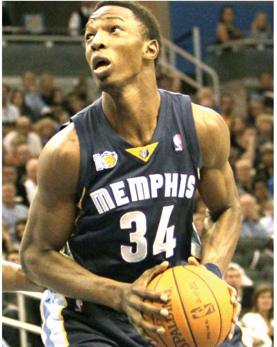
Hasheem Thabeet, alipong'ara kwenye Ligi ya mpira wa Kikapu Marekani. Vijana wenye vipaji wakiandaliwa wanaweza kufikia mafanikio makubwa.

"Nasisitiza wizara kuangalia mitaala iliyopo kama inakidhi mahitaji ya sasa na kuchukua hatua stahiki pale ambapo kutaonekana kuna upungufu, nihimise kuboreshwa kwa vyyo vya ualimu na viimarishie masomo ya elimu kwa michezo, hatua itakayomwezesha kila mhitimu kuwa na ujuzi wa ufundishaji wa michezo," anasema Waziri Majaliwa.