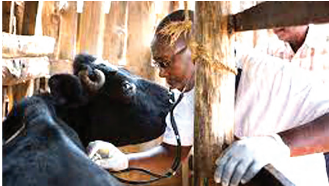
Mifugo ikishatibiwa kuna walakini wa kanuni za kuzingatia muda stahiki wa kuuza nyama na maziwa. PICHA: MTANDAO

Anasema utamaduni huo ume-sababisha baadhi ya jamii kuen-deleza ulaji wa mlo wa aina moja kwa miaka mingi na kusababisha udumavu, udhaifu na maradhi yanayohusiana na lishe duni. Hata hivyo, kubwa zama hizi ni kula vyakula vilivyochakachuliwa na kuchafuliwa tena vinavyoumiza.