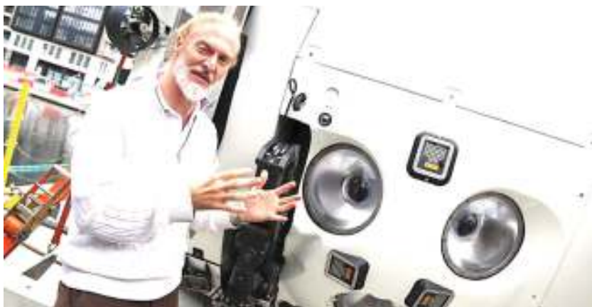
Victor Vescovo, akiwa ndani ya chombo chake.