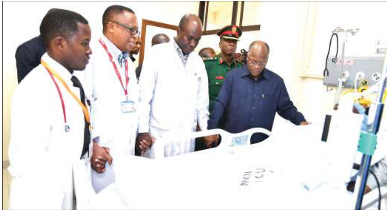
Rais John Magufuli akimjulua hali Askofu Mkuu wa Jimbo Katoliki la Dar es Salaam, Mhashamu Yuda Thadeus Ruwa'ichi anayepatiwa matibabu katika Taasisi ya Mifupa Muhimbili (MOI), jijini Dar es Salaam juzi.