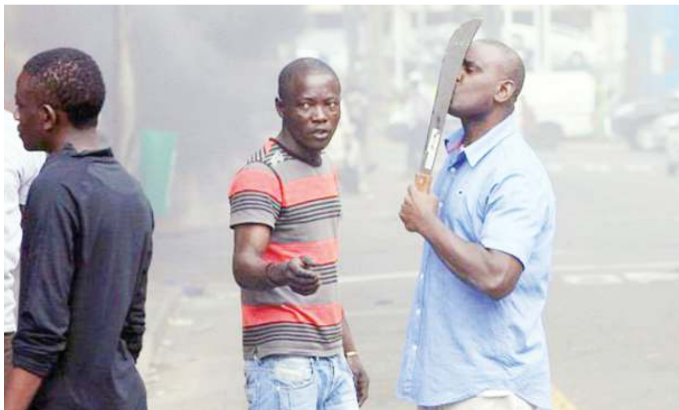
Raia wa Afrika Kusini akiwa ameshika Panga kwa ajili ya kuwadhuru wageni waliopo nchini humo.

Alisema chini ya makubaliano hayo, serikali ya Rwanda itapewa, lakini pia itatoa ulinzi kwa wakimbizi na waomba hifadhi ambao hivi sasa wanashikiliwa kwenye vituo huko Libya. DW