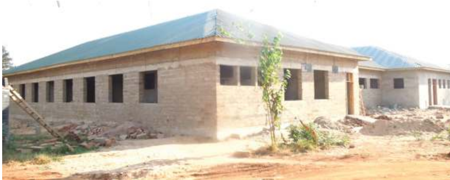
Jengo la wodi mpya ya kinamama na watoto, katika Hospitali ya Wilaya Nachingwea.

Anasema, mbali na ujenzi wa zahanati na vituo vya afya, wameanza kupunguza kero ya maji kwa