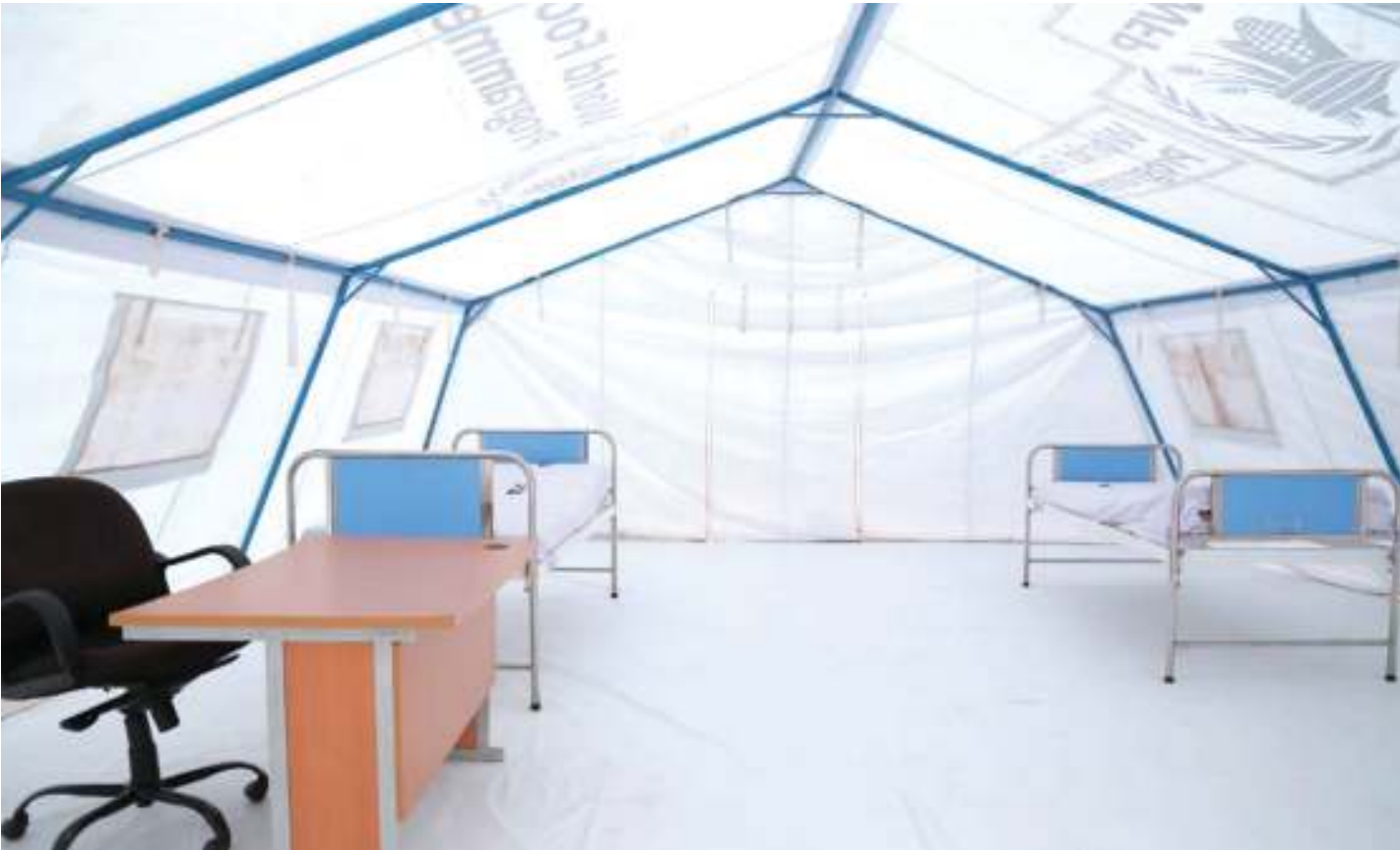
Eneo maalum la kuwaweka wanaohisiwa na ugonjwa wa Ebola.