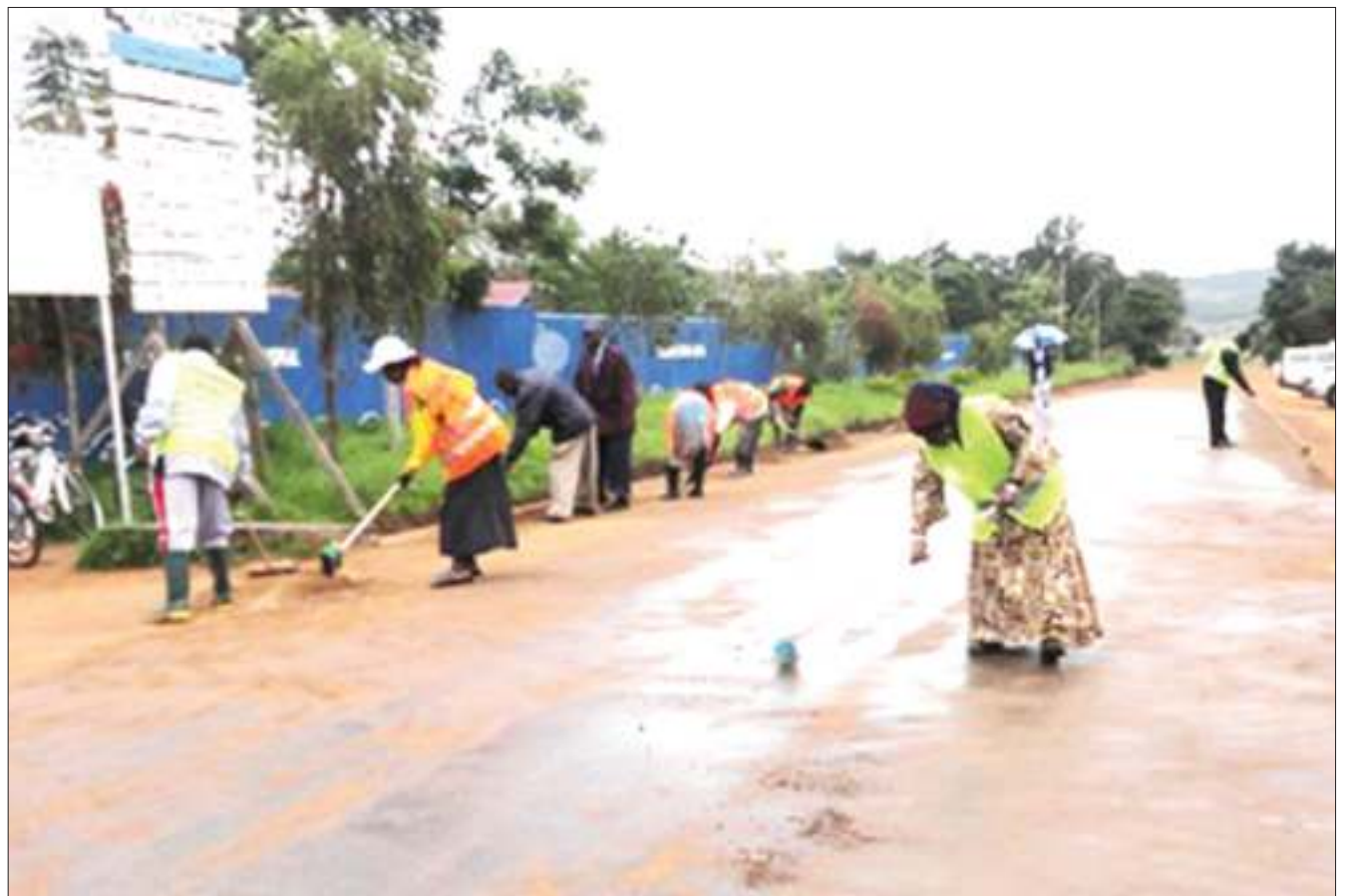
Shughuli za ufagaji barabarani, kinamama wakiwa sehemu ya waajiriwa.