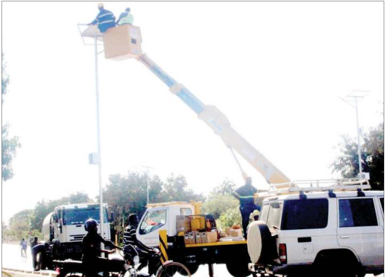
Mafundi wa Wakala wa Barabara (TANROADS) mkoani Shinyanga, wakifunga taa kwenye barabara kuu ya kutoka Tabora kwenda Mwanza, zinazotumia umeme wa jua mkoani humo jana.

Aliwasihi watoto hao kujilinda dhidi ya vitendo vya udhalilishwaji kwani kuna baadhi ya watu wanatumia mbinu mbalimbali za kuwaadaa watoto kwa nia ya kuwadhalilisha.