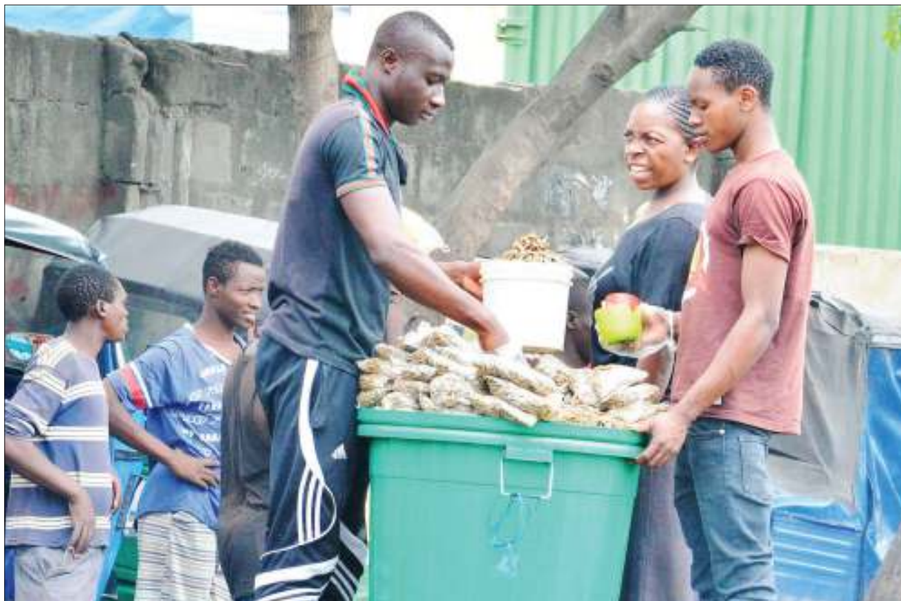
Mchuzi wa dagaa (kushoto), akiwashawishi wateja kununua bidhaa yake pembeni ya barabara katika eneo la Mabibo Sokoni, jijini Dar es Salaam jana. Mfuko mmoja uliuzwa kwa bei ya 1,000/-.

Alitaja maeneo hayo kuwa ni pamoja na Jiji la Dar es Salaam, Dodoma na miji ya Kibaha na Bagamoyo ambayo imesheni viwanda ambavyo hutegemea rasilimali maji katika kujiendesha.