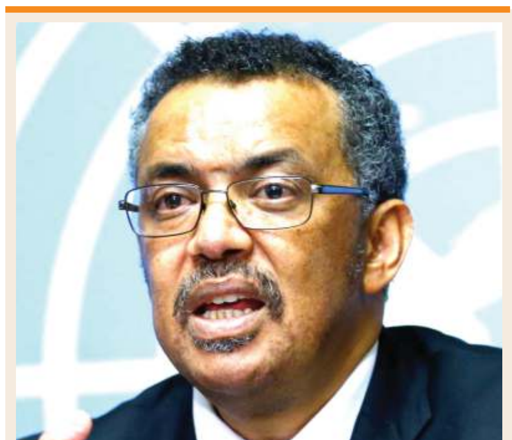
Mkurugenzi Mkuu WHO, Tedros Adhanom Ghebreyesus.

"Kampeni yetu hii ya 'Nyumba ni Choo' tutazunguka nchi nzima. Kuna baadhi ya mikoa tayari tumeshapita na sasa tupo hapa Shinyanga. Lengo letu ni kuhamasisha usafi wa mazingira, kwa wananchi kujenga vyoo bora kwenye nyumba zao, na kuacha kujisaidia ovyo na kusababisha