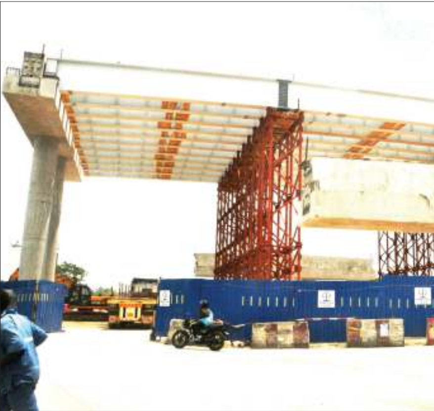
Mwonekano wa sehemu ya ujenzi unaoendelea wa barabara za mpishano (Ubungo Interchange), katika eneo la mataa ya Ubungo, jijini Dar es Salaam jana.