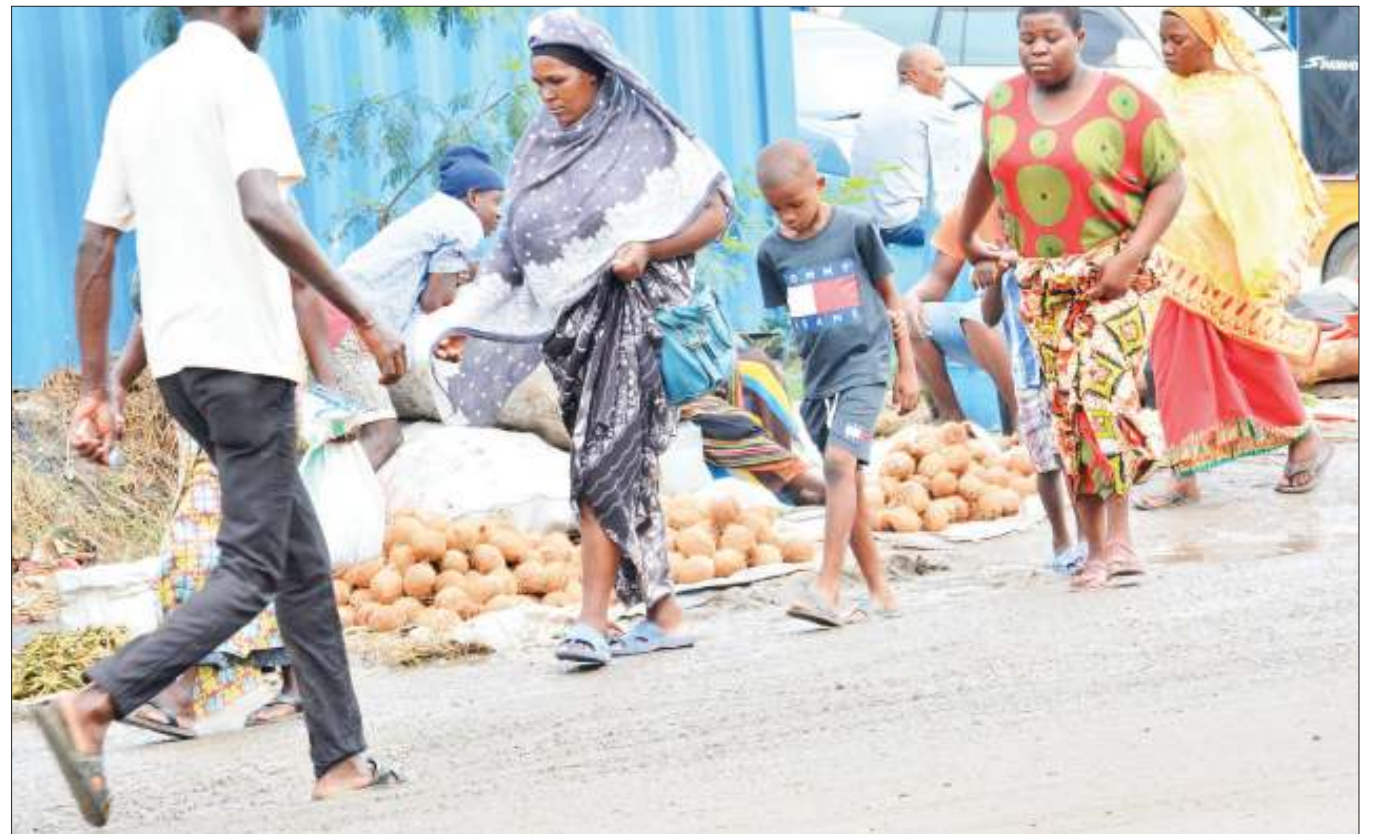
Wachuuzi wakiwa wamepanga bidhaa zao katika mazingira hatarishi kiafya kutokana na matope mengi yaliyowazingira katika eneo la Mabibo, jijini Dar es Salaam jana.

“Serikali kupitia idara mbalimbali imejitahidi kutoa elimu ya wazazi na walezi kuzingatia milo kamili na kuzalisha vyakula vyenye virutubisho, lakini wamesahau elimu ya malezi kwa watoto,” alisema Mwasandube.