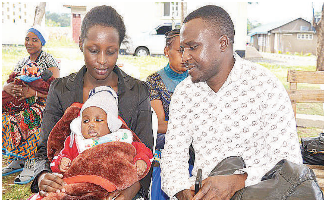
*Wazazi wakishiriki huduma za kliniki wilayani Meru.

ibabu hayo viko sita, ambazo ni: Hospitali ya Taifa Muhimbili (MNH); Taasisi ya Saratani ya Ocean Road; Taasisi ya Moyo ya Jakaya Kikwete; Taasisi ya Mifupa na Mishipa ya Fahamu Muhimbili (MOI); Hospitali ya Aga Khan na Hospitali ya Saifee.