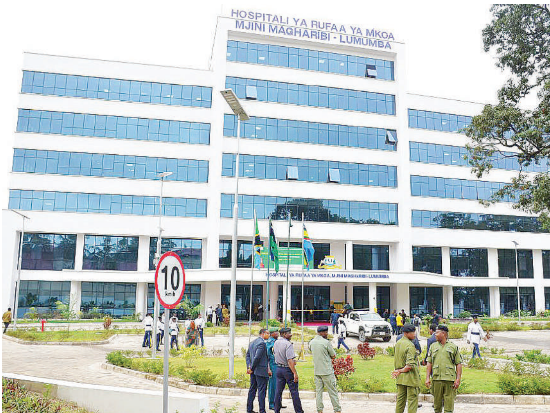
Hospitali mpya ya Lumumba, iliyoko Zanzibar.