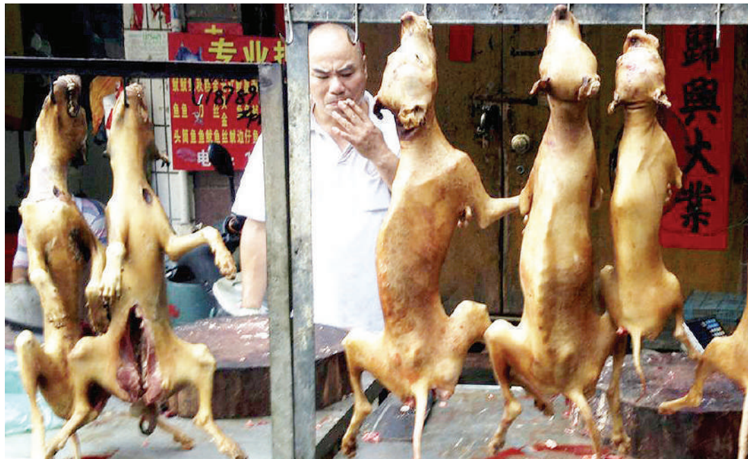
Nyama ya mbwa inayoandaliwa.

Ni tukio lililowashangaza wengi wakati wa michezo ya Olimpiki mjini Seoul mwaka, Korea, Kusini mwaka 1988 wa wakati huo, tukio kubwa la kimataifa ambalo Korea Kusini iliwahi kuandaa na