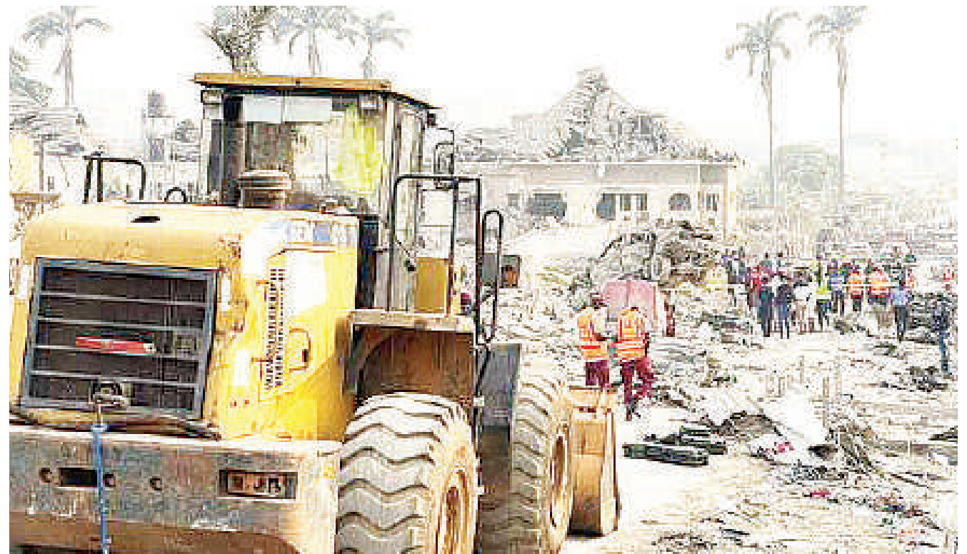
Maofisa wa uokoaji wakiwa katika eneo lililokumbwa na mlipuko jana Nigeria.

Hata hivyo Mackenzie na watuhumiwa wenzake wamekuwa mahabusu kwa zaidi ya miezi saba tangu mwezi Mei 2023 hadi sasa. RFI