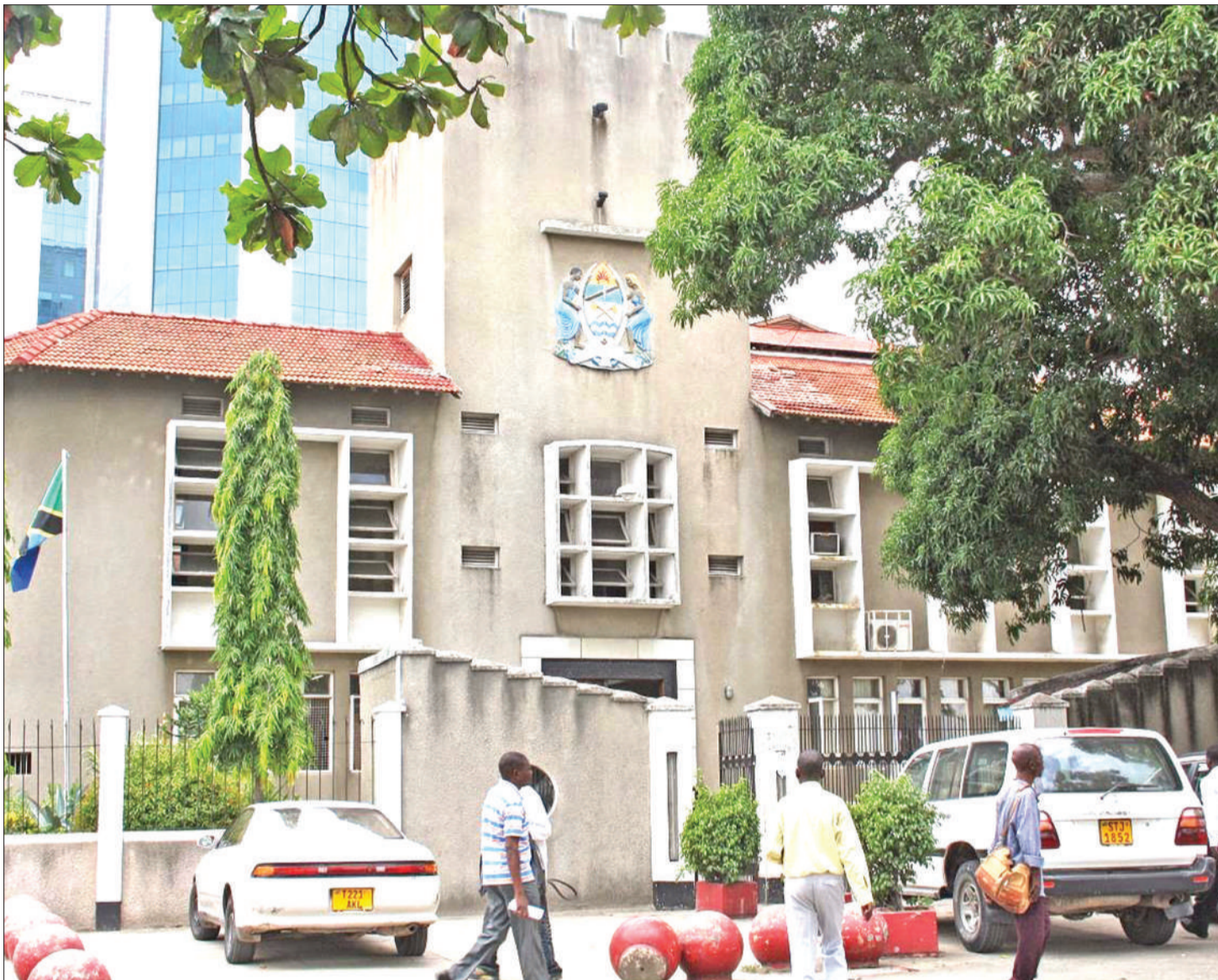
Baadhi ya wanasiasa na viongozi wamefikishwa kwenye Mahakama Kuu Divisheni ya Makosa ya Rushwa na Uhujumu Uchumi.