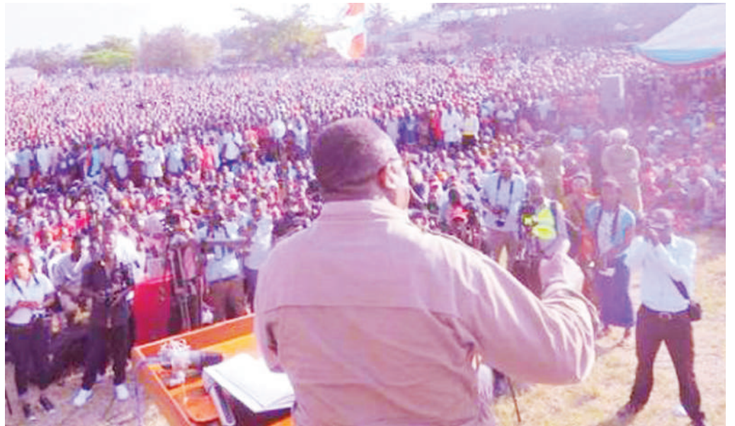
Mgombea urais kupitia CHADEMA, Tundu Lissu, akihutubia mkutano wa kampeni katika viwanja vya Furahisha, jijini Mwanza jana.