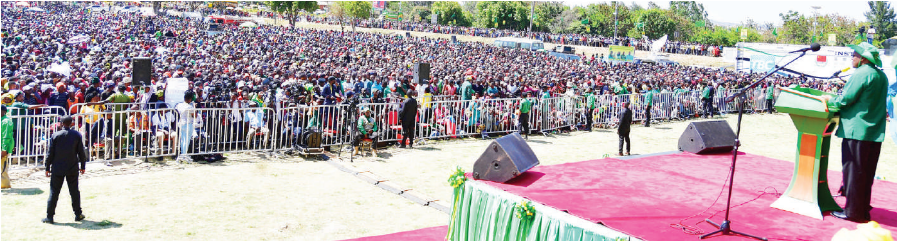
Mgombea urais kupitia CCM, Rais John Magufuli, akizungumza na wananchi wa Mkoa wa Singida kwenye mkutano wa kampeni katika uwanja wa Bombardier, mjini Singida jana.

• JPM asema umeme vijiji vyote miaka miwili ijayo, ACT-Wazalendo yaahidi uchumi wenye tija, Lissu atamba kuleta neema ... Endelea ukurasa 2, 4