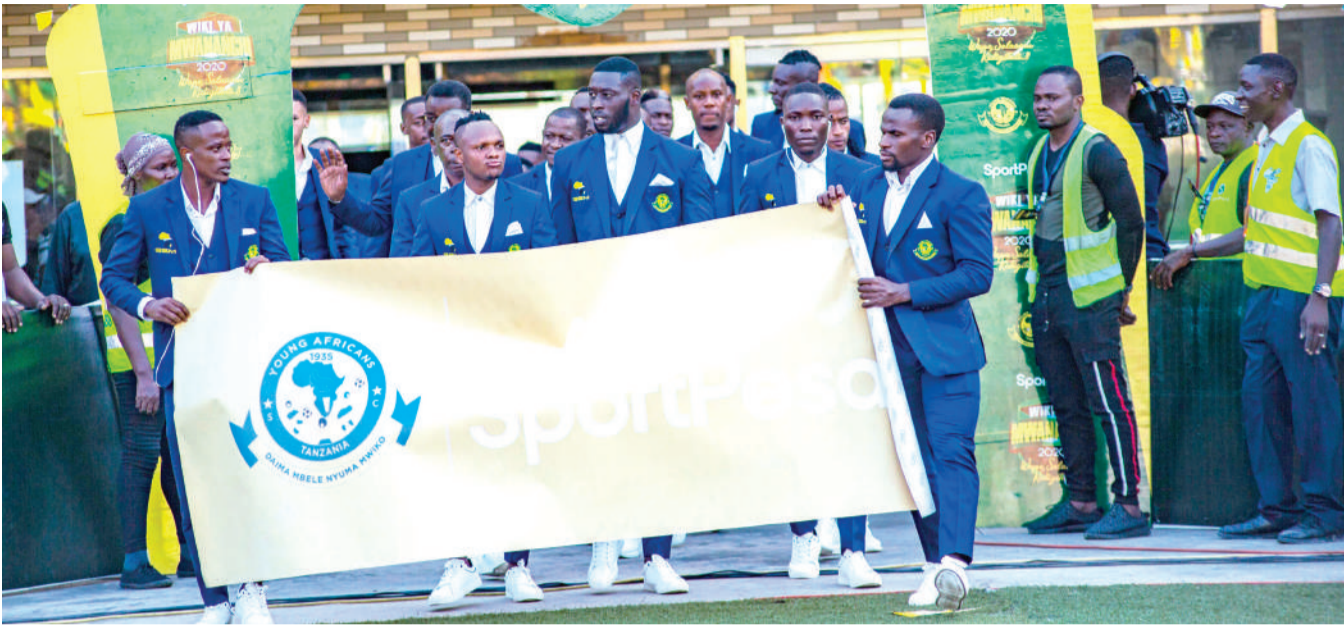
Wachezaji wa Yanga wakiingia na bango la shukrani kwa wadhamini wao Kampuni ya SportPesa katika siku ya kilele cha Wiki ya Wananchi iliyofanyika Jumapili iliyopita kwenye Uwanja wa Mkapa jijini, Dar es Salaam.