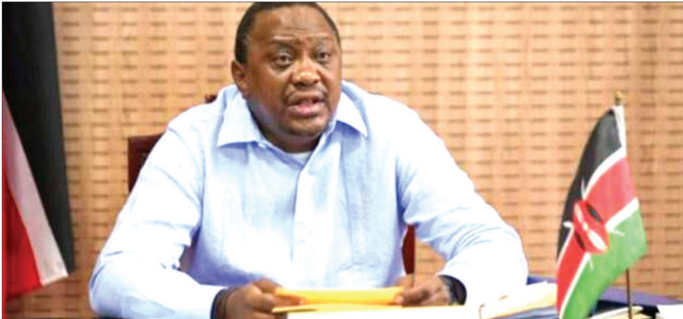
Rais wa Kenya, Uhuru Kenyatta, ameamuru Wizara ya Afya kuchapisha zabuni zote zinazohusiana na namna serikali ilivyoshughulikia janga la corona.