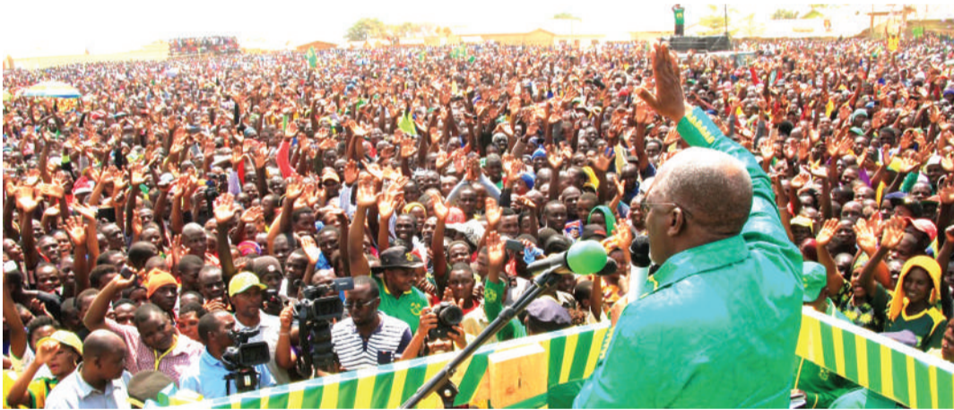
Mgombea urais wa CCM, Rais Magufuli akizindua kampeni jijini Dodoma wiki iliyopita.