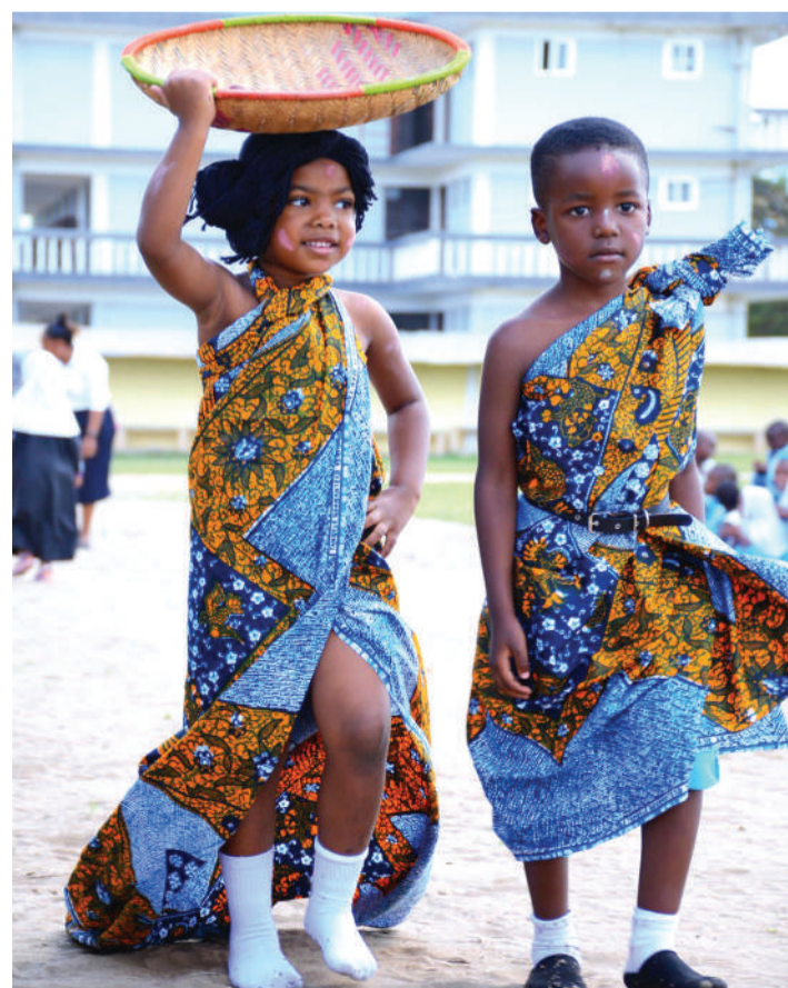
Wanafunzi wa Shule ya Awali ya Babobab iliyoko Mapinga, Bagamoyo wakipita katika onyesho la mavazi kwenye bonanza lililofanyika shuleni kwao mwishoni mwa wiki iliyopita.

"Kuna mifano ya wanamuziki wengi ambao wamefanikiwa sana kwenye maisha kutokana na vipaji walivyonyonyo, mwanafunzi anaweza asifanye vizuri sana darasani, lakini akawa na kipaji kitakachompa maisha mazuri sana," aliongeza.