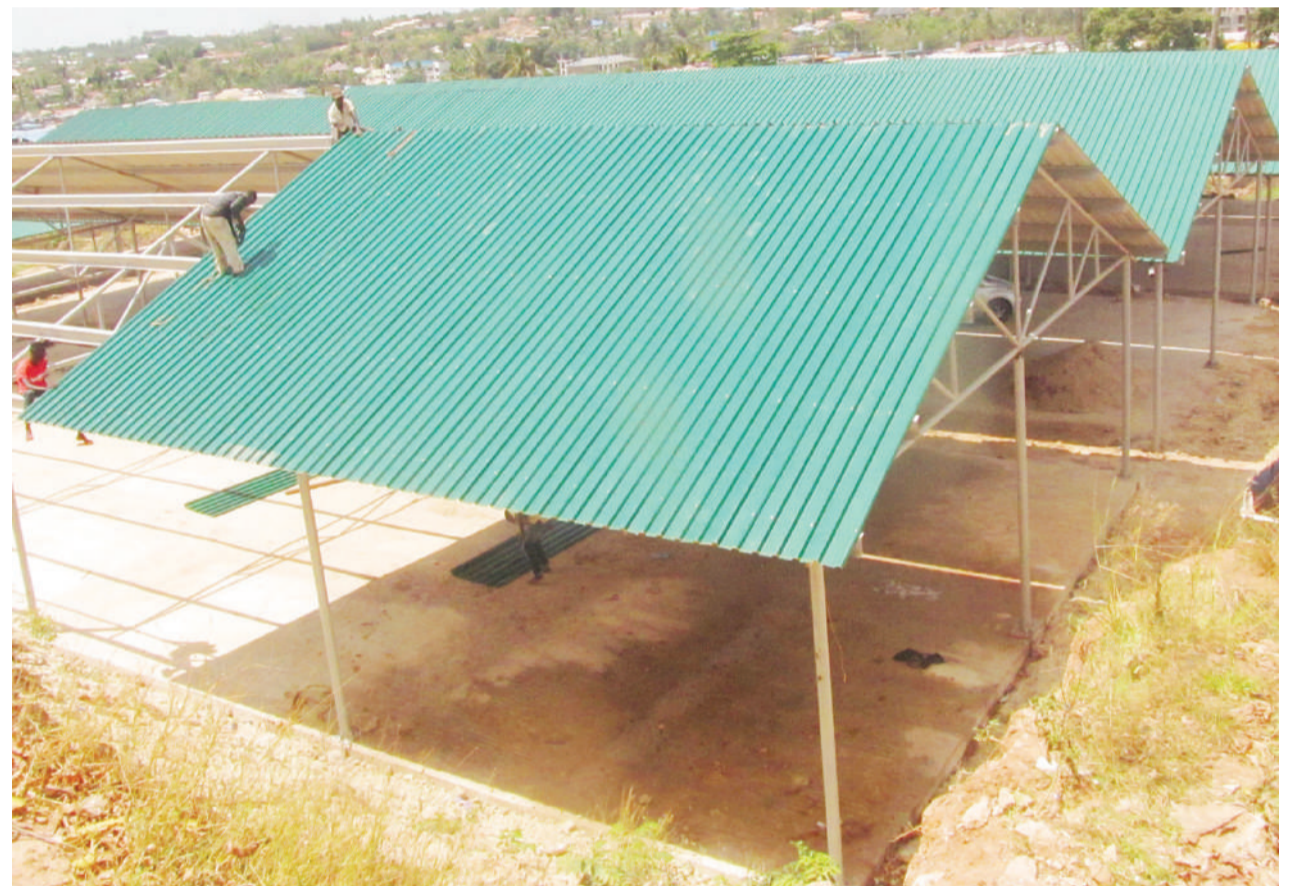
Mafundi wakiezeka soko jipya, linalojengwa kwa ajili ya wachuuzi wanaofanya biashara zao, kando ya Barabara ya Morogoro, eneo la Mbezi Mwisho, jijini Dar es Salaam jana.