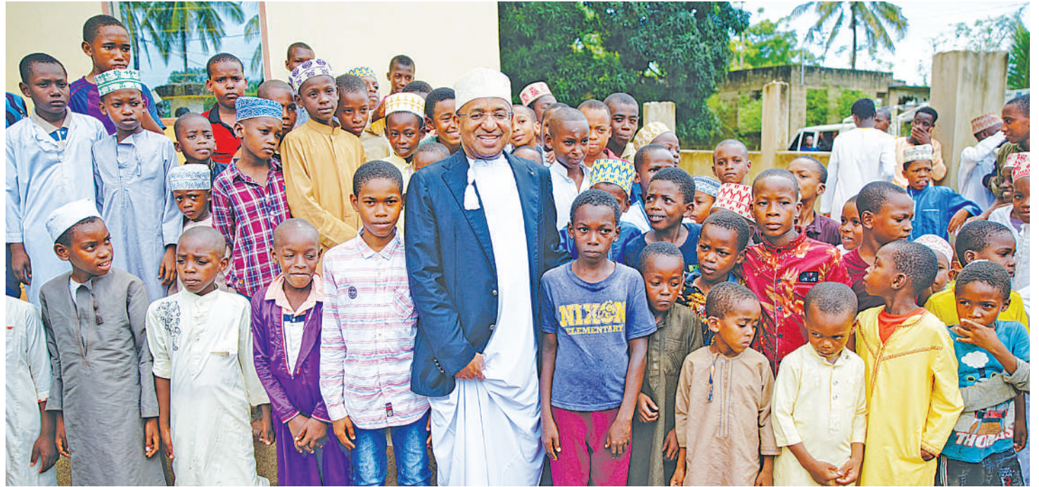
Rais wa Zanzibar, Dk. Hussein Ali Mwinyi akiwa na watoto wa Kijiji cha Nyamanzi, Mkoa wa Mjini Mgharibi, Unguja.