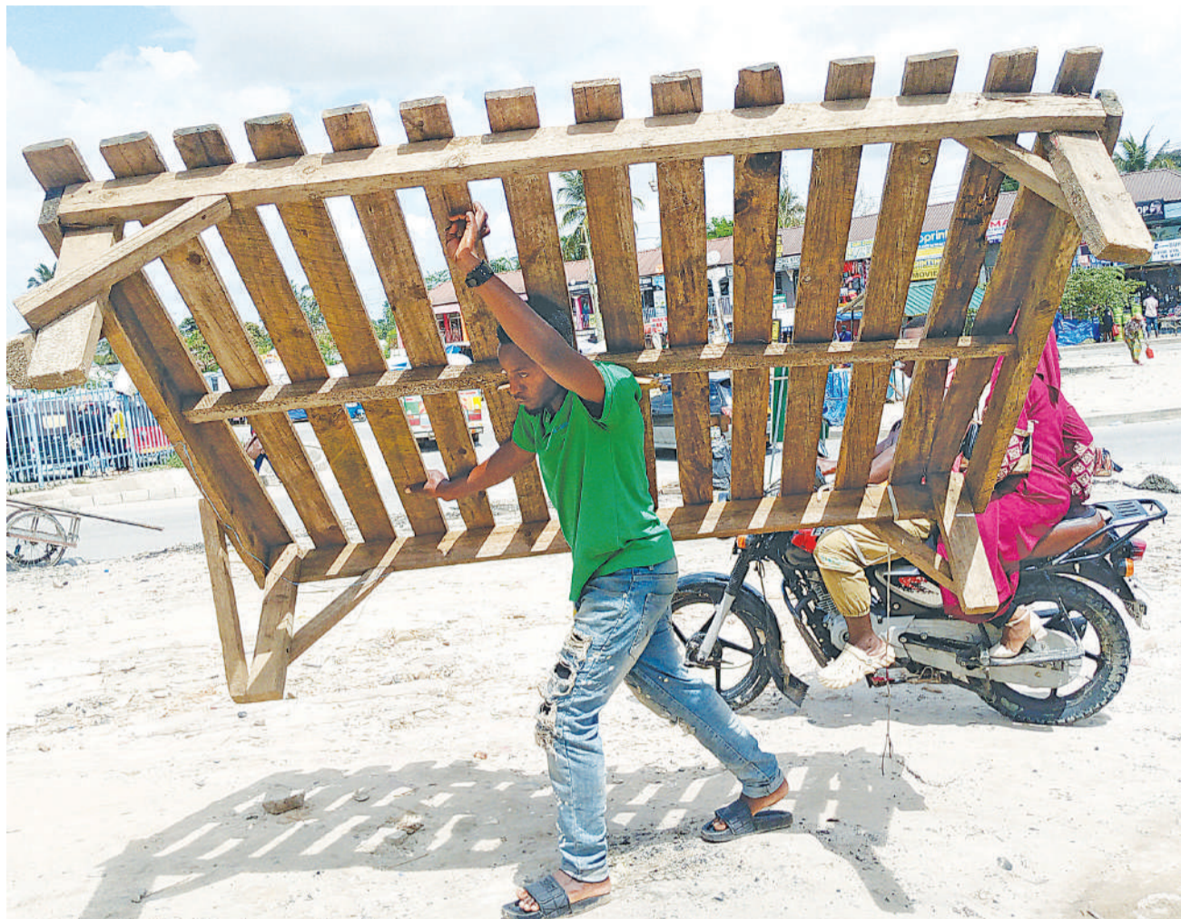
Mfanyabiashara mdogo akiwa amebeba meza yake na kuipeleka katika eneo analofanyia biashara Mbezi Mwisho Dar es Salaam juzi. Baada ya kumaliza biashara jioni mara nyingi huziondoa meza hizo wakihofia kubomolewa na mgambo.

"Wote mmemisia Waziri wa Ujenzi hapa baada ya kumpigia simu, ameshasema tayari mkandarasi ameshapatikana na ujenzi wa barabara ya Bigwa-Kisaki utaanza wakati wowote kuanzia sasa, mnataka nini tena wana Mkuyuni," alisema Mbunge Taletale.