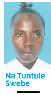
Na Tuntule Swebe