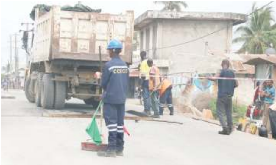
Wafanyakazi wanaojenga barabara ya Magomeni kwenda Sinza Kijiweni wakiweka matuta kwa ajili ya kuzuia magari yaendayo kwa kasi hasa sehemu yenye watu wengi eneo la Kwa Mtogole jana.