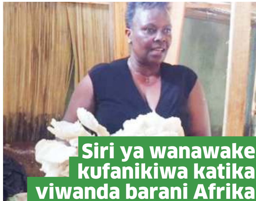
Siri ya wanawake kufanikiwa katika viwanda barani Afrika