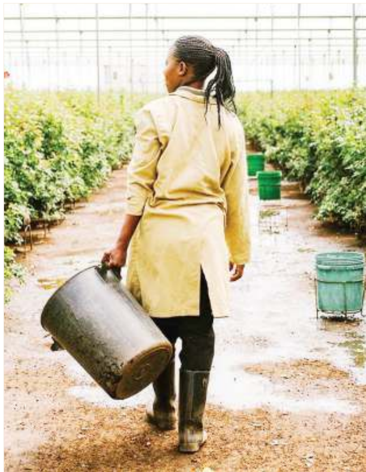
Moja ya viwanda vya maua mkoani Arusha, vilivyo na nafasi ya kufaidikwa zaidi endapo mkataba wa EPA utafikiwa.