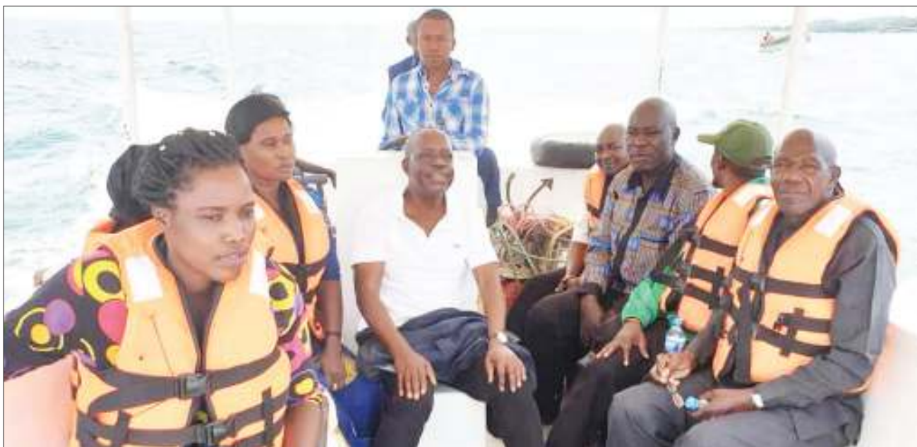
Mbunge wa Musoma Vijijini, Profesa Sospeter Muhongo (katikati) na watu wengine wakisafiri kwa boti juzi kwenda kwenye kisiwa cha Rukuba jimboni humo kwa ajili ya uzinduzi wa maktaba ya Shule ya Msingi Rukuba na pia sherehe za sikukuu ya Pasaka.

"Maofisa masuhuli wote wa halmashauri husika pia wanapaswa kuimarisha mchakato wa kudhibiti ubora wa taarifa na kuandaa ratiba ya uandaaji wa taarifa za fedha ili kuhakikisha usahihi wa taarifa zinazowasilishwa kwa ukaguzi kwa mujibu wa viwango vya kimataifa vinavyokubalika," CAG Assad anashauri.