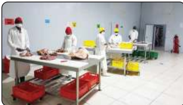
sehemu za vituo vya machinjio zilizowekwa alama za rangi ili kuzuia muingiliano wa bidhaa.

Meat King inafanya kazi kwa ukaribu na zaidi ya wakulima na wasambazaji 800 wa nyama nchini ili kuboresha uzalishaji/uzajaji, ulishaji na jinsi ya kuwatunza wanyama kwa kiwango kinachotakiwa katika uzalishaji wetu. Tunawakagua wakulima na kuhakikisha kuwa wanyama wanatunzwa kwa hali ya kiubinadamu, kuku wanakuwa na uwezo wa kuwa huru(kukimbia kwa kujitafutia chakula wenyewe) na sio kulishwa vyakula vya samaki ambapo huharibu ladha ya nyama ya kuku, hawapewi madawa ya kuwakuzia haraka (hormones) na matumizi ya madawa mengi.