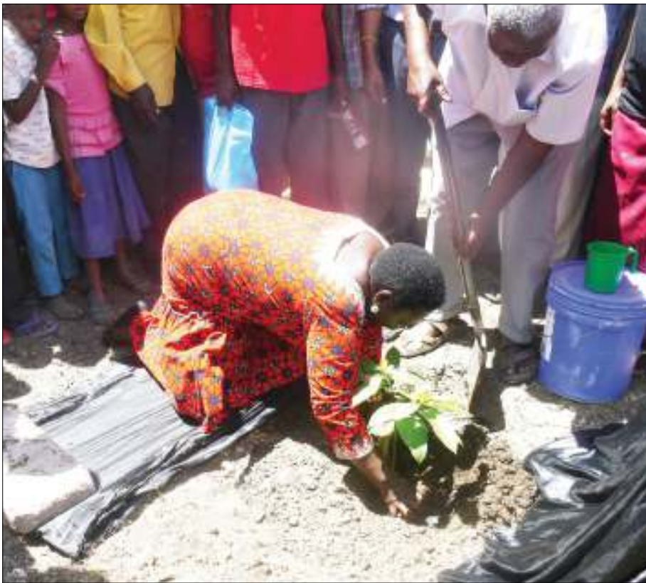
Mkuu wa Wilaya ya Kishapu, Nyabaganga Taraba, akipanda mti katika ofisi ya Kata ya Shangihilu kwenye siku ya Tamasha la Kupinga Mila na Des-turi Kandamizi ambazo zimekuwa zikisababisha kukithili kwa mimba na ndoa za utotoni, lililoandaliwa na Shirika la Save The Children