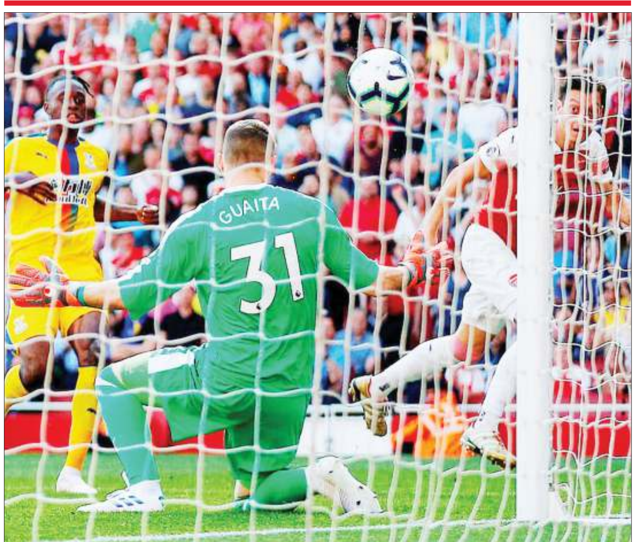
Mesut Ozil (kulia), akiifungua Arsenal bao la kwanza wakati wakikubali kipigo cha mabao 3-2 dhidi ya Crystal Palace, kwenye mechi ya Ligi Kuu iliyopigwa Uwanja wa Emirates juzi.

Simba ndio mabingwa watetezi wa ligi hiyo inayoshirikisha jumla ya timu 20 na Yanga yenye pointi 74 ndio vinara wakati African Lyon, zote za jijini Dar es Salaam inaburuza mkia.