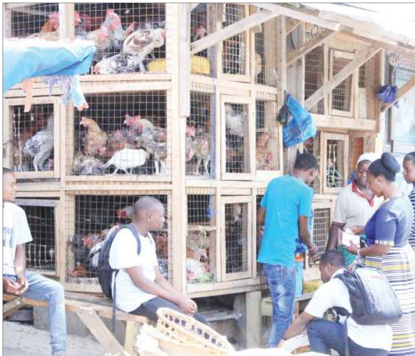
Baadhi ya Wakazi wa Jijini la Dodoma, wakifanya manunuzi ya kuku katika shamrashamra ya Jumatatu ya Pasaka soko kuu la Majengo jana.

Aidha, amewashauri viongozi wa dini kuendelea kukemea vitendo viovu vitakavyojitokeza kwenye chaguzi hizo, hata kama miongoni mwao wanatoka kwenye makanisa yao.