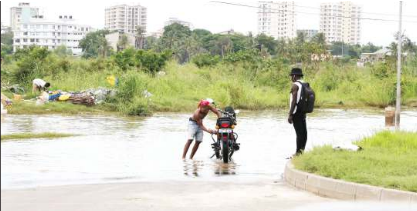
Mwendesha bodaboda akisafisha pikipiki yake katikati ya barabara iendayo Kariakoo eneo la Jangwani ambalo limejifunga kutokana na mvua inayoendelea kunyesha jijini Dar es Salaam jana.