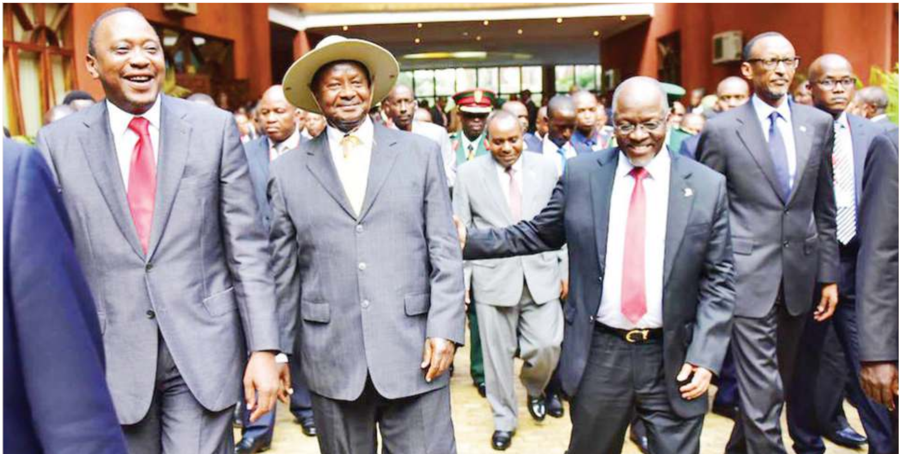
Viongozi wa Jumuiya ya Afrika Mashariki (EAC). Kutoka Kushoto ni Rais Uhuru Kenyatta wa Kenya, Yoweri Museveni wa Uganda, John Magufuli wa Tanzania na Paul Kagame wa Rwanda.