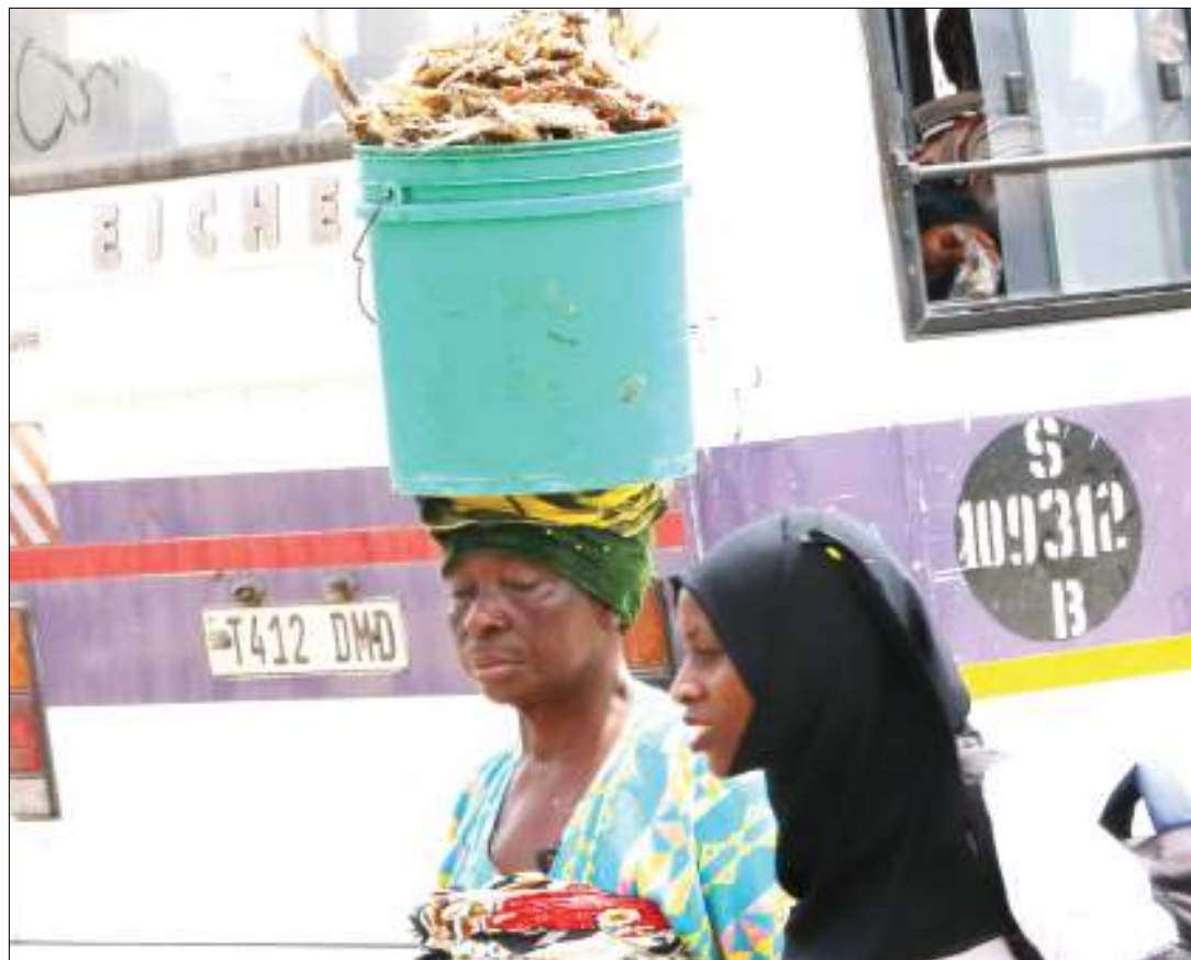
Muuzi dagaa wa kukaanga akiwa na ndoo iliyosheheni bidhaa hiyo akitoka katika soko la samaki la Feri jijini Dar es Salaam jana. Biashara hiyo imeajiri wanawake wengi.