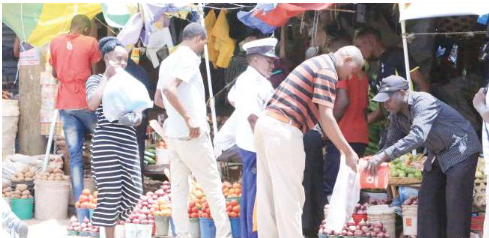
Wananchi wakijipatia mahitaji katika soko kuu la Majengo jijini Dodoma kama walivyokutwa walikuwa wakifanya maandalizi ya sikukuu ya Pasaka.