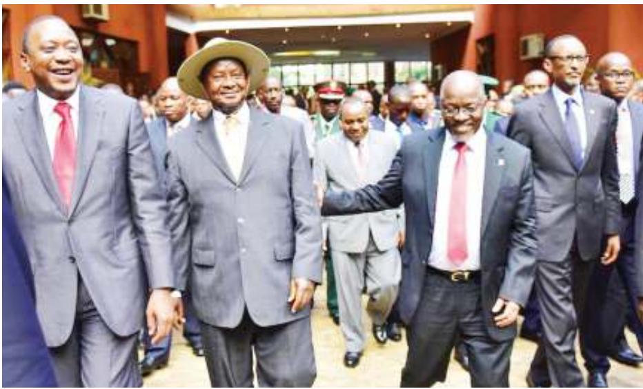
'Hitaji' mkataba wa EPA na kukua kwa viwanda