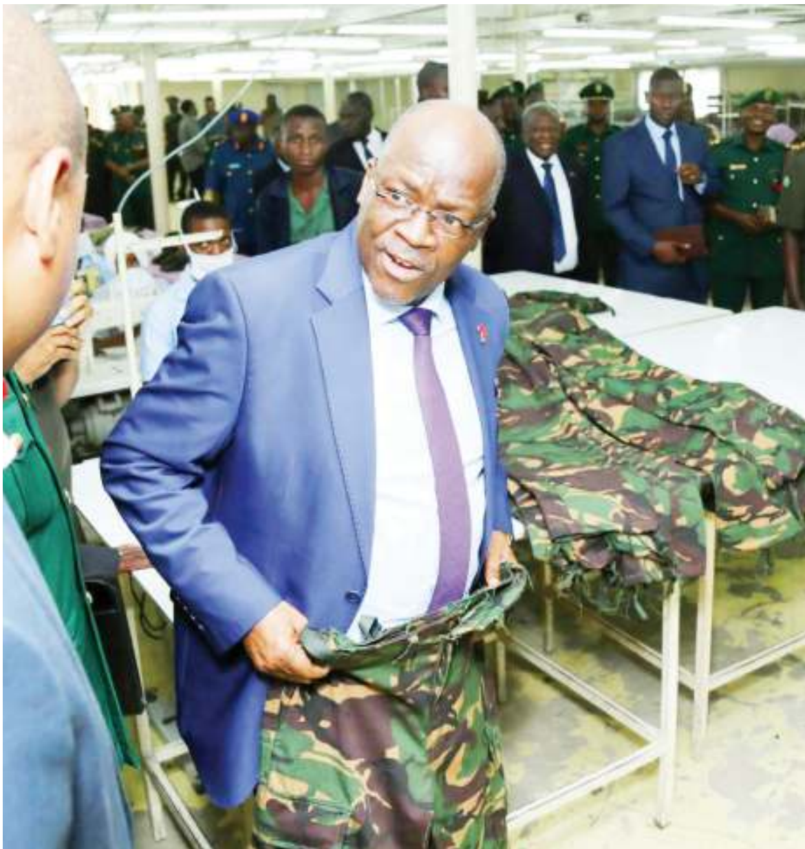
Rais John Magufuli, akifurahia sare za kijeshi zinazoshonwa na kiwanda cha ushonaji nguo katika kituo cha uwekezaji cha JWTZ kupitia SUMA-JKT, Mgulani jijini Dar es Salaam.

Kwa hali hiyo, dira mpya ya SIDO ikawa ni kuibua, kutangaza na kuen-