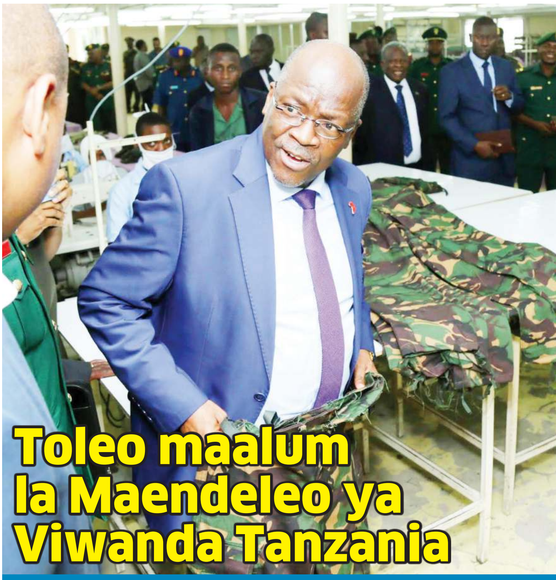
Toleo maalum la Maendeleo ya Viwanda Tanzania