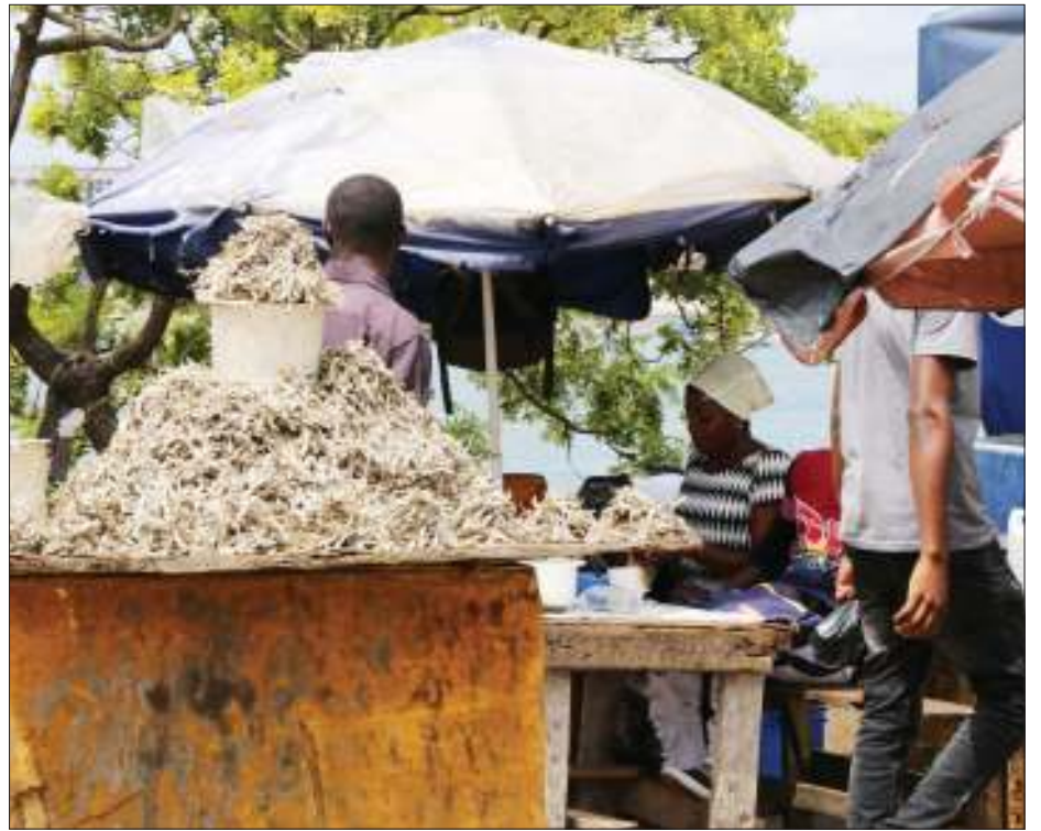
Wakazi wa jiji la Dar es Salaam wakipita karibu na meza iliyowekwa dagaa mchele ambao ni sehemu ya mboga maarufu kwa wakazi wake wa makundi mbalimbali.