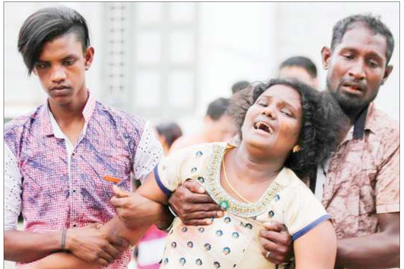
Raia wa Sri Lanka akilia baada ya ndugu zake kufariki kutokana na mlipuko uliotokea kanisani na kuuu watu zaidi ya 290.

Kampeni ya kumuondoa madarakani Bashir iliongozwa na chama cha wataalamu nchini (SPA) ambacho kimetoa pendekezo la kubuniwa kwa baraza la kiraia kuongoza nchi hiyo kwa kipindi cha mpito. BBC