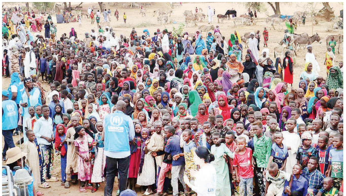
Raia wa Sudan wakikimbilia katika kambi ya wakimbizi ya Borota iliyoko Chad, karibu na mpaka wa Jimbo la Darfur baada ya mkataba wa usitishaji mapigano kutozingatiwa.

Hata hivyo, ikulu ya Uganda katika ukurasa wake wa Twitter imetuma picha ya Museveni kuthibitisha kuwa rais huyo ametia saini muswada huo. BBC