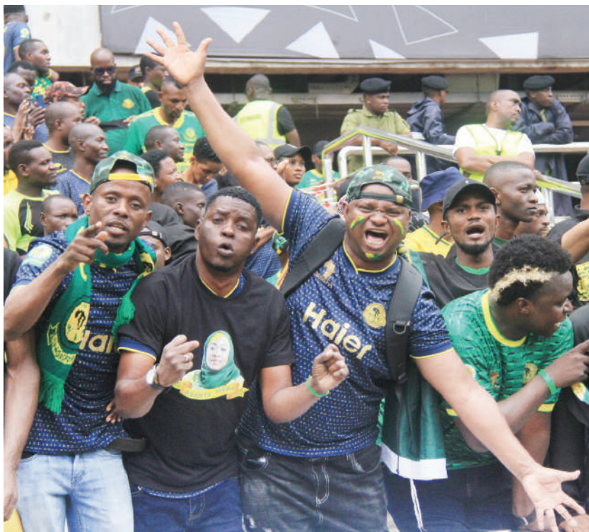
Mashabiki wa Yanga wakishangilia baada ya timu yao kupata bao la kusawazishi dhidi ya U.S.M Alger katika mchezo wa fainali ya kwanza ya Kombe la Shirikisho uliofanyika Uwanja wa Benjamin Mkapa jijini Dar es Salaam juzi, Yanga ilifungwa mabao 2-1.