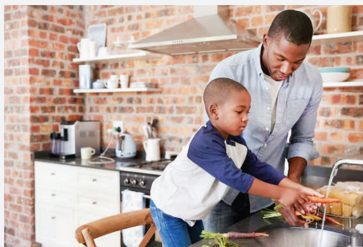
Watoto wafunzwe kupika wakati wa likizo na kujengewa ujuzi wa mambo ya maisha.