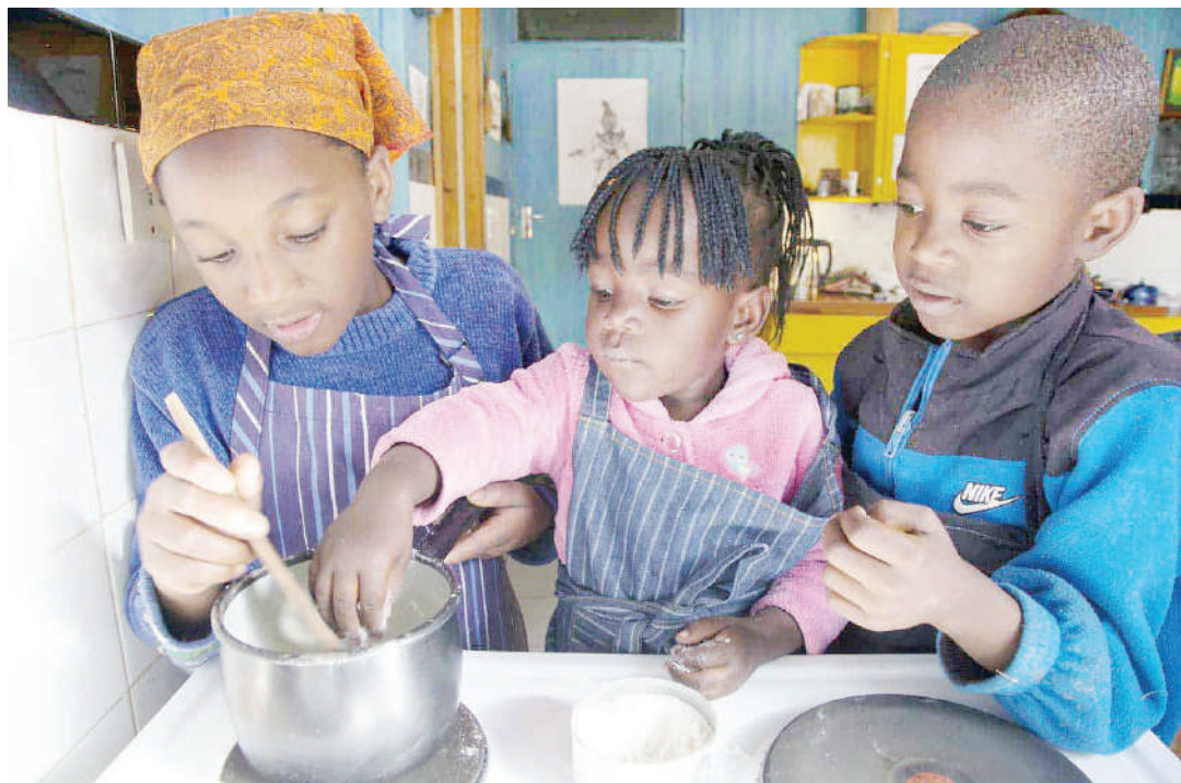
Watoto wafunzwe kupika wakati wa likizo na kujengewa ujuzi wa mambo ya maisha.

Kama kuna walioko hivyo kuanzia sasa waamke na kuanza kutimiza wajibu huo wa usimamizi. Wapo wengine hawafahamu maana ya 'home work' au kazi za kufanyia nyumbani wala hawawasaidia watoto wao badala yake