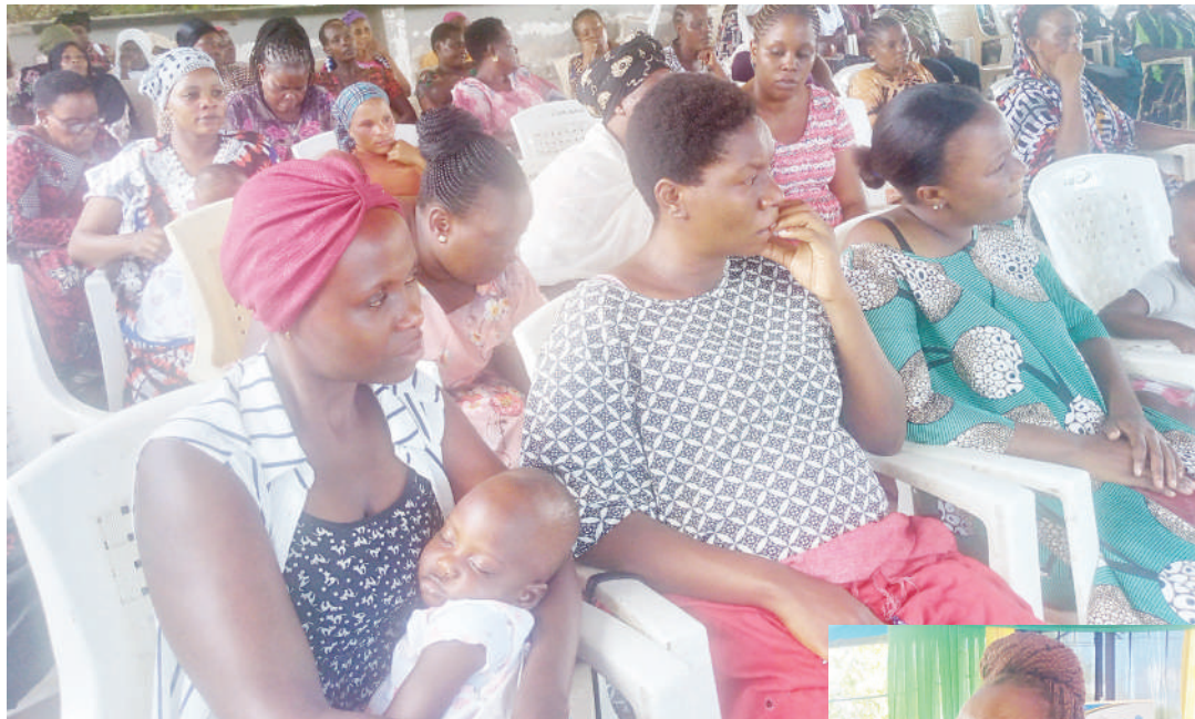
Wazazi na walezi wakifuatilia mafunzo, tafakarini na mipango.