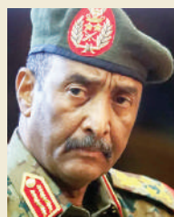
Jenerali Abdel al-Burhan

UN ilisema kikosi cha RSF kimechukua udhibiti wa nyumba za raia, biashara za watu binafsi na majengo ya umma ambayo baadhi yake yameporwa. DW