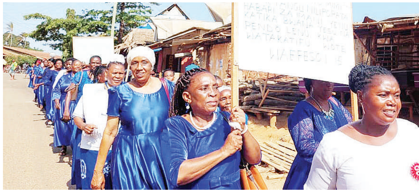
Wanawake kutoka makanisa ya Anglikana, Romani Katoliki na Kanisa la Kiinjili la Kilutheri Tanzania KKKT Muheza mkoani Tanga, wakiwa kwenye maandamano ya amani kuadhimisha Siku ya Maombi ya Mwanamke ambayo hufanyika kila mwaka duniani, juzi.

Alisema watumishi wa halmashauri watakuwa marafiki endapo watazingatia sheria na taratibu na tofauti na hapo hatawaacha salama hasa wanaokula fedha za umma kwa kuwa atashughulika na ipasavyo.