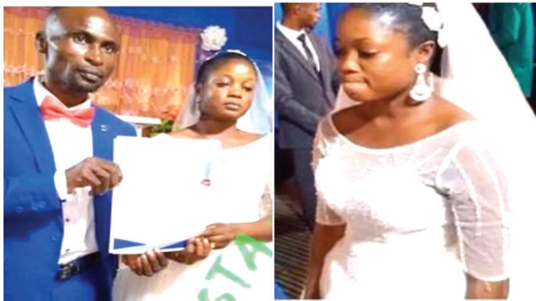
Ndivyo mabinti wanavyokuwa mawindo ya baba mlezi baada ya mama kufunga ndoa.

"Nilikosa ujasiri wa kukataa mambo haya niliyolazimishwa na baba. Nilipata hofu nilikuwa namwogopa sana mama hata nikashindwa kumweleza ninacho-