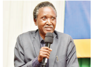
ukuaji wao,” anaelekeza.

“Ili kukomesha vitendo vya ukatili kwa wanafunzi wakiwa kwenye magari na mabasi, kunapaswa kuwa na ratiba rafiki za safari ili wanafunzi, hususani watoto wadogo, wapate muda wa kutosha kupumzika kwa ajili ya