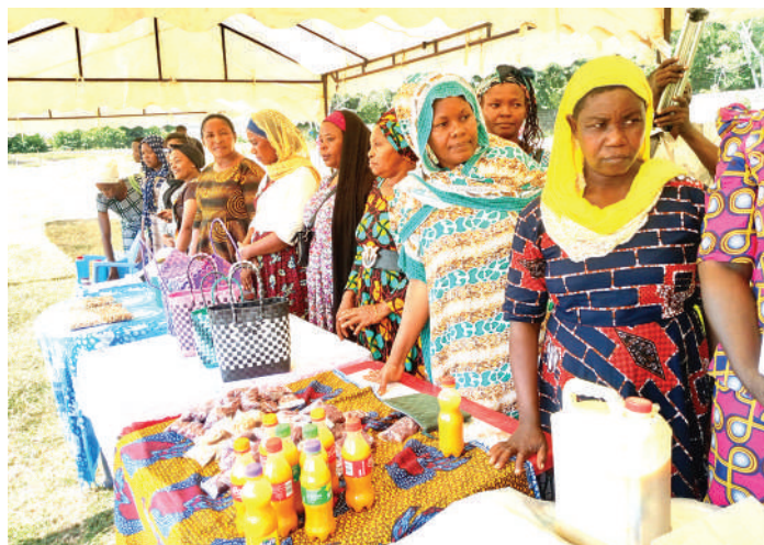
Kinamama wajasiriamali wakionyesha bidhaa baada ya kuji-funza jinsi ya kutumia simu ili kuboresha biashara zao.

Kaulimbiu ni "ubunifu na mabadiliko ya teknolojia, chachu kuleta usawa wa kijinsia," ukweli ni kwamba ni asilimia chache kati yao wanaomiliki simu au kuwa na uelewa kuhusu mambo ya diji-