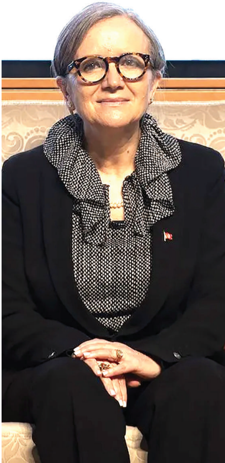
Waziri Mkuu Profesa Najla Bouden baada ya kutumbuliwa.