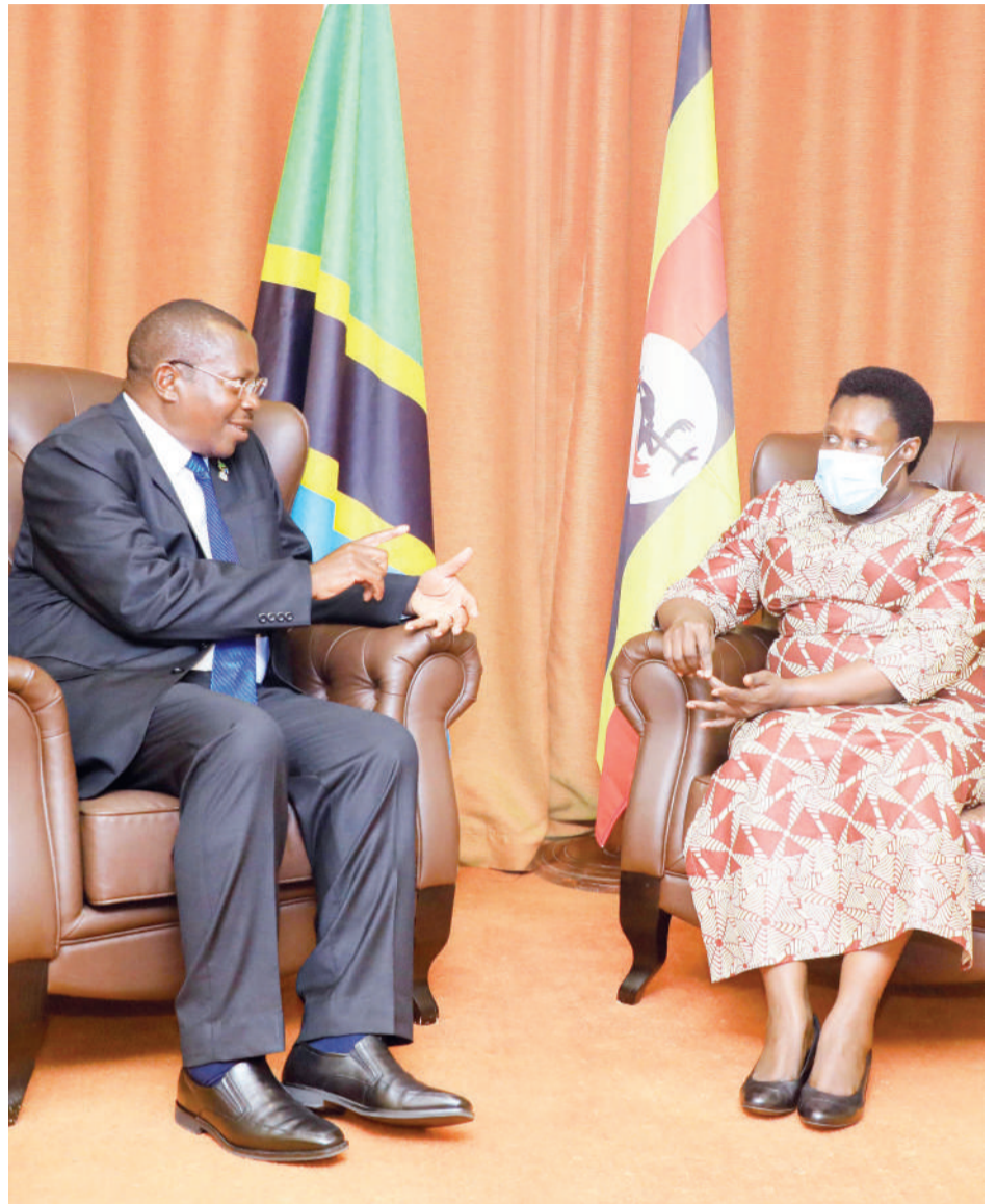
Makamu wa Rais, Dk. Philip Mpango, akifanya mazungumzo na Makamu wa Rais wa Uganda, Jessica Alupo, katika mkutano wa pili wa wakuu wa nchi na serikali wa nchi 25 za Afrika, wanachama wazalishaji wa zao la kahawa jijini Kampala, Uganda jana.