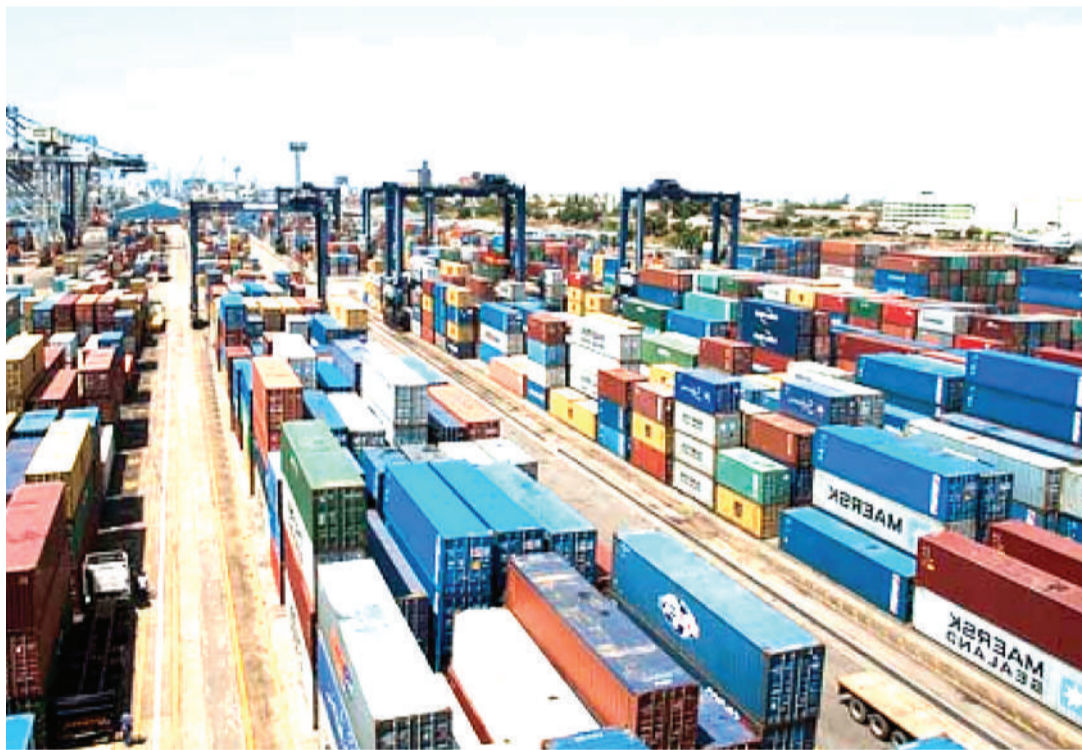
Kitengo cha Makontena cha Mamlaka ya Usimamizi wa Bandari.

Utafiti unasema moja kati ya bandari nne kote duniani imetoea eneo la kutia nanga meli na kushusha shehena kwa zabuni za kishindani, ila si zote. Maeneo mengine kuchagua kampuni ya uendeshaji inafanana na 'shindano la urembo' ambako maombi