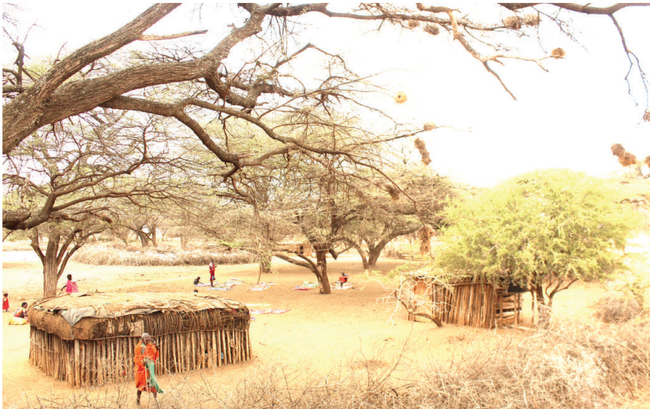
Wakazi wa Kijiji cha II Ngwesi kilichopo Kaunti ya Nanyuki nchini Kenya wakiwa wameandaa bidhaa zao kwa ajili ya kuwauzia wageni.