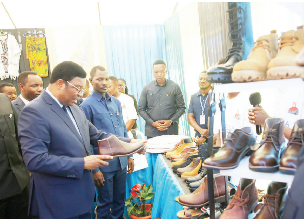
Waziri Mkuu, Kassim Majaliwa akiangalia kiatu kilichotengenezwa na kiwanda cha wajasiriamali cha Faru Products jijini Dodoma, kabla ya kufungua kongamano la vijana la mkoa huo jana.