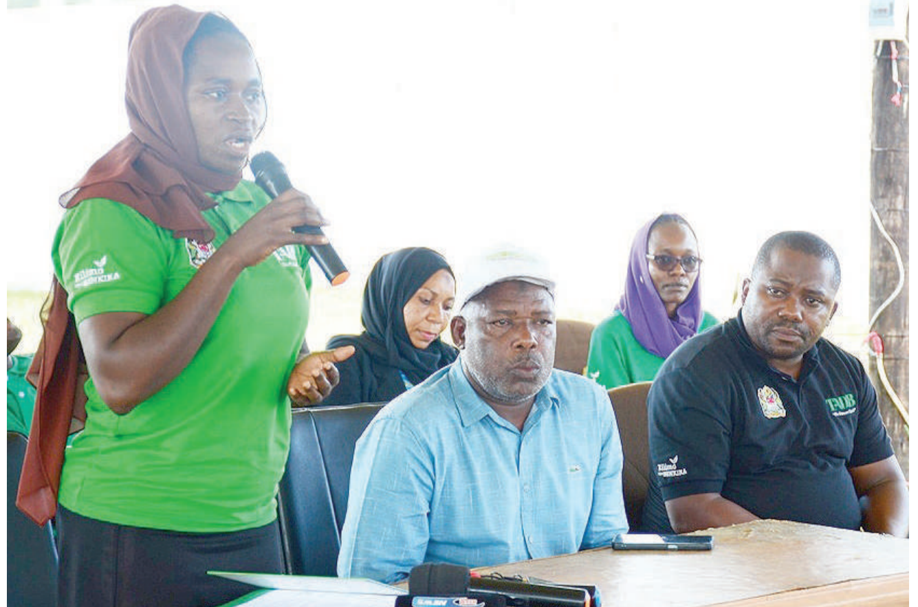
Ofisa Maendeleo ya Biashara wa Benki ya Maendeleo ya Kilimo Tanzania (TADB) Kanda ya Zanzibar, Ashura Akim (kushoto), akizungumza na wavuvi, wafugaji na wakulima wakati akitoa elimu kuhusu fursa zinazopatikana katika benki hiyo kwenye maonyesho ya wakulima Nanenane, Dole, Wilaya ya Magharibi A Unguja jana.

Alisema "Tunamatumaini kuwa benki hii itatukomboza hivyo tunaomba waliyotueleza yaende sambamba na vitendo ambayo ni kutupatia mikopo na fursa ya kutupatia mafunzo ili kuwa na wataalamu".