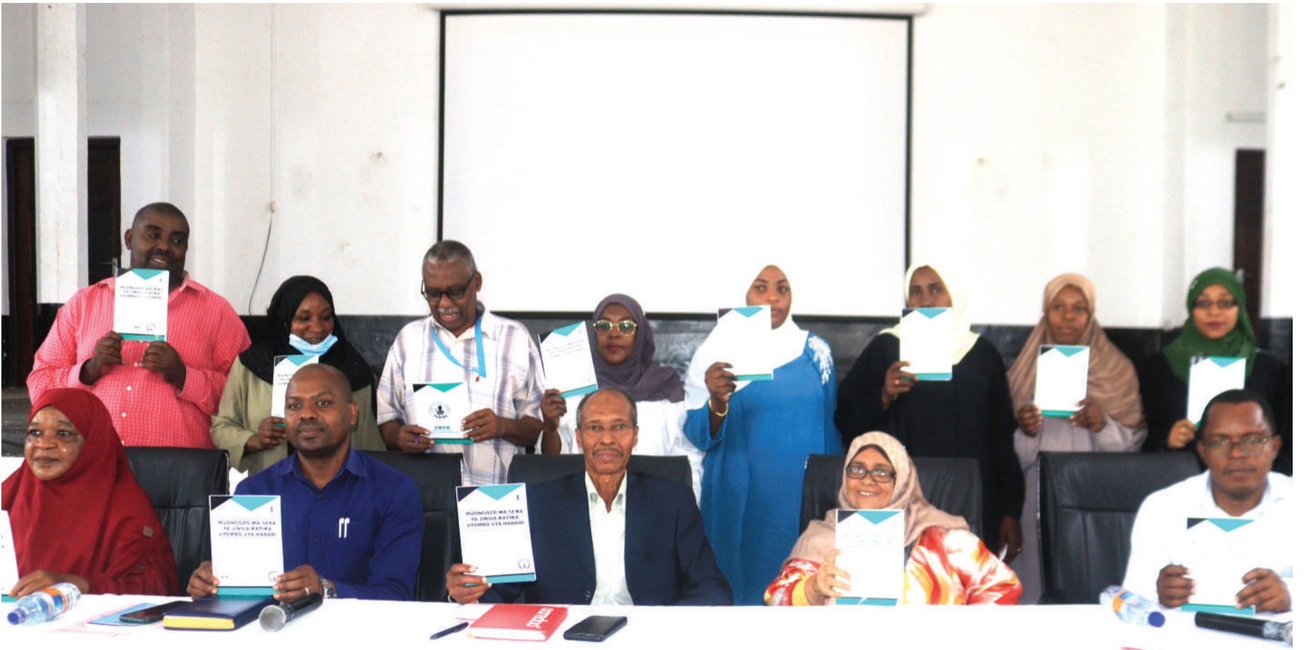
Katika picha ya pamoja, wadau wa habari na mwongozo wa sera ya jinsia ulioandaliwa na TAMWA.