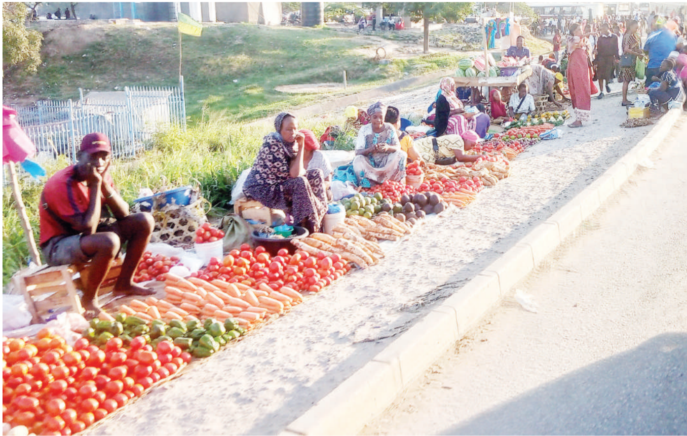
Wachuuzi wakiwa wamepanga bidhaa zao kwenye eneo la waenda kwa miguu kando ya barabara katika kituo cha daladala cha Mbezi Luis, Manispaa ya Ubungo Dar es Salaam jana.