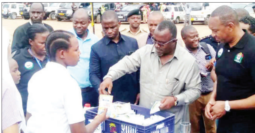
Mkuu wa Mkoa wa Tanga, Adam Malima, akigawa maziwa kwa wanafunzi wakati wa maadhimisho ya uzinduzi wa Wiki ya Maziwa, katika viwanja vya Tangamano, jijini Tanga jana.

Pia walikamata gorori 39 kwenye maeneo ya kitalu cha uwindaji North Safari kilichopo Kata ya Utengule Tarafa ya Mlimba.