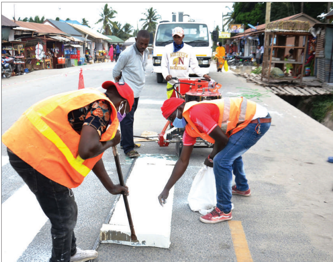
Mafundi wa Kampuni ya Ujenzi ya Nyanza Road, wakipaka rangi kuweka alama ya kivuko cha waenda kwa miguu barabarani, eneo la Kitunda-Kivule, jijini Dar es Salaam jana.

"Msimamo huo wa nchi za SADC unatajiwa kuwasilishwa katika vikao vya Umoja wa Afrika kwa majadiliano na kuweka msimamo wa pamoja wa nchi za Afrika kuhusu maboresho ya Katiba ya Shirika la Kazi Duniani," alisema.