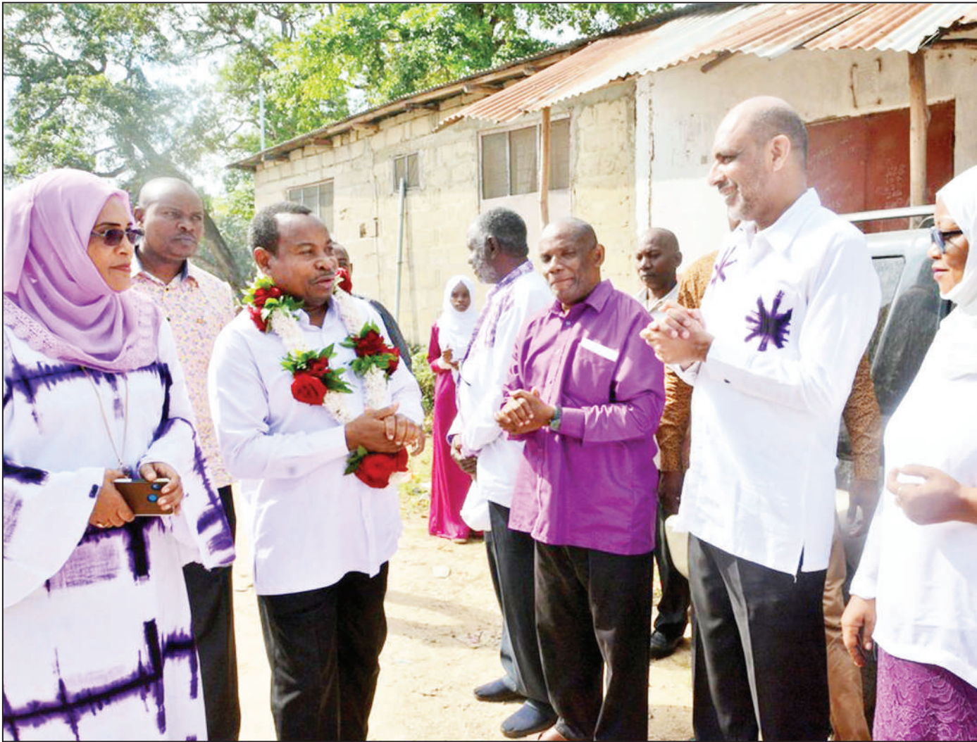
Makamu wa Kwanza wa Rais Zanzibar, Othman Masoud (wapili kushoto), akisalimiana na viongozi wa Chama cha ACT-Wazalendo, akiwa katika ziara za kichama Mkoa wa Kaskazini Unguja jana.

Alisema kama vijana wa chama hicho hawatakuwa na vitambulisho itakuwa vigumu kupiga kura katika uchaguzi mkuu hali ambayo haitakuwa jambo rahisi kushinda katika uchaguzi huo.