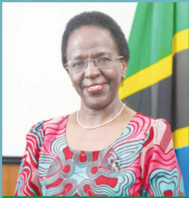
BALOZI LIBERATA RUTAGERUKA MULAMULA (MB), WAZIRI WA MAMBO YA NJE NA USHIRIKIANO WA AFRIKA MASHARIKI