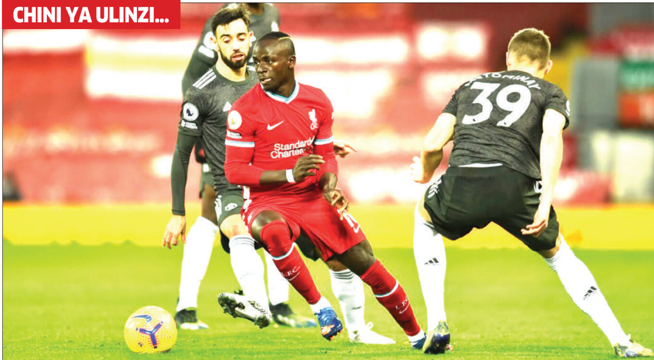
Mshambuliaji wa Liverpool, Sadio Mane, akipata ushindani mkali kutoka kwa safu ya ulinzi ya Manchester United kwenye mechi ya Ligi Kuu England iliyopigwa Uwanja wa Anfield juzi na kumalizika kwa sare tasa.