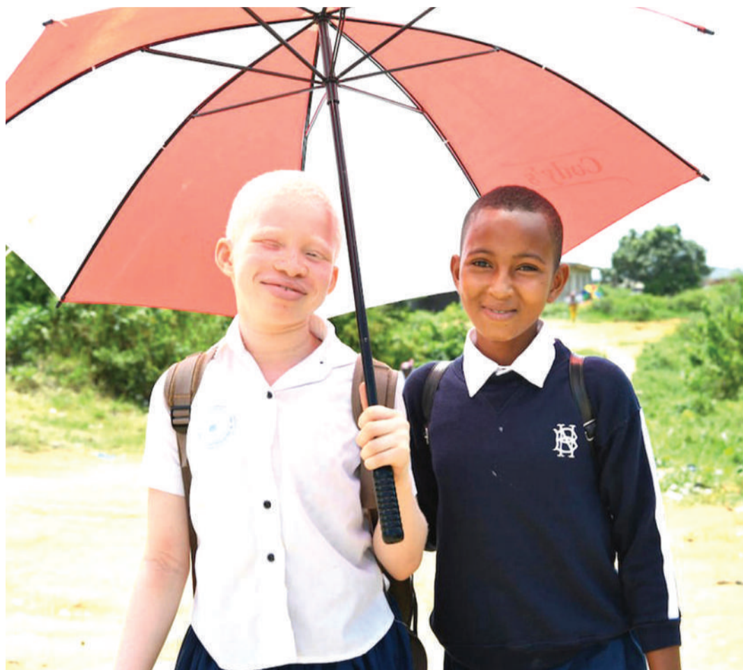
Watoto waelekezwe bila kuonyeshwa tofauti zao. Wote wapewe haki na mahitaji sawa kuepusha ubaguzi na unyanyapaa.

wakati wa idara ya ustawi wa jamii kulitumia na kuwatambua watoto wenye uhitaji na kuwasaidia.