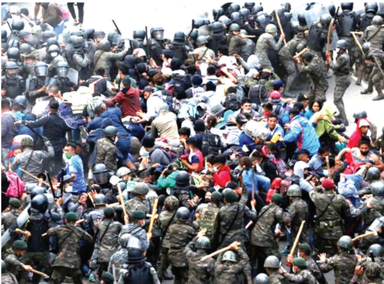
Polisi na wanajeshi wakikabiliana na wahamiaji ili kuwalazimisha kurudi walikotoka. Takriban wahamiaji 7,000, wengi wao kutoka Honduras, wanakadiriwa kuwasili Guatemala tangu mwishoni mwa wiki.