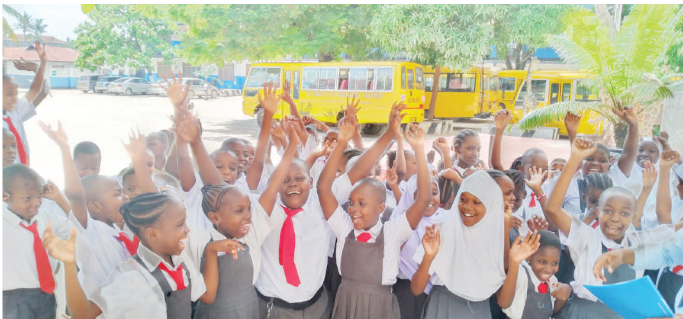
Wanafunzi wa darasa la tano ambao walifanya mtihani wa darasa la nne mwaka jana wa Shule ya Msingi St Mary's Tabata, wakifurahia baada ya kutangaziwa matokeo mazuri ya darasa la nne kwa shule hiyo yaliyotolewa mwishoni mwa wiki.

Mwaka-tobe alisema kwa mujibu wa sheria ya mbegu ya mwaka 2003 na maboresho yake ya mwaka 2014, imeweka utaratibu mzuri mkulima aliyenunua mbegu mahali sahihi akiwa na vithibitisho ikiwamo risiti na vifungashio, apate fidia ambapo TOSCI inaweza kumsaidia mkulima kupitia vyombo vya haki ikiwamo mahakama.