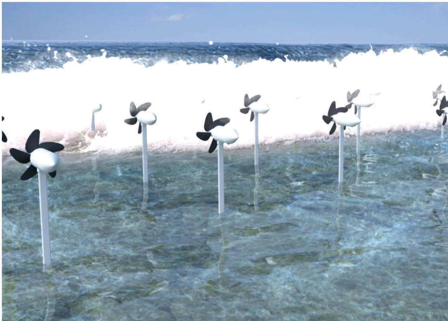
Pichani ni mapanga boi yanayokusanya na kuchakata mawimbi kupata umeme.

■Uingereza, Italia wayatumia kuvuna umeme