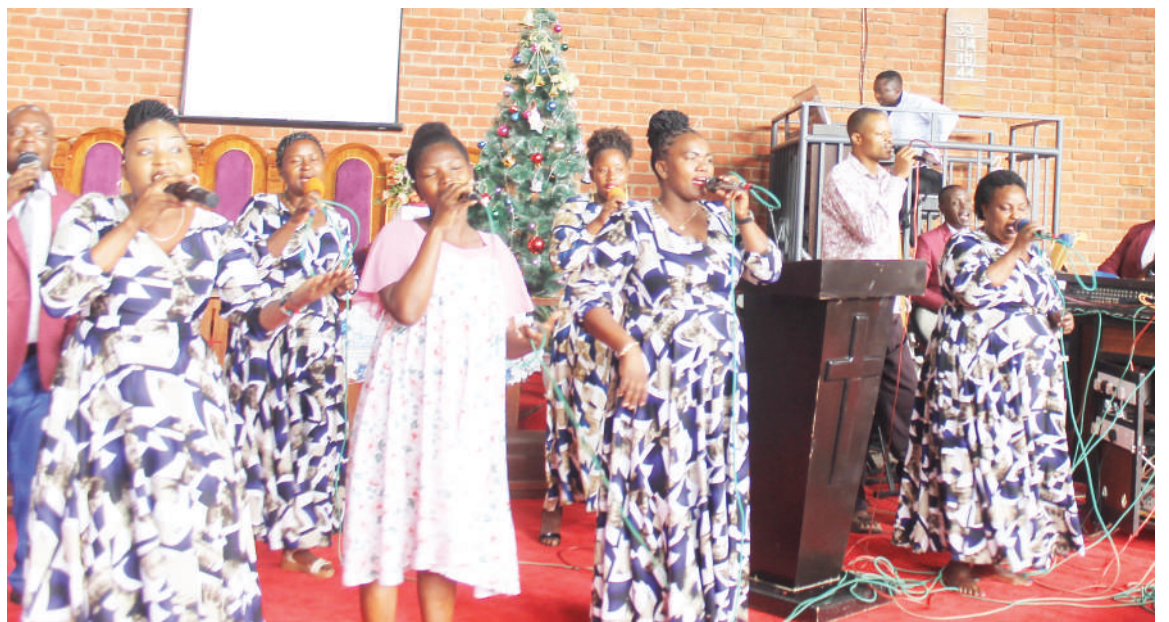
Kwaya ya Kanani ya Kanisa Kuu la KKKT Dayosisi ya Dodoma ikiimba kwenye ibada ya Krismasi iliyofanyika Kanisa la Usharika wa Dodoma mjini jana.