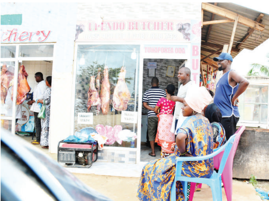
Wananchi wakiwa kwenye foleni kusubiri huduma ya nyama, kilo moja ili-uzwa kwa 11,000/- ikiwa ni ongezeko la shilingi 3,000 katika eneo la Goba Tegeta A, Dar es Salaam jana.