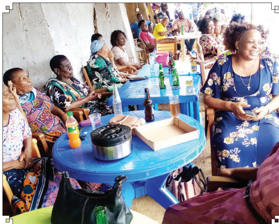
Wakazi wa Wilaya ya Muheza, mkoani Tanga, wakipata vinywaji na chakula jana katika kusherehekea sikukuu ya kuzaliwa Yesu Kristo.