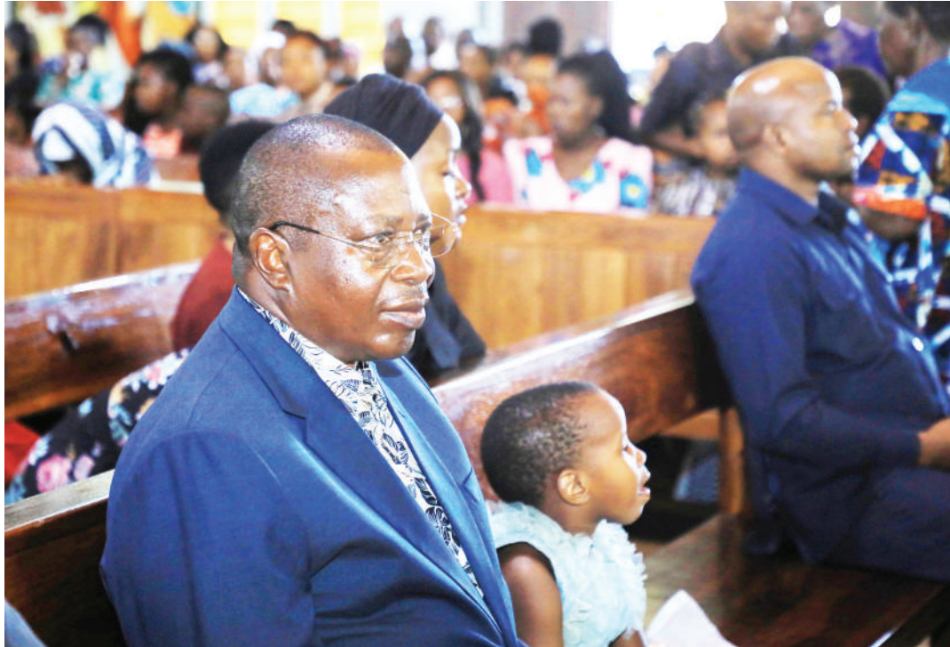
Makamu wa Rais, Dk. Philip Mpango, akishiriki ibada ya Sikukuu ya Krismasi katika Kanisa Katoliki Parokia ya Mwenyeheri Maria Theresa Ledochowska Kiwanja cha Ndege Dodoma jana.