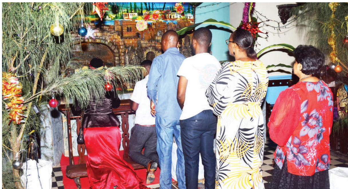
Waumini wa Kanisa Katoliki Zanzibar wakisali kwenye pango la mtoto Yesu baada ya ibada ya mkesha wa Krismasi iliyofanyika juzi Kanisa la St. Joseph mjini Zanzibar.