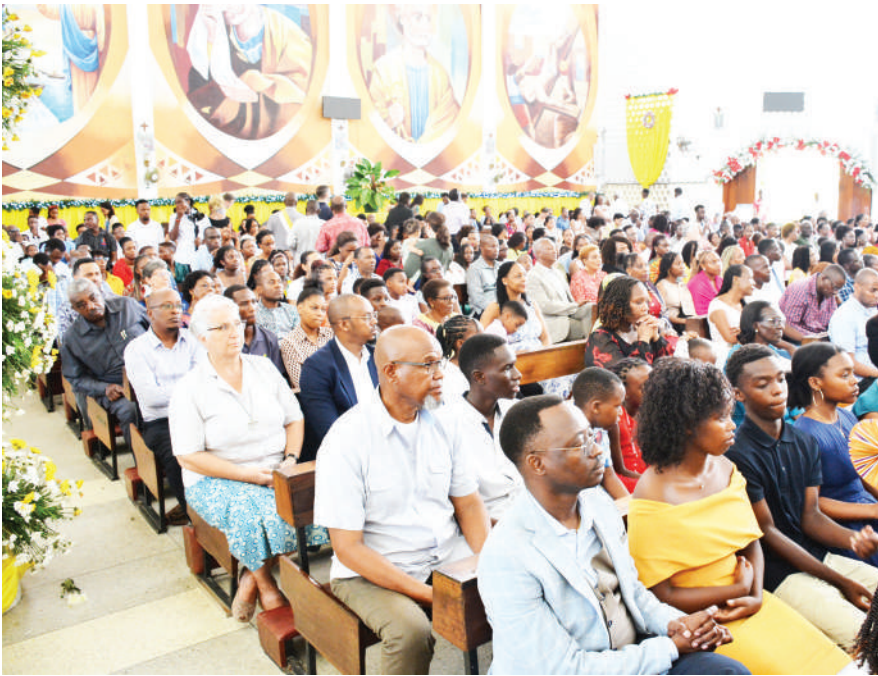
Waumini wa Parokia ya Mtakatifu Petro Oysterbay jijini Dar es Salaam, wakiwa kwenye ibada ya Krismasi jana.