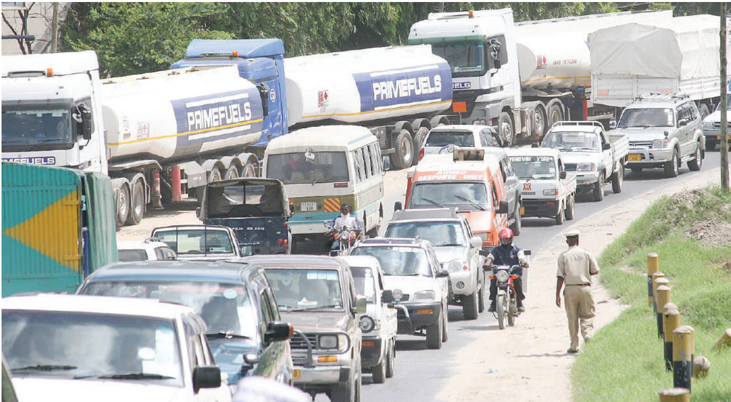
Foleni kwenye moja ya barabara mkoani Dar es Salaam ni tatizo 'endelevu'.

W ATANZANIA wa- napoingia 2024 Nipashe 'Team', tunawatakiwa heri na mafanikio kwa mwaka mpya. Licha ya kufurahia kuvuka, tunaangalia mambo ambayo wanaingia nayo wakati wanasherehekea ujio wa mwaka mpya.