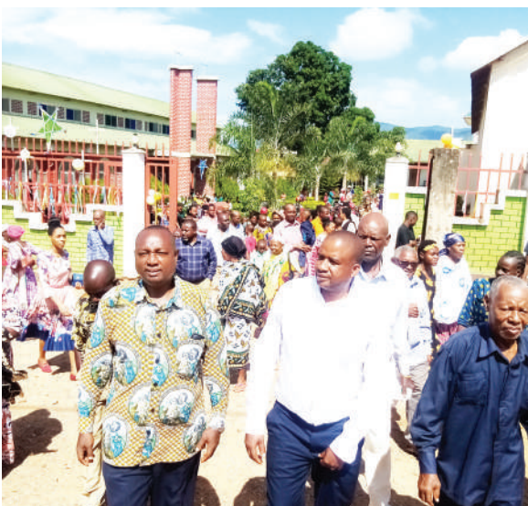
Waumini wa Kanisa la Romani Katoliki la Kristo Mfufuka lililoko Mtaa wa Majengo Shimoni, wilayani Muheza, Tanga, wakitoka katika ibada ya kuzaliwa kwa Yesu Kristo iliyoongozwa na Pa-dri Martine Kihyo.