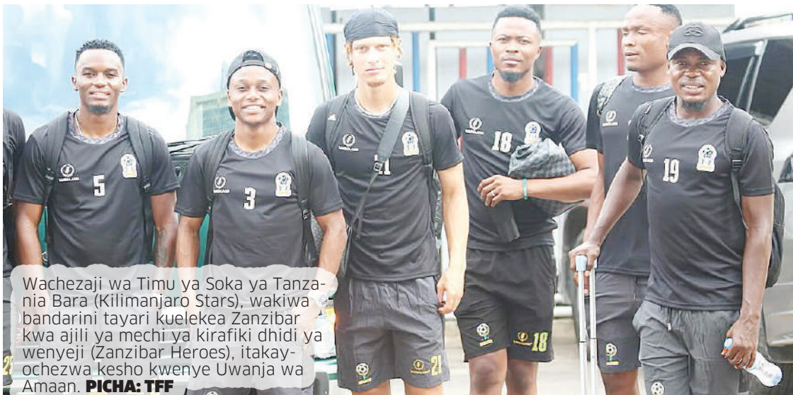
Wachezaji wa Timu ya Soka ya Tanzania Bara (Kilimanjaro Stars), wakiwa bandarini tayari kuelekea Zanzibar kwa ajili ya mechi ya kirafiki dhidi ya wenyeji (Zanzibar Heroes), itakayochezwa kesho kwenye Uwanja wa Amaan.