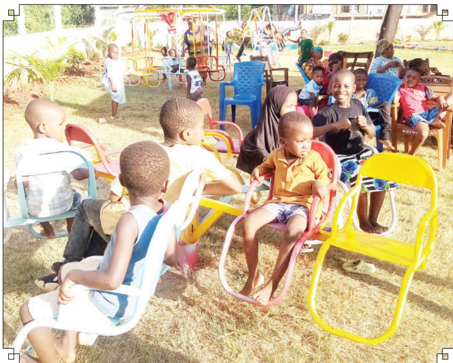
Watoto wakibembea jana katika viwanja vya Msekwa Park wilayani Muheza, mkoani Tanga, kusherehekea sikukuu ya Krismasi.