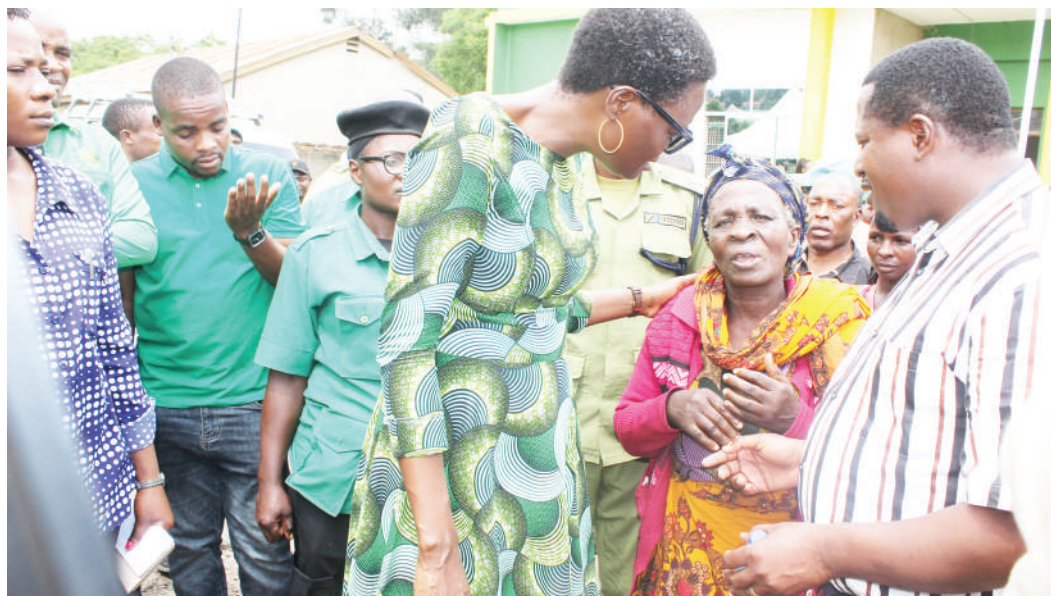
Spika wa Bunge na Rais wa Umoja wa Mabunge Duniani (IPU), Dk. Tulia Ackson, akimsikiliza mkazi wa Rungwe nje ya ofisi za Chama cha Mapinduzi Wilaya ya Mbeya Mjini wanaodaiwa kuporwa maeneo yao wilayani humo.

Alisema kwa sasa wilaya hiyo inashika nafasi ya tatu kitaifa kwa kutekeleza vizuri mkataba wa lishe na kwamba walikubaliana kuendeleza juhudi za kuhakikisha wanaendelea kufanya vizuri.