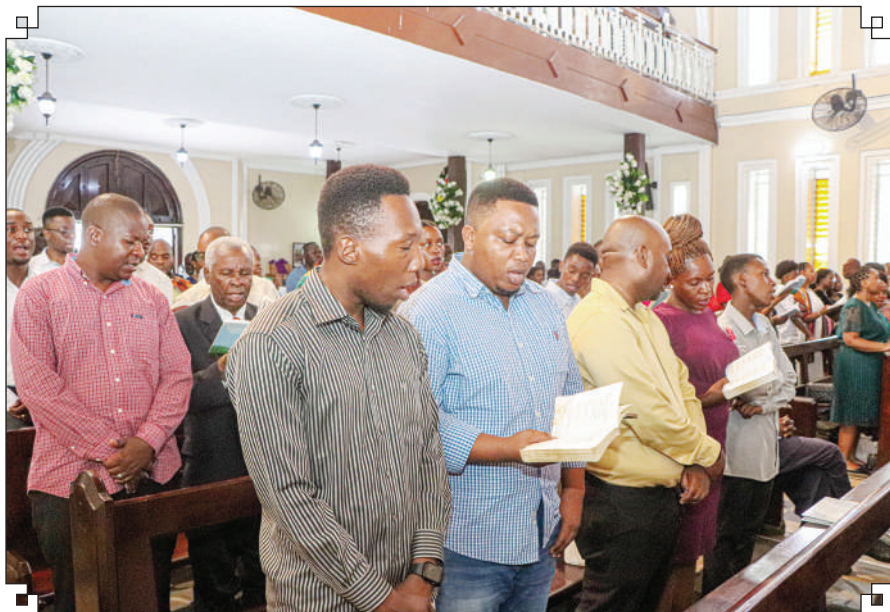
Waumini wa Kanisa la Anglikana Tanzania Dayosisi ya Dar es Salaam wakati wa ibada ya Sikukuu ya Krismasi jijini Da es Salaam jana.