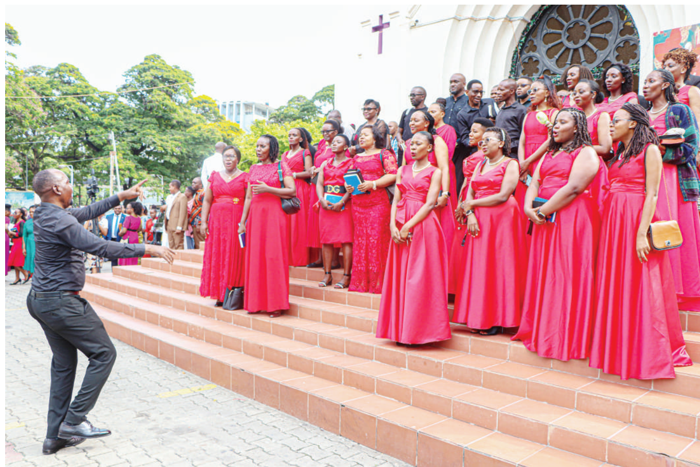
Waimbaji wa Kwaya ya Kanisa la Kiinjili la Kilutheri (KKKT) Azania Front jijini Dar es Salaam wakiimba wakati wa Ibada ya Sikukuu ya Krismasi.

Fainali za mashindano hayo yanayofanyika kila mwaka zitafanyika Januari 13, mwakani na bingwa atajinyakulia kitita cha Sh. milioni 100 huku mshindi wa pili akiondoka na Sh. milioni 70.