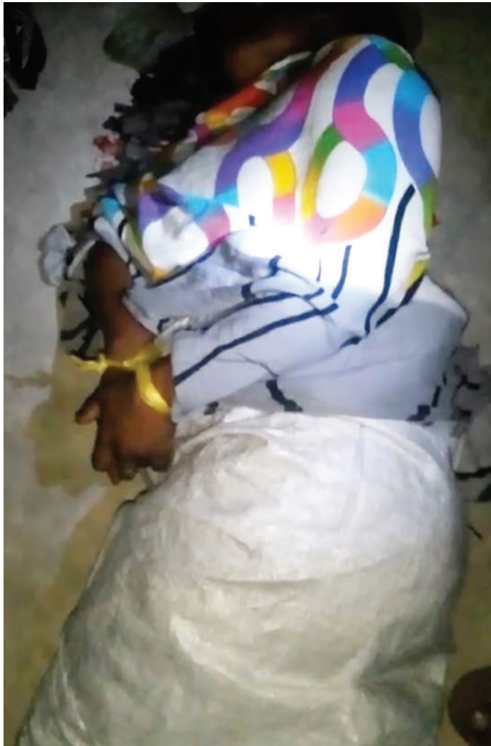
Ukatili uliofanywa dhidi ya mjamzito Juni 5, mwaka huu.

Baadaye mwandishi alizunguma na mume wa mwathirika (jina tunalo). Akathibitisha wanawake wawili kufika nyumbani kwake kwa lengo la kuomba