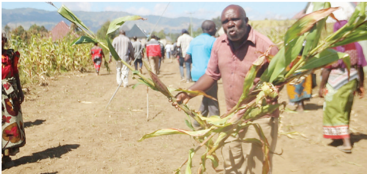
Wakazi wa Mtaa wa Sai- Ituha, Kata ya Ilomba jijini Mbeya jana wakionyesha mazao yao yaliyofyekwa na watu wanaodaiwa kuchukua kandarasi ya kujenga ukuta wa Taasisi ya Utafiti wa Kilimo Tanzania Tari Kituo cha Uyole ili kuzuia wakazi hao kulima mazao katika eneo hilo.