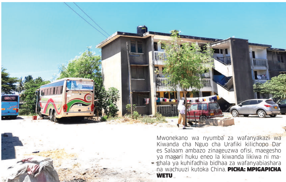
Mwonekano wa nyumba za wafanyakazi wa Kiwanda cha Nguo cha Urafiki kilichopo Dar es Salaam ambazo zinageuzwa ofisi, maegesho ya magari huku eneo la kiwanda likiwa ni maghala ya kuhifadha bidhaa za wafanyabiashara na wachuuzi kutoka China.

Mbuva anasema nchi yote haiwezi kuendelea bila viwanda hasa vya nguo, hivyo anaiomba serikali kuhakikisha vinfanyakazi, ili kutoa ajira kwa wingi kama ilivyokuwa miaka ya zamani kuliko kugeuza eneo hilo kuwa ofisi, gereji na maegesho ya magari.