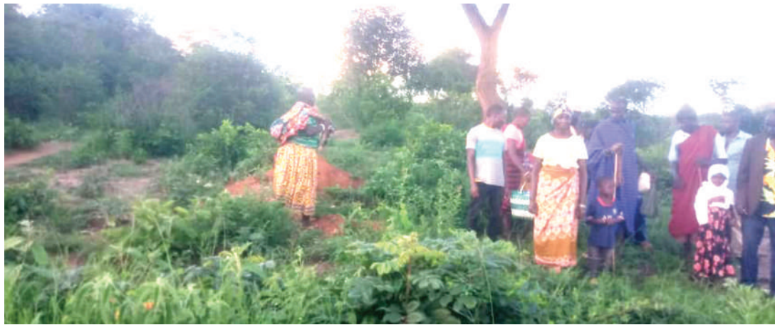
Wakazi wa Kambulwa wakikusanyika kwenye maeneo yao kabla ya mkutano wa kujadili hatima yao.

Wanapofika kwenye ofisi za Nipashe wanasema: "Sisi wananchi wa Kwamgome ni wafugaji na wakulima tunaolima eneo la Kambulwa, lakini maeneo yetu yame-