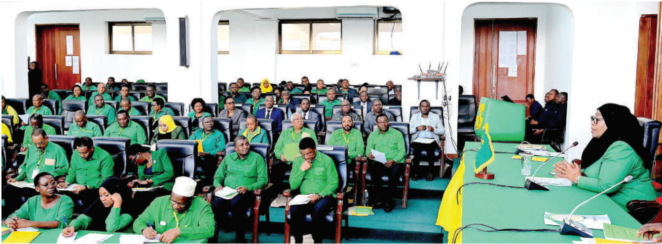
Mwenyekiti wa Chama Cha Mapinduzi (CCM), Rais Samia Suluhu Hassan, akiongoza kikao cha Halmashauri Kuu ya CCM Taifa (NEC) kilichofanyika ukumbi wa Halmashauri Kuu (White House) Dodoma jana.

wa kwa ajili ya barabara za mikoa na madaraja katika mikoa yote 26 ya Tanzania Bara.