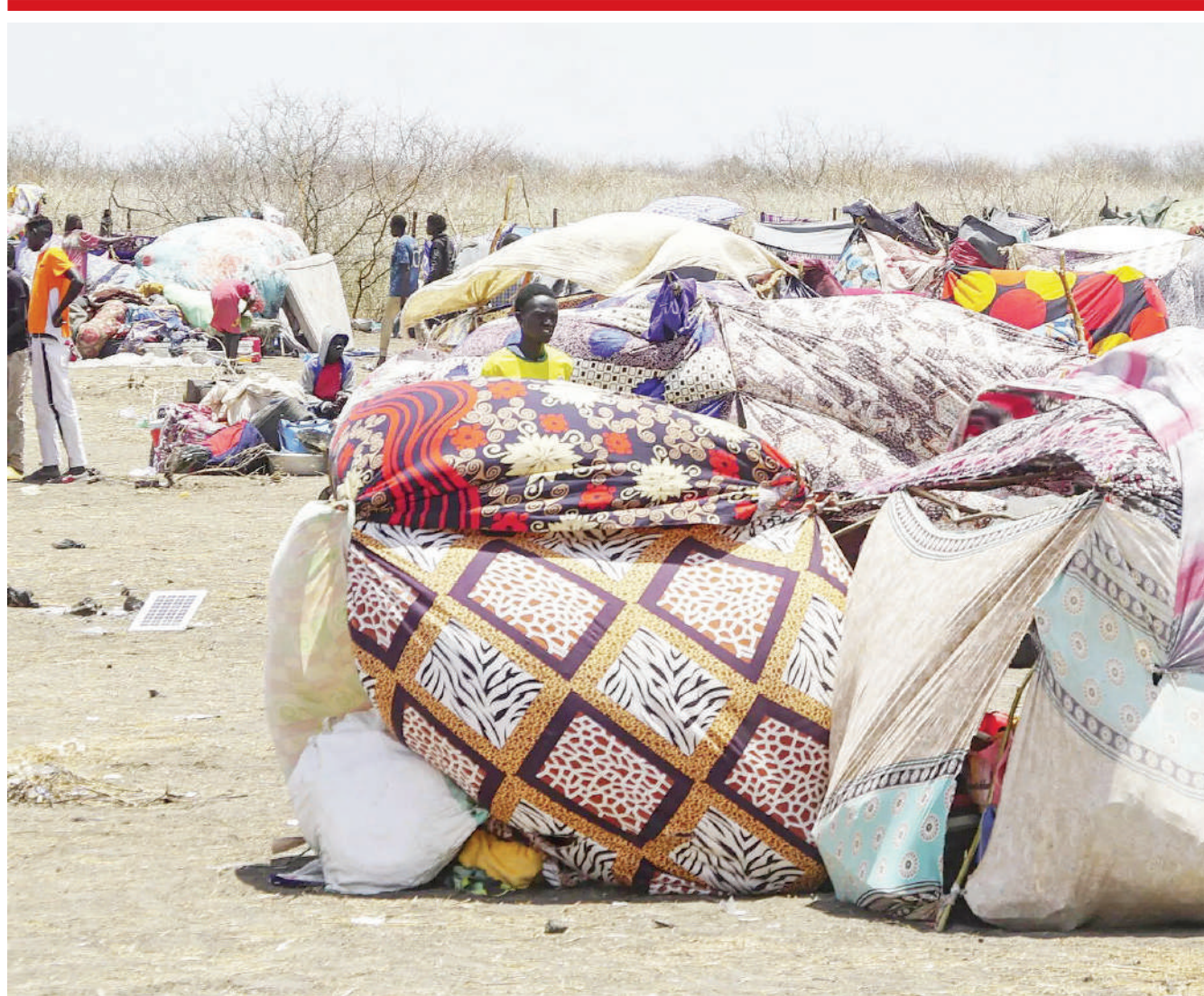
Mahema yaliyotengenezwa kwa kanga na raia wa Sudan huko Chad na Sudan Kusini baada ya kikimbia taifa lao wakihofiwa mapigano yanayoendelea.

Aidha, hayo yanajiri baada ya juma lililopita, Uganda kudai kuwa ujenzi wa reli hiyo utakaogharibu dola za Marekani Bilioni 2.2 utaanza tena mwaka huu, baada ya mazungumzo yake na serikali ya China kuhusu kupewa mkopo kugonga mwamba. RFI