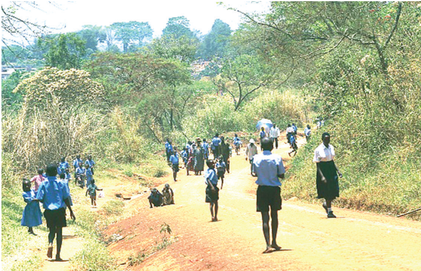
Wanafunzi wakitembea umbali mrefu, kupishana na vyombo vya usafiri kama magari na kuchafuliwa na vumbi.

U NAPOONA watoto wanakataa shule, kuna jambo. Inawezekana wanaichukia kutokana na mazingira mabovu, umbali na njaa. Vyote ni sababu ya kukatisha masomo na kuichukia elimu.