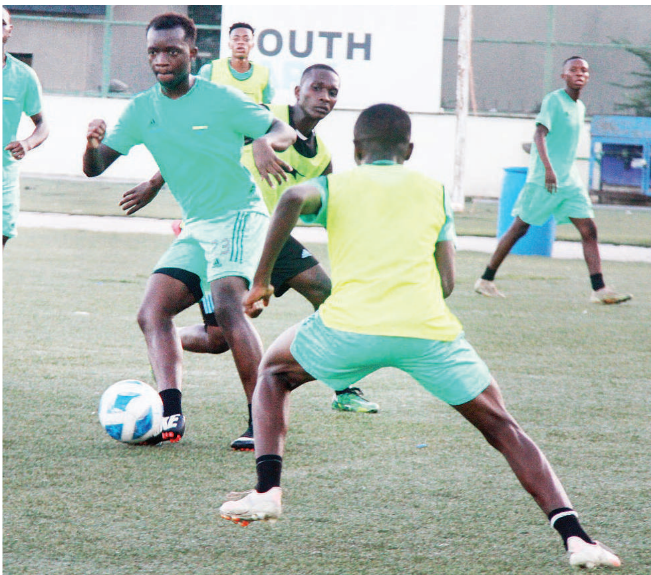
Wachezaji wa timu ya vijana wanaolelewa na Kituo cha Michezo cha Jakaya Kikwete jijini Dar es Salaam wakifanya mazoezi jana.

Azam FC, baada ya kuifunga Ruvu Shooting mabao 4-1, iko kwenye nafasi ya pili ya msimamo nayo ikiwa imecheza mechi nne na kushinda zote, lakini ikiwa na mabao 13 na kufungwa moja.