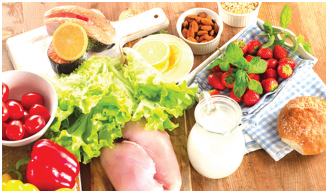
Sehemu ya mahitaji yaliyoandaliwa kwa mlo kamili.

Ulaji bora kwa makundi: Anasema ulaji bora unatakiwa kuzingatia mahitaji ya mwili kutiana na jinsi, umri, mzunguko wa maisha, kazi/shughuli na hali ya afya.