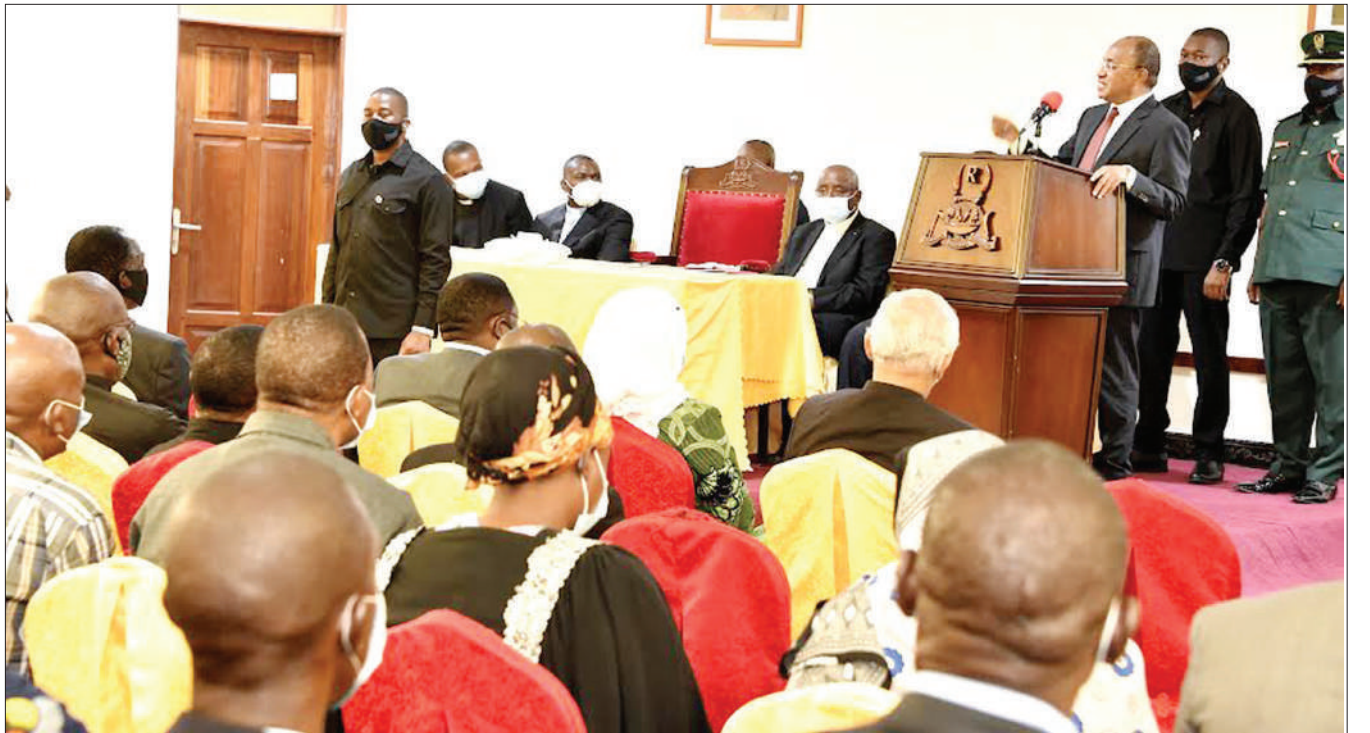
Rais wa Zanzibar na Mwenyekiti wa Baraza la Mapinduzi, Dk. Hussein Ali Mwinyi, akizungumza na Viongozi wa Madhehebu ya Dini ya Kikristo, mjini Zanzibar jana.

Aliwataka wananchi ikiwamo wakazi wa mji huo kuendelea kuchukua juhudi za kuulinda ikiwamo hifadhi yake ya urithi wa mambo ya kale.