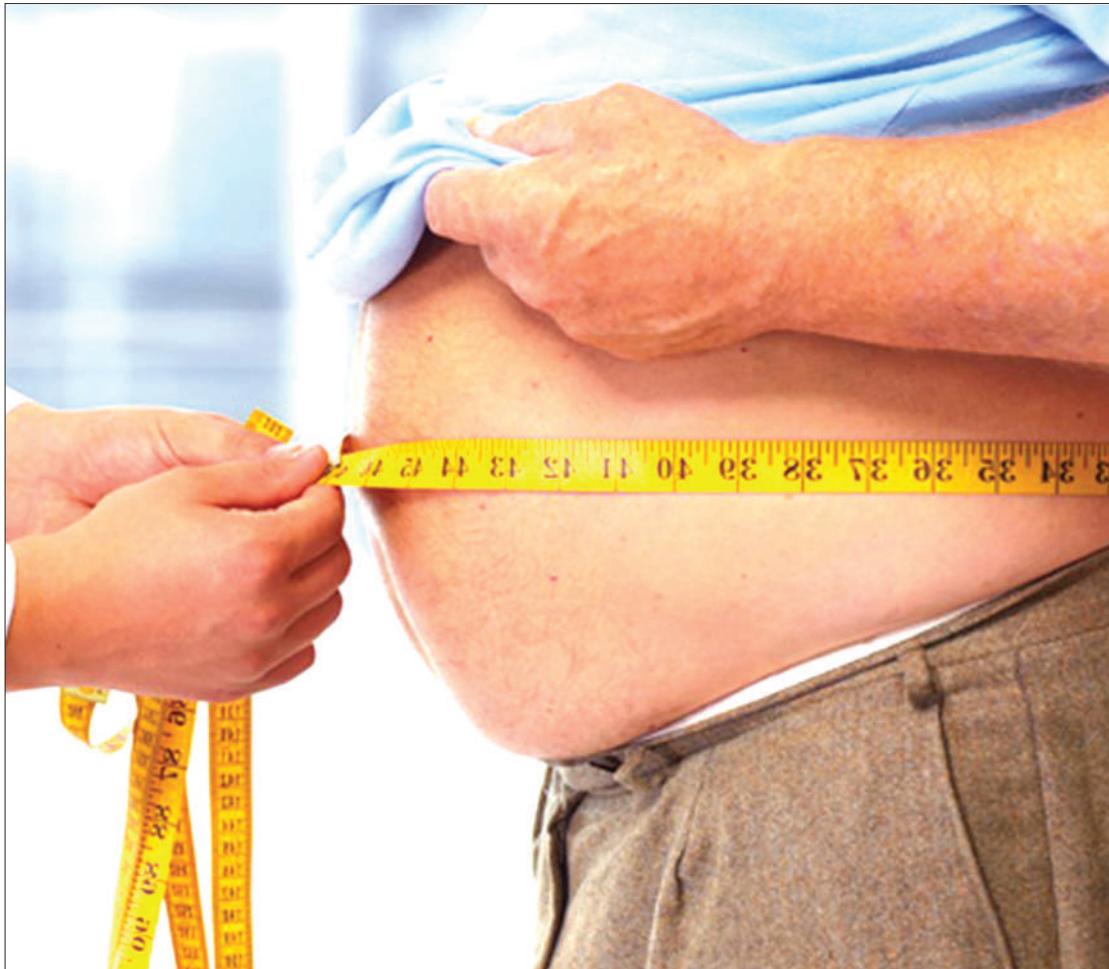
Mtu mwenye kitambi akipatiwa huduma ya kitabibu.

Utafiti wa miaka 1986/1987 ulionyesha kuwa mtu mmoja kwa kila 100 alikuwa na kisukari na watu watao kwa kila 100 walikuwa na shini-kizo la damu.