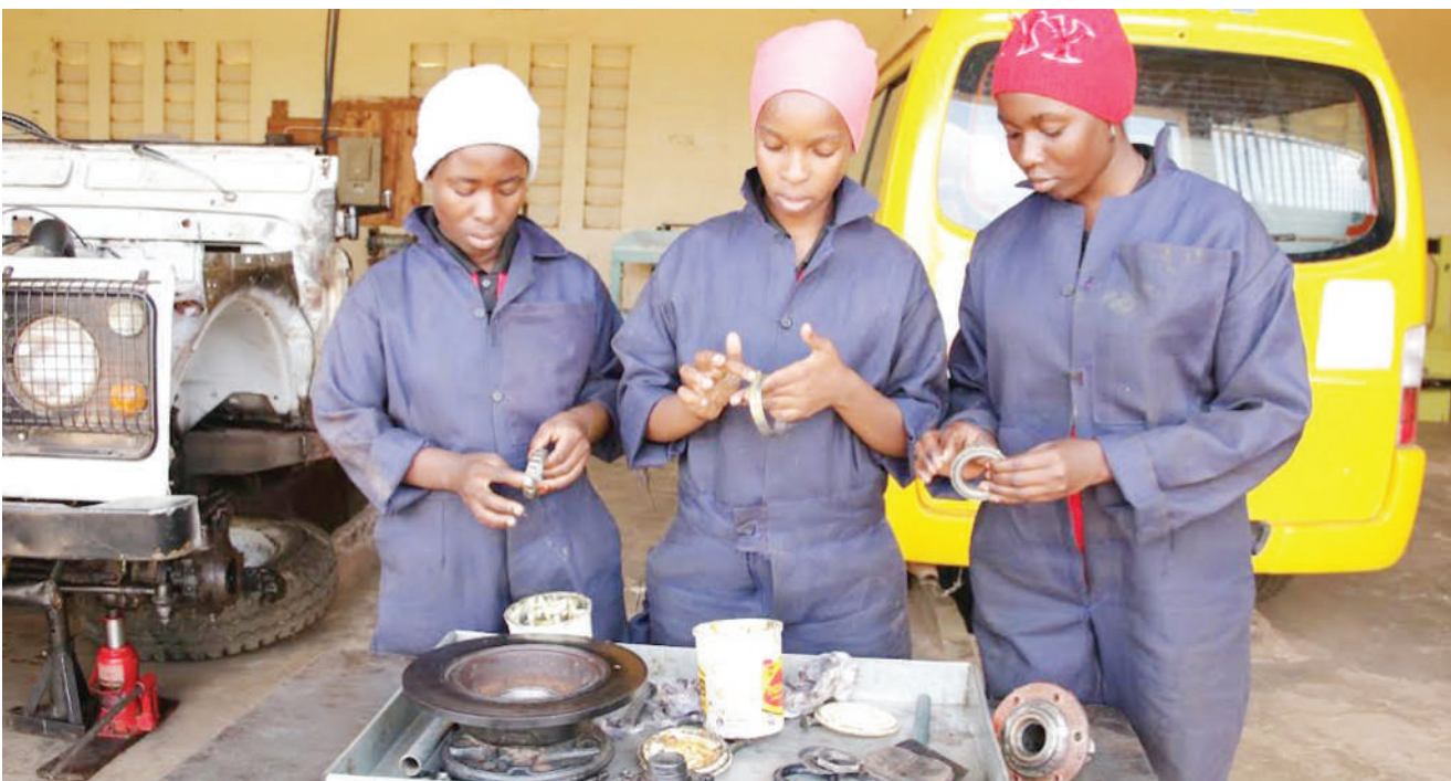
Mabinti balehe na kinamama vijana wenye umri kati ya miaka 17 hadi 24, wilayani Kahama, mkoani Shinyanga, wanaosoma fani ya ufundi magari wakijifunza kwa vitendo katika Chuo cha Ufundi stadi Mwaka, katika Halmashauri ya Msalala juzi, kwa ufadhili wa Shirika la FHI360 chini ya USAID na PEPFAR. Habari Uk. 7.

“Operesheni zetu ni endelevu kama kuna watu wako maeneo yale wakitarajia kutenda uhalifu hakika tutawamaliza wote,” alisema.