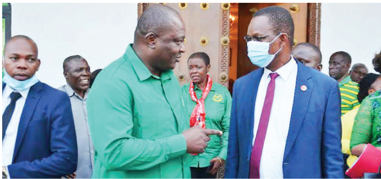
Katibu Mkuu wa Chama Cha Mapinduzi (CCM), Daniel Chongolo (kushoto), akizungumza na Katibu Mkuu wa Chama cha Frelimo cha nchini Msumbiji, Roque Silva Samwel, baada ya mazunguzo yao katika ofisi ndogo za makao makuu ya CCM Lumumba, jijini Dar es Salaam juzi.