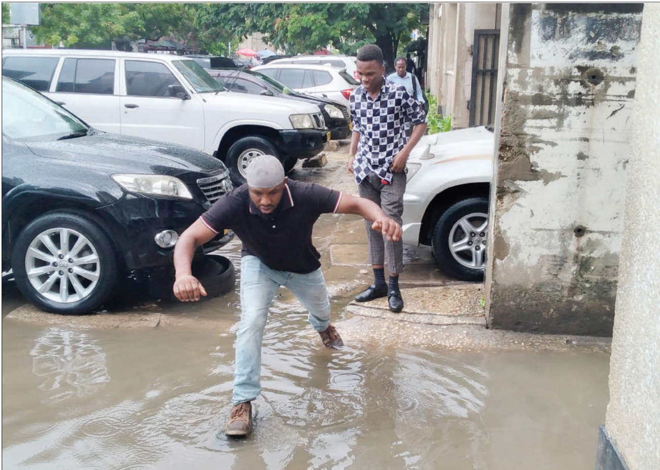
Mkazi wa Dar es Salaam akiruka maji yaliyojaa kwenye barabara ya Mtaa wa Pamba, eneo la Posta, kutokana na mvua iliyoonyesha jana.

Mvua zenyewe za msimu tunazitarajia kuanza kati ya wiki ya kwanza mpaka ya tatu ya Oktoba kama ambavyo tulivyotoa utabiri. Hizi za sasa wananchi wasiwe na shaka ni za kawaida ambazo zipo nje ya msimu," alisema Senyagwa.