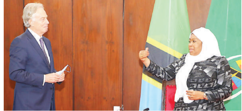
Rais Samia Suluhu, akizungumza na Waziri Mkuu Mstaafu wa Uingereza, Tony Blair Ikulu Chamwino Jijini Dodoma.