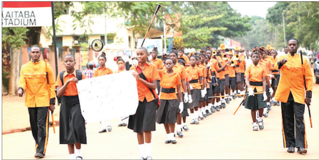
Wanafunzi wa mkoani Kagera wakiingia katika Uwanja wa Kaitaba mjini Bukoba, katika moja ya maadhimisho ya Siku ya Mtoto wa Afrika, iliyotumika kupinga mimba za utotoni.

Anasema pamoja na wao kanisa kutounga mkono mimba za mabinti shuleni, lakini wana hoja mtoto akishakosea pia sio vema kumtelekeza, bali kumtafutia nam-