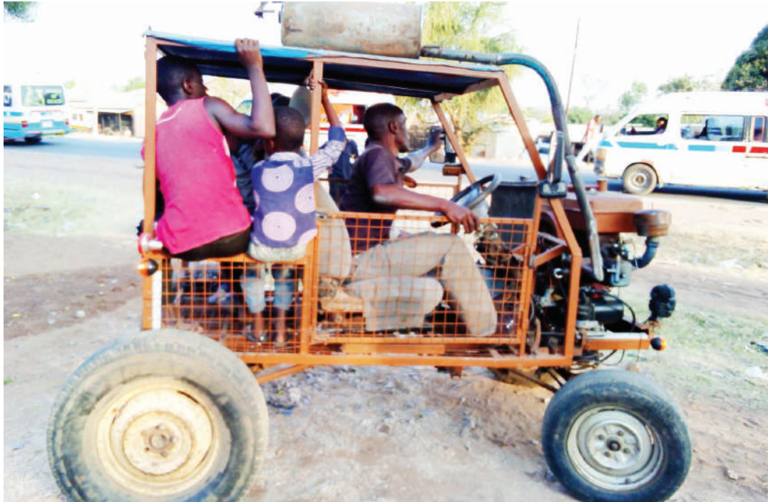
Trekta la Misango likiwa kazini kwa kubeba abiria.