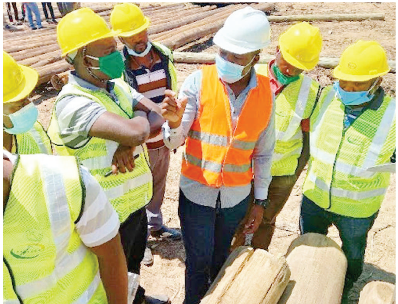
Timu ya wahandisi wa Shirika la Umeme Tanzania (TANESCO) wakipata mafunzo kutoka kwa Kampuni ya New Forests, kampuni endelevu ya mbao, inayofanya kazi katika kiwanda cha kutibu miti mkoani Iringa. Lengo la mafunzo hayo ni kuwapa ujuzi, kuhakikisha ubora wa kusimamia na kufuatilia utekelezaji wa mradi wa 2 wa umeme vijijini (REA) III awamu ya pili.

Alisema kuwa kanuni zinataka umbali wa kituo kimoja cha mafuta hadi kingine usipungue mita 200, ili kuepusha athari kubwa zinazoweza kutokea wakati dharau ya moto, lakini kutokana na dharau ya wenye vituo hawazingatii kanuni hiyo.