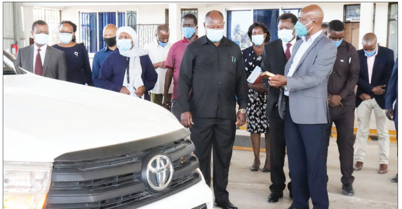
Naibu Waziri wa Ujenzi na Uchukuzi, Mwita Waitara (katikati), akijionea ufanyaji kazi wa kituo cha ukaguzi wa magari kilichoko chini ya Chuo cha Taifa cha Usafirishaji (NIT) jijini Dar es Salaam mwishoni mwa wiki.

Hadi kufikia mwishoni mwa mwezi Agosti zaidi ya watu 300,000 wameshapata chanzo nchini.