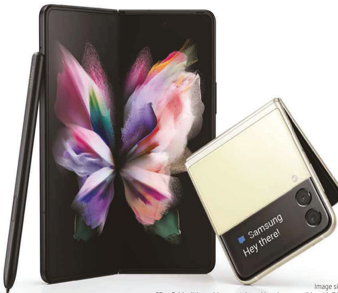
Image simulated. SPen Fold edition sold separately and is only compatible with Z Fold3 5G.