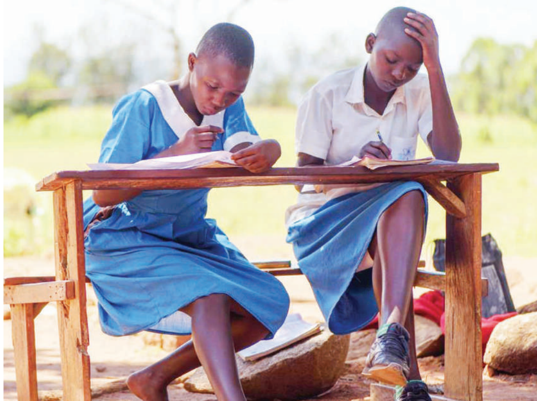
Wanafunzi wakisoma katika mazingira magumu.

Anakumbusha: “Kuna wakati walililalamikia kuwa wanahitaji fedha ya kununua vitu shuleni, lakini sikuwa na majibu mbali na uchungu.”