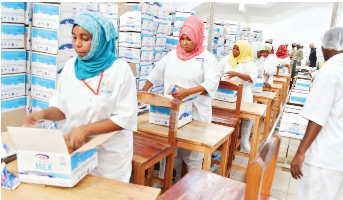
Wafanyakazi wafunzwe ujasiriamali wakiwa na nguvu si wakati wanapokaribia kustaafu.

M FANYAKAZI anapojiririwa katika utumishi wa umma au sekta binafsi upo wakati atastaafu na kuachana na ajira kwa mujibu wa sheria au kwa hiari.