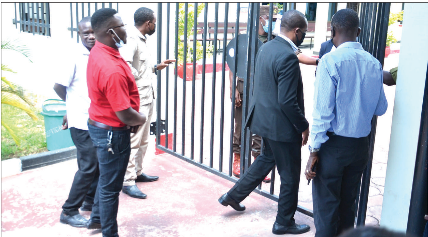
Kiongozi wa Chama cha ACT-Wazalendo, Zitto Zuberi Kabwe (katikati), akiwa amezuiwa kuingia katika Mahakama ya Mafisadi iliyopo Mawasiliano Sinza jijini Dar es Salaam jana, kusikiliza kesi ya Mwenyekiti wa CHADEMA, Freeman Mbowe.