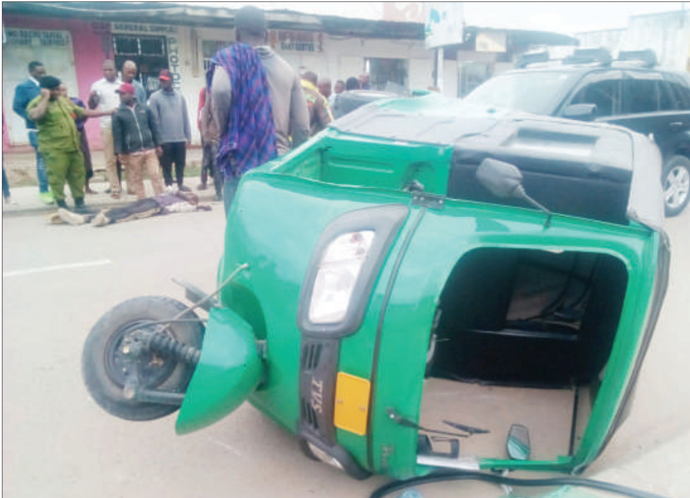
Wakazi wa Jiji la Dodoma, wakimwanganalia mtu aliyelala chini (kushoto), baada ya kugongwa na Bajaji, katika Barabara ya Sido, eneo la Uhindini, jijini humo jana.

Hata hivyo, aliwasisitiza wakazi wa jijini Dodoma kuendelea kutoa ushirikiano wa utoaji taarifa pale wanapoona kuna viashirika vya rushwa ili zifanyiwe kazi kwa ufasaha.