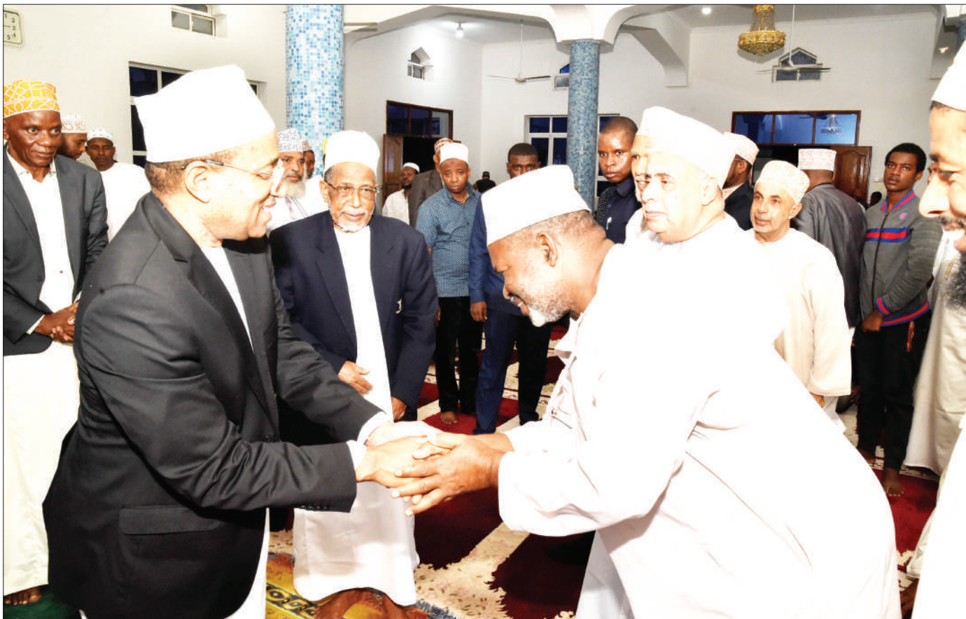
Rais wa Zanzibar na Mwenyekiti wa Baraza la Mapinduzi, Dk. Hussein Ali Mwinyi, akisalimiana na waumini wa dini ya kiislam, baada ya kumalizika kwa Sala ya Tarawekh, katika Masjid Ibadhi, wilayani Wete Pemba juzi.