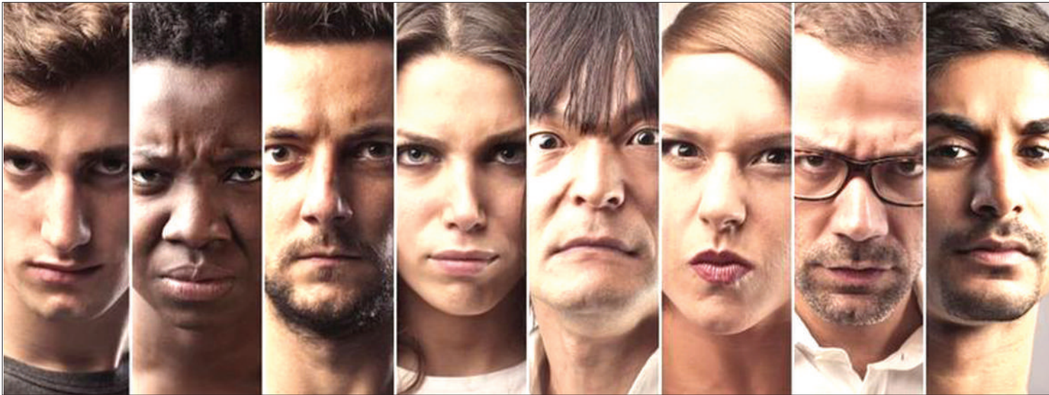
Picha zinazoonyesha watu wakiwa katika hisia tofauti.