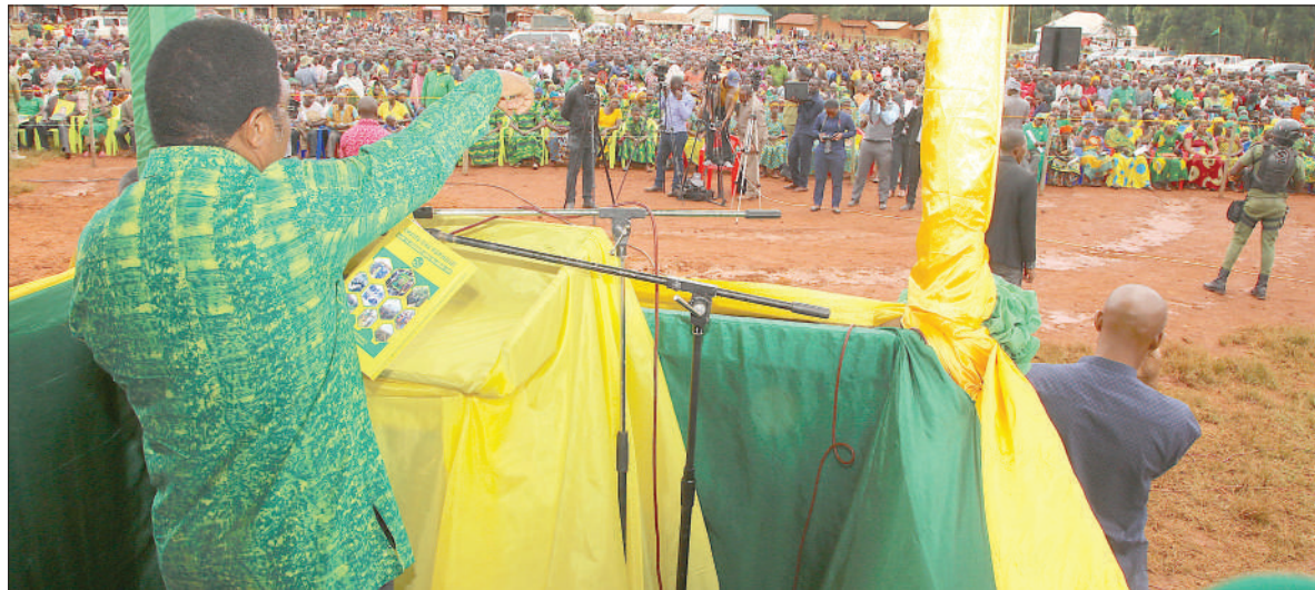
Mjumbe wa Kamati Kuu ya Halmashauri Kuu ya Taifa ya CCM na Waziri Mkuu, Kassim Majaliwa, akizungumza wakati akizindua kampeni za CCM za uchaguzi mdogo wa Jimbo la Buhigwe, katika Uwanja wa Shule ya Msingi Buhigwe, mkoani Kigoma, jana.

Aidha, Rais Samia alitoa wito kwa umoja huo kuushawishi Umoja wa Ulaya (EU) kuondoa vikwazo vya kiuchumi dhidi ya Burundi.