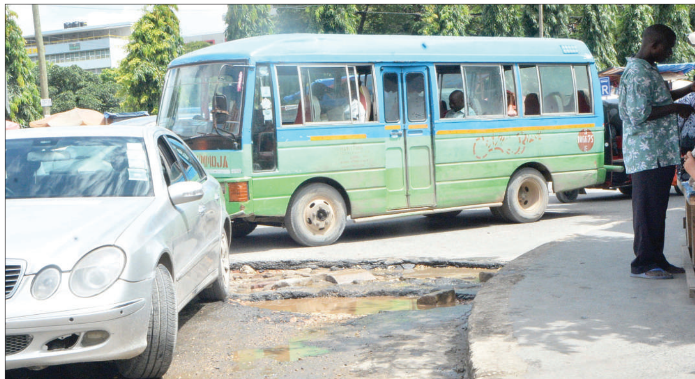
Magari yakipita kwa tahadhari kutokana na ubovu wa barabara katika makutano ya Mtaa wa Uhuru na Bibi Titi Mohamed, eneo la Mnazi Mmoja, jijini Dar es Salaam jana.

Iliendelea kudaiwa mahakamani hapo kuwa mshtakiwa alitenda makosa mawili, la kwanza ni kubaka chini ya kifungu cha 130 cha Sheria ya Mwenendo wa Makosa ya Jinai ya Mwaka 2002 na la pili ni kumpa mwanafunzi ujauzito, chini ya kifungu cha 60 (a) cha Sheria za Elimu.