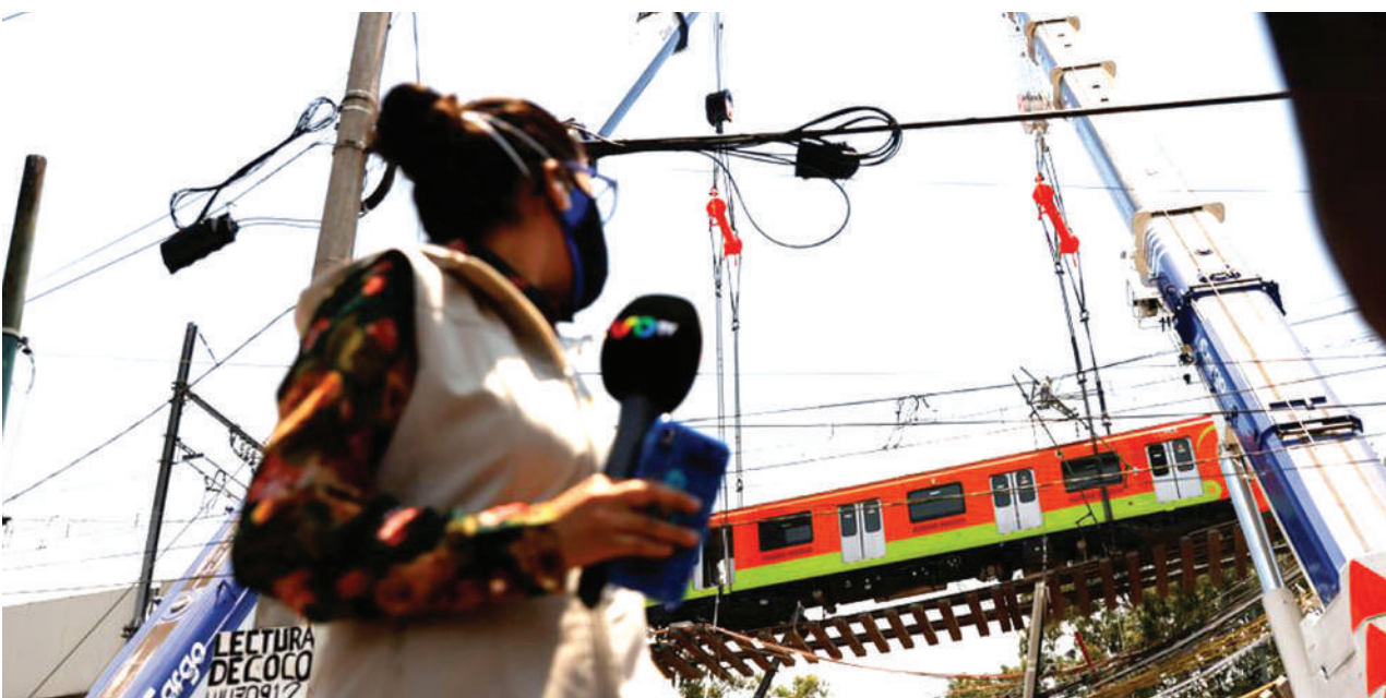
Mwanahabari akishuhudia namna wafanyakazi wa treni iliyopata ajali na kusababisha vifo zaidi ya 20 na majeruhi 50 juzi, wakiendelea kuliondoa jana, baada ya daraja kukatika kwenye kituo cha Olivos, jijini Mexico.