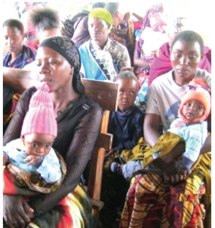
Baadhii ya kinamama waliopelika watoto katika kliniki ya Mrara kupatiwa chanjo, kwenye uzinduzi wa Wiki ya Chanjo uliofanyika Aprili mwaka 2017, katika Hospitali ya Mrara.

Shirika la Afya Duniani (WHO), linakadiria kati ya watoto 10 duniani, mmoja alikosa chanjo ya kuokoa maisha dhidi ya magonjwa kama surua, dondakoo na pepopunda.